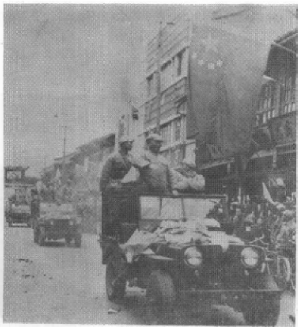
图二。一九五〇年二月二十日，陈赓、宋任穷两将军率人民解放军第四兵团进驻昆明。前面车上是陈赓将军，第二辆车上是宋任穷将军。