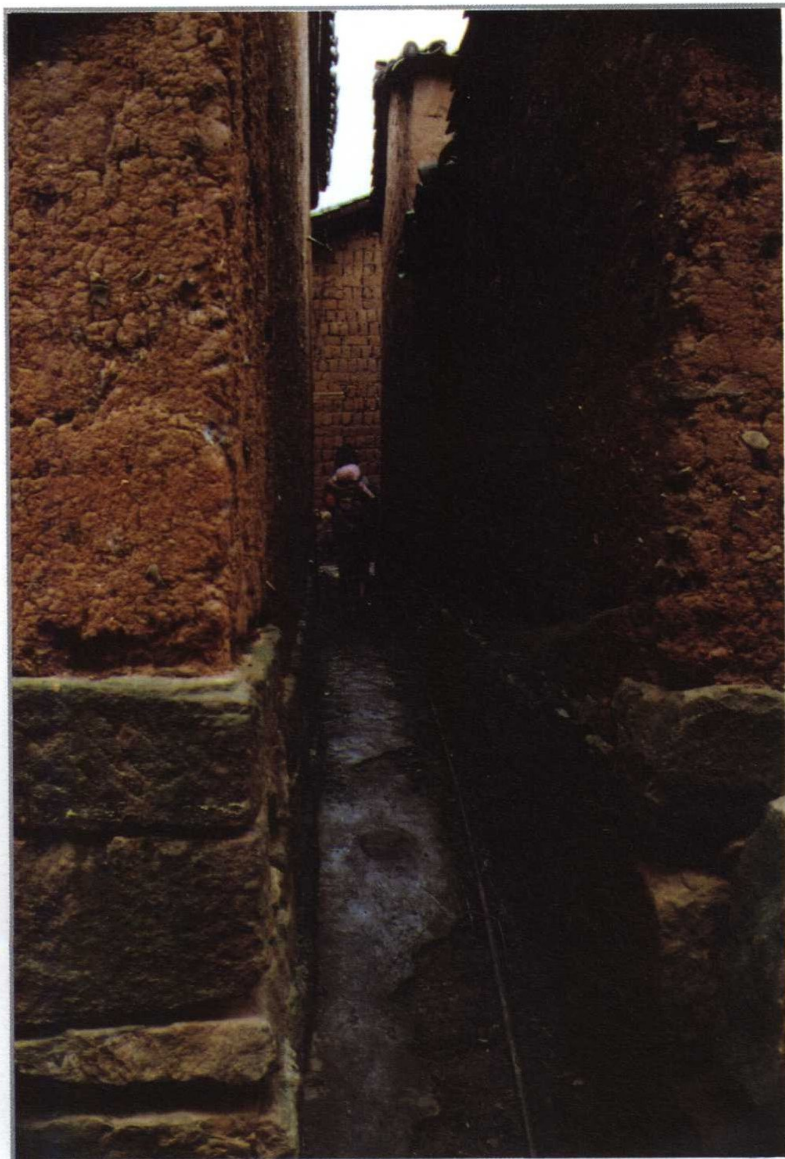
15 背着孩子忙碌穿行在小巷泥墙间的蒙古族女人