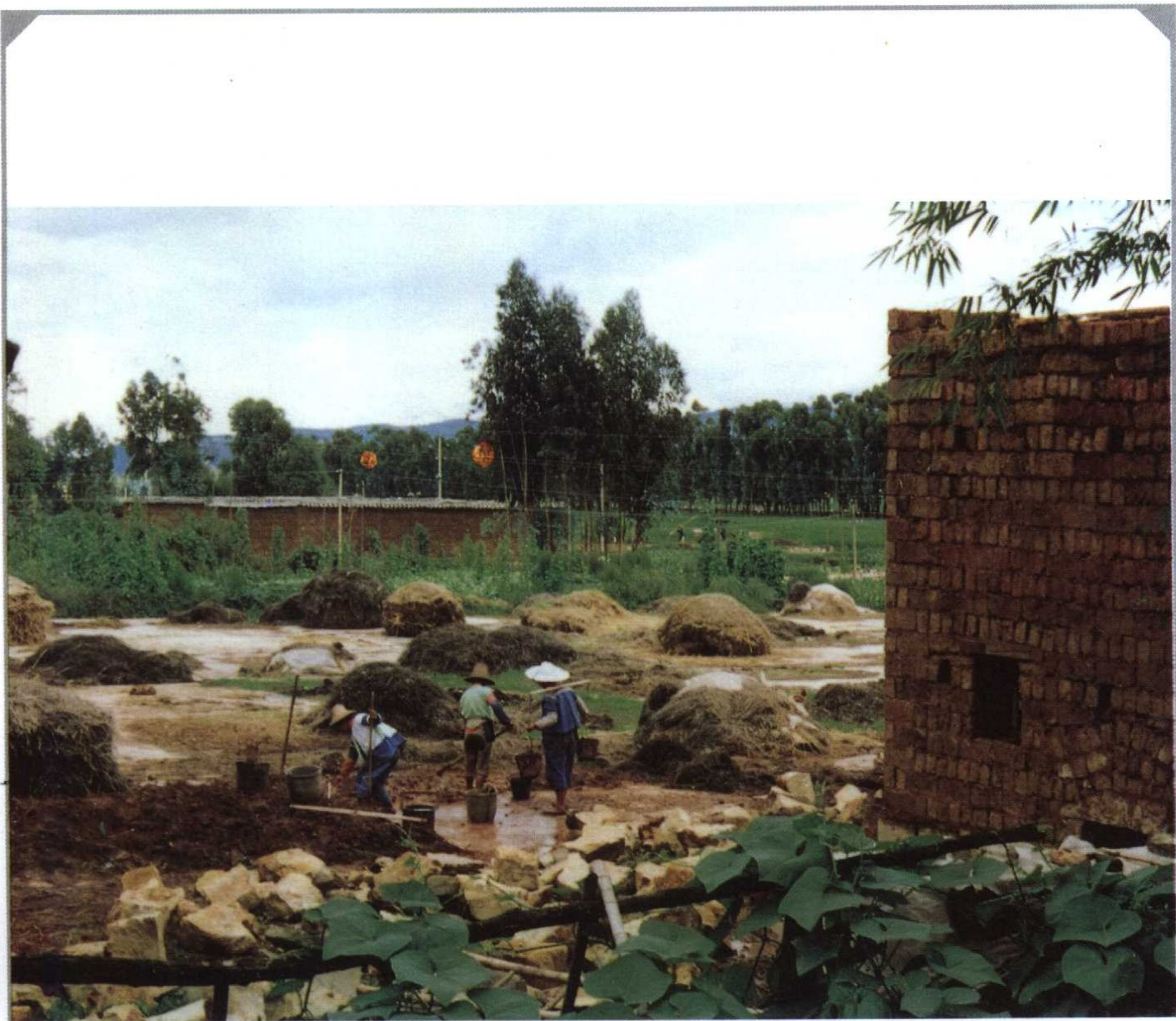
10 住毡房的蒙古族，如今成了这一带土木建筑的能手 (女人与扁担之二)