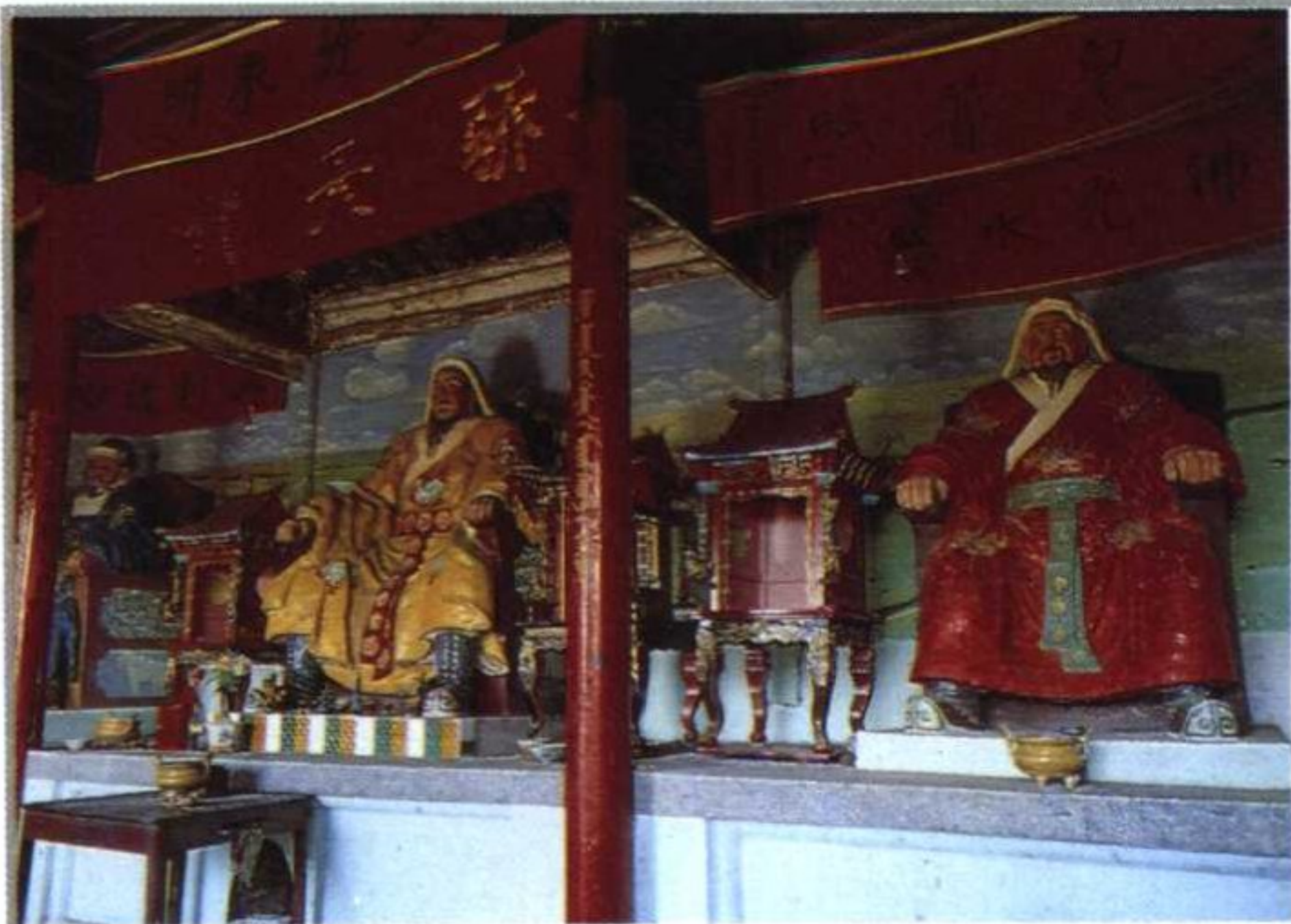
5 三圣宫里供奉的成吉思汗、蒙哥和忽必烈像