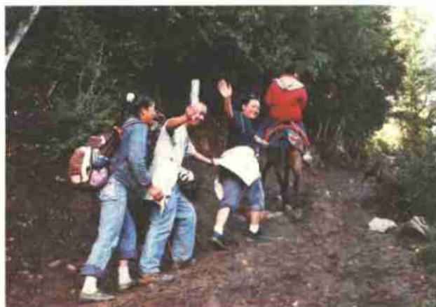
我们走向美丽的远方