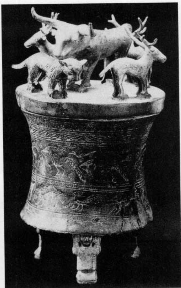
图 2 《虎牛鹿贮贝器》 江川李家山出土的战国时 期的这批文物，说明云南 最早的雕塑作品具有多样 性、艺术性和实用性。

马、羊、猪等 40 余种动物。造型有单独的动物圆塑，有动物组合的群雕，还有人和动物组合的各种动态雕塑。这些作品形象典型生动，具有很高的艺术和历史价值。这反映出云南古代先民们在“雕塑”这个概念未形成之前，就对雕塑工艺品有先见的追求和创造。当然，古代云南产生了辉煌灿烂的青铜文化乃至雕塑艺术，是因为云南具备了创造青铜雕塑艺术的物质条件，当时就有铜、锡、铅的生产。云南作为金属王国之地，使其在战国、西汉时期的雕塑作品就以青铜来铸造。而同时代的秦朝国都西安，兵马俑只能用土陶制作。因战国、西汉时的青铜产量不大，云南滇国的雕塑作品尺寸稍小。 ③