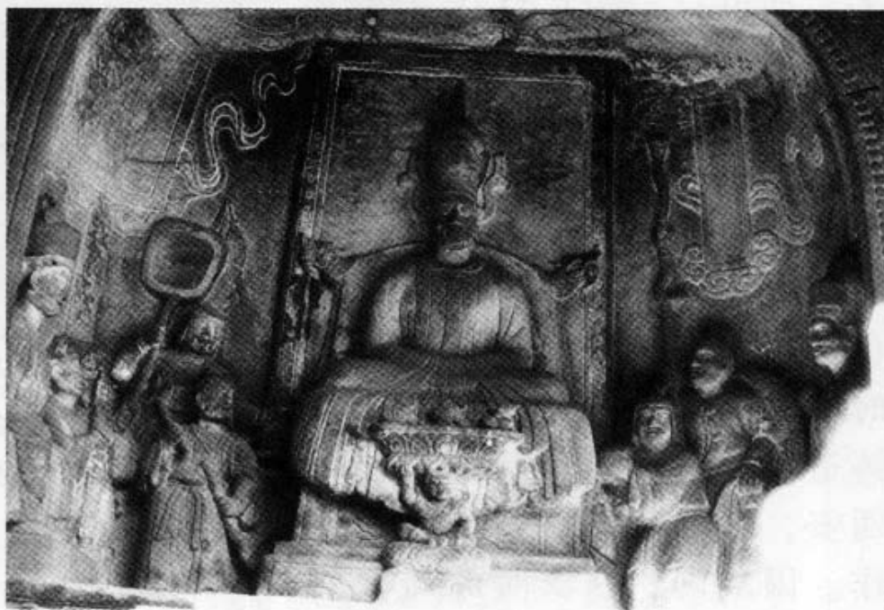
图 3 《异牟寻坐朝图》 唐南诏国时期的剑川石钟山石窟造像，是云南雕塑艺术形成的标志，具有重要的艺术价值和历史价值。上图为第一窟。

唐宋时期云南最有代表性的雕塑是剑川县沙溪石钟山石刻人像。石钟山属老君山脉，离剑川县城 25 公里，这里山峦起伏，群山翠微，怪石嶙峋。石钟山的雕刻分 3 个片区，