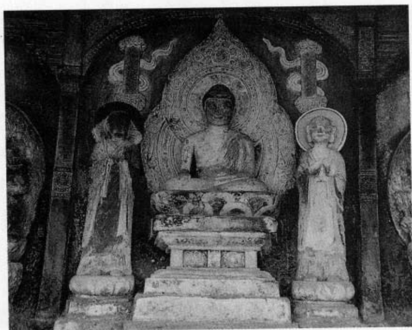
图4 《唐明王》 剑川石钟山石窟6号窟造像，高3米，宽11米，规模较大。