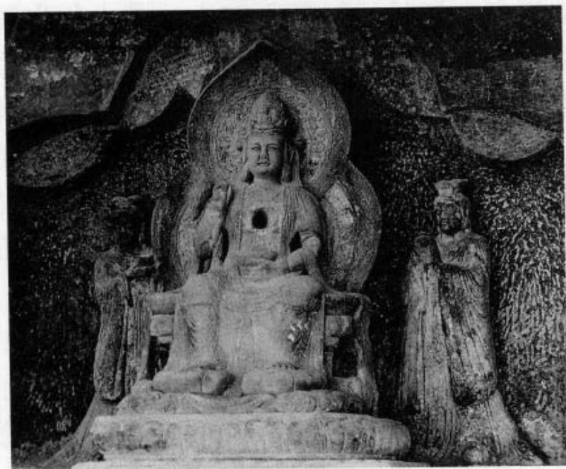
图5 《甘露观音》 剑川石钟山石窟7号窟，高2.7米，宽11米。当地老百姓称她为“剖腹观音”，她甘于把自己的心挖出来。