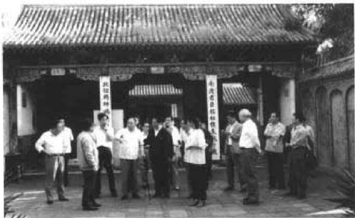
1991年9月原中共中央副主席李德生参观岳飞庙