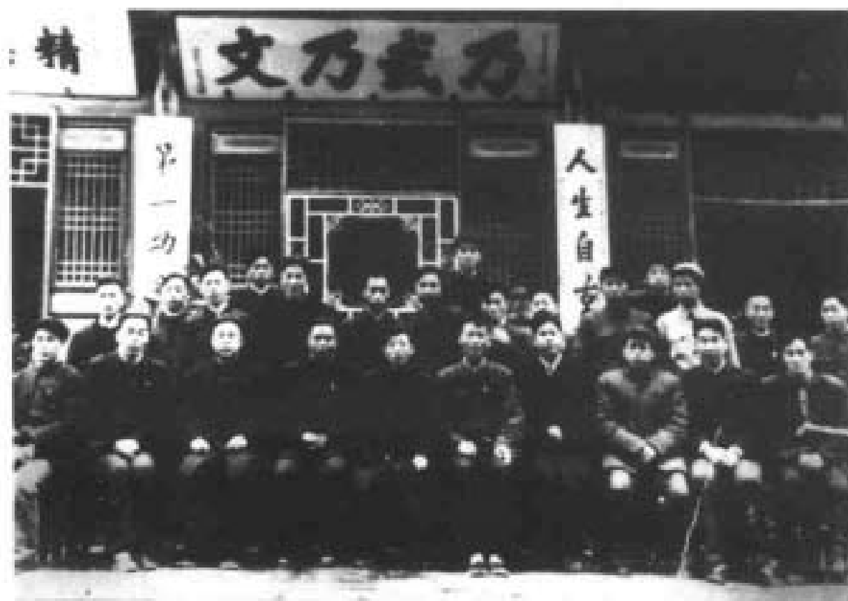
1959年11月7日共青团中央书记（后任中共中央总书记）胡耀邦参观岳飞庙留念