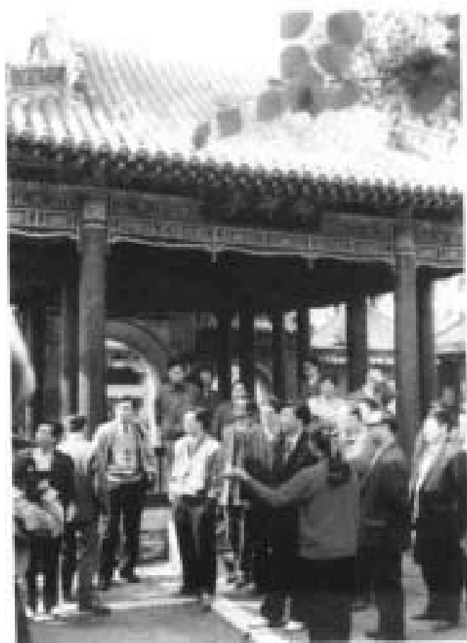
1994年7月中共中央宣传部副部长（现任中宣部部长）刘云山视察岳飞庙