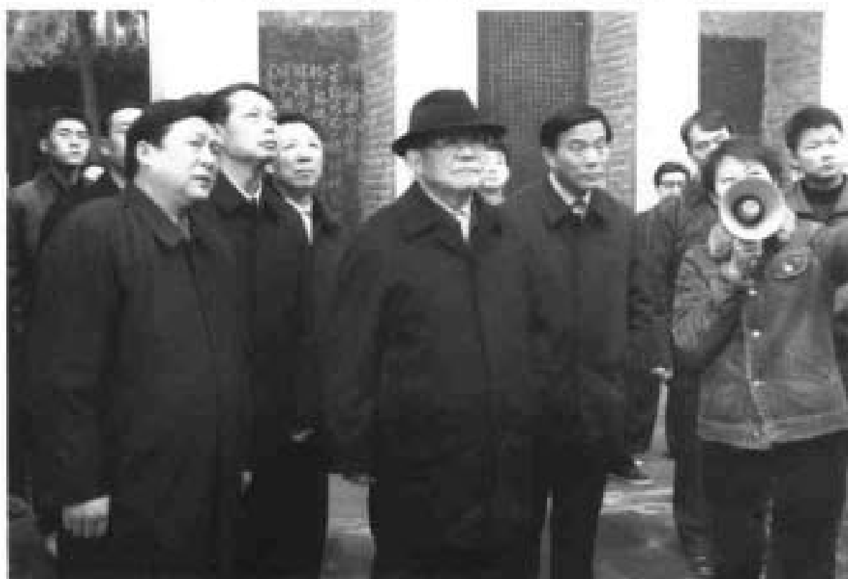
2004年12月原国务委员兼国防部部长，军委副主席迟浩田参观岳飞庙