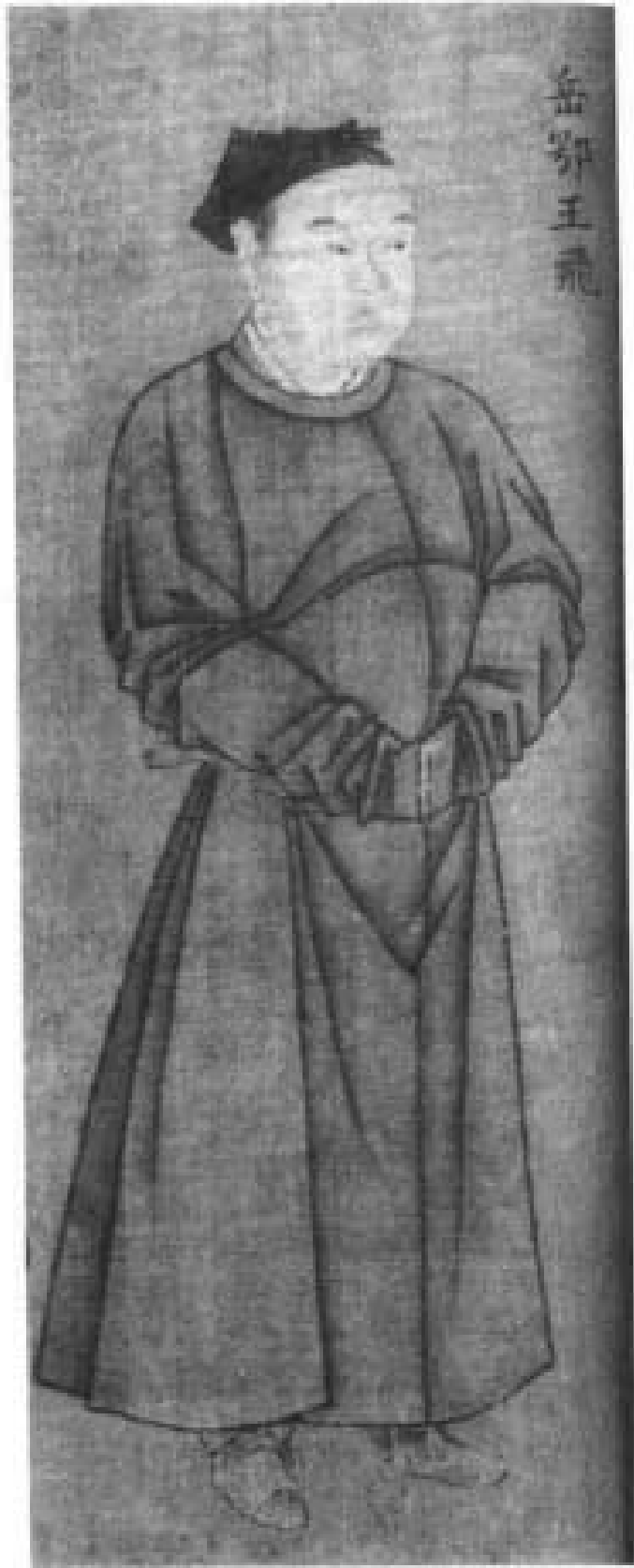
宋·岳鄂王飞像 宋·刘松年画