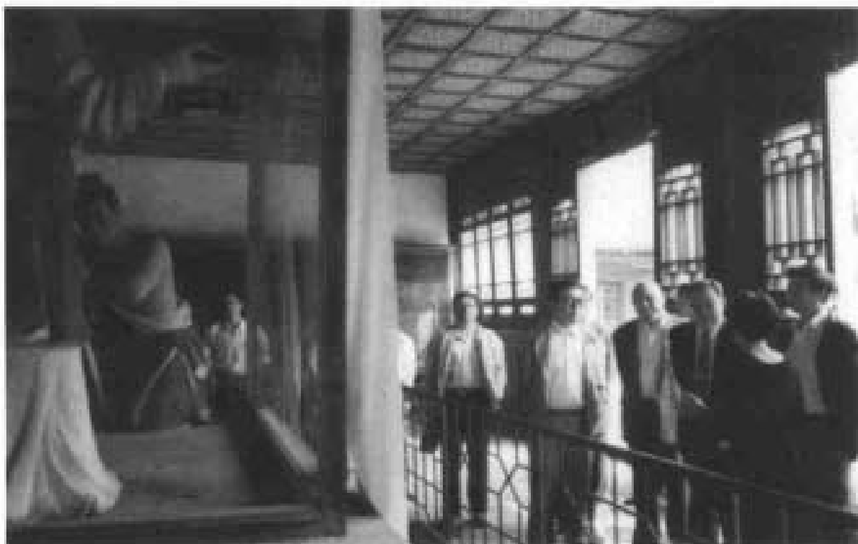
1995年9月中共中央组织部部长张全景参观岳飞庙