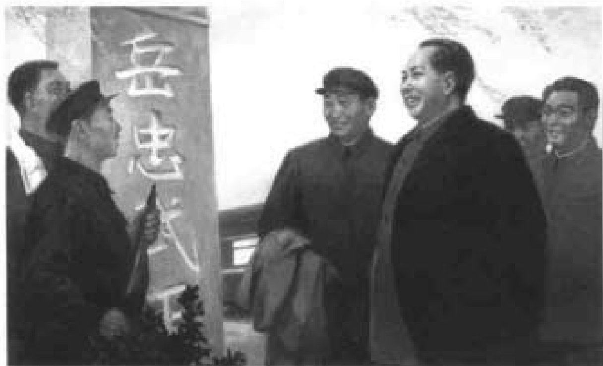
1952年11月1日中共中央主席毛泽东途经汤阴火车站视察岳忠武王故里碑（国画）