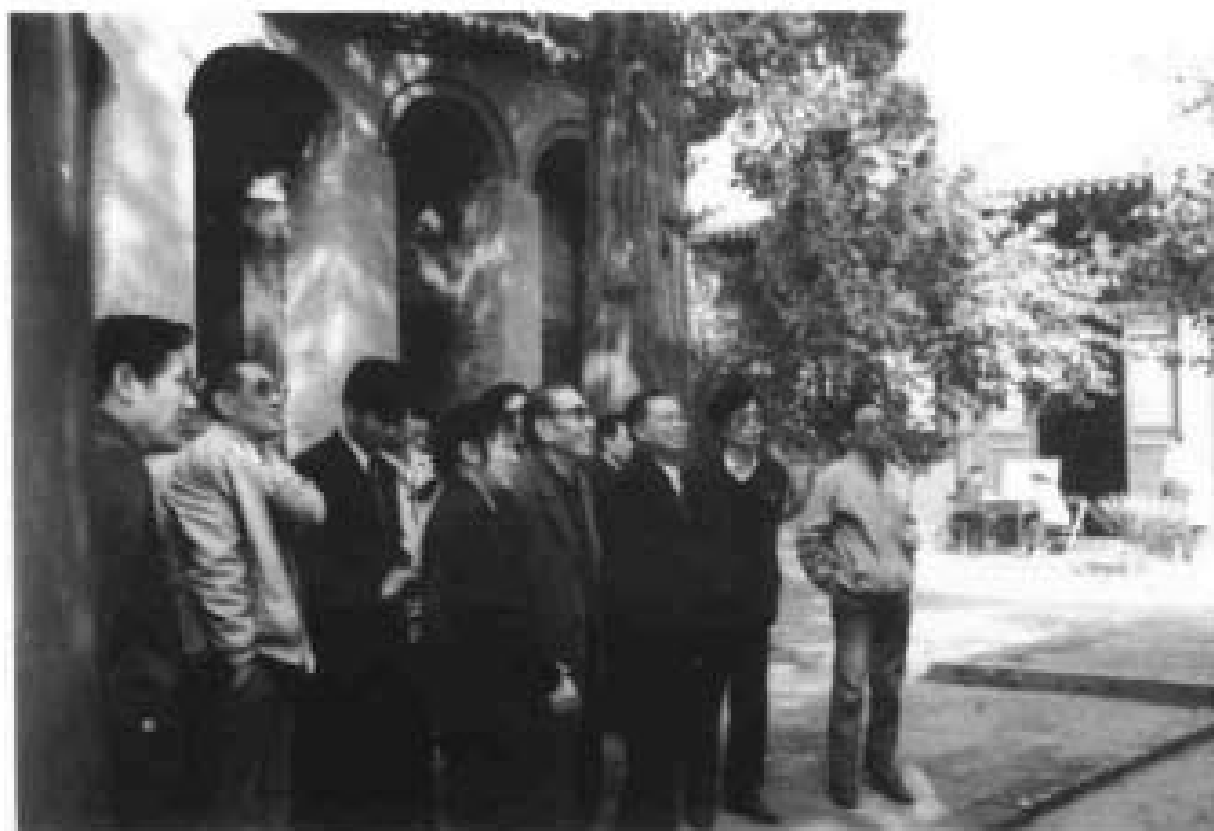
1990年11月原国务院副总理康世恩参观岳飞庙