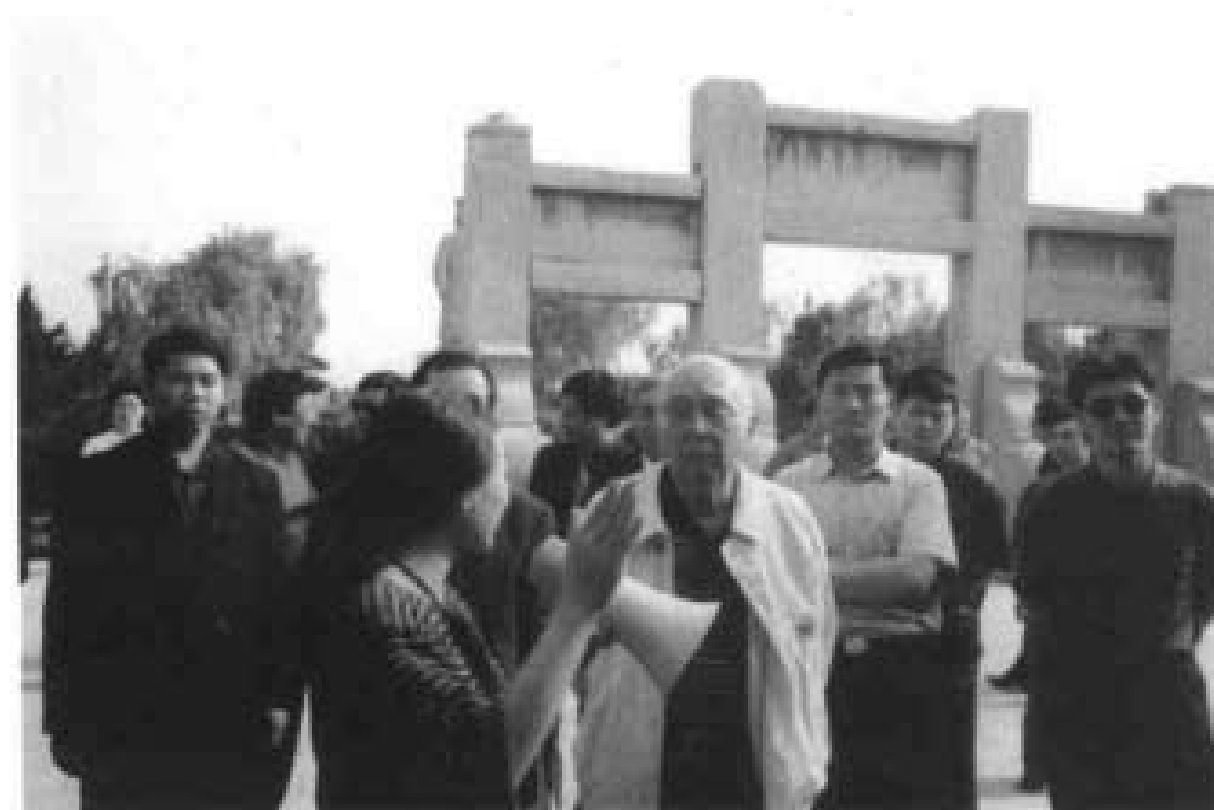
2004年5月原全国人大副委员长王光英视察茱萸里城