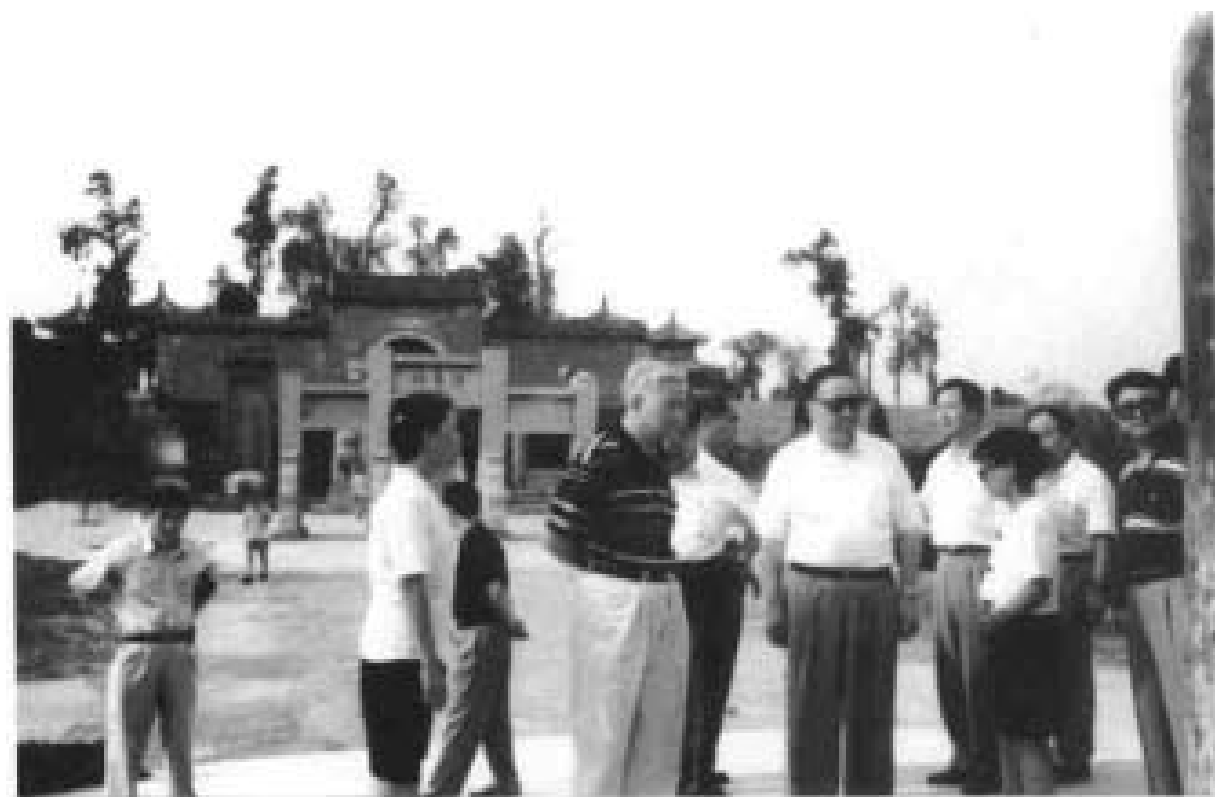
1996年8月全国政协副主席叶选平视察爨里城