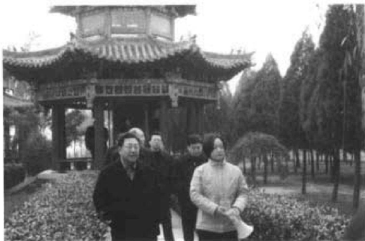
2002年11月中共河南省委书记（现任全国政协副主席）陈奎元视察茱萸里城