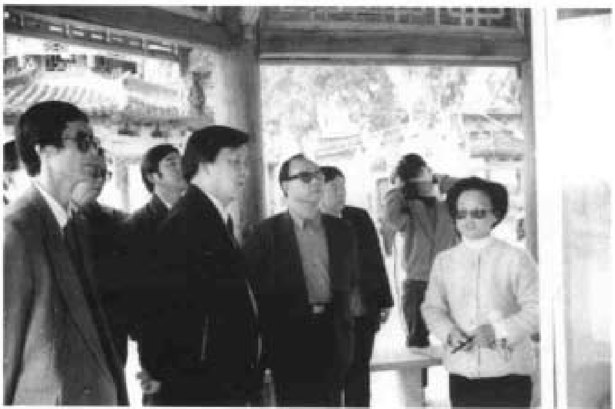
1994年7月中共中央宣传部副部长（现任中宣部部长）刘云山视察茭里城