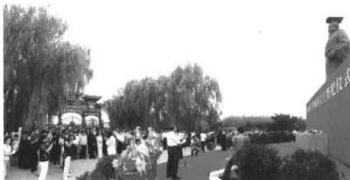
2006年9月莒里城祭祀周文王活动