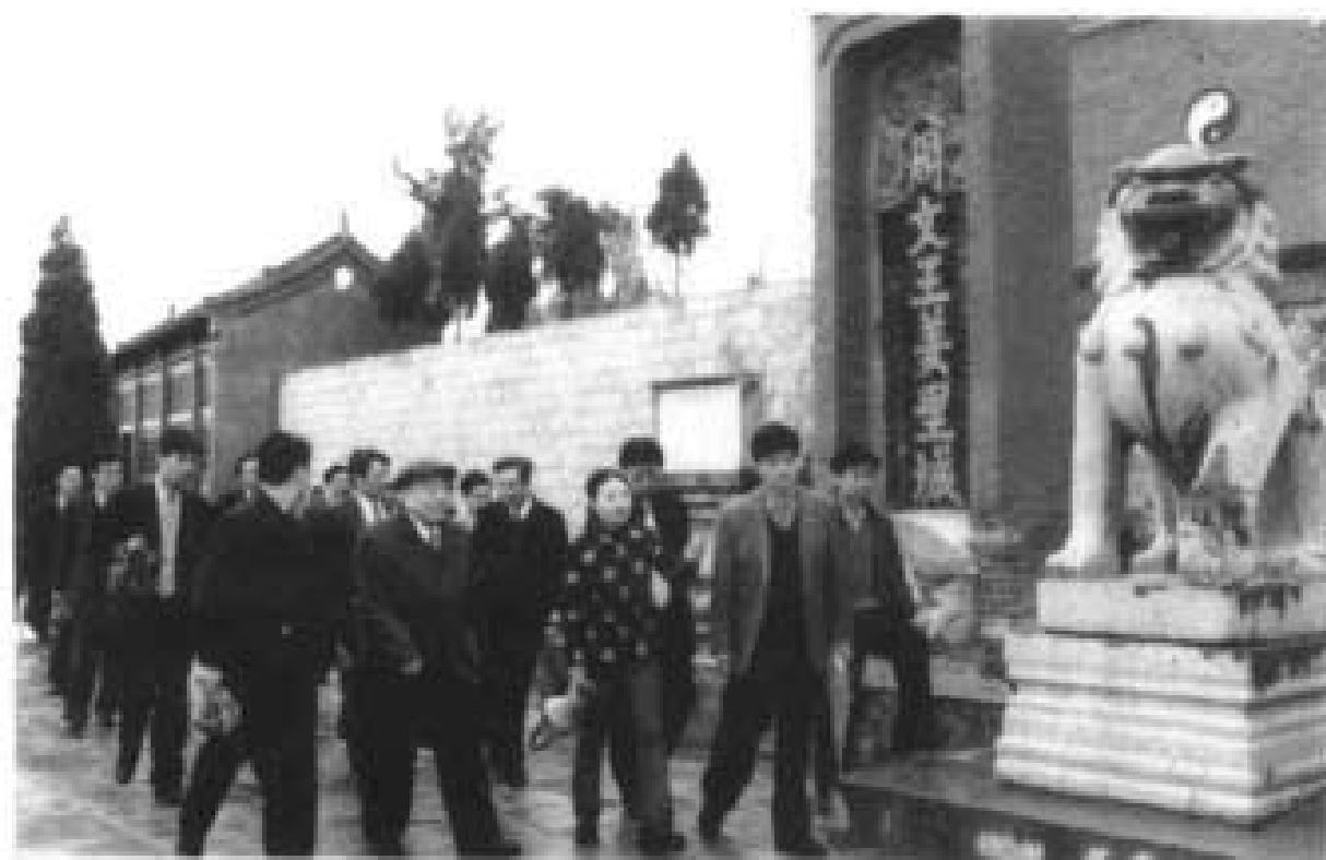
2000年4月全国人大副委员长布赫视察茆里城