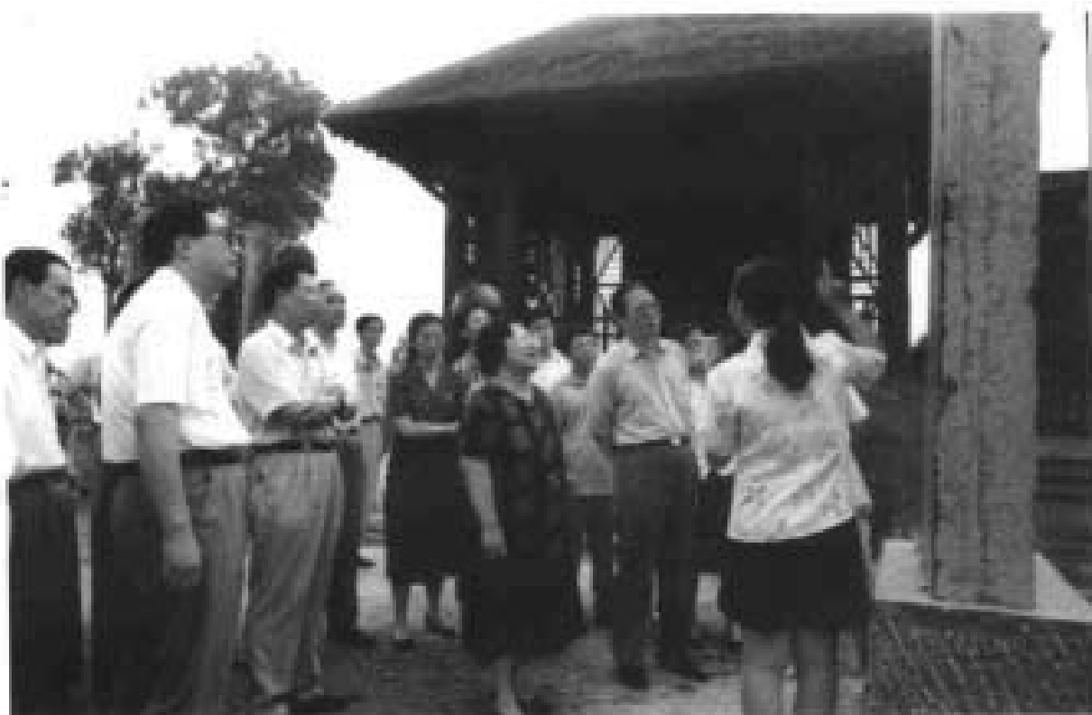
1996年7月国务委员彭佩云视察爨里城