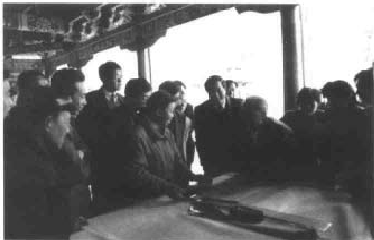
全国政协副主席杨成贵视察茆里城后题字