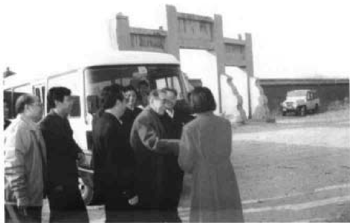
1990年10月原国务院副总理康世恩参观茆里城