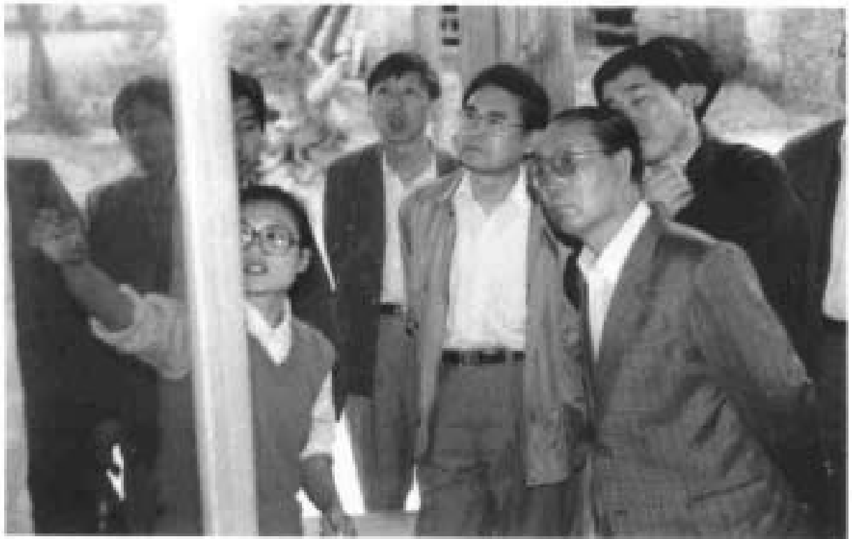
1993年10月10日国务委员陈俊生视察茭里城