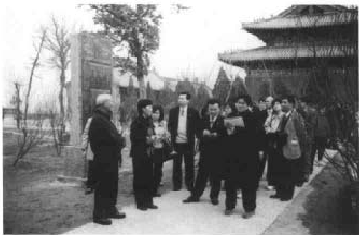
2000年3月泰国公主诗琳通一行参观莒里城