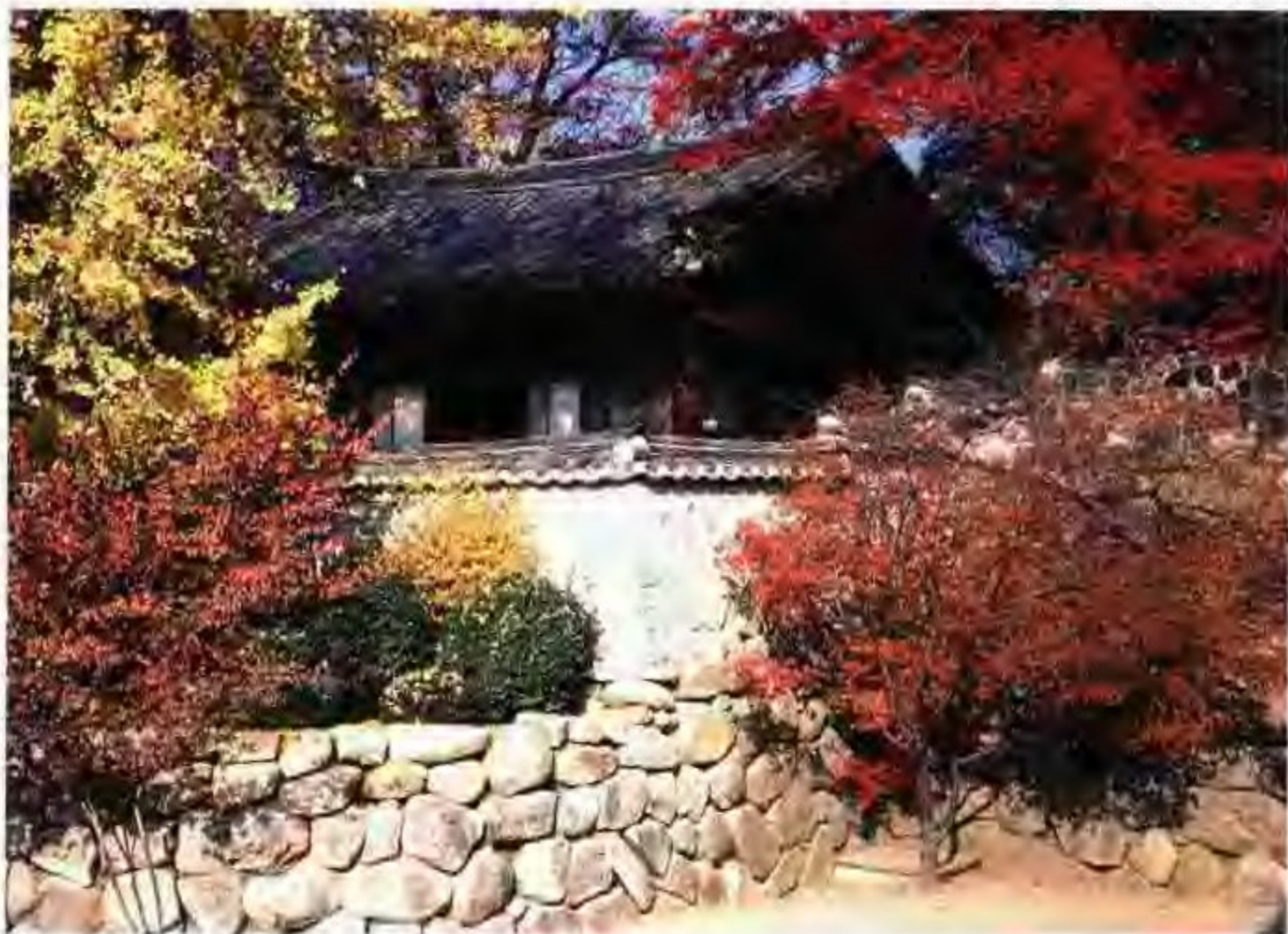
秋天是最适合去韩国旅游的季节

龙头山公园位于釜山繁华的市区。龙头山这个名字的由来是由于山峰像一条龙从海里飞向天空的样子。登上龙头山,可以俯瞰繁华的市区街道与碧蓝的大海。天气晴朗时,一开了望远方的对马岛,在山上观赏夕阳与夜景更加浪漫而富有情调。高达118米的釜山塔是釜山的象征。