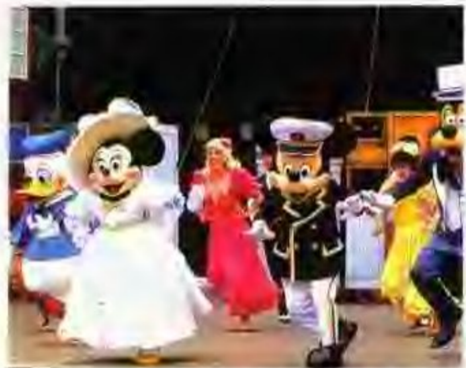
东京迪斯尼乐园的“美国海滨”舞步