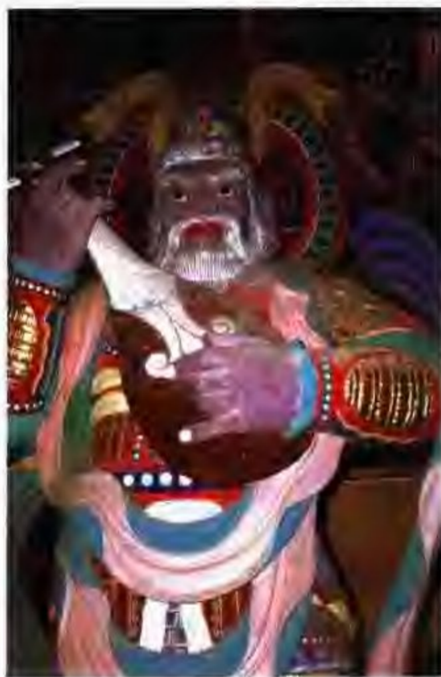
石窟庵内持国天王像

石窟庵坐落在庆州城外约10千米的吐含山，是一座用天然巨石凿成的洞窟寺院，始建于公元751年，由巧夺天工的石雕组合而成。它的布局是“前方后圆”，后部的圆形主室，表示天界。两室之间由通道相连。前室的地面铺砖，左右两壁上嵌着佛法守护神。通道入口两旁有金刚力士的正面立像，通道两侧有四大天王像。主室中央的台座上，供奉着如来石雕坐像。主室周围的石壁上，有文殊菩萨、普贤菩萨等塑像。如来坐像背面是造型优美的观音立像。如来面向东南偏东方向，据说，每年春分、秋分时节，阳光可以直照主佛如来佛像。石窟庵从1962年开始，由国家进行大规模维修。