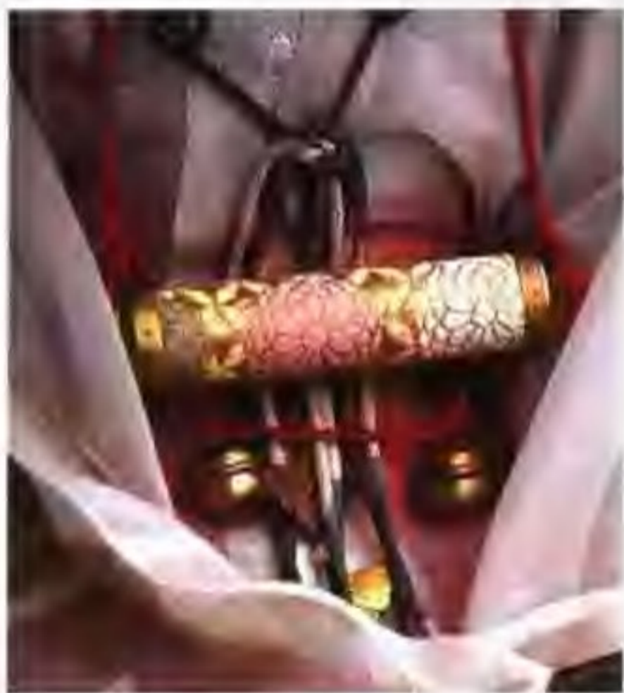
和服上精美别致的传统饰物

日本的医疗技术与设备,水平均很高,享有盛誉。医生们大多懂英语、德语,有的还懂中文。大都市里有些基督或天主教会,设有附属医院,他们替海外病人诊疗,经验相当丰富。