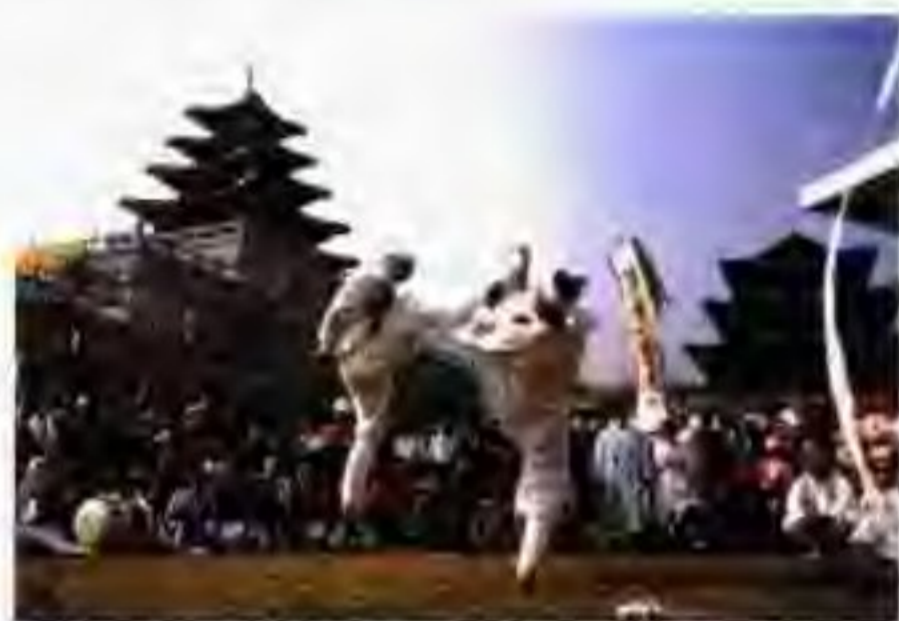
在景福宫表演的传统竞技