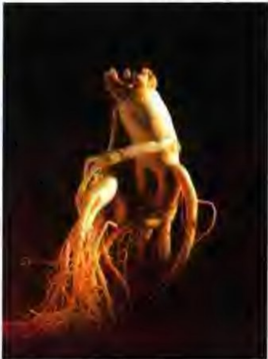
韩国的特产——高丽人参

奥林匹克公园位于汉城松坡区五轮洞88，乘地铁5号线奥林匹克公园站下。这里不仅拥有奥运会期间使用过的六大户外运动场地，亦是文化、艺术中心的多用途公园。草坪区陈列着来自67个国家的雕塑作品约200件，形成户外雕塑公园。其中尤以法国塞以加乐的“拇指”、比利时比欧利的“流动喷泉”最引人注目。