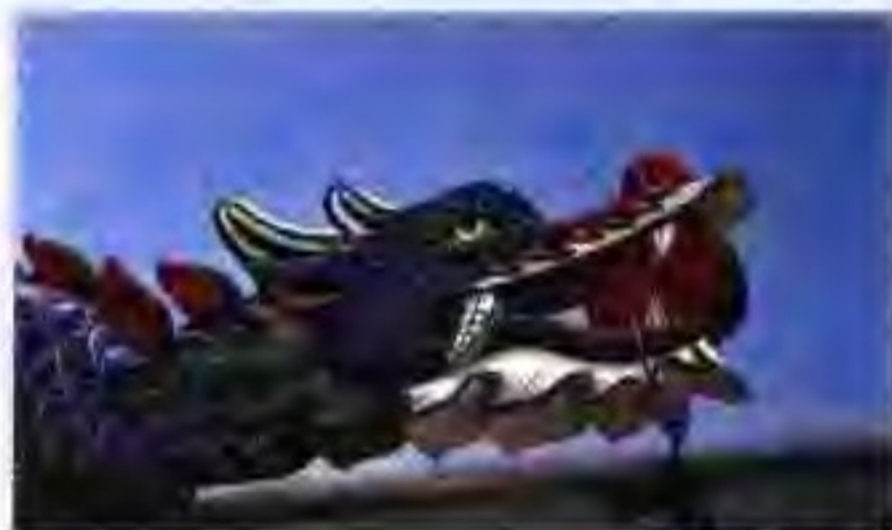
有韩国特色的假帽

韩国有着重视教育的传统。教育被视为实现自我和促进社会进步的手段。现代教育于19世纪80年代传入韩国。大韩民国于1948年建立后，韩国政府开始建立了现代教育制度。1953年，政府规定了小学6年制义务教育。今天，韩国已是世界上读写能力比率最高的国家之一。同时，人们公认受过良好教育的韩国人民是韩国过去30年中实现快速经济增长的主要动力。教育人力资源部是负责制定和推行教育政策的政府机关。政府对基本政策给予指导并提供财政资助。教育资金由中央统一筹集，政府拨款占学校预算的绝大部分。