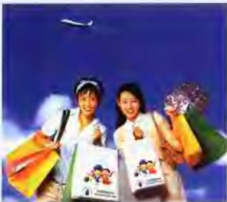
汉城是购物的天堂

曹溪寺位于汉城钟路区坚志洞45，乘地铁1号线钟阁站下。这里是韩国佛教最大宗派——大韩佛教曹溪宗的总部。大雄殿宏伟壮观，气派非凡。每年农历四月初八，为纪念佛祖诞辰而举行的提灯游行更是闻名的景观。