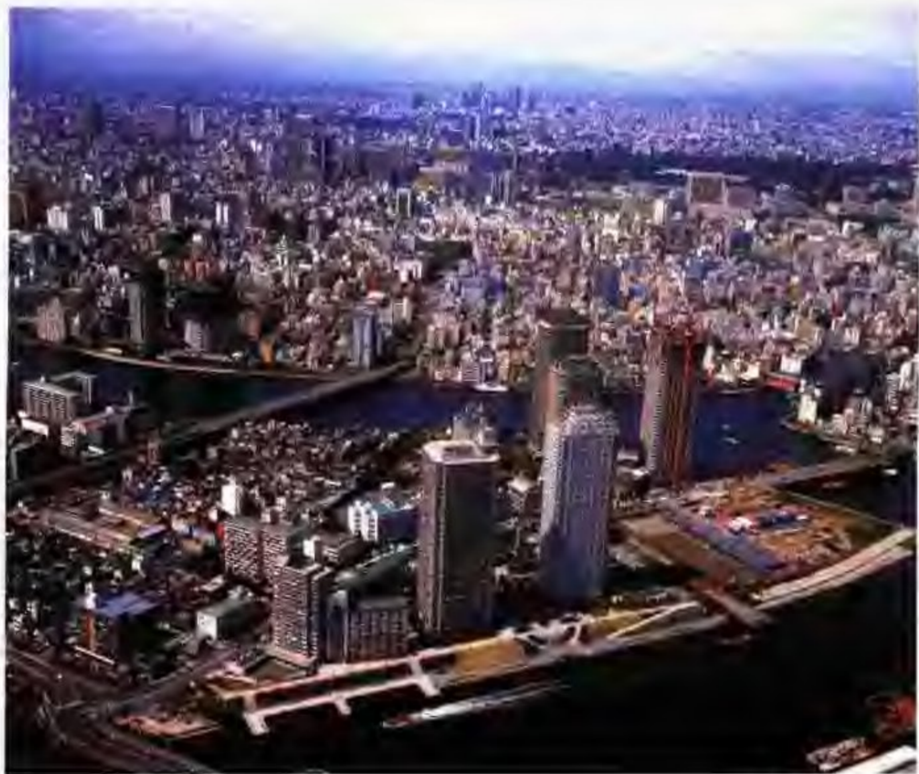
从东京塔上俯瞰全市

东京国立博物馆是日本最大的博物馆，由一幢日本民族式双层楼房，和它左侧的东洋馆、右侧的表庆馆和大门旁的法隆寺宝物馆构成，共有43个展厅。博物馆内主要收藏和展出日本古代历史文物和美术珍品共十几万件，展品按雕刻、染织、金工、武具、刀剑等次序分类展出，展现了日本社会各个时期的文化艺术和人民生活概貌。东洋馆是一座现代化建筑，展出以东洋美术为中心的各国美术作品。表庆馆是明治四十二年为纪念大正天皇成婚而建立的巴洛克形式的花岗岩建筑，具有明治年代典型建筑风格，馆内展出了明治年代的展品。