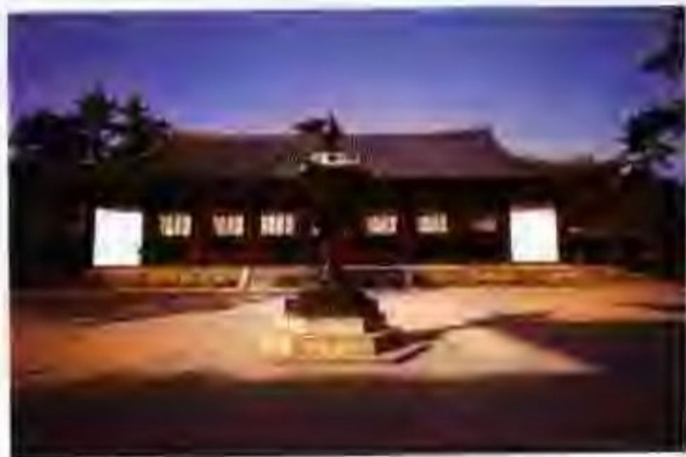
西院伽蓝的大讲堂

日本的四季分明，而且各有特色。春季衣着只需轻装，但也不妨带些薄的毛衫。夏季有很多民间佳节，社会大众可以尽情享受。各处海滩及山间避暑地区，都挤满红男绿女，热闹异常。夏季衣着应以凉爽为佳，运动衣衫也很实用。秋季是旅游日本的佳期，比起春季，有过之而无不及。衣着和春季差不多，也需薄的毛衫。冬季的空气冷而清新，中部和北部更冷些，很多滑冰滑雪的场所开放。南部虽温暖，但大衣毛衫等厚的衣服还是应该携带的。