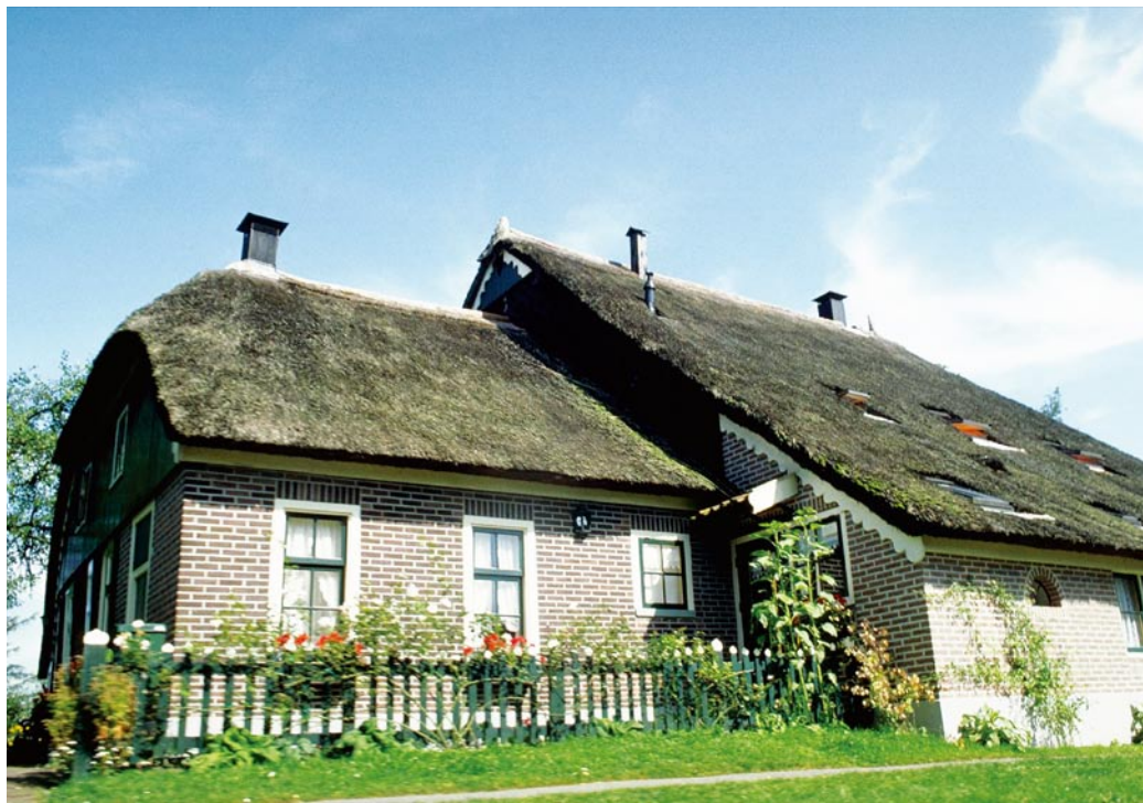
○ 羊角村的标志——芦苇小屋，看似简陋，却只有富人才住得起。

芦苇建造屋顶。河边一栋栋小屋看上去就像我国一些地区的茅草房，充满了自然之趣。这种房屋冬暖夏凉、防雨耐晒，成了羊角村的标志。18及19世纪时，贫穷的农民买不起瓦片，只得用芦苇建造屋顶。三十年河东，三十年河西，到如今，芦苇比砖瓦还要贵上10倍，成为高级的建筑材料，只有十分富