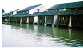
○ 开斋即是碧水悠悠。

雨天过往行人有掉到河里去致伤的危險。清康熙年间，住在桥旁的一位篾匠，看见一位孕妇在过桥