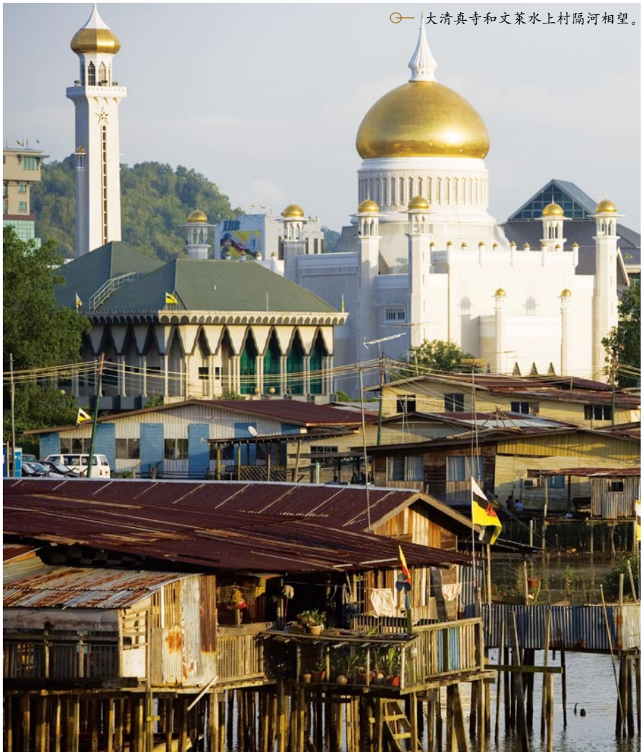
大清真寺和文莱水上村隔河相望。

那么，为什么在水上村原住民纷纷迁往内陆的时候，还有人选择留守？其中原因究竟是什么？这只能从民族的精神和文化方面才能给出有说服力的回答。水上村既然是文莱整个国家的发祥地，自然和本民族的历史文化不可分离，这里是文莱民族的精神和文化的根。不管世界怎样飞速发展，社会怎么纷纷扰扰，水上村永远是文莱人不得不眷