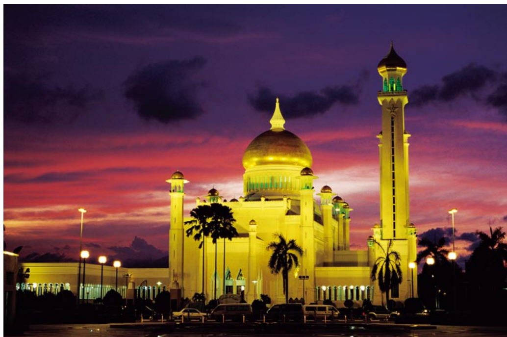
○ 夜色中的文莱河风光，清真寺等著名建筑构成一幅美丽的画卷。

府接待重要外国使团参观的首选之地。水上村驰名世界由来已久了，500多年前，随麦哲伦远航的意大利史学家安东尼·帕加塔初次在东方见到这样奇特的地方时一阵惊呼，在他的著作《首次周游世界》中把这个水上村落誉为“东方威尼斯”。翻开古代中国及古代阿拉伯的名著，也可见到这个大名鼎鼎的村落的身影。