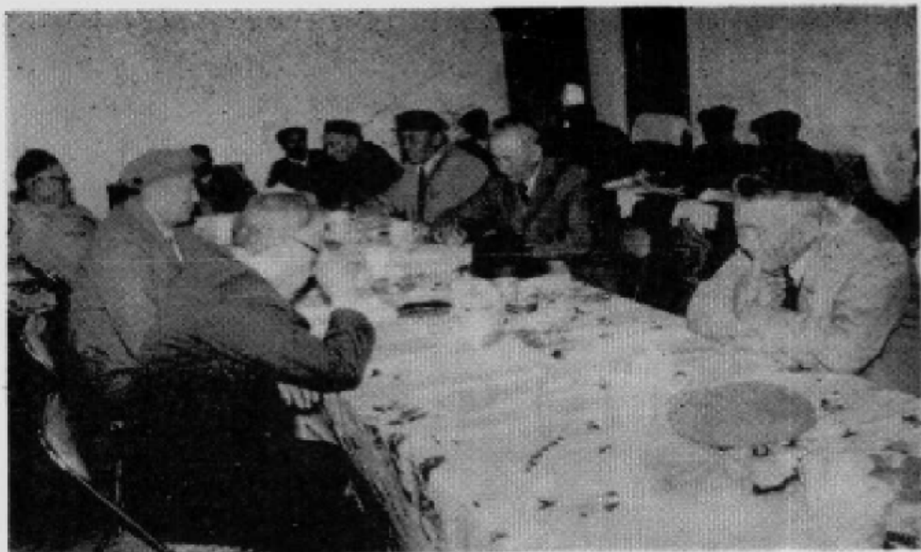
↑ 认真学习文件精神