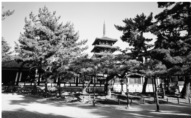
◆ 日本法隆寺，为圣德太子修建。

推古天皇，原名额田部皇女，生于554年，是第29代天皇钦明天皇之女，母亲为当时的大权臣苏我稻目之女苏我坚盐媛。推古天皇年轻时姿色端丽，行为举止大度娴雅，于是被同父异母的哥哥——第30代天皇敏达天皇相中，立为皇妃，后又被册封为皇后。585