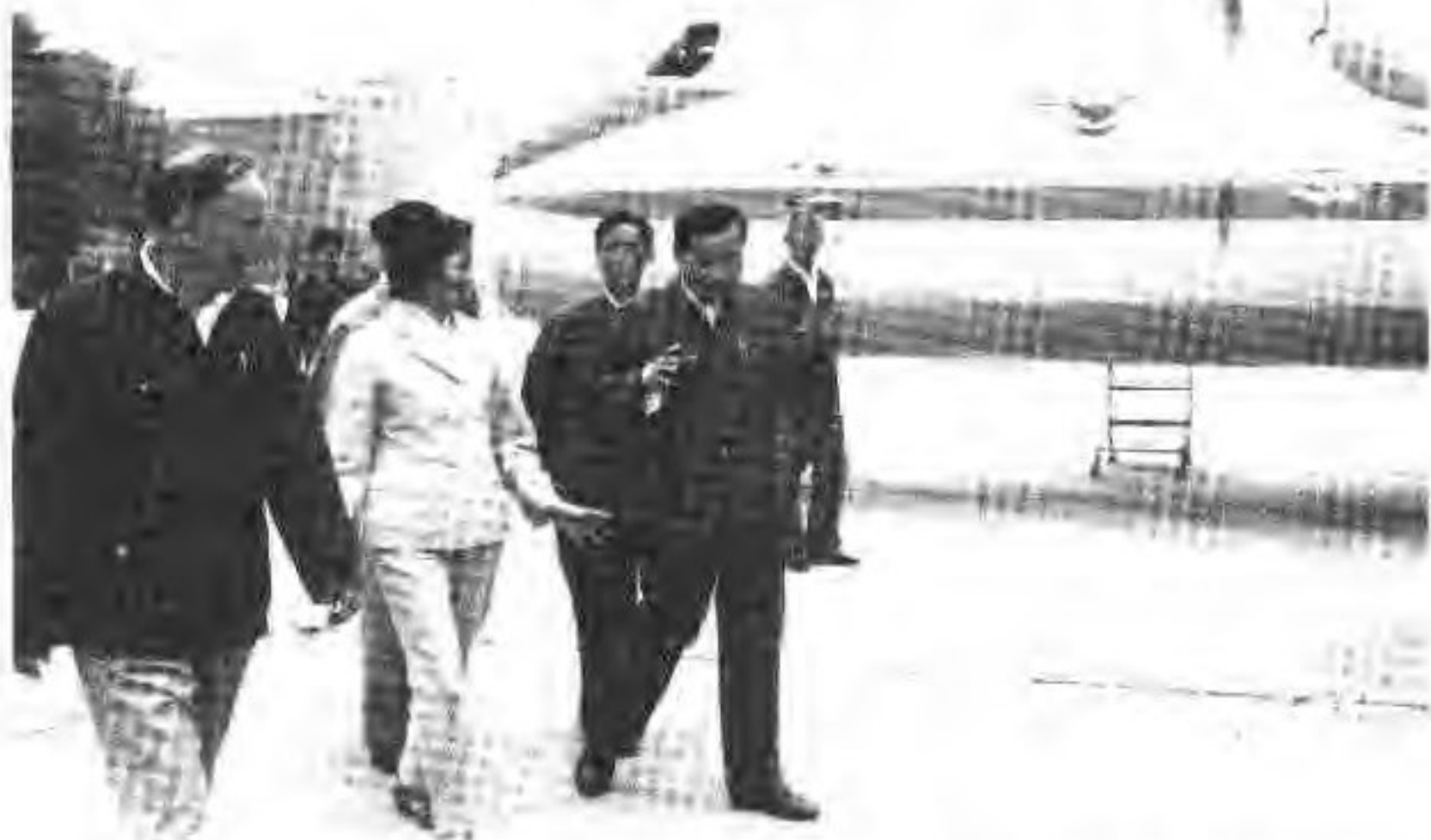
7. 1984年9月7日中共中央候补书记郝建秀在厂长邵国斌，书记肖正诚，总工程师易志斌陪同下参观运—7飞机