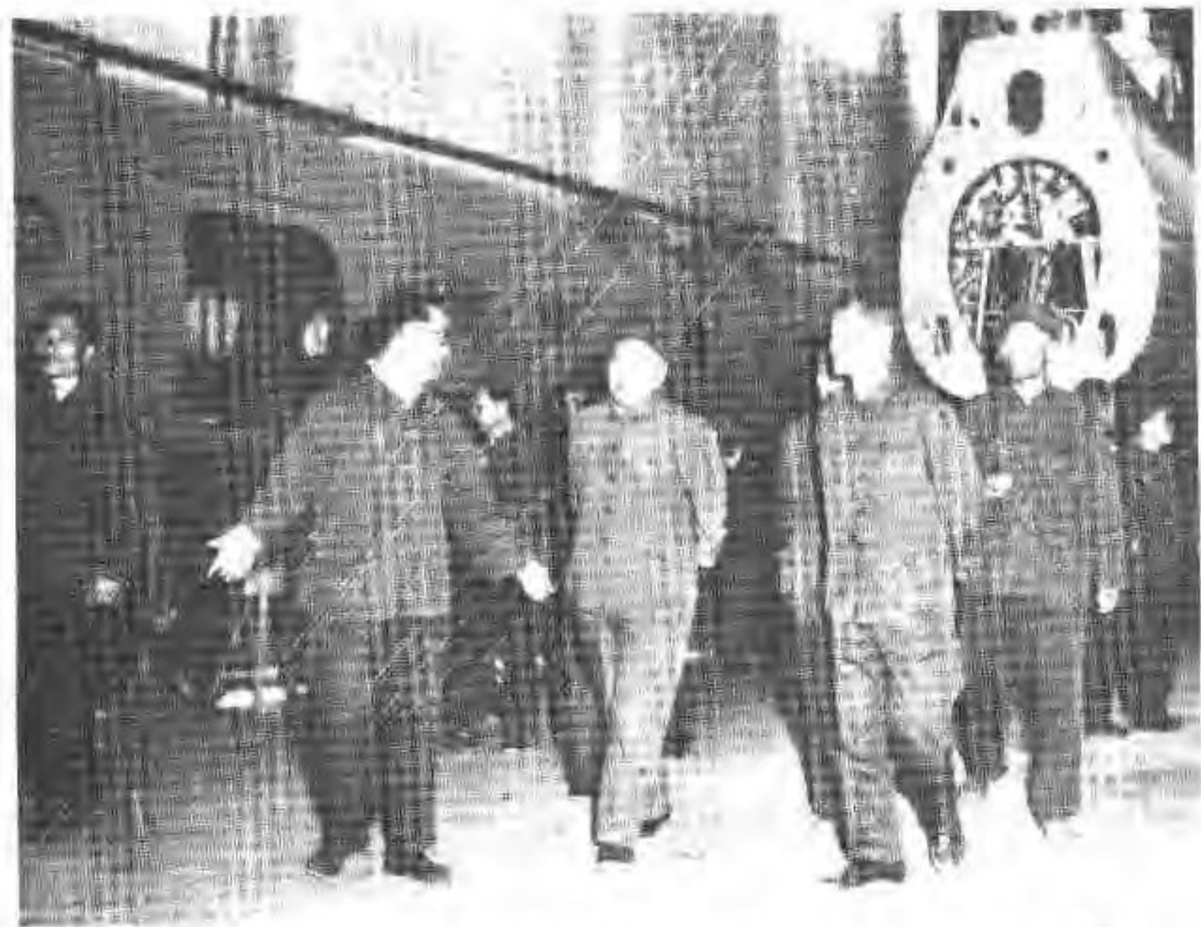
8. 1978年4月17日三机部部长吕东首次来厂检查工作。厂长李溪溥（右）副厂长兼总工程师陆颂善（左）陪同吕东部长（中）在总装车间视察。