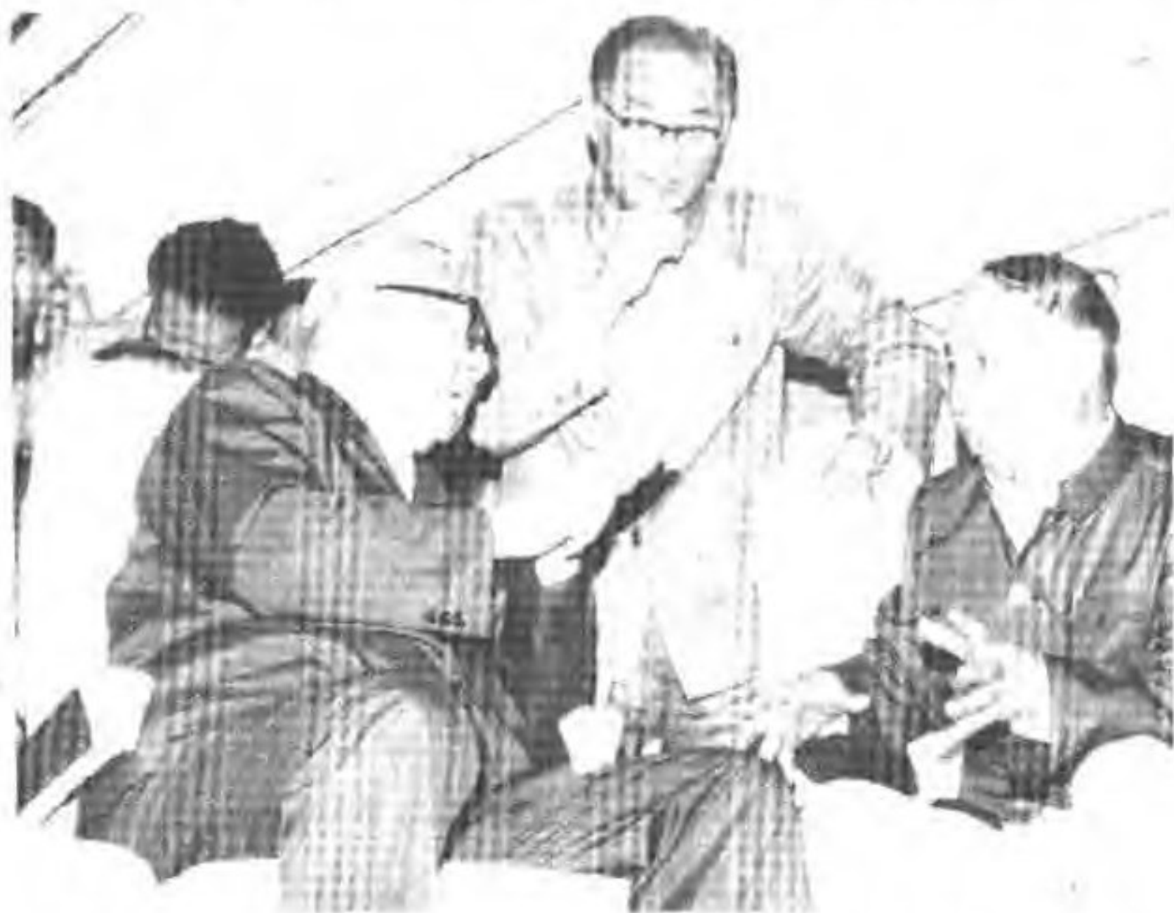
2. 1984年9月7日国家主席李先念（左）参观工厂生产的运—7飞机，省委书记李溪溥（中），厂长邵国斌陪同参观。