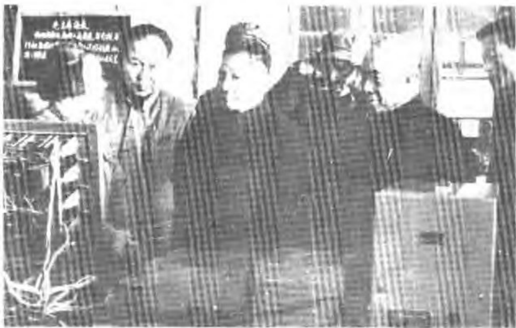
1. 1966年3月12日中共中央总书记邓小平及国务院副总理李富春，由厂长孙志瑞陪同在总装车间仪表工段参观。