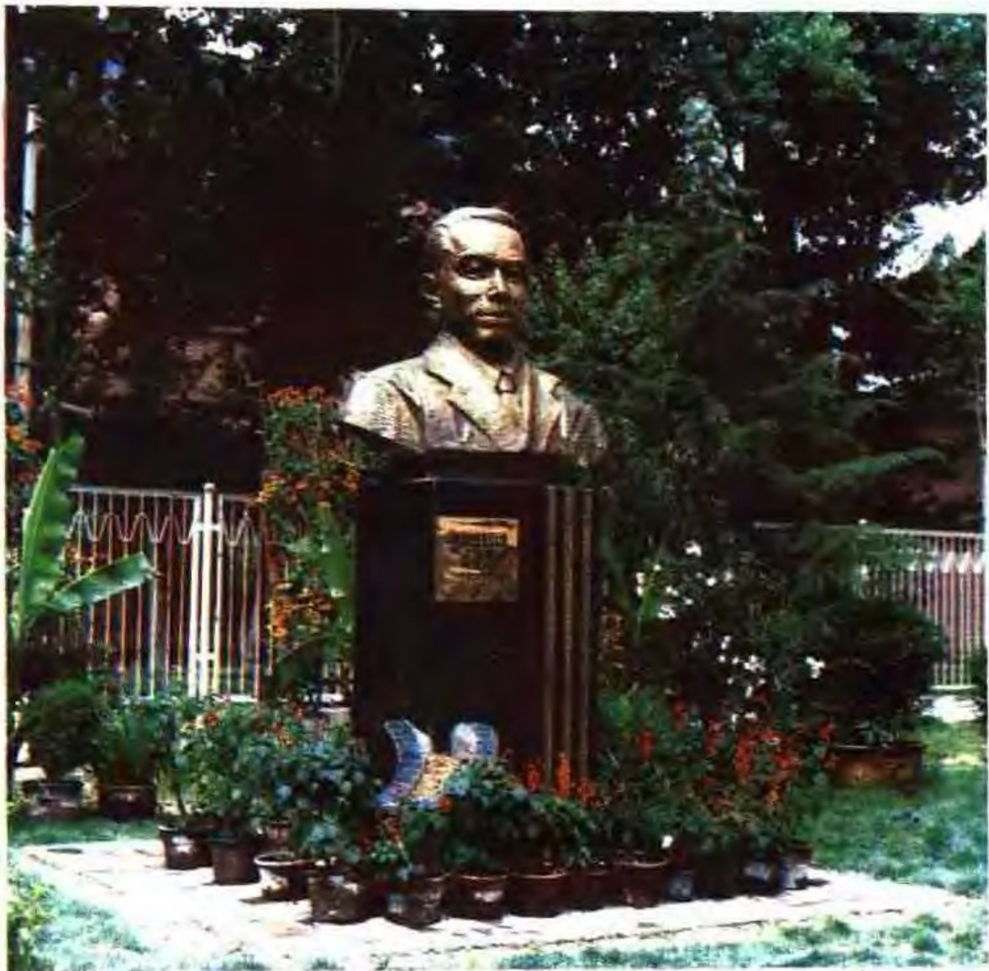
毛澤東的陪都壽壽銅製像矗立在河邊幽雅新修成之地前