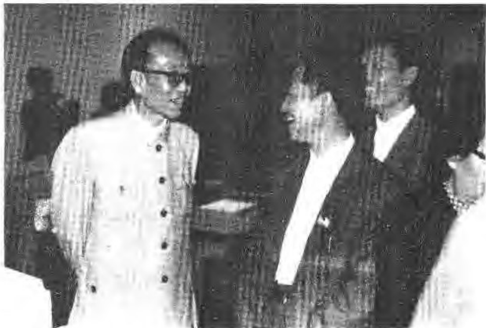
6. 1985年5月3日王任重同志在陶良视察。