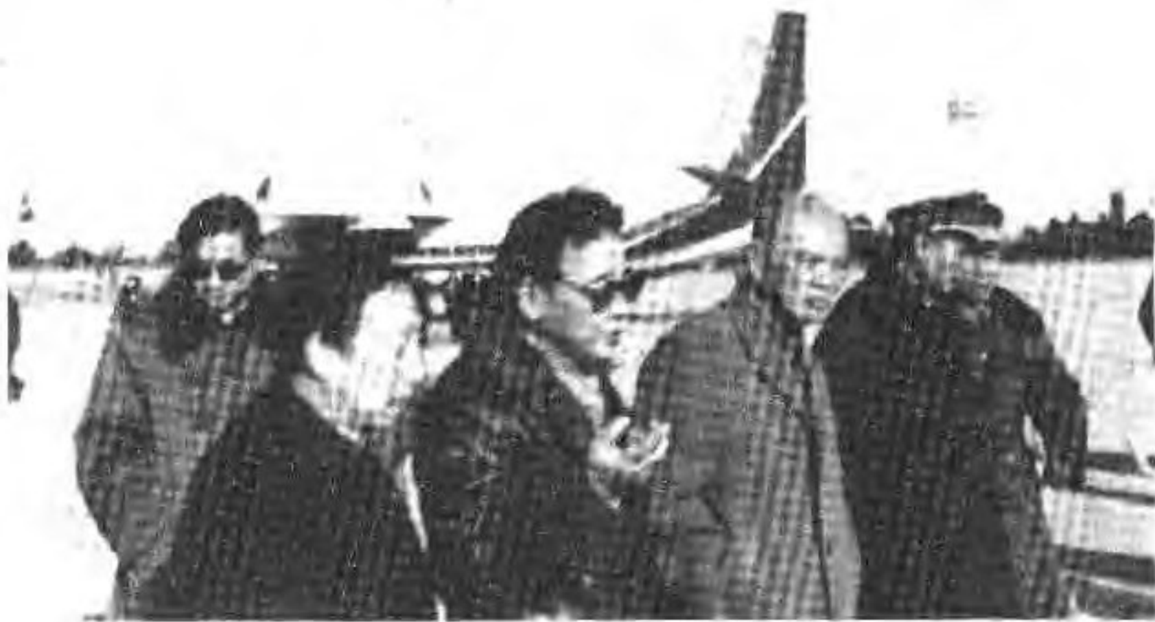
4. 1985年12月1日国务委员姚依林（右三）、副总理李鹏（左二）由航空工业部部长莫文祥陪同在首都机场参观运7—100型客机。