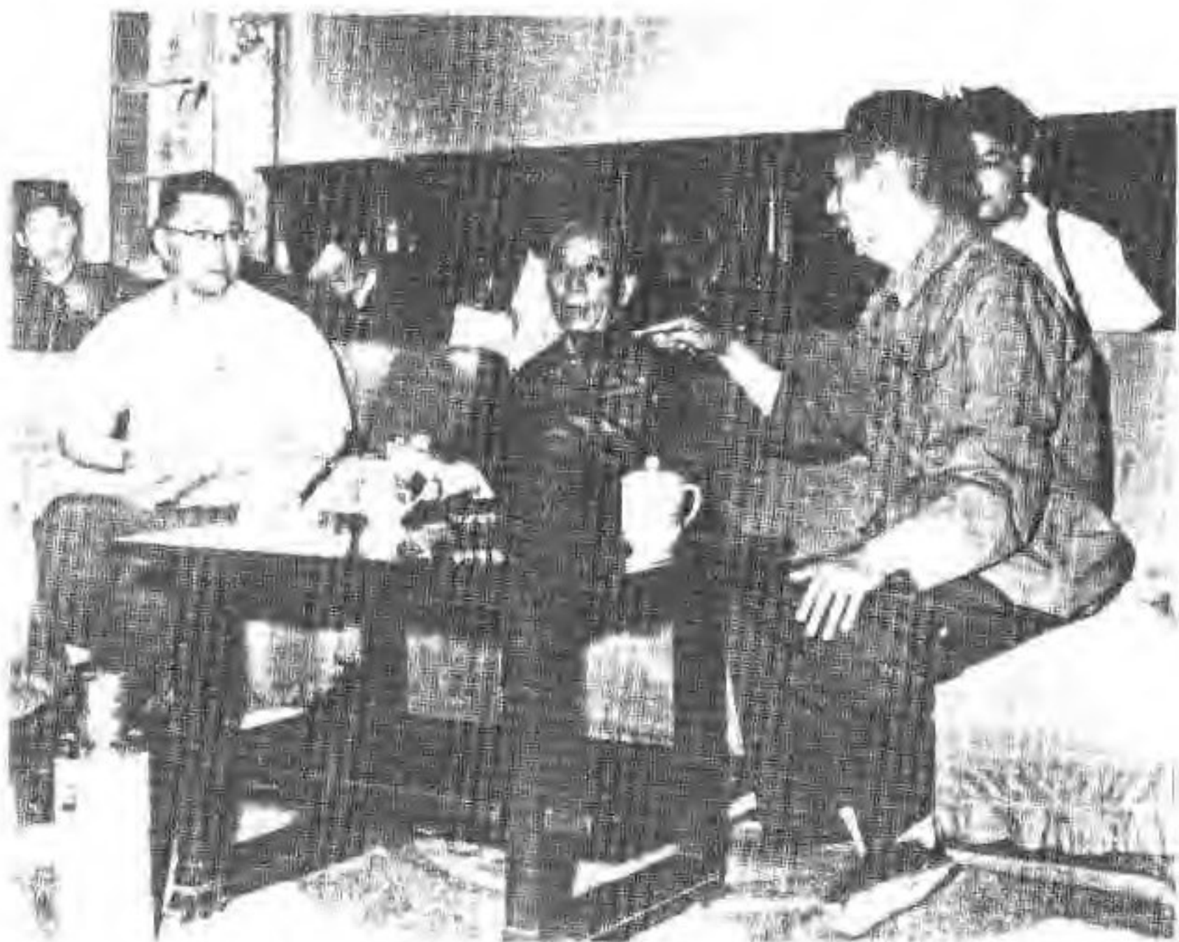
5. 1977年6月10日国务院副总理王震来厂视察期间，听取党委书记张胜明（右），革委会主任李溪溥（左）汇报工厂情况。