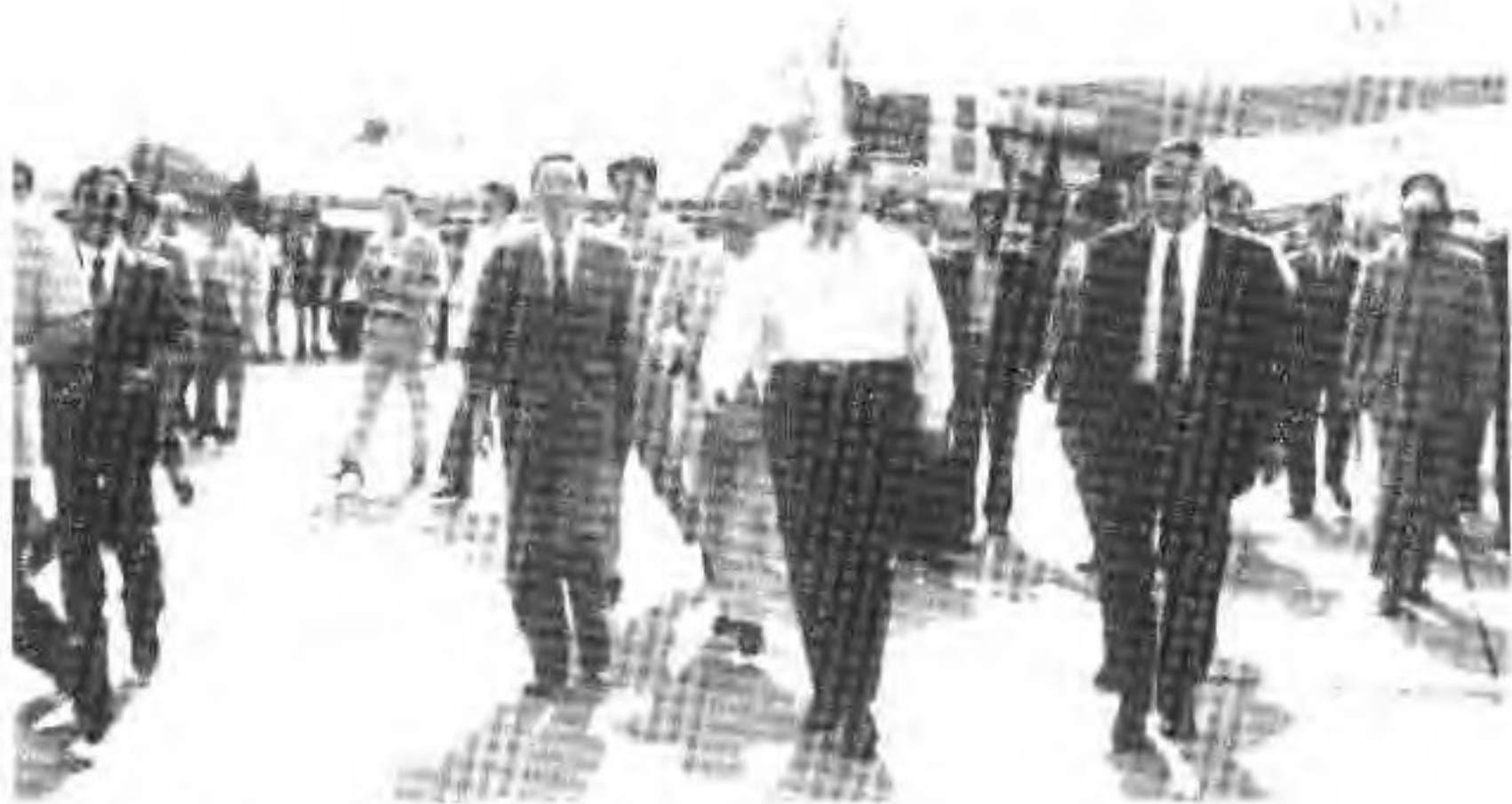
3. 江泽民同志在阎良视察