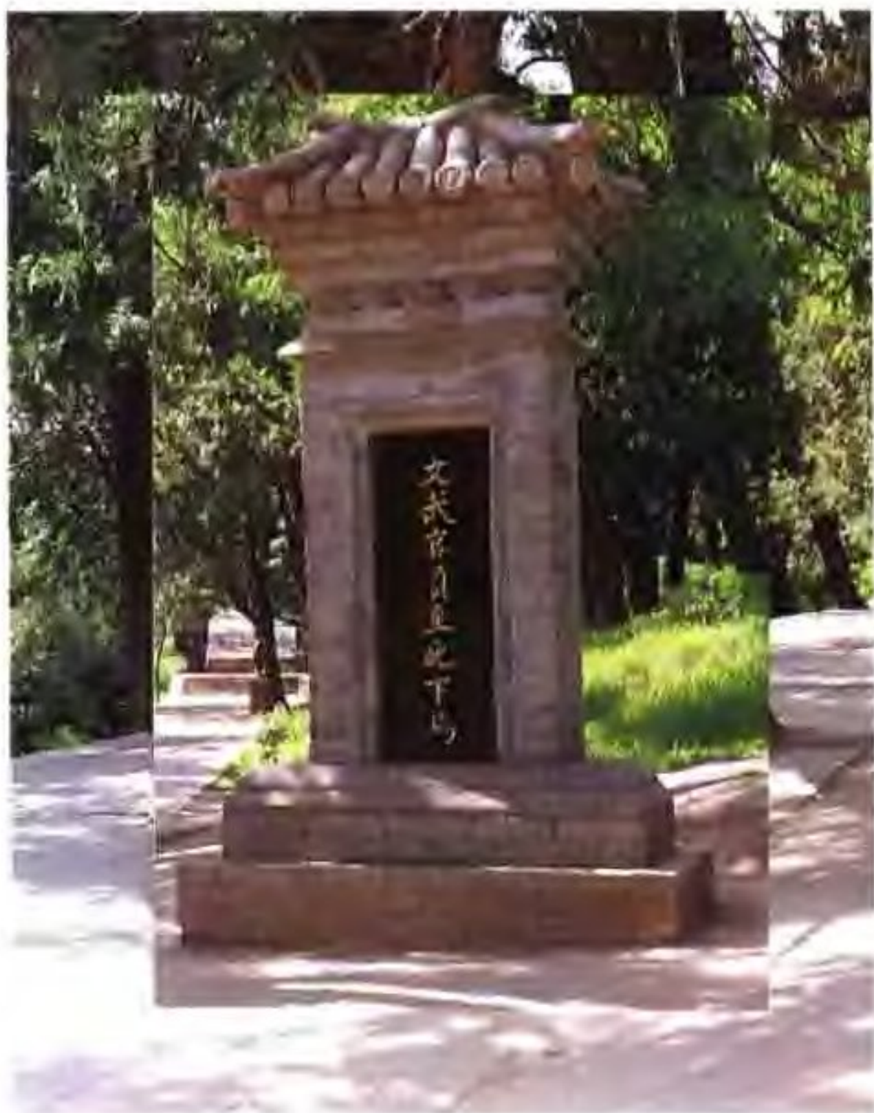
“文武官员至此下马”碑

距黄帝陵约 400 米的神道旁，有一座明嘉靖年间垂立的石碑（右图），上刻“文武官员至此下马”。古代祭陵者均须在此下马，下轿。