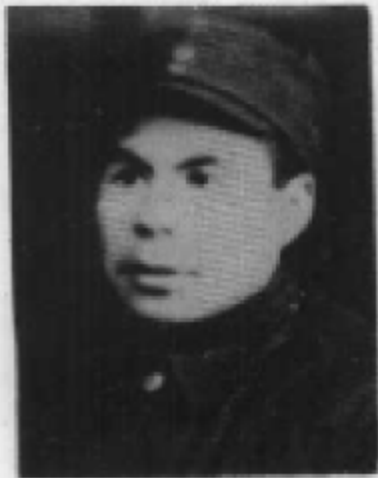
延边军分区副司令员邱会魁