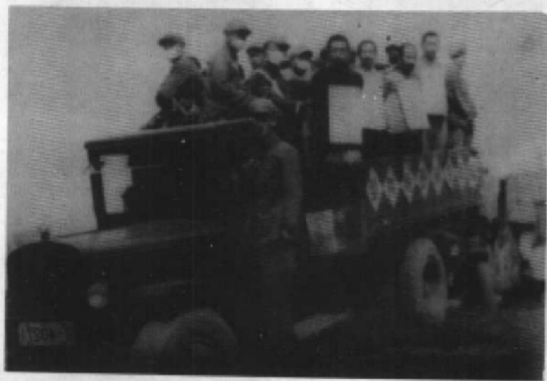
游斗匪首大快人心