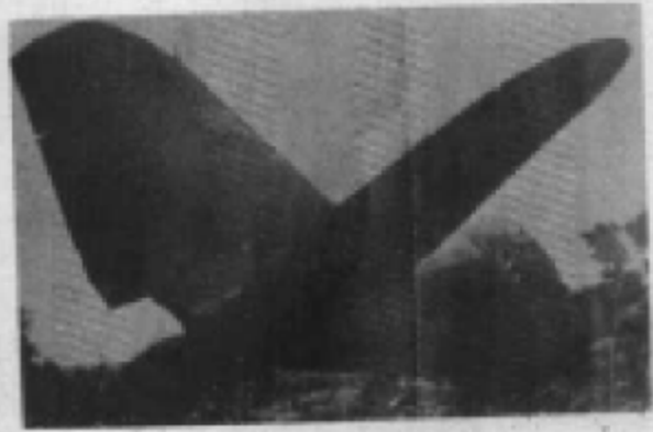
美国间谍唐奈·费克图 所乘无国籍标志的C—47型 飞机被我击毁的残骸