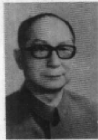
延边地委书记、延 边军分区政委 孔原