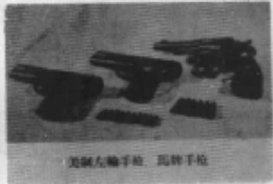
美制大轴手枪 瓦特手枪