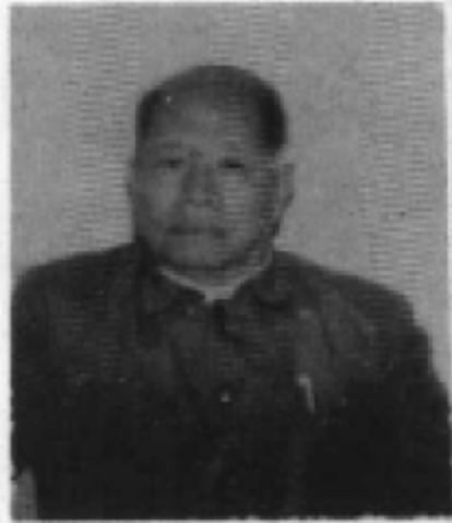
延边地委书记、延 边军分区政委 邹文涛