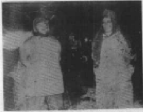
美国间谍唐奈·费克图 在他们所乘的飞机被击落后 当场被扑的情形