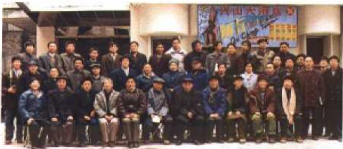
《兴山小水电》征编会留影