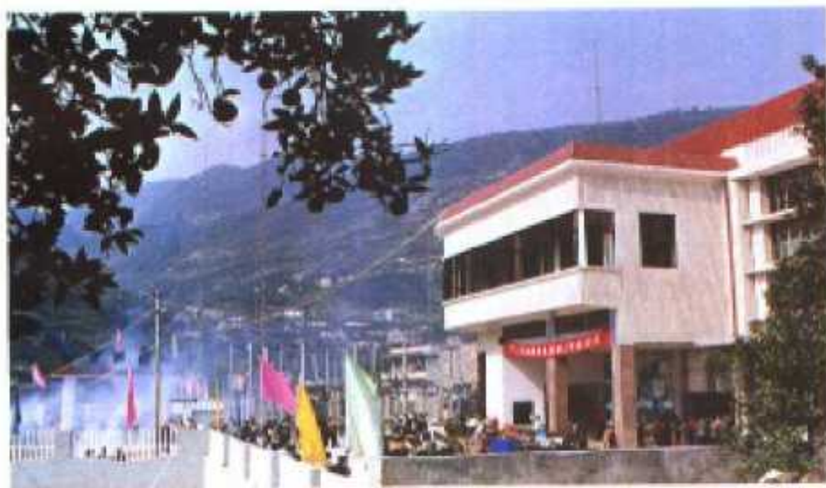
装机1.2万千瓦的南阳河电站