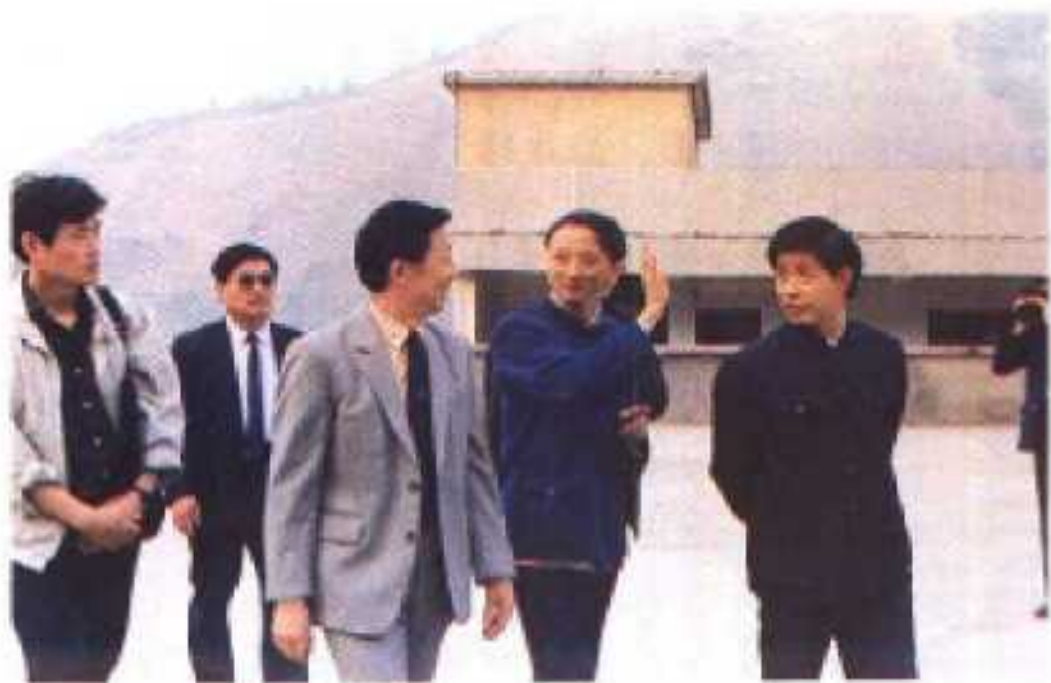
国家教委副主任郎世炎(左三)视察兴山水电人才基地——兴山县职业高中。左二为地委副书记李文钊，左一为中共兴山县委书记易行远，右二为职高校长汪文贵。