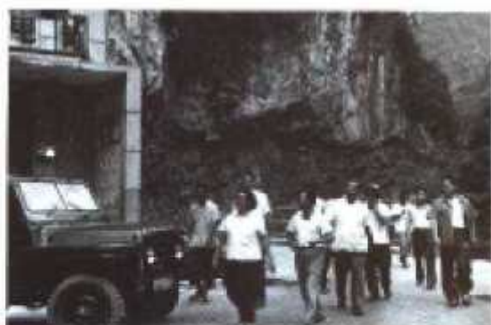
1979年7月24日原水利部部长钱正英视察娘子包电站。右为中共兴山县委书记冯运汉。