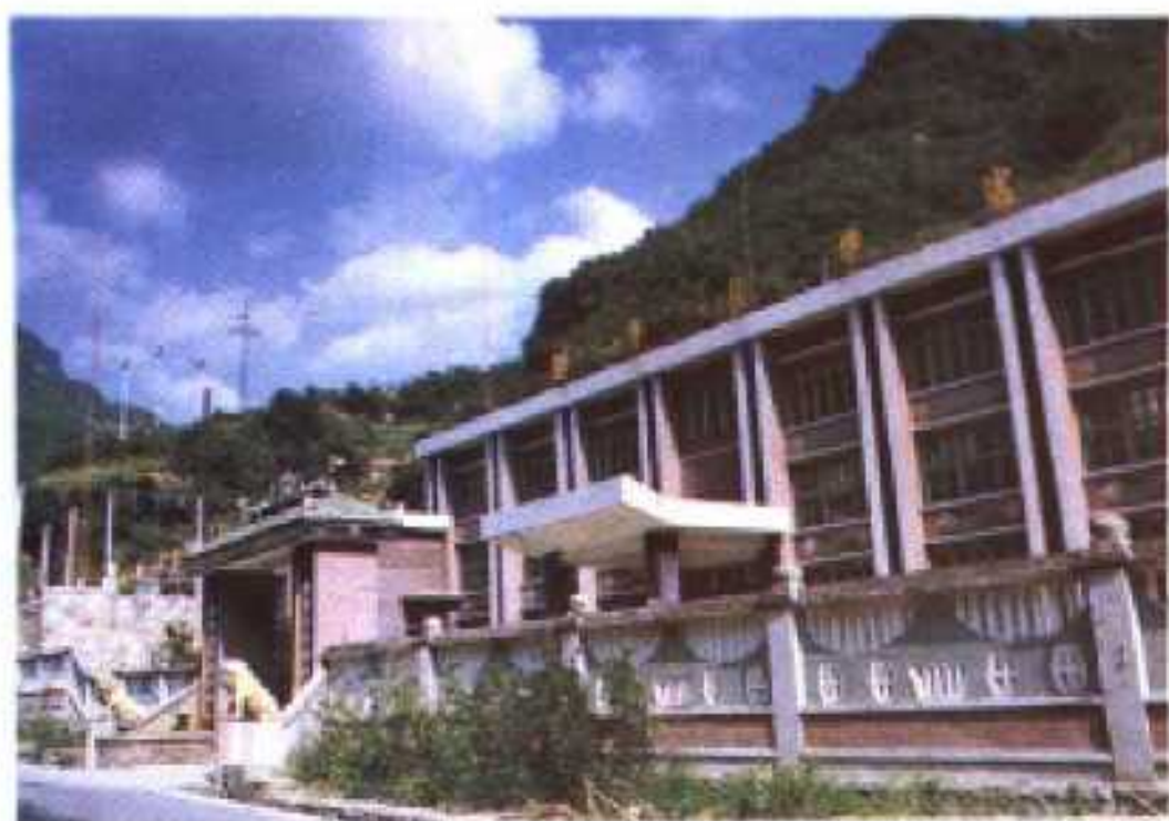
装机容量 2500KW 的高压将军柱电站