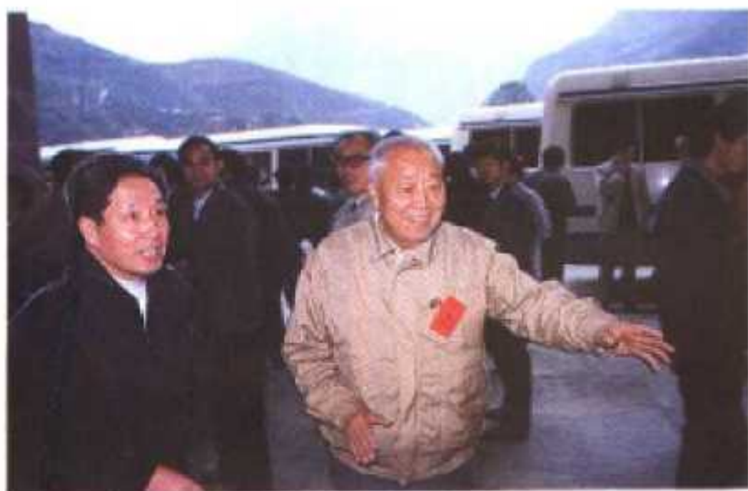
省委书记关广富(左一)视察兴山南阳河电站,右一为 省人大顾问姜一。