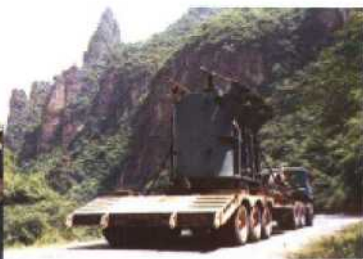
县水电开发公司安装南阳河电站 6300KW 的主式发电机组。