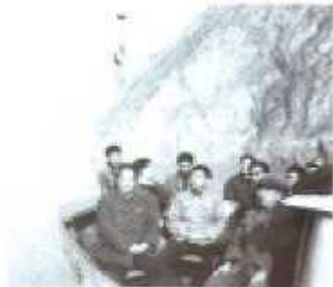
地委领导亲临小青滩指挥 过江线