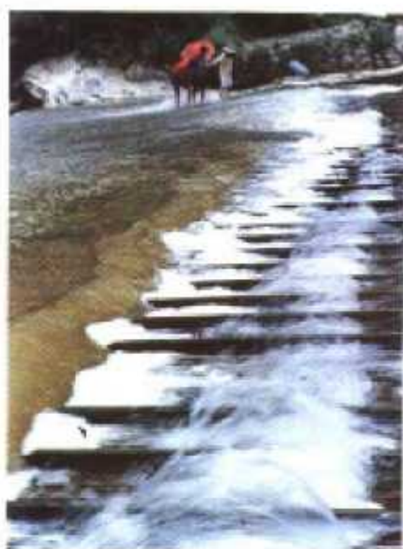
燕子包电站成栏栅坝