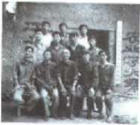
孩子包电站指挥部及工作人员