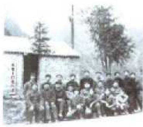
苍坪河电站指挥部及工作人员