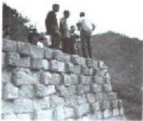
兵各宝剑峡顶过江拱塔塔基