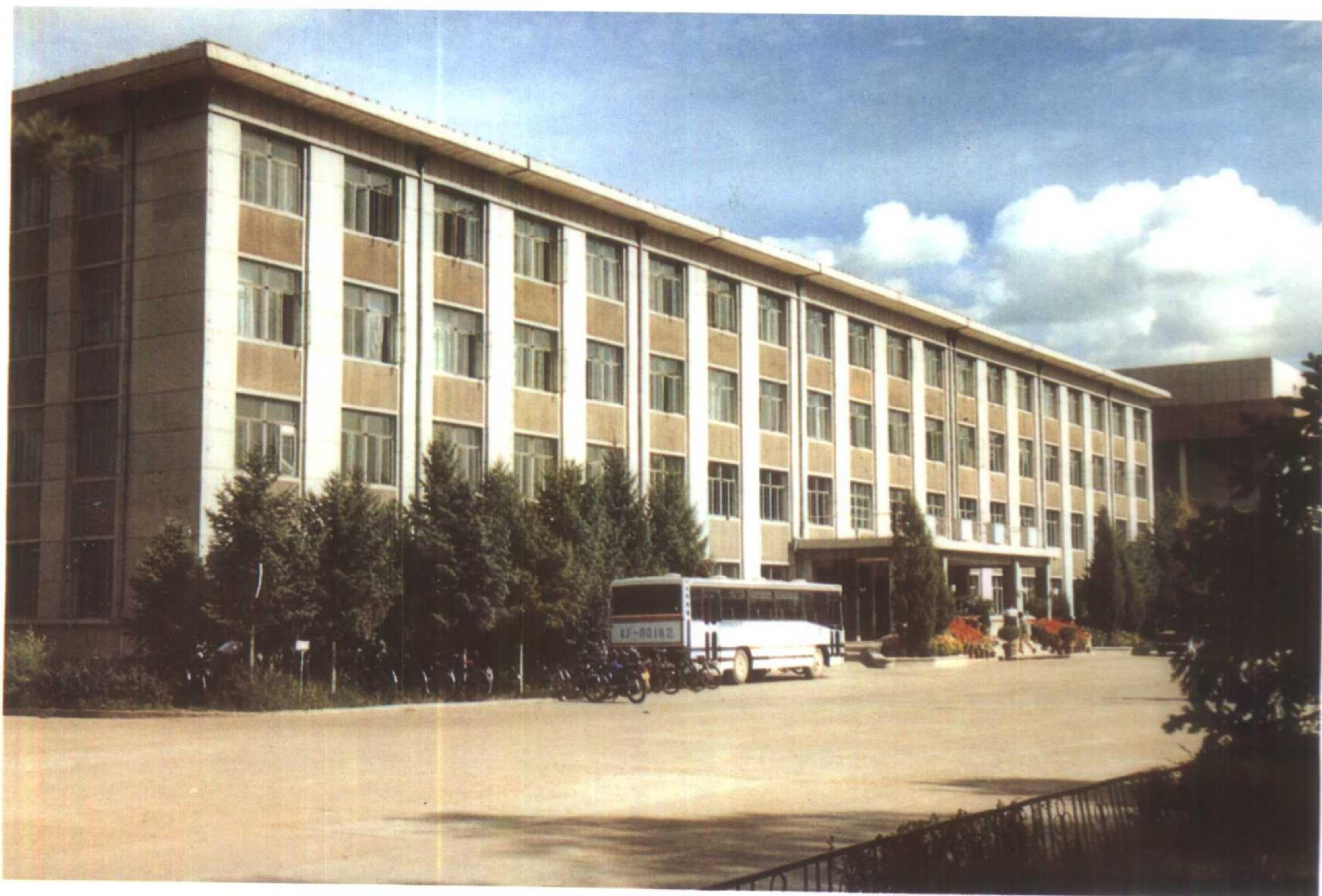
兴安盟行政公署办公楼