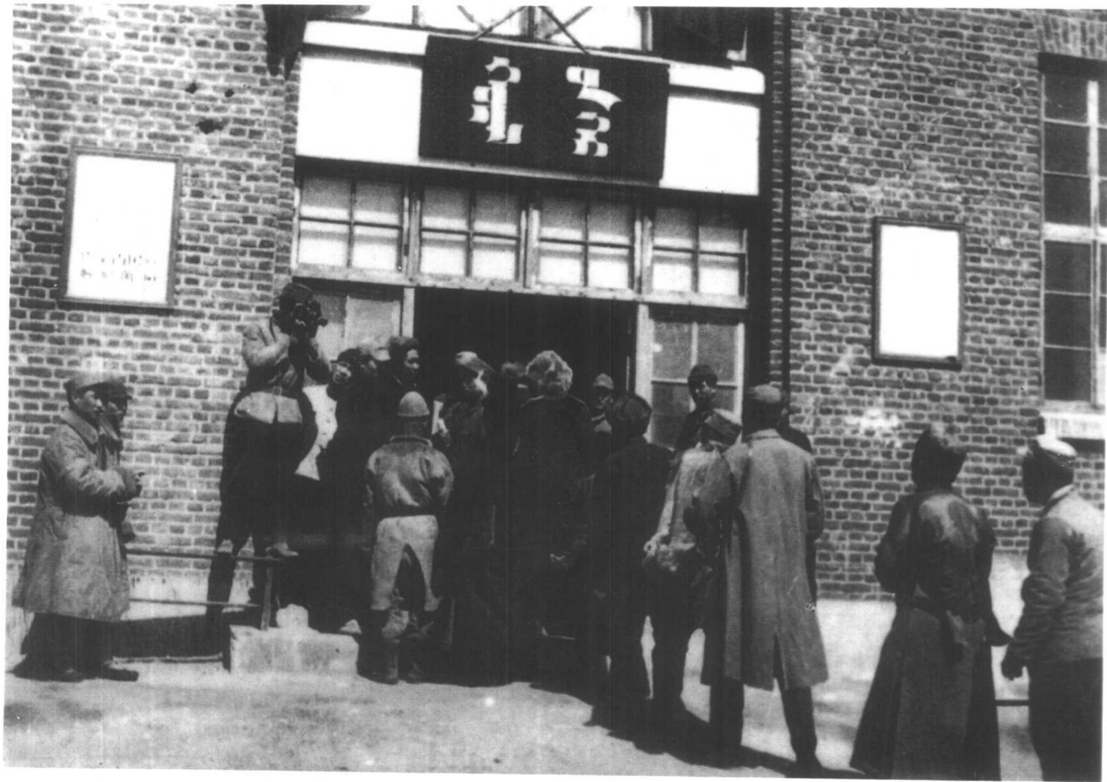
內蒙古人民代表会议代表们步入会场