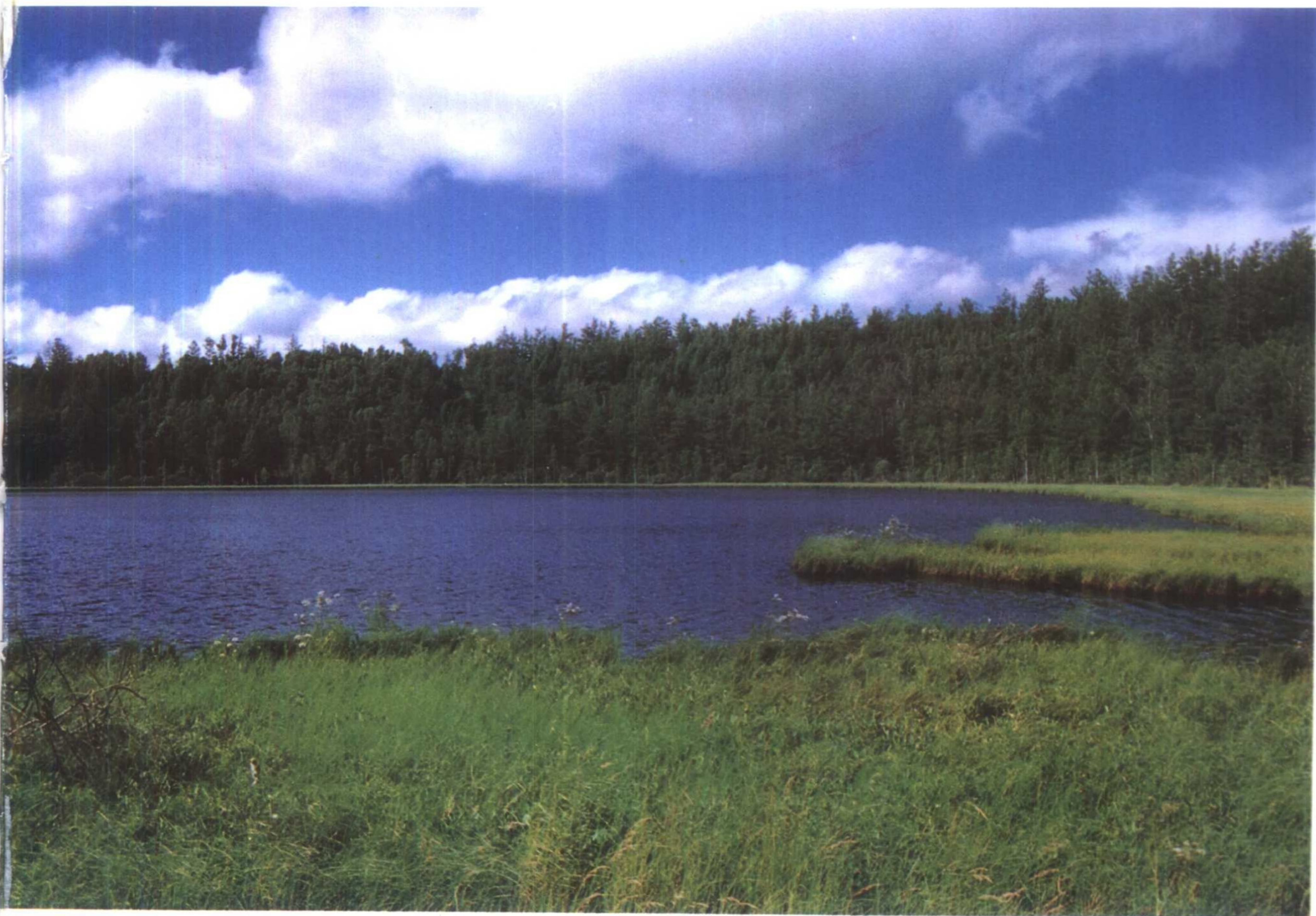
水草丰美的科尔沁草原