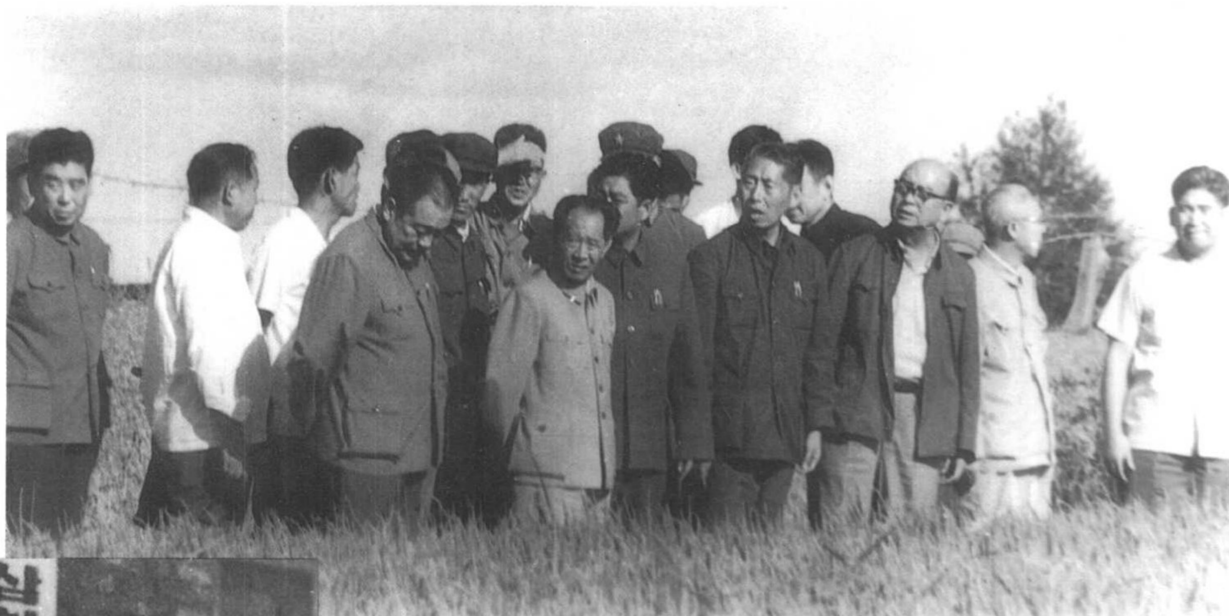
1982年8月20日胡耀邦同志视察乌兰哈达公社三合大队并与社员亲切握手