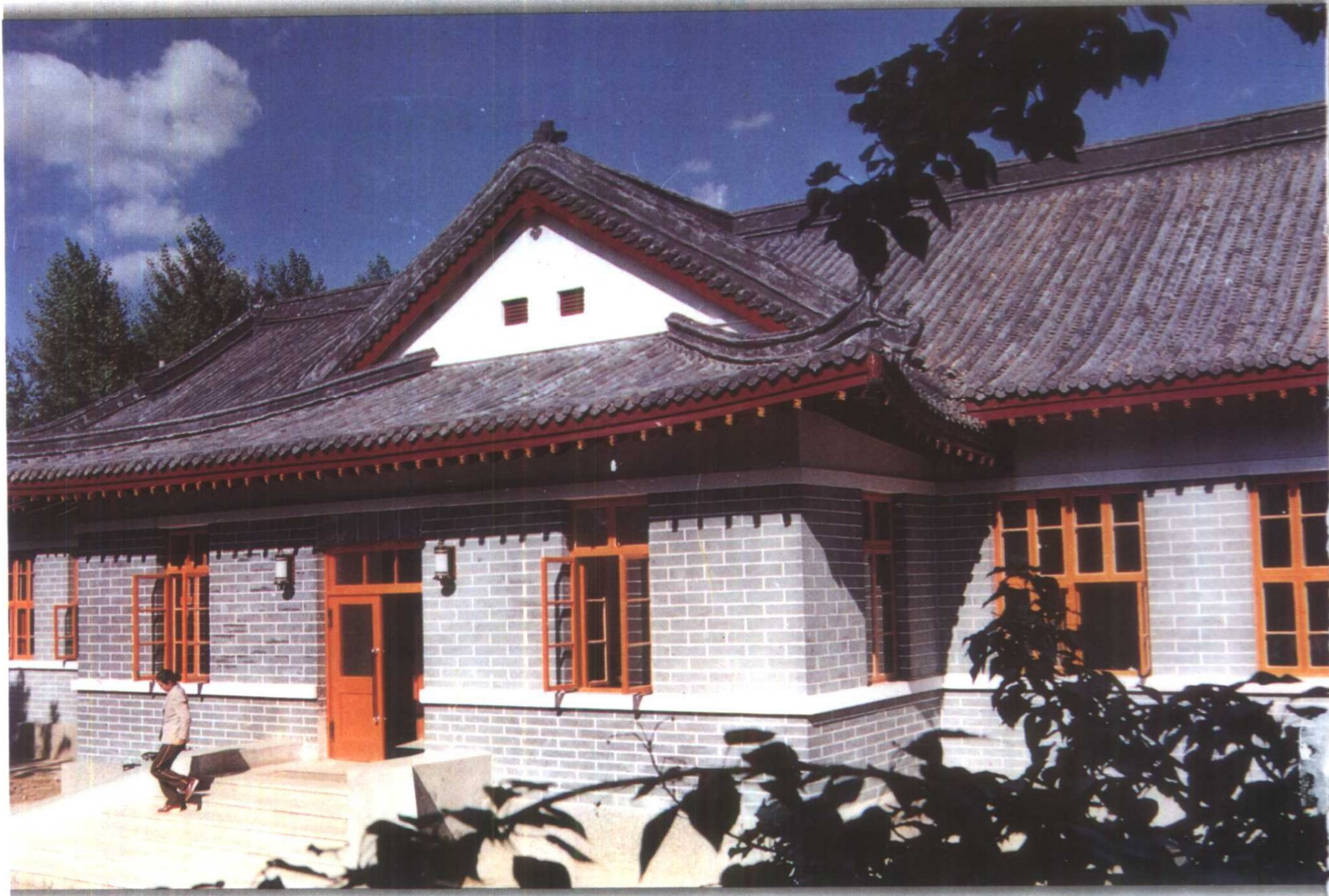
1947年，內蒙古自治政府成立后，乌兰夫在这里办公