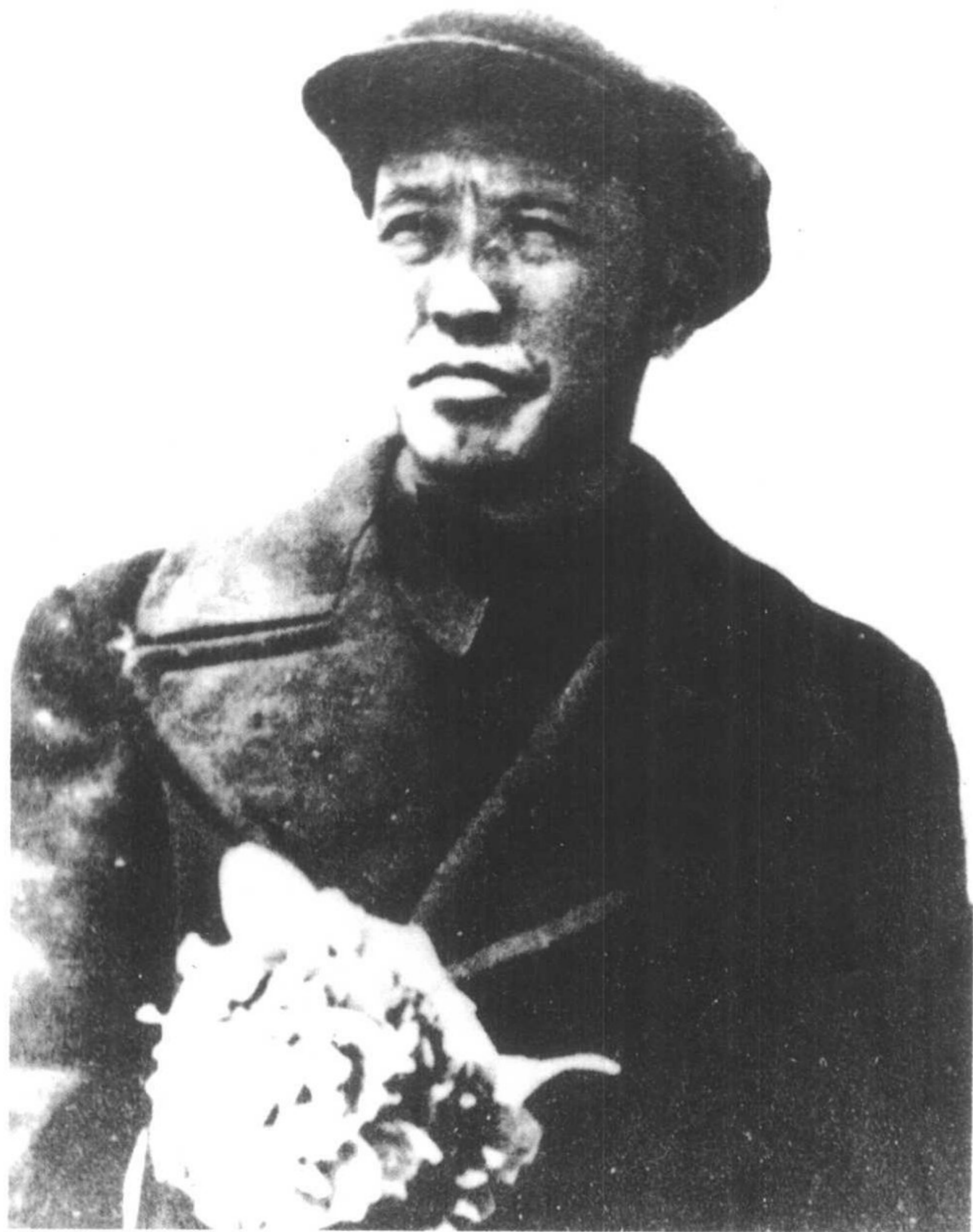
1947年5月1日，內蒙古自治政府在王爷庙（今乌兰浩特市）成立，乌兰夫当选为內蒙古自治政府主席