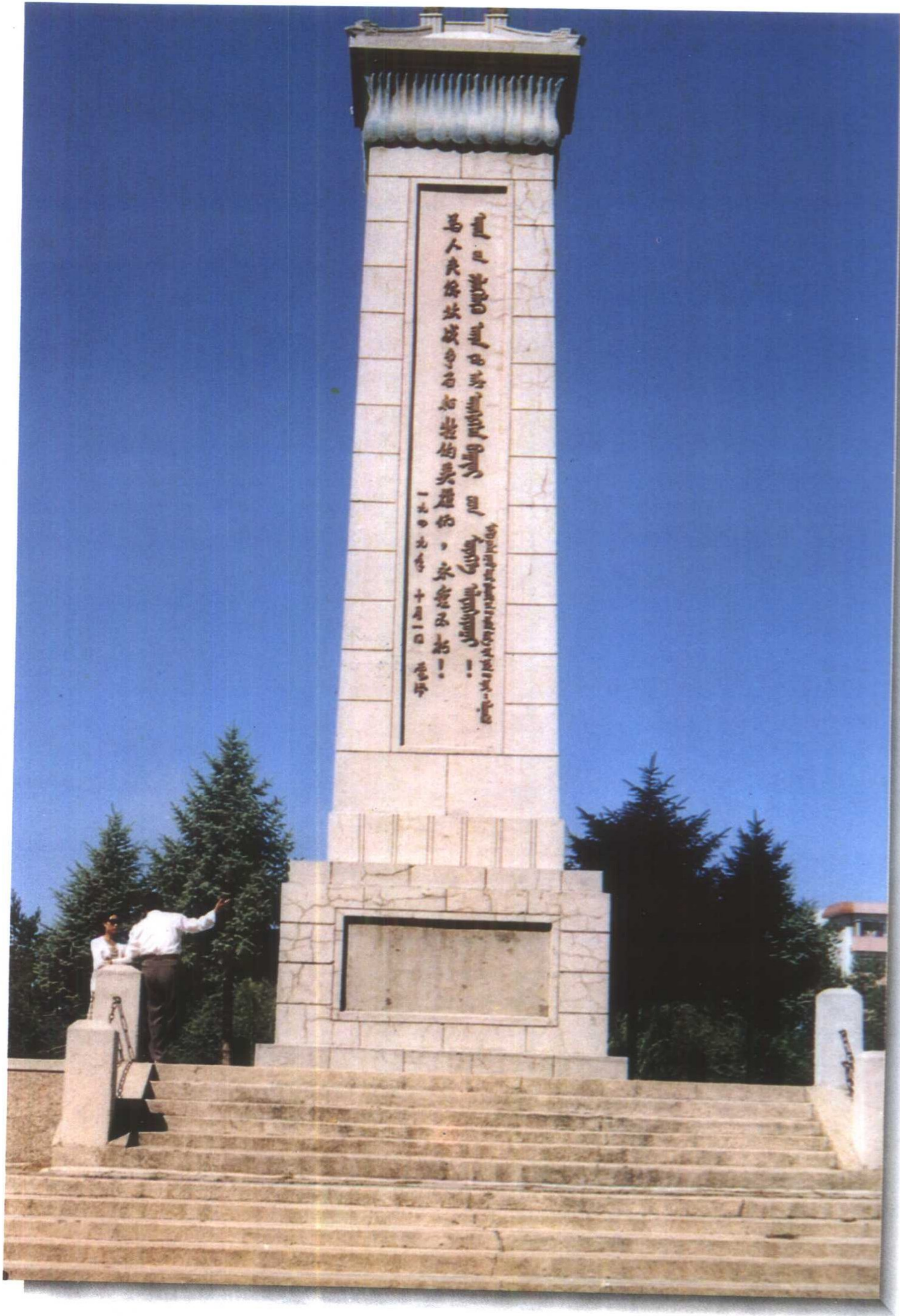
乌兰夫题词：为人民解放战争而牺牲的英雄们，永垂不朽！