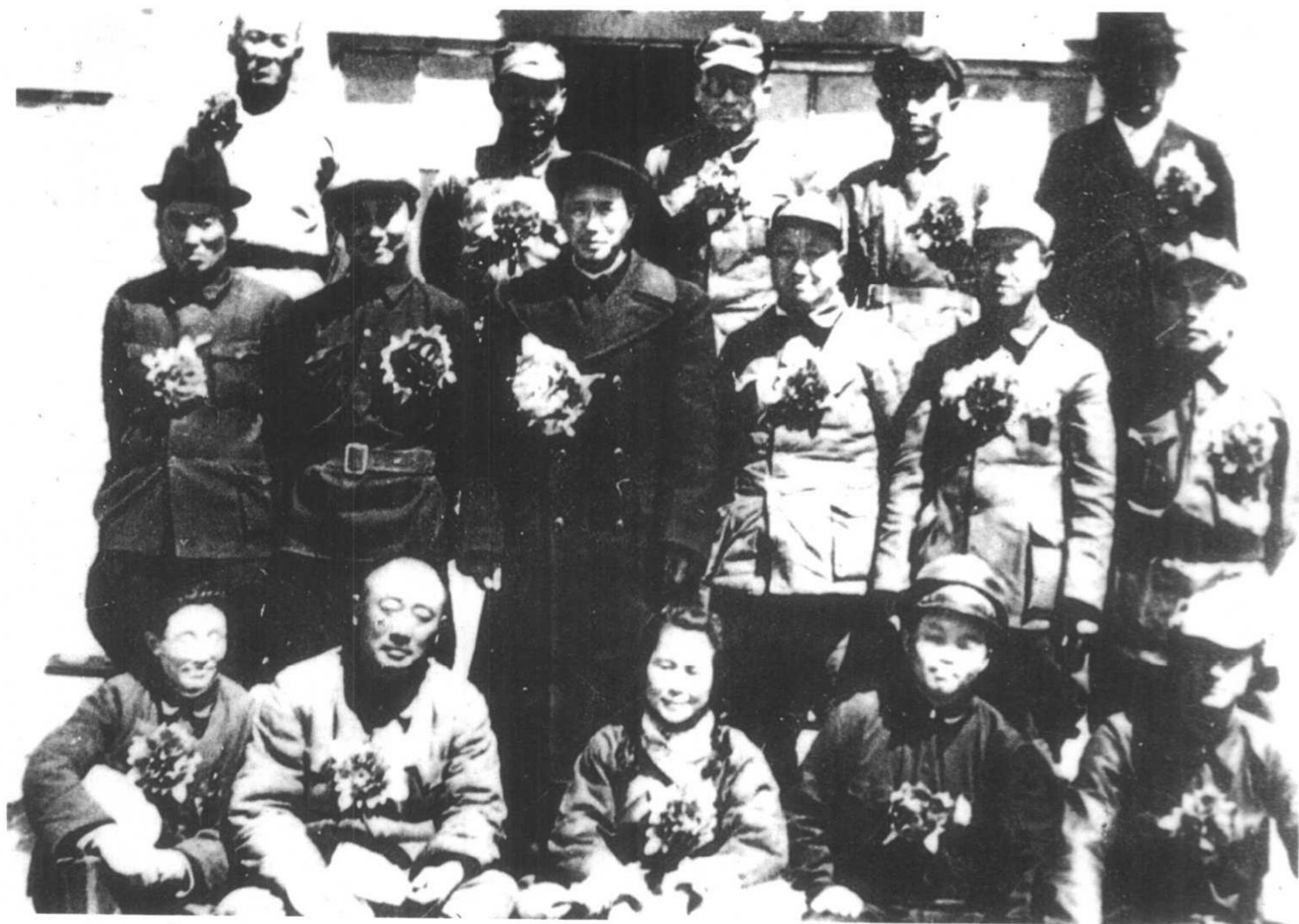
1947年5月1日，內蒙古自治政府成立时委员们合影