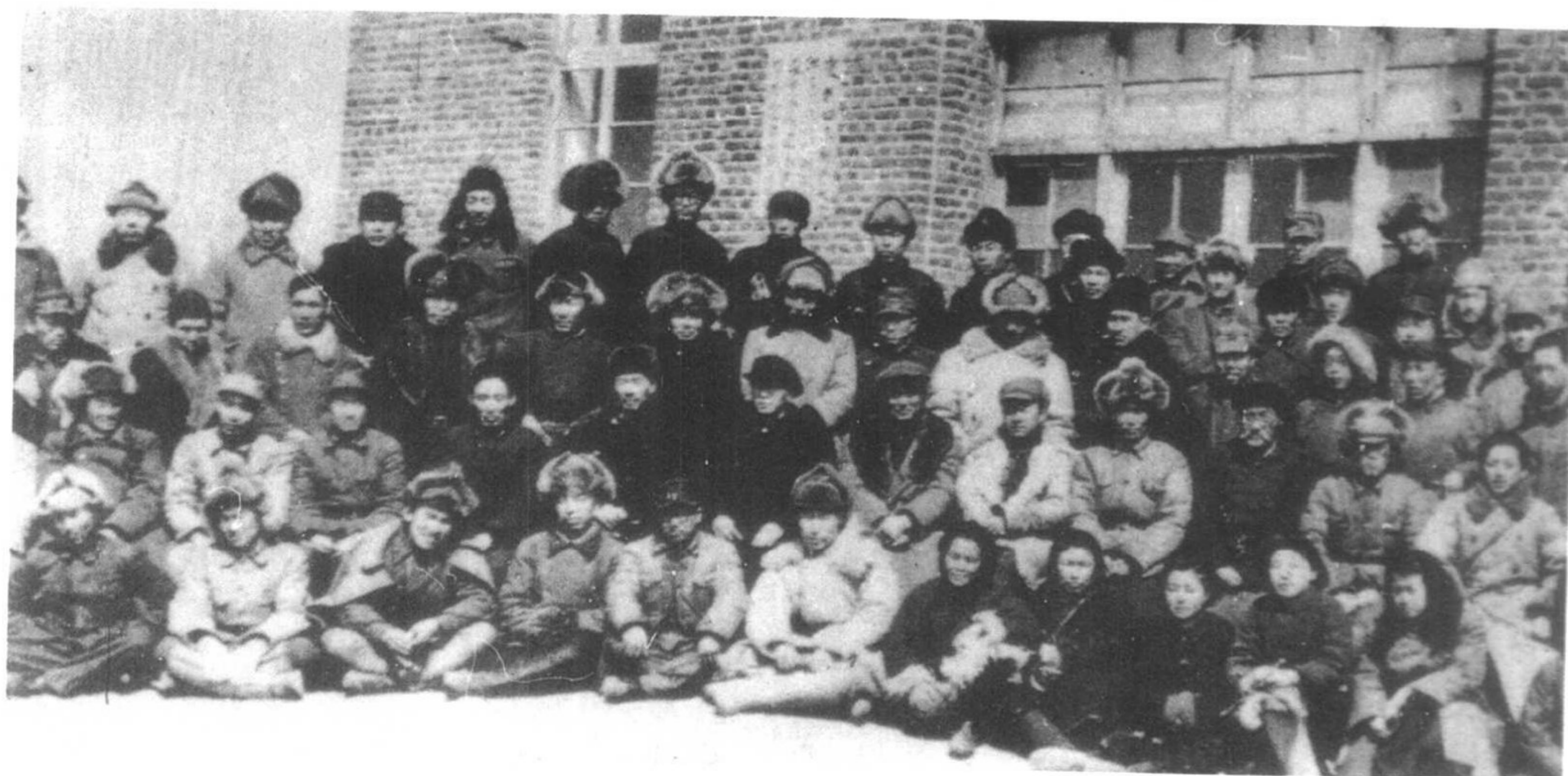
1947年內蒙古人民代表会议代表合影