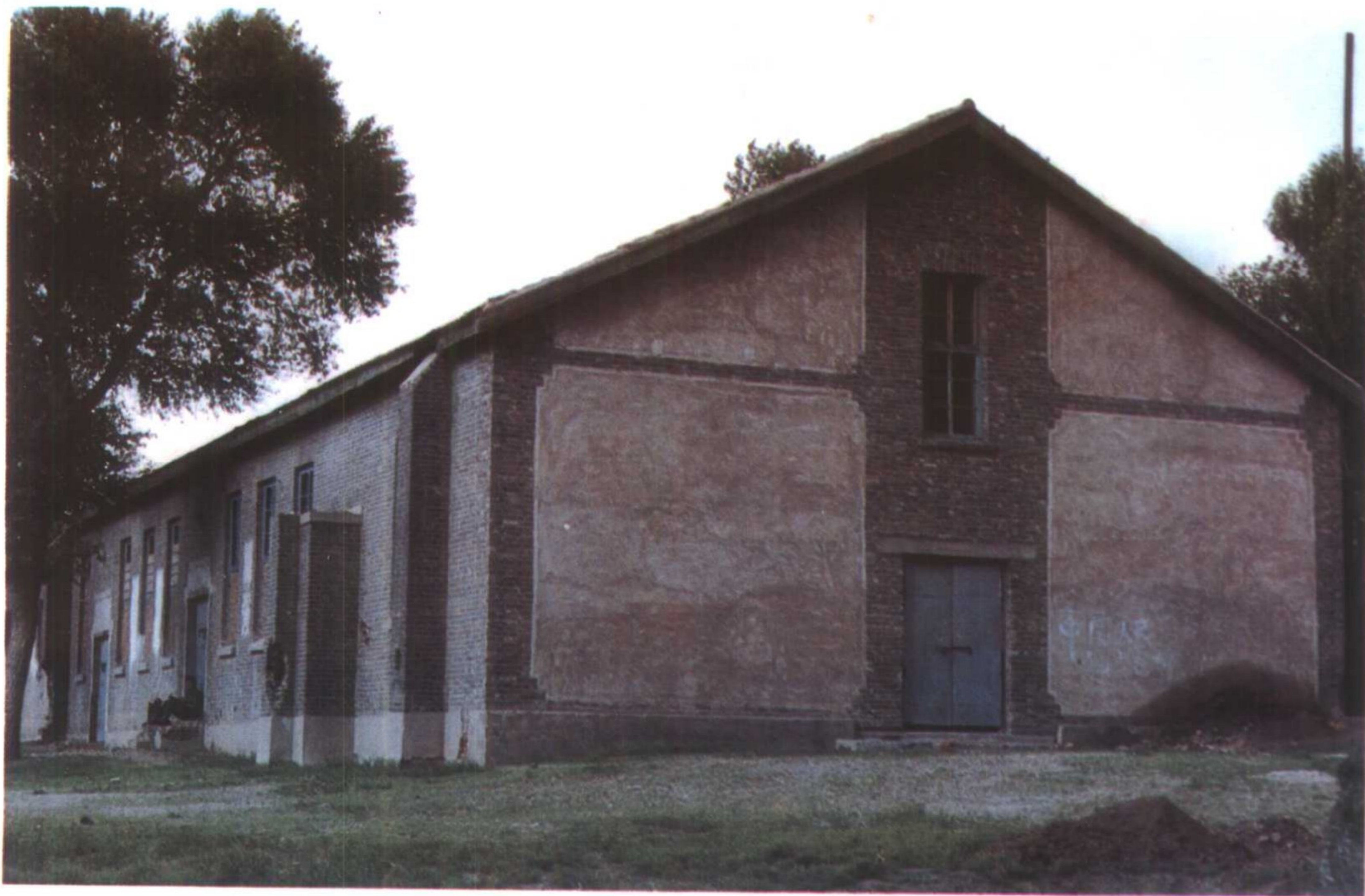
原五一会址 1947年內蒙古人民代表会议在这里召开