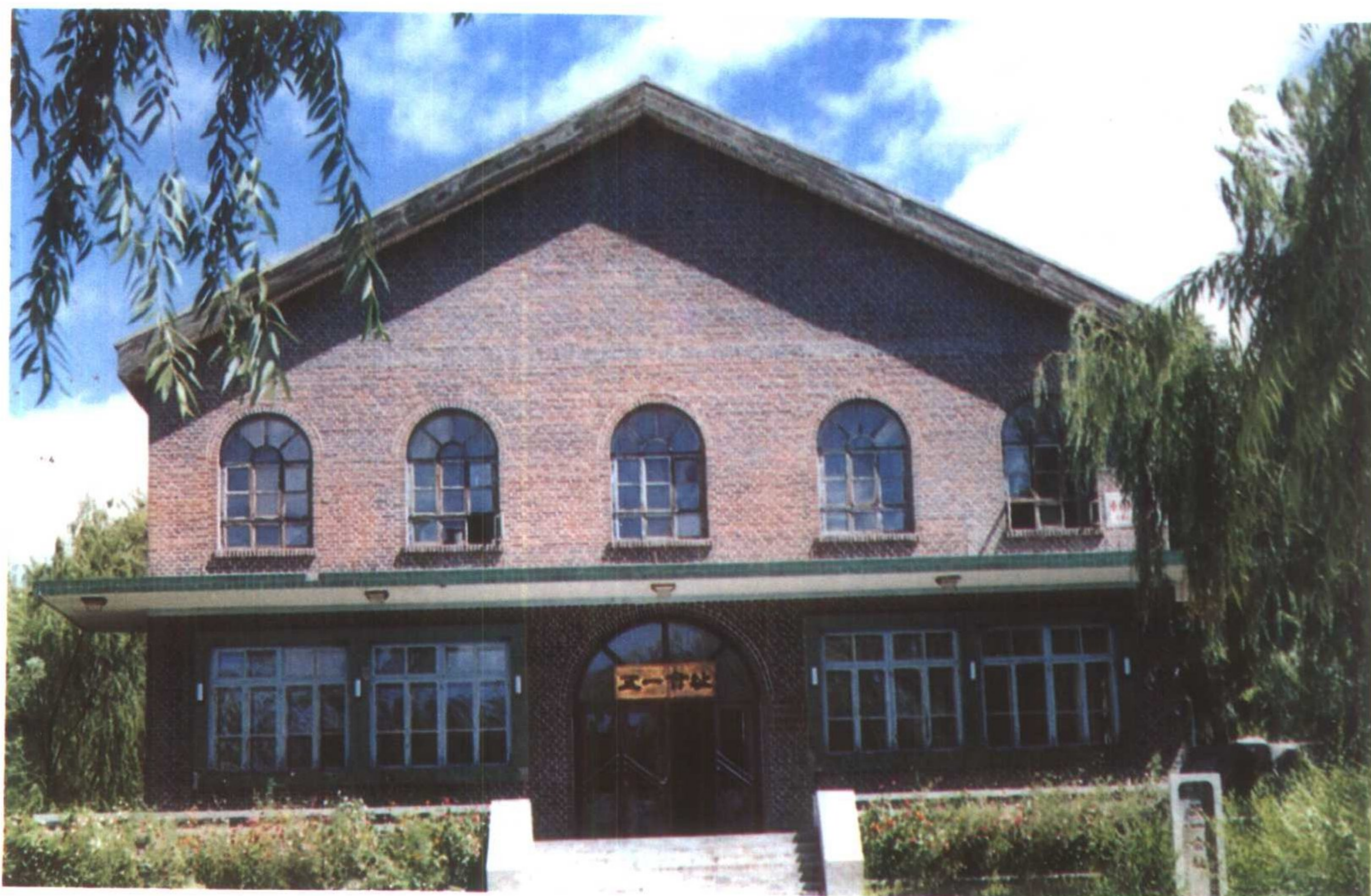
修缮后的五一会址