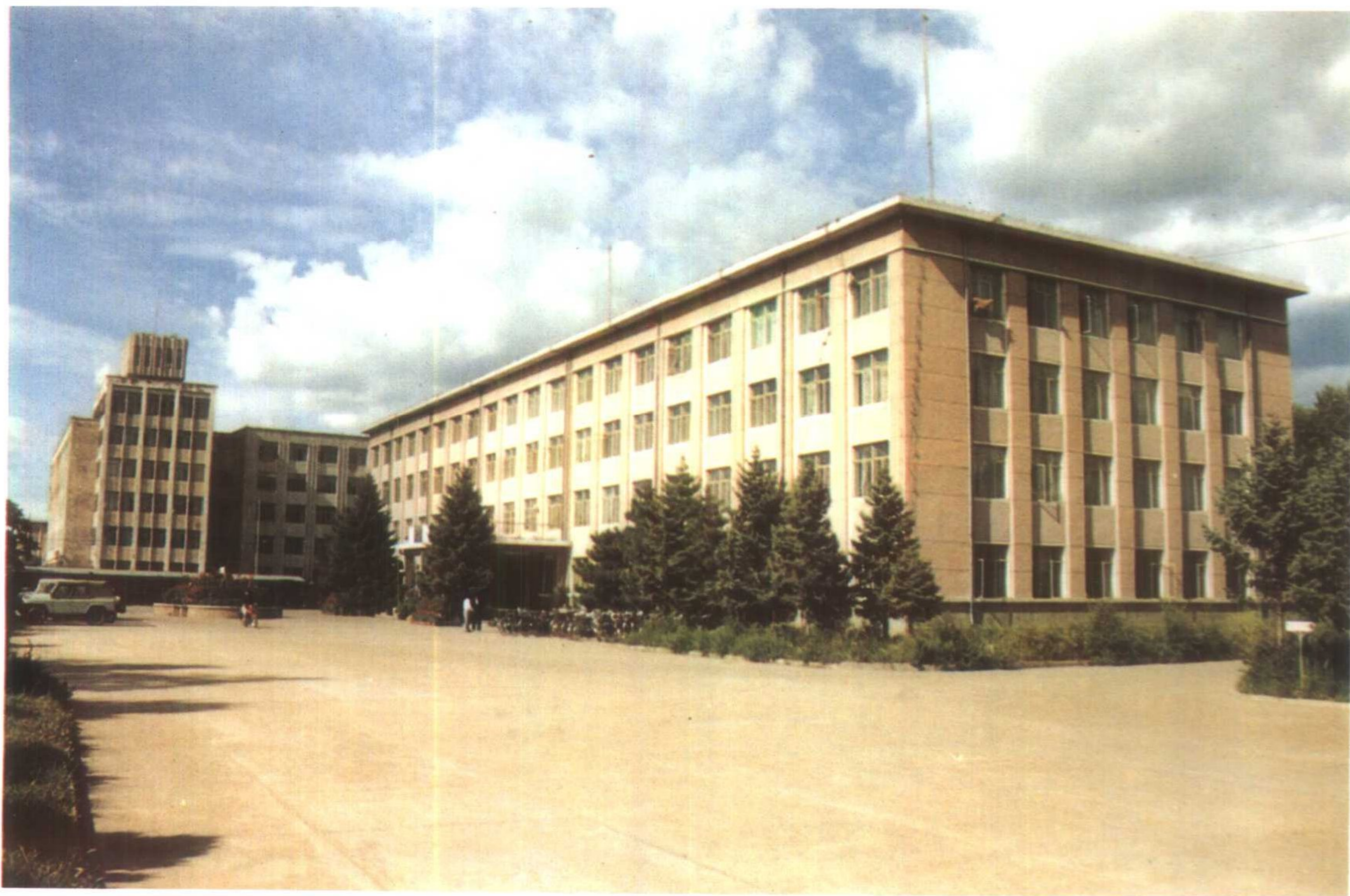
中共兴安盟委办公楼