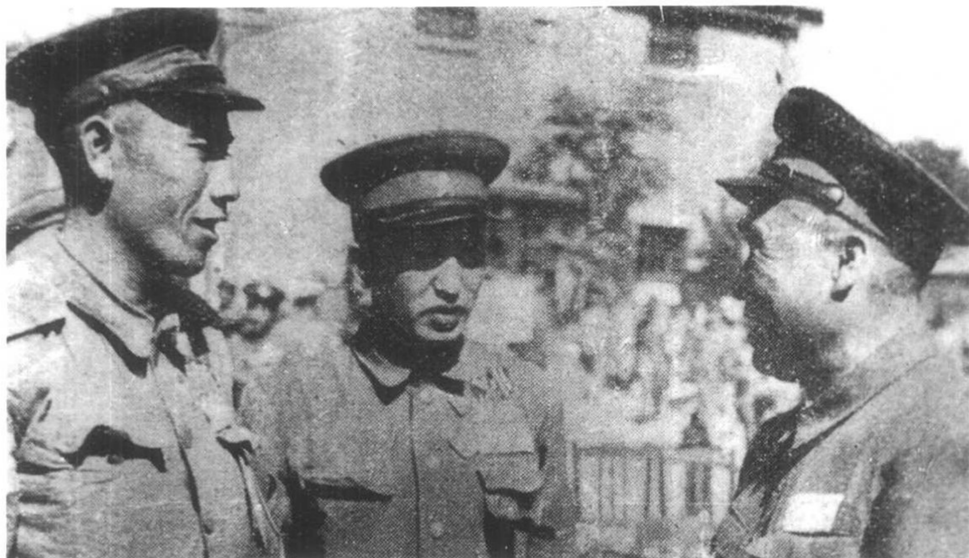
朱德同志视察乌兰浩特