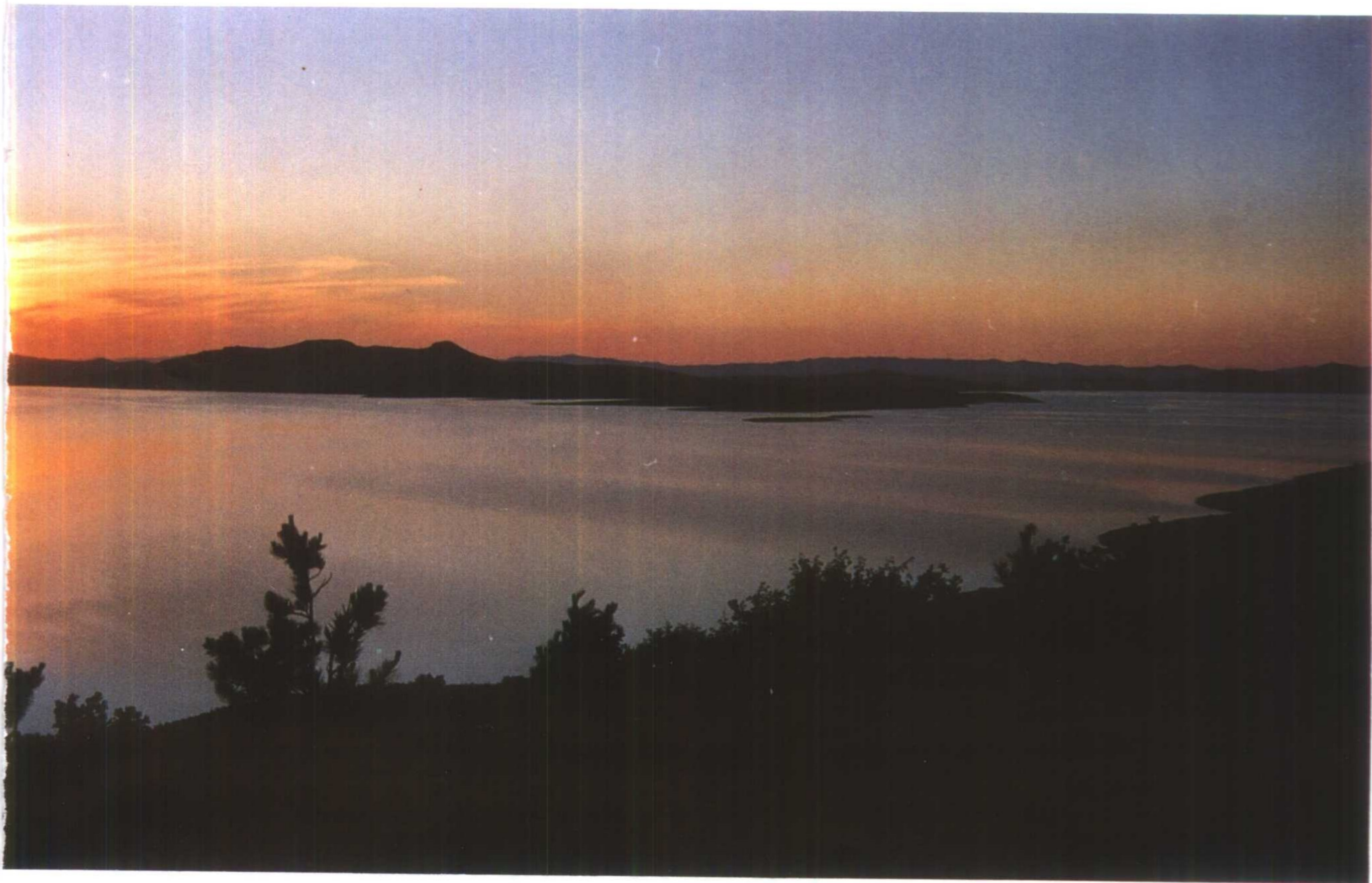
察尔森水库旁的旅游村