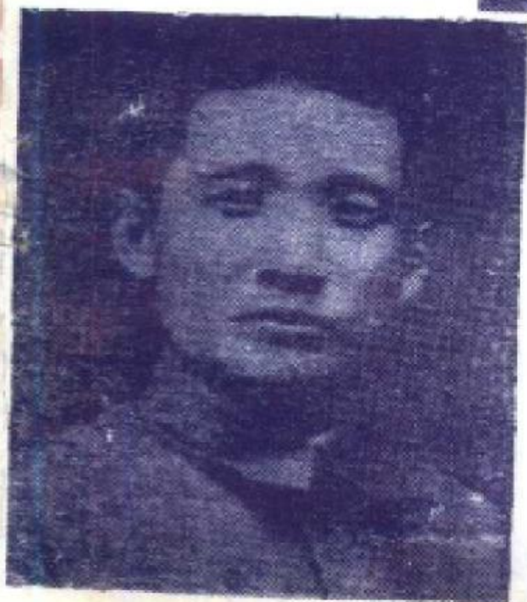
图②张治中在1932年一二八抗日战争时留影。