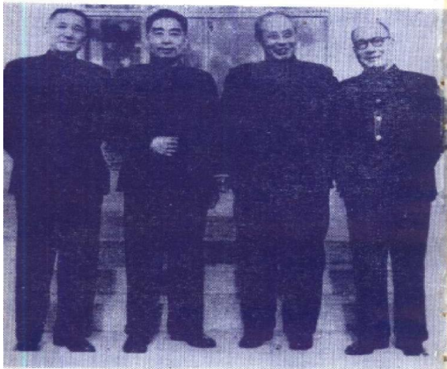
图⑦1962年春节前，周恩来总理同张治中（左一）、 傅作义（右二）屈武（右一）在一起。