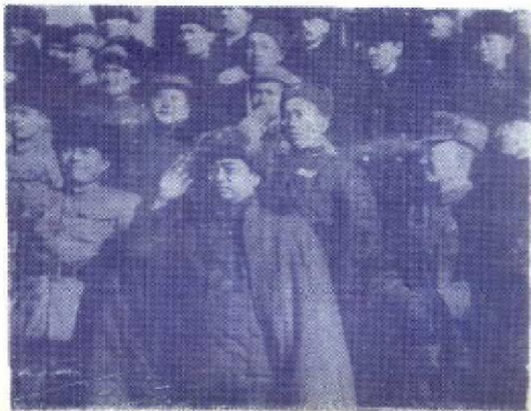
图⑥1949年11月张治中和彭总、王震同志在迪化阅兵台上。