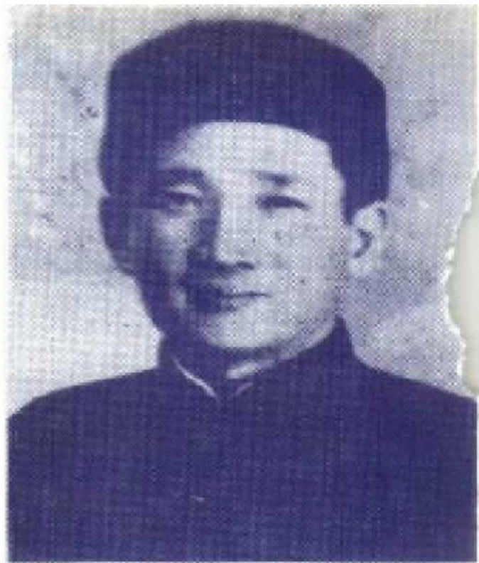
图③张治中在四十年代初期留影。