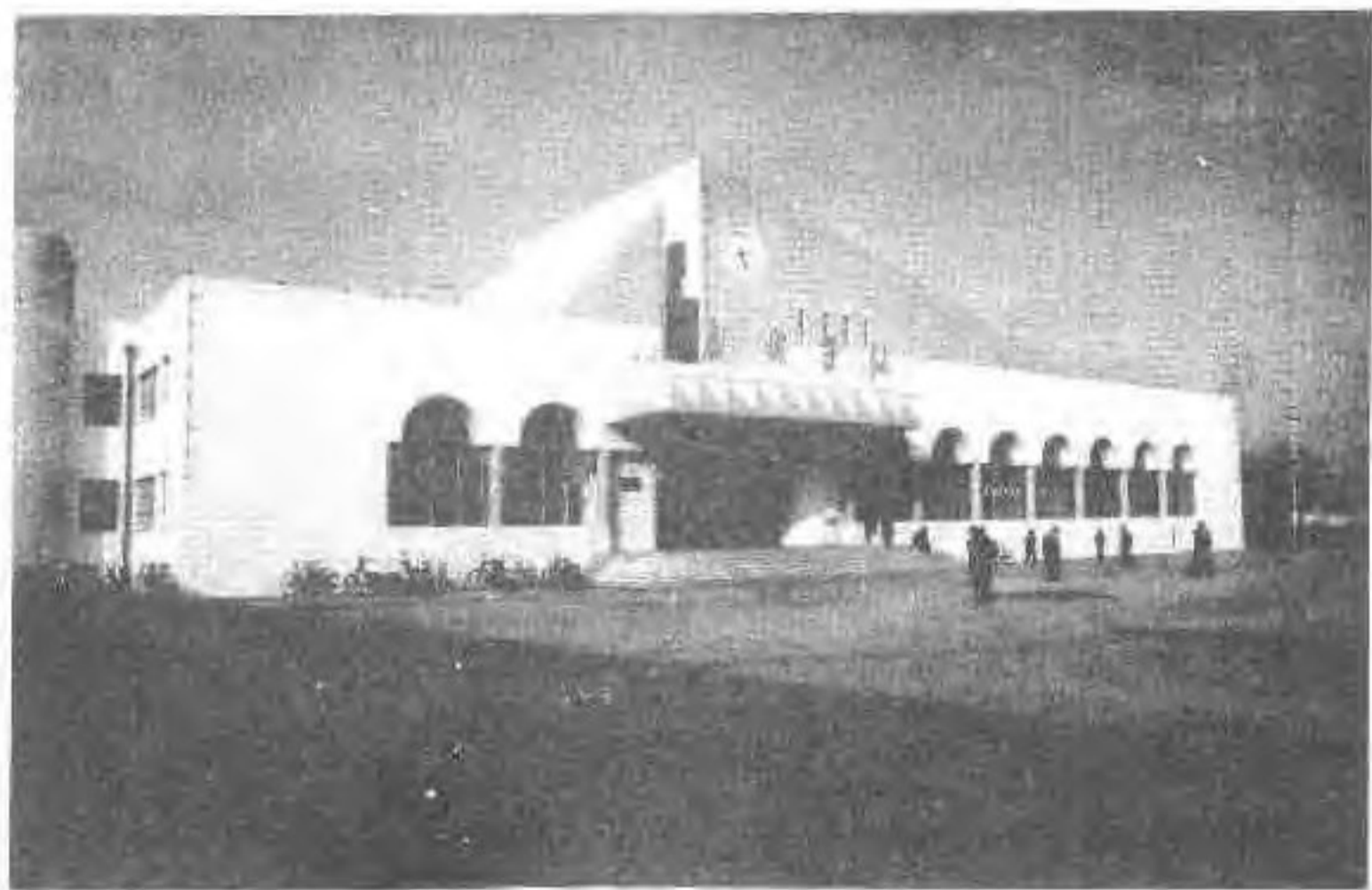
新建的新城子火车站