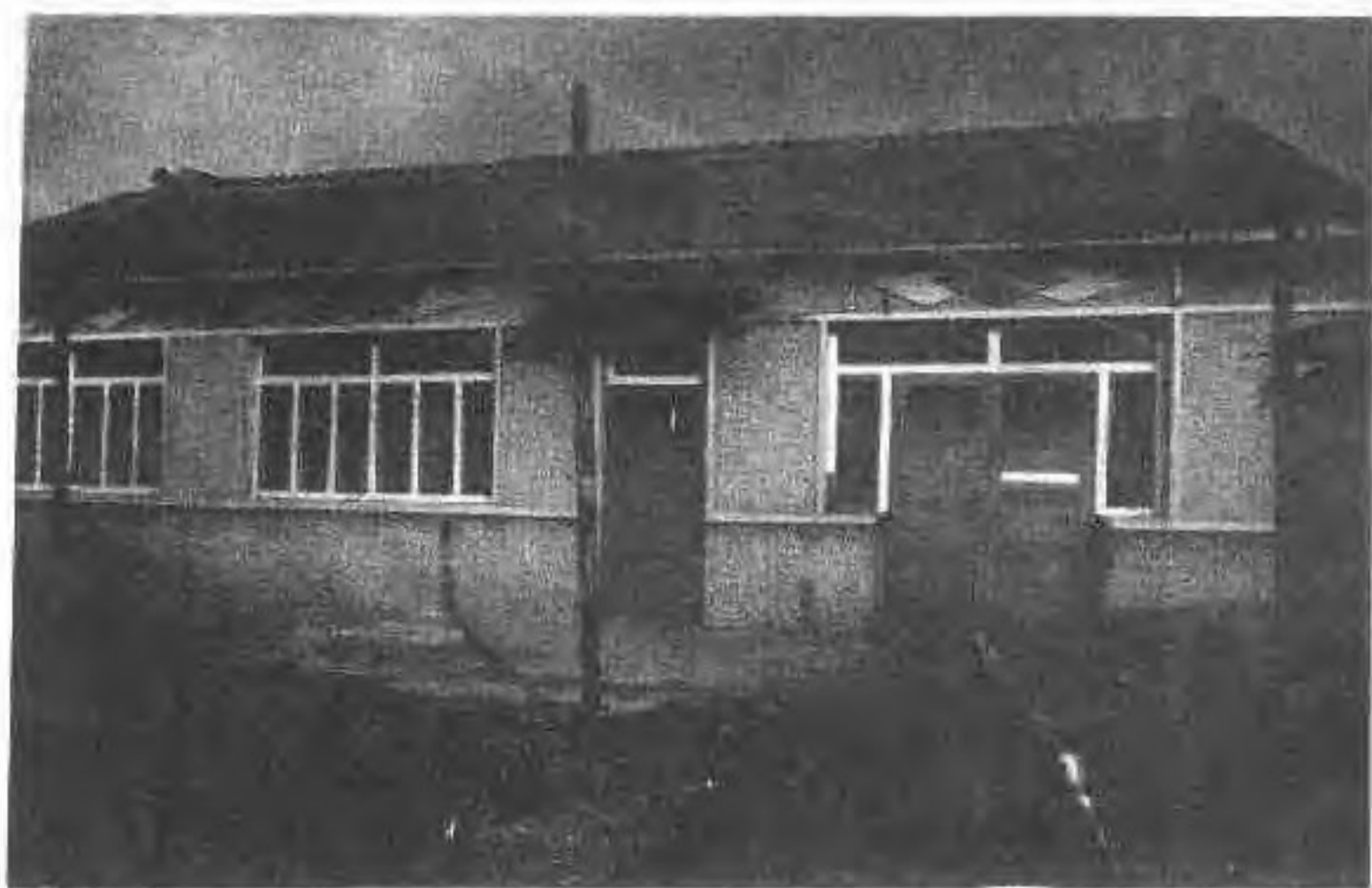
新城子街基督教活动点