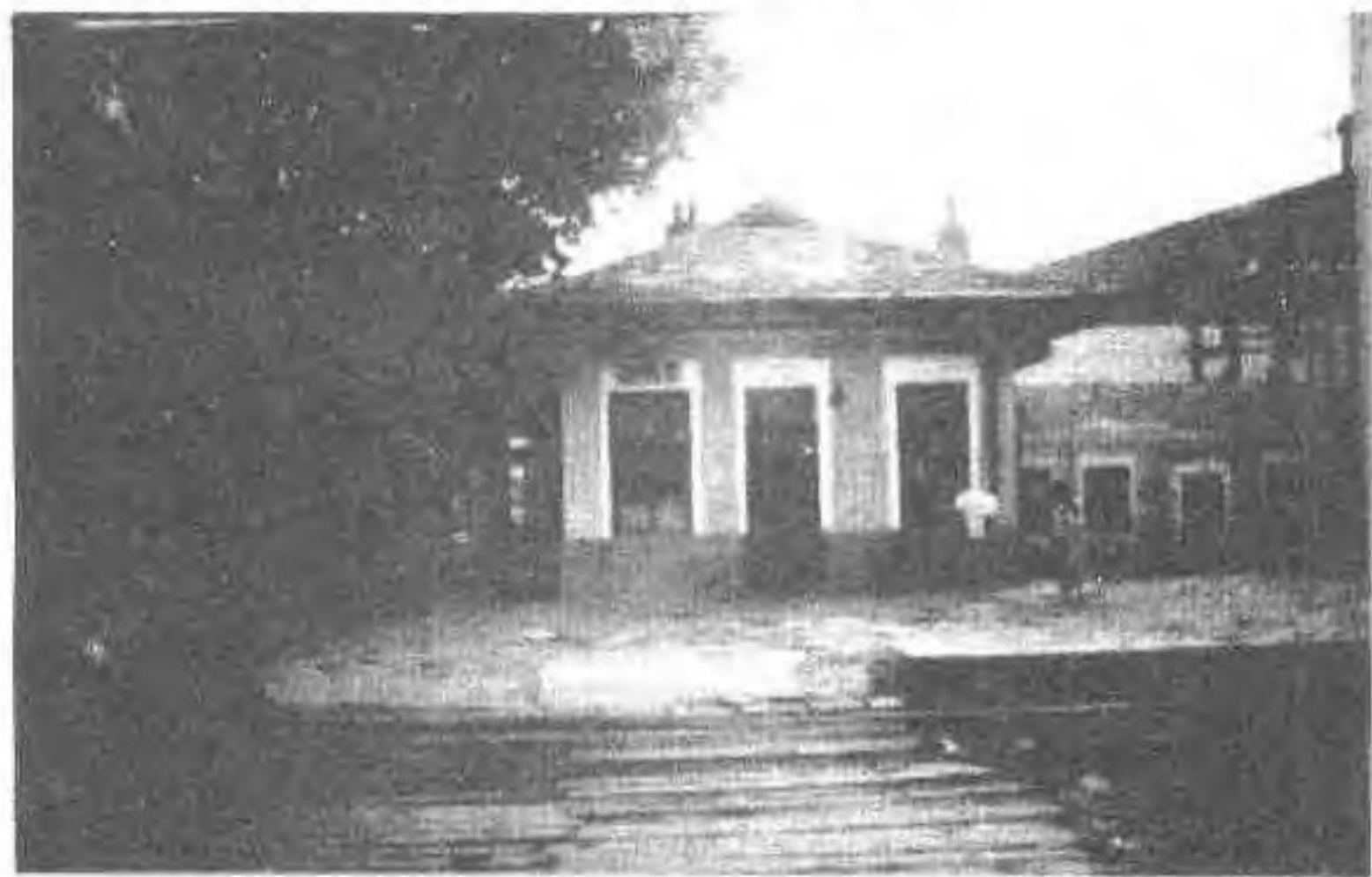
新城子火车站旧貌