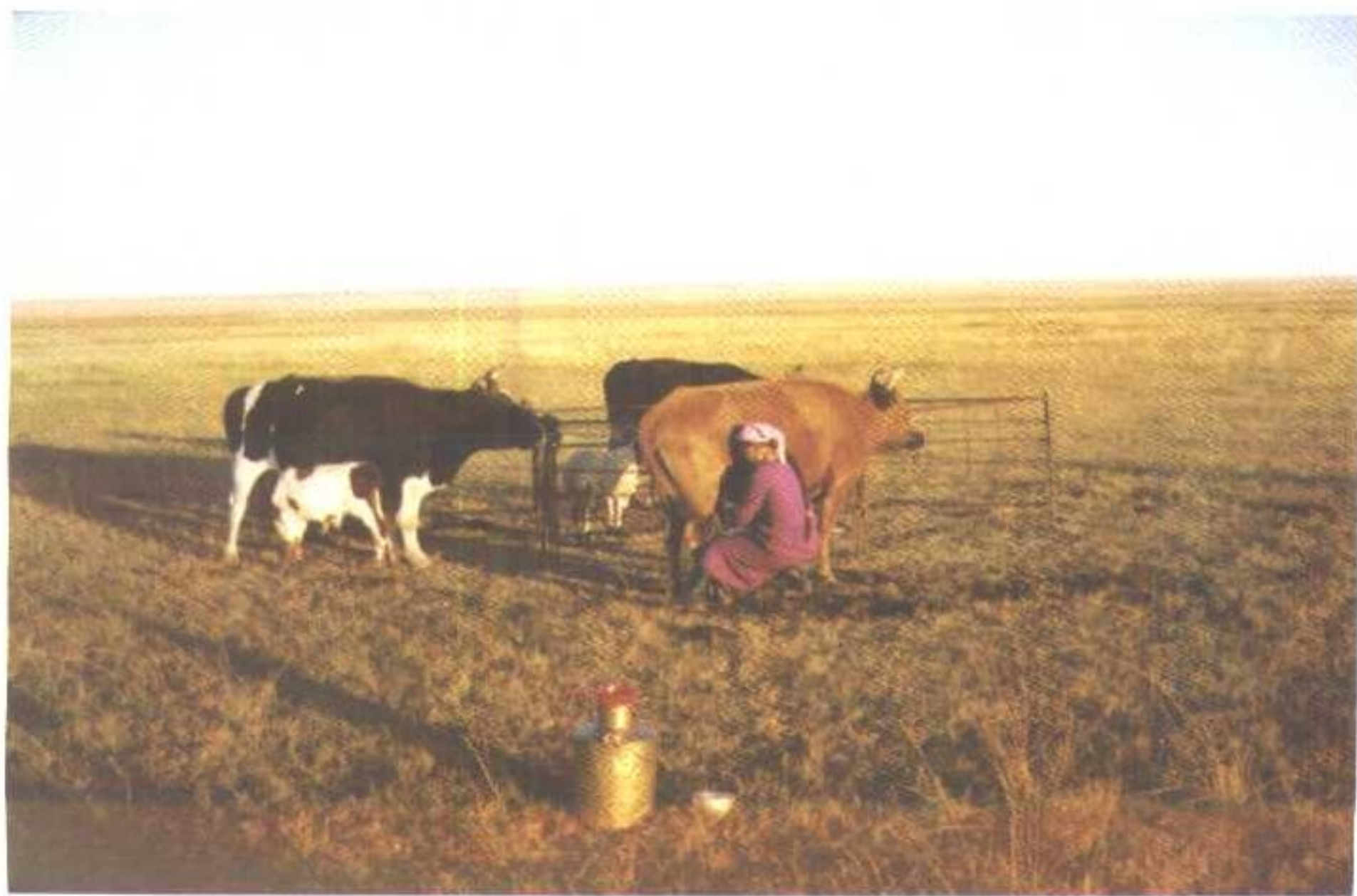
牧民居家生活一景