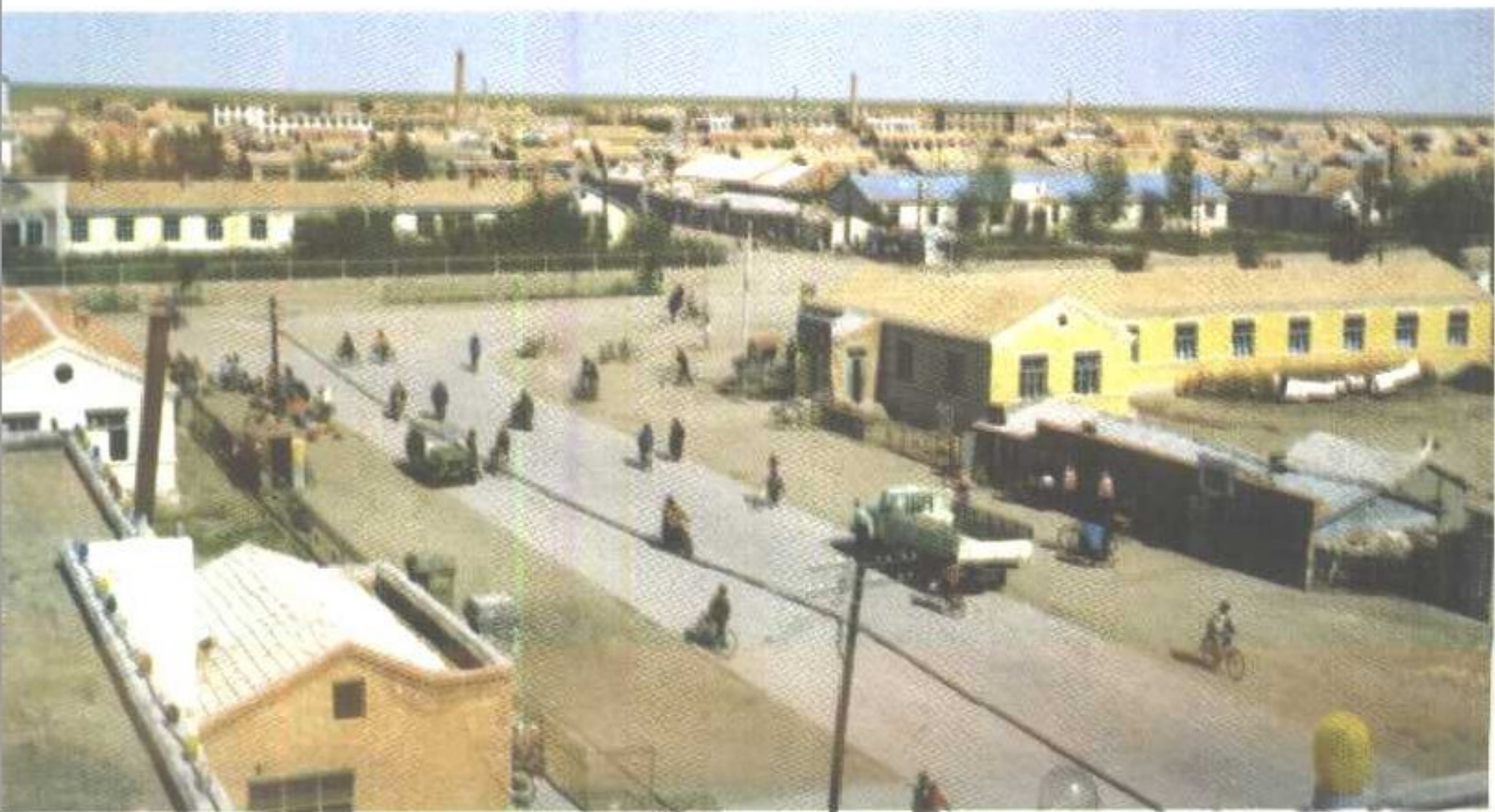
阿拉坦额莫勒镇一角