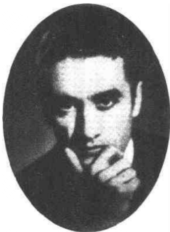
而立之年的切利毕达克