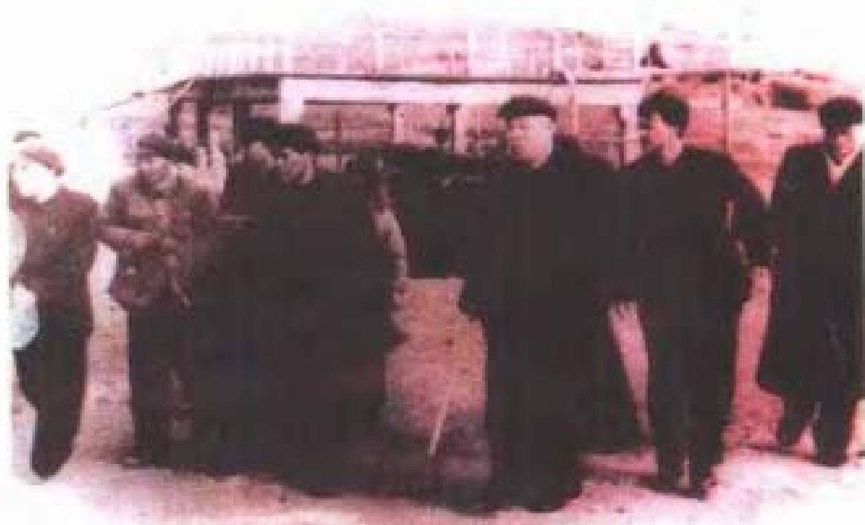
1960年3月6日，董必武在王任重、张体学陪同下 视察徐家河水库大坝施工现场。