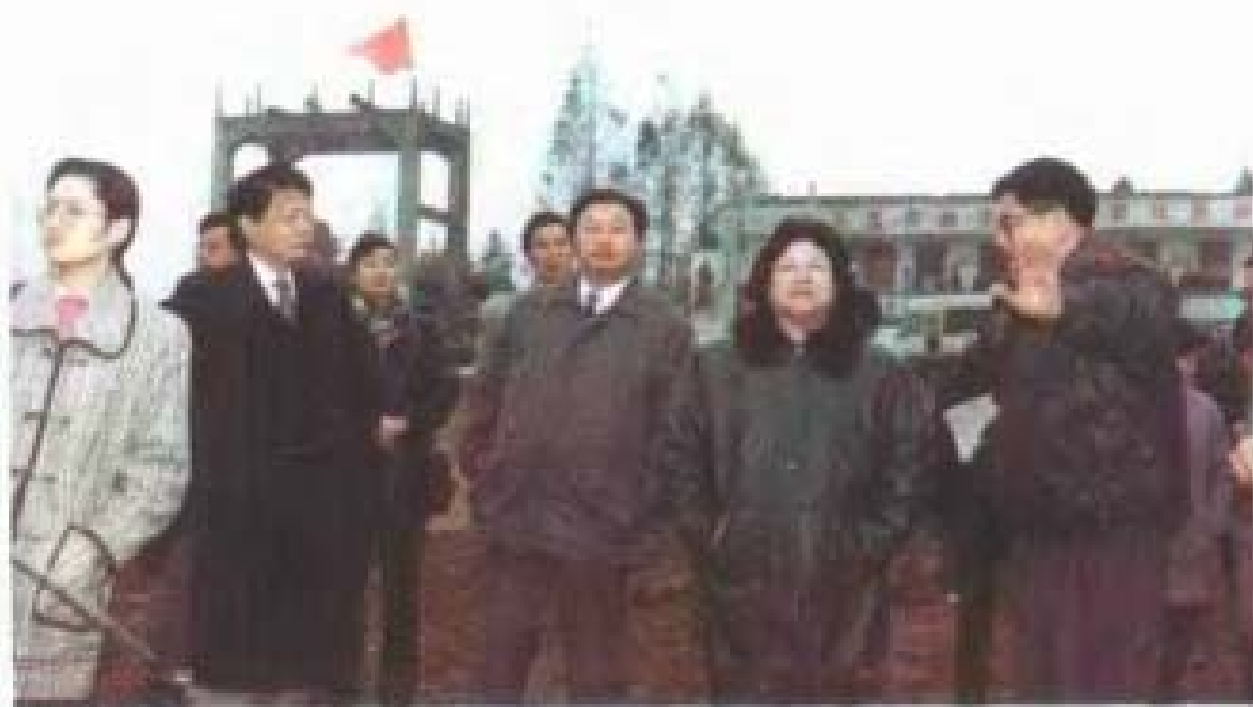
1995年12月，彭佩云视察汉北河。