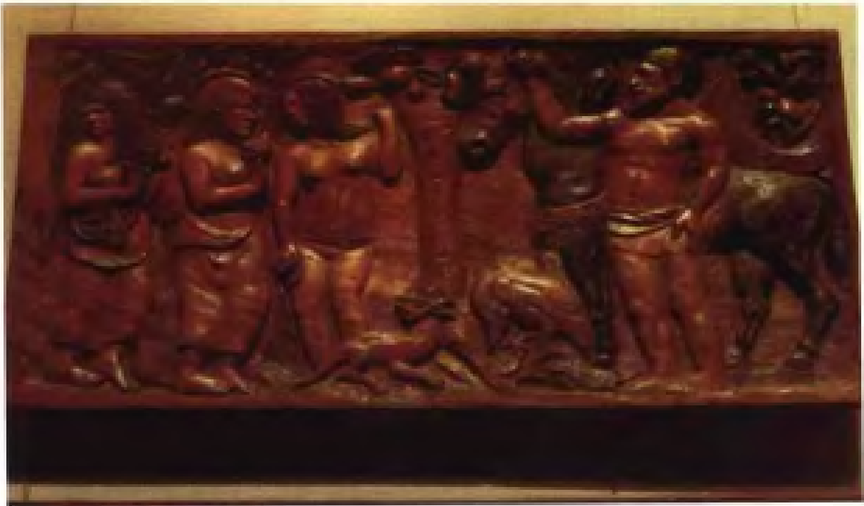
法国印象派大师高更木刻