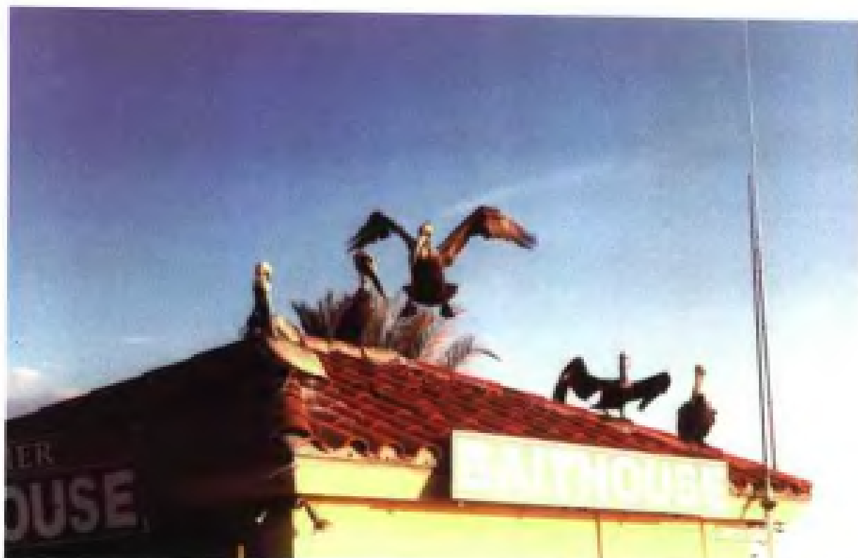
娱乐城人造小岛路边店屋顶落莉娜