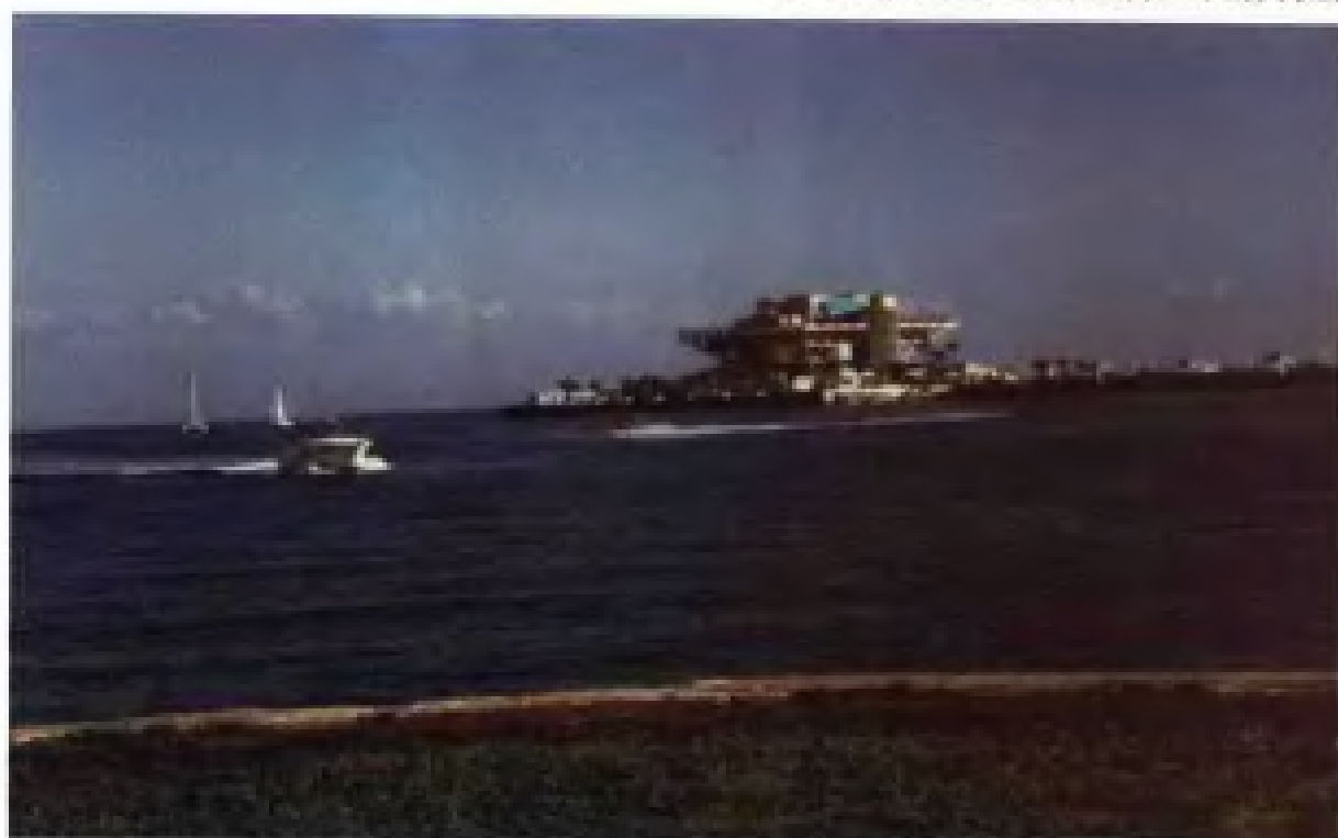
圣彼得斯堡海上的异形建筑——观景娱乐城