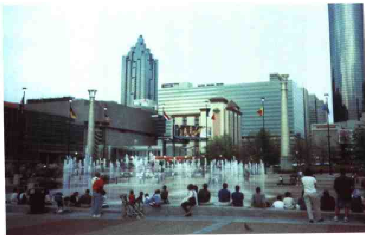
亚特兰大奥运公园的音乐喷泉