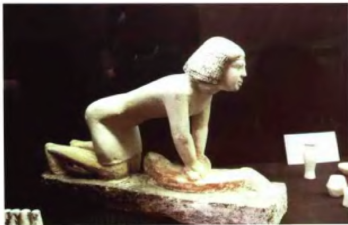
10 世纪古埃及石雕“国王之子”等