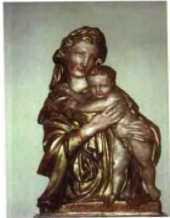
欧洲 15 世纪圣母子塑像