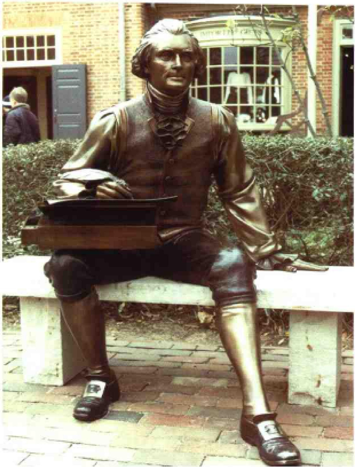
威廉斯堡路边的杰斐逊铜像，仿佛正在沉思如何起草《独立宣言》