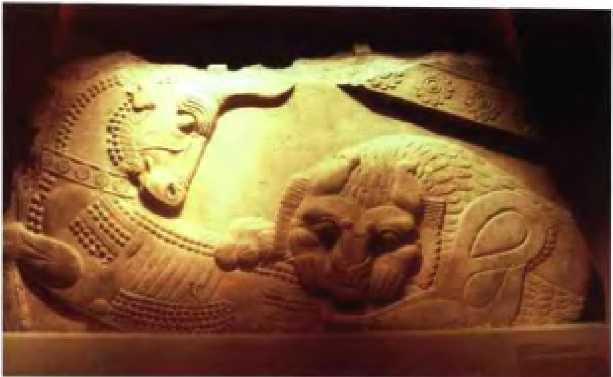
公元前 358 ~ 338 年古伊朗公牛与狮子搏斗浮雕