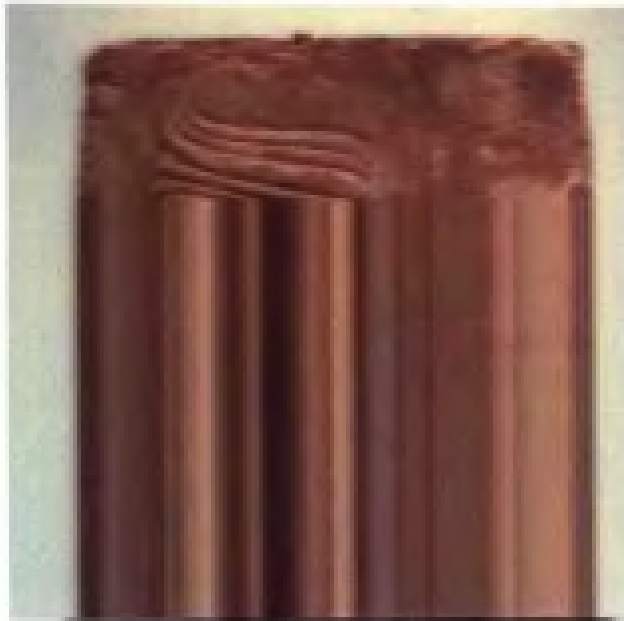
公元前 883~859 年西亚亚述国王石板浮雕头像