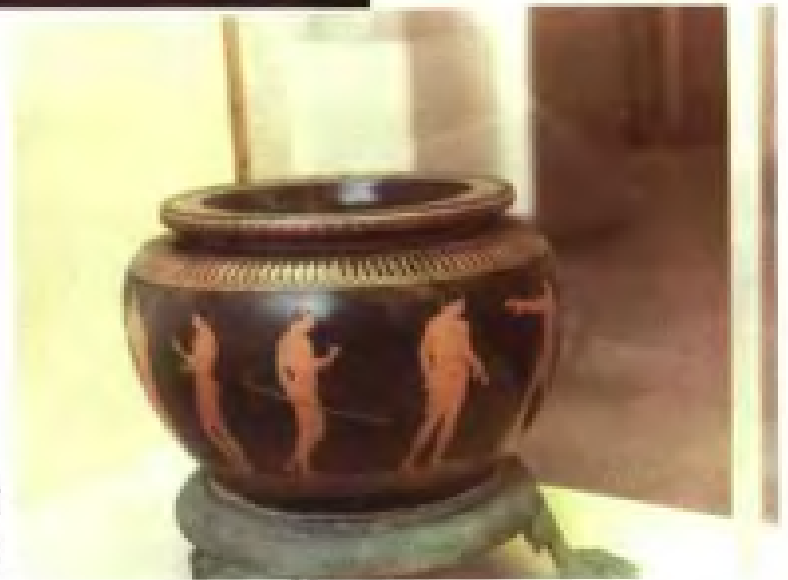
古希腊彩陶人物罐 ——培训“奥运”运动员