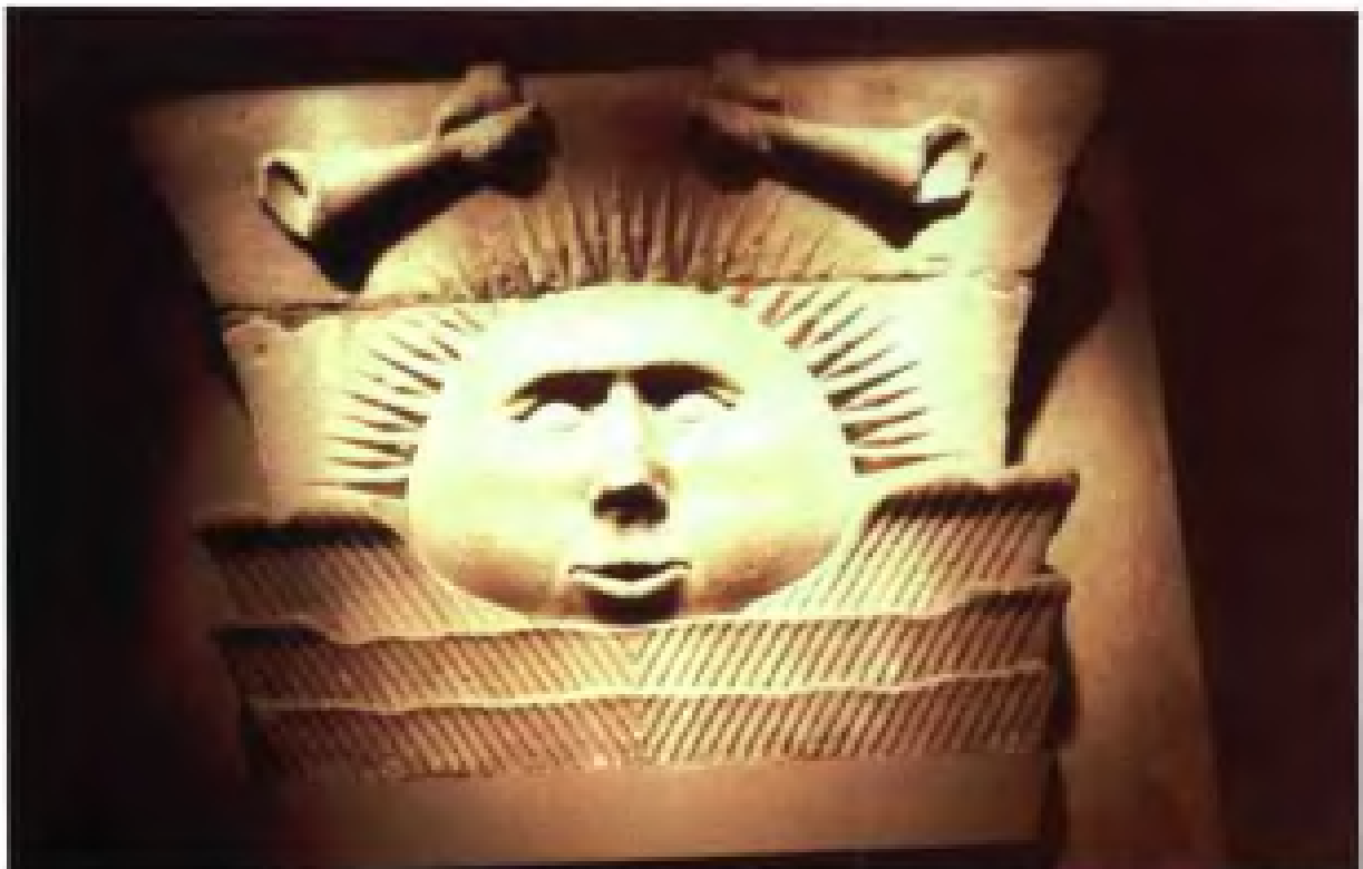
古代美洲石雕太阳神