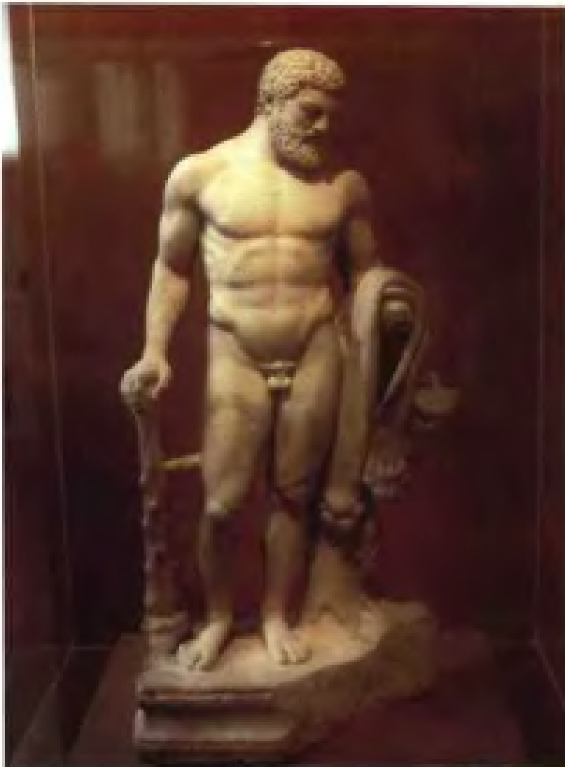
公元前5—3世纪神话人物造像 “俄刻留斯”