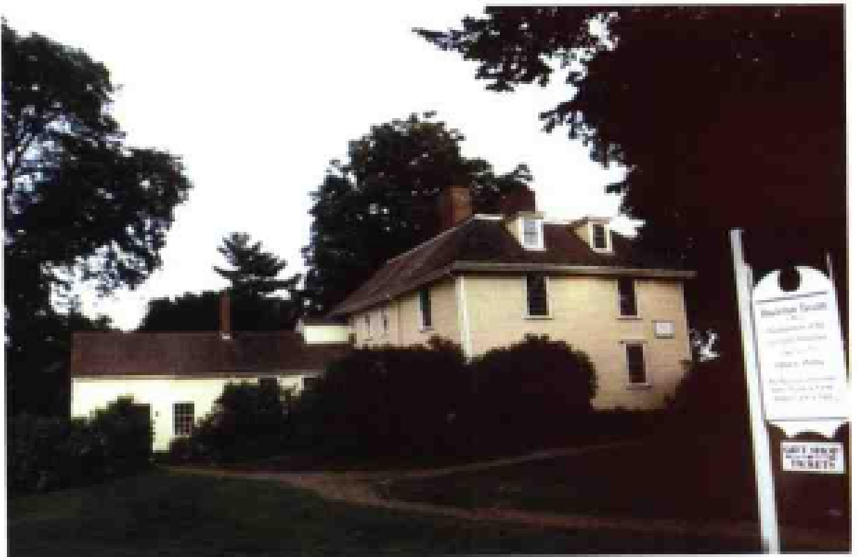
波士顿列克星顿镇独立战争爆发地民兵司令部