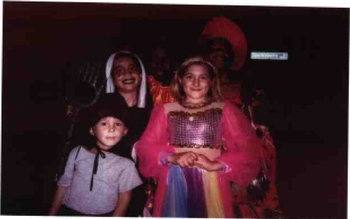
万圣节逐户叩门的社区“小鬼”