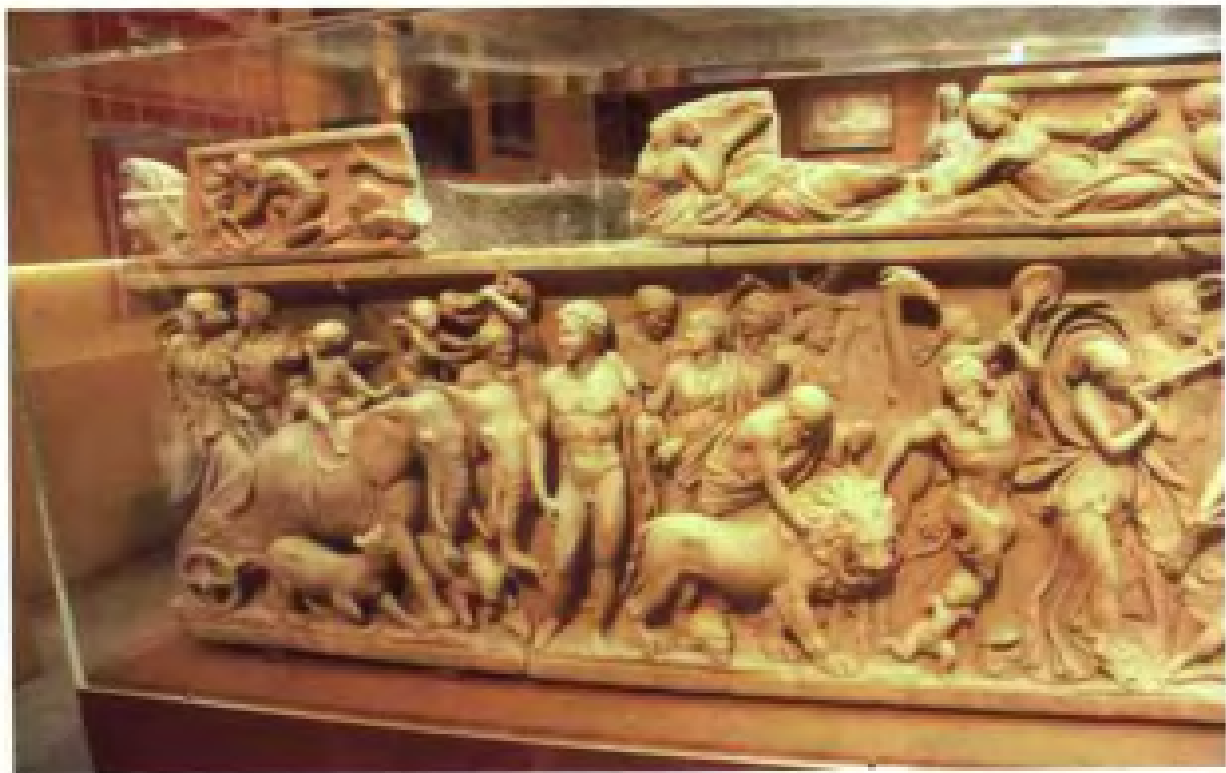
公元 3~2 世纪罗马帝国浮雕“希腊人玩狮子与大象”