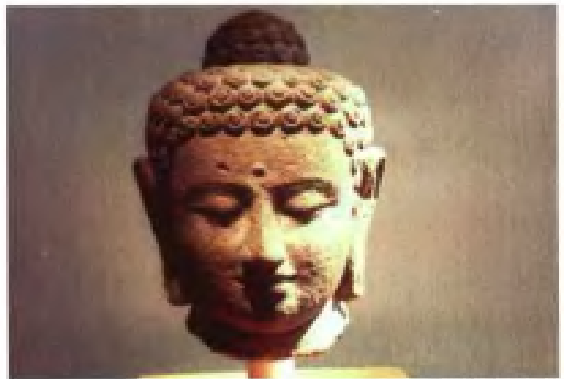
印度石雕佛像头部