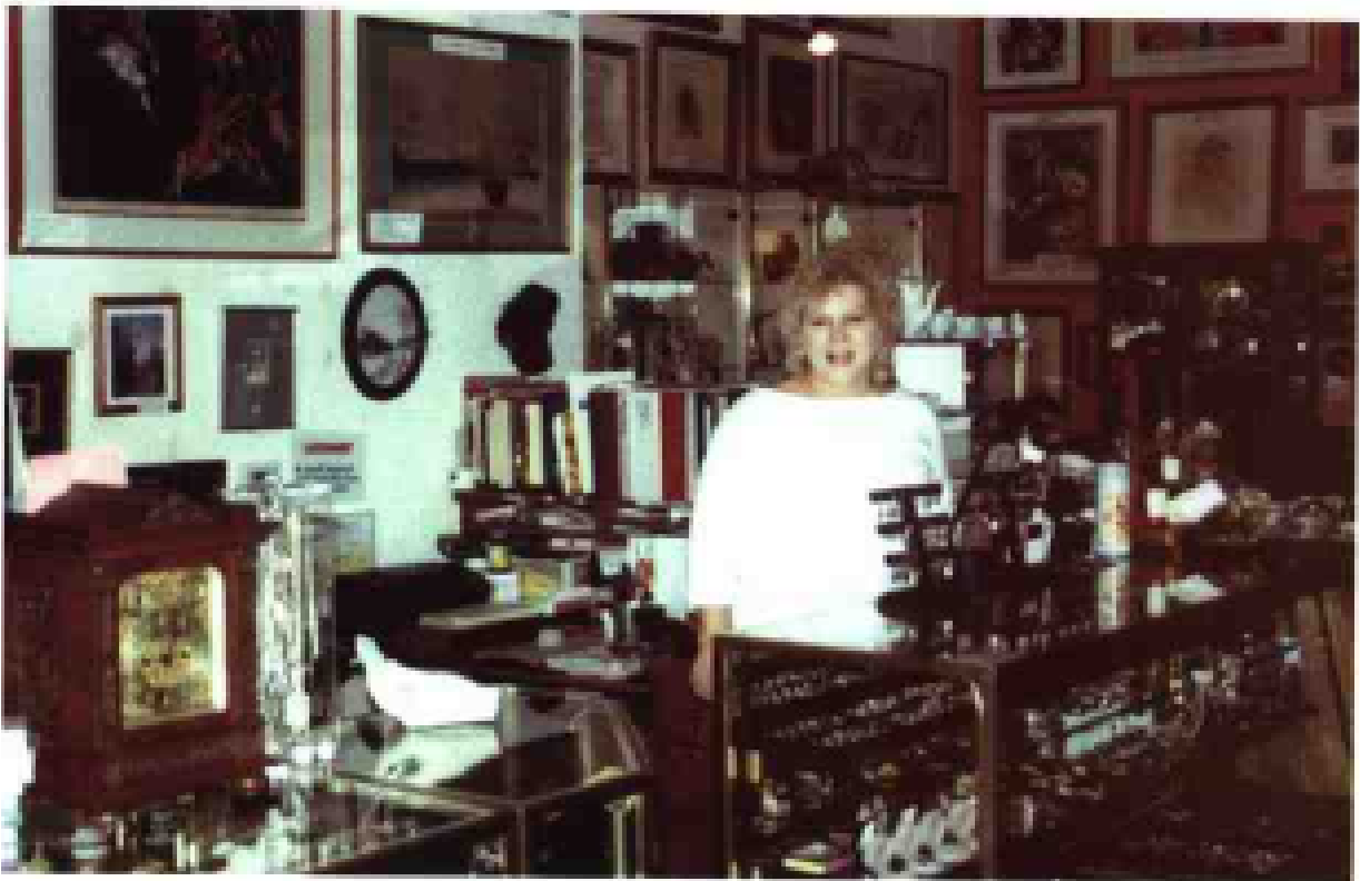
佛罗里达州清水区海绵港古董店的女老板