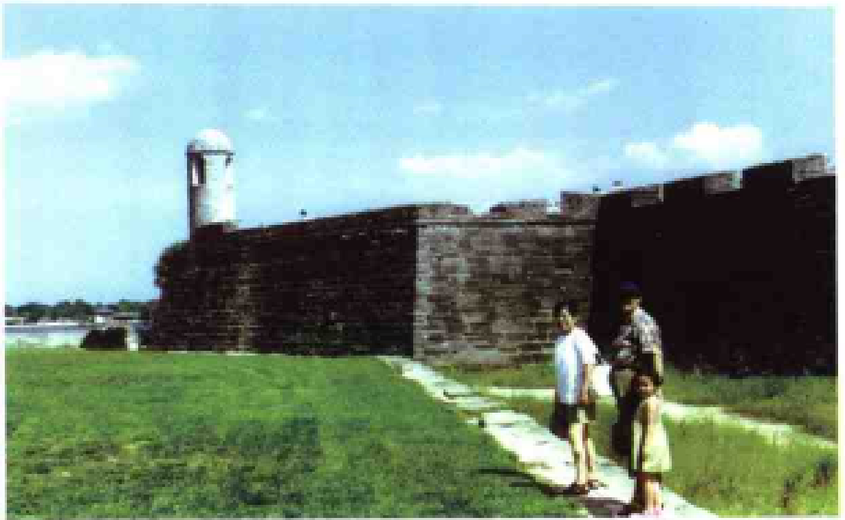
圣奥古斯丁的西班牙军事要塞