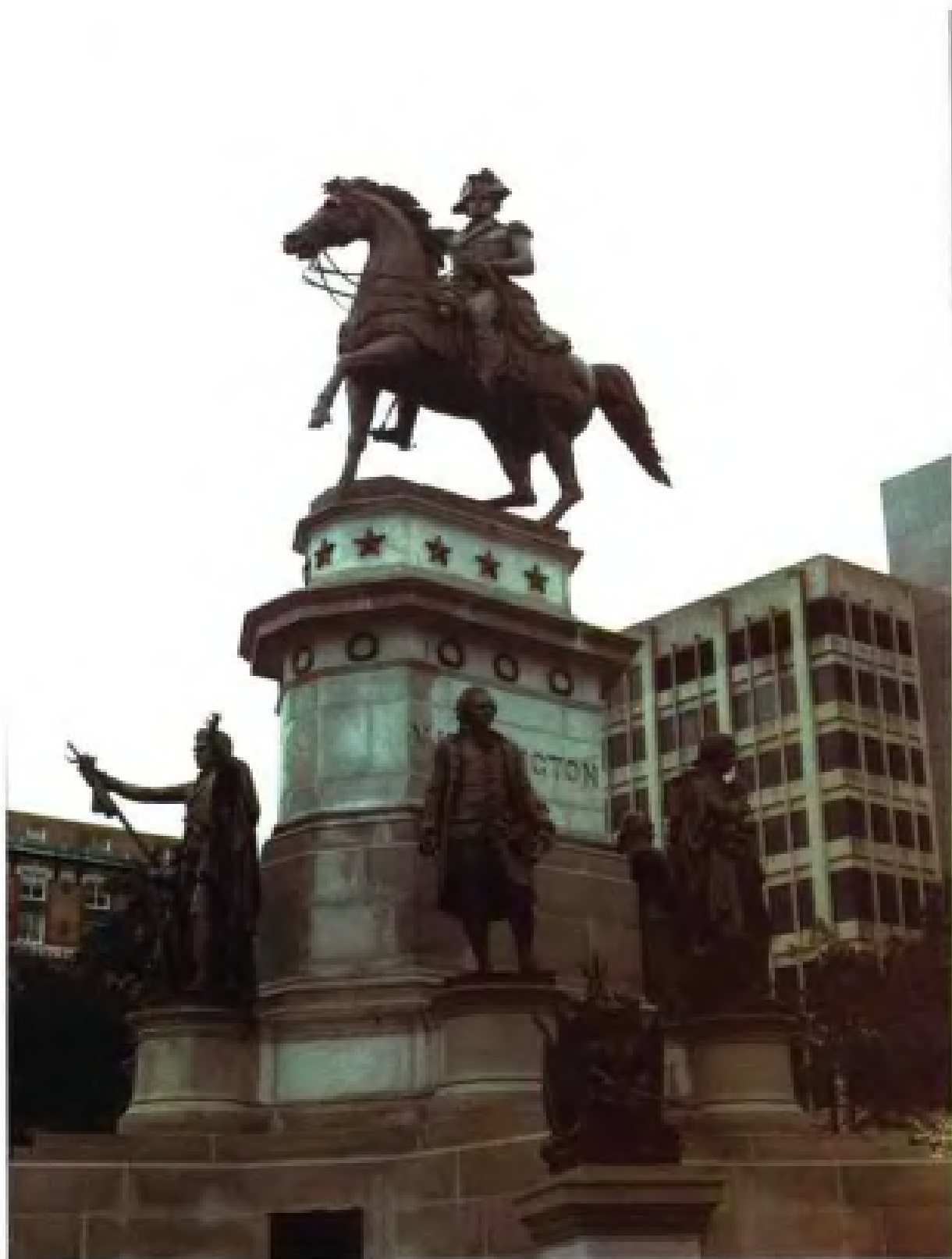
里士满美国独立建国纪念碑