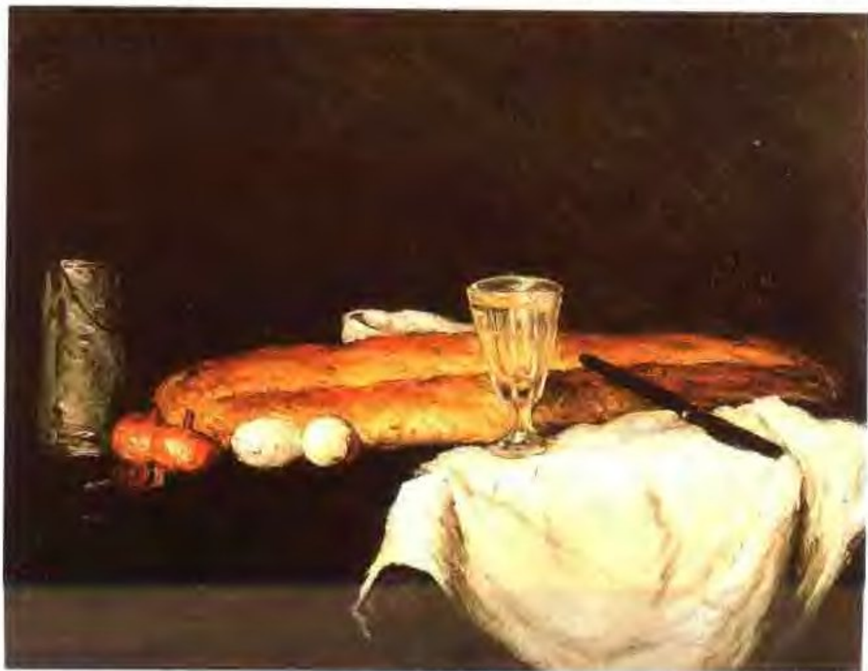
面包和蛋 1865年 油画 画布 59.1×76.3cm 美国俄亥俄州辛辛那提美术馆藏