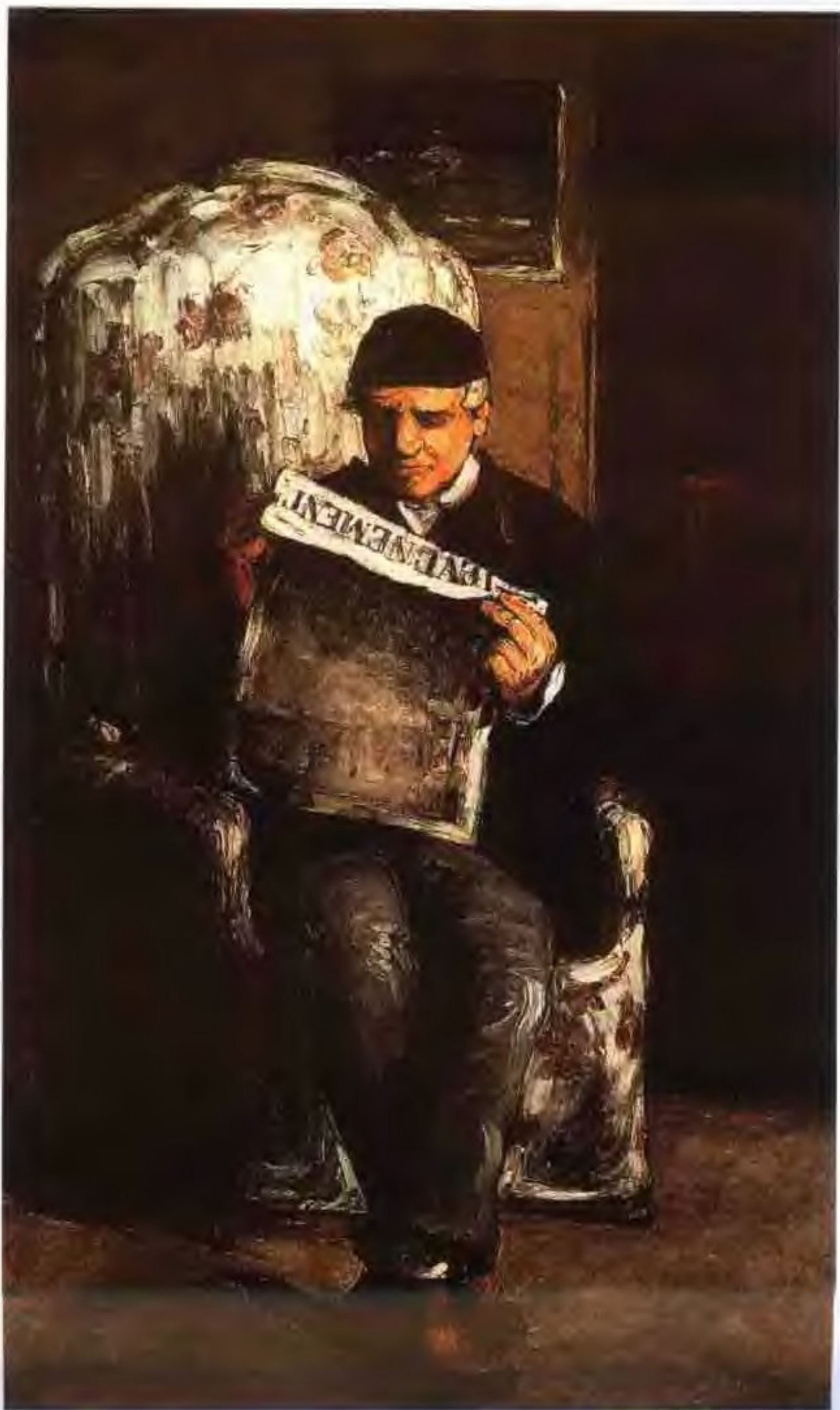
画家的父亲 1866年 油画 画布 198 × 119cm 美国华府 国家画廊藏