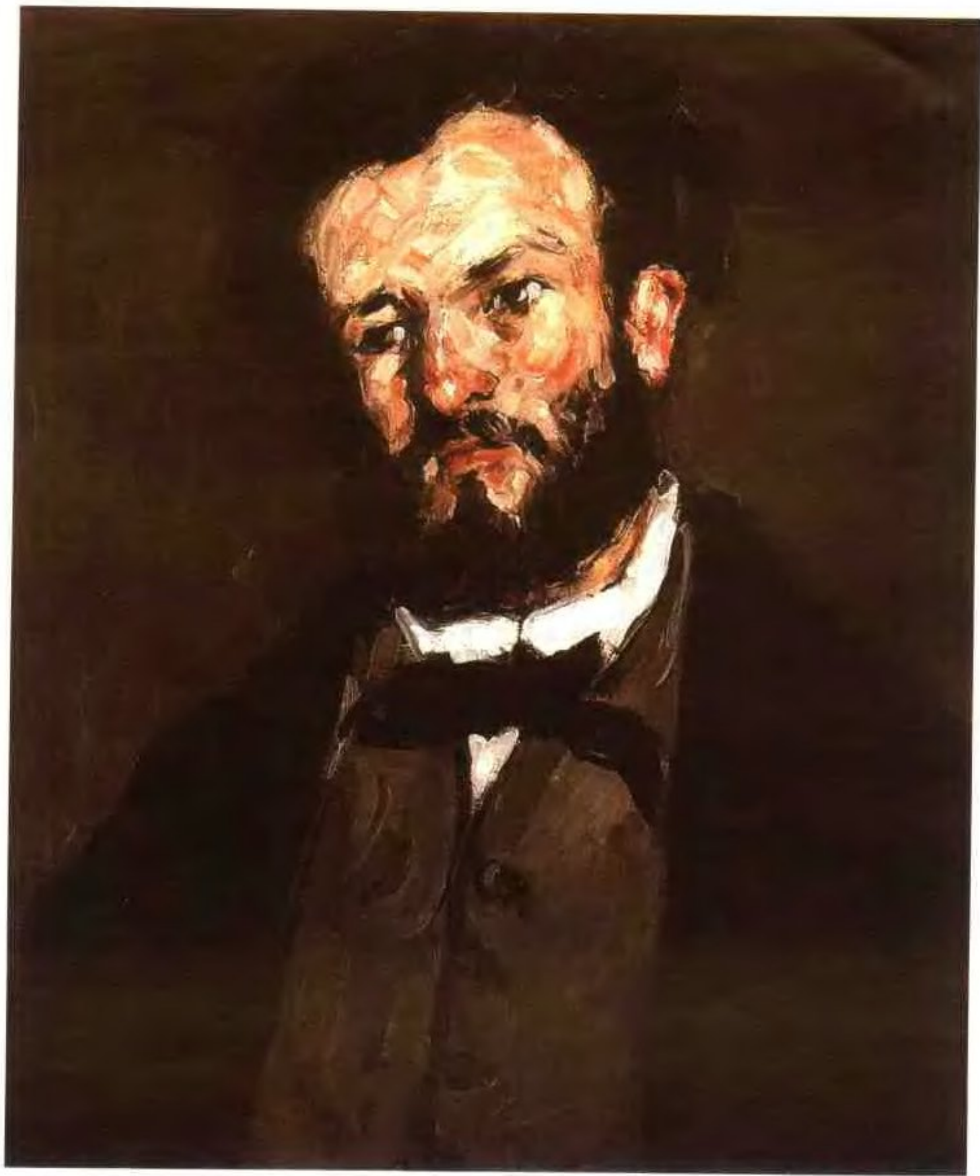
荷谟画像 1866年 油画 画布 60×50.2cm 美国加州马里布保罗·盖帝画廊藏