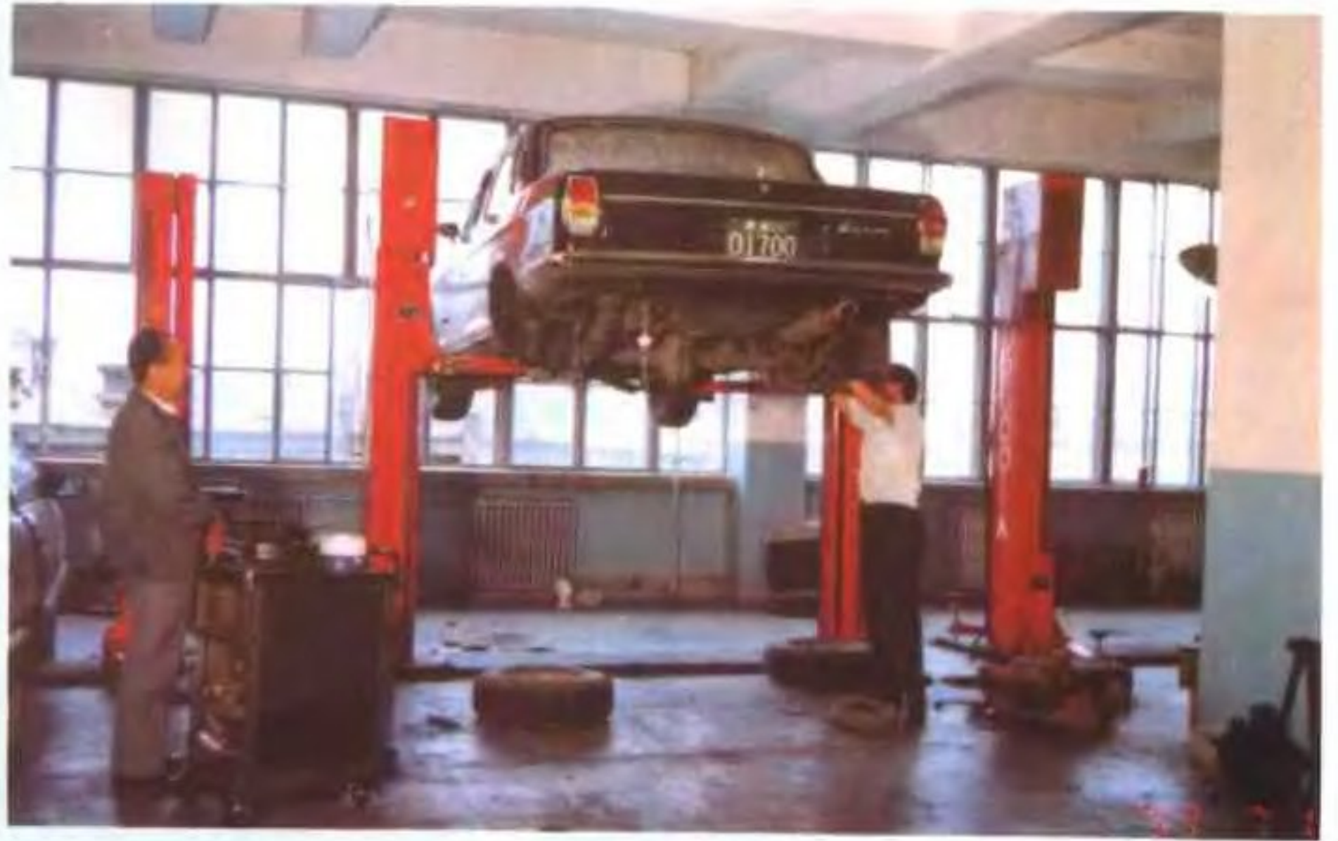
▲ 西宁市小汽车修理厂技工正在检修小车底盘