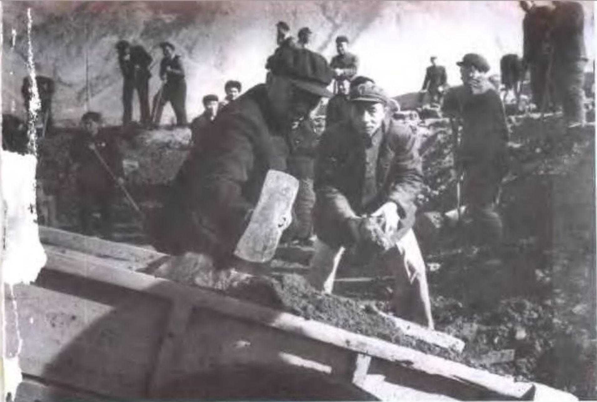
◀ 1958年冬袁任远省长等领导参加西宁火车站修路基劳动