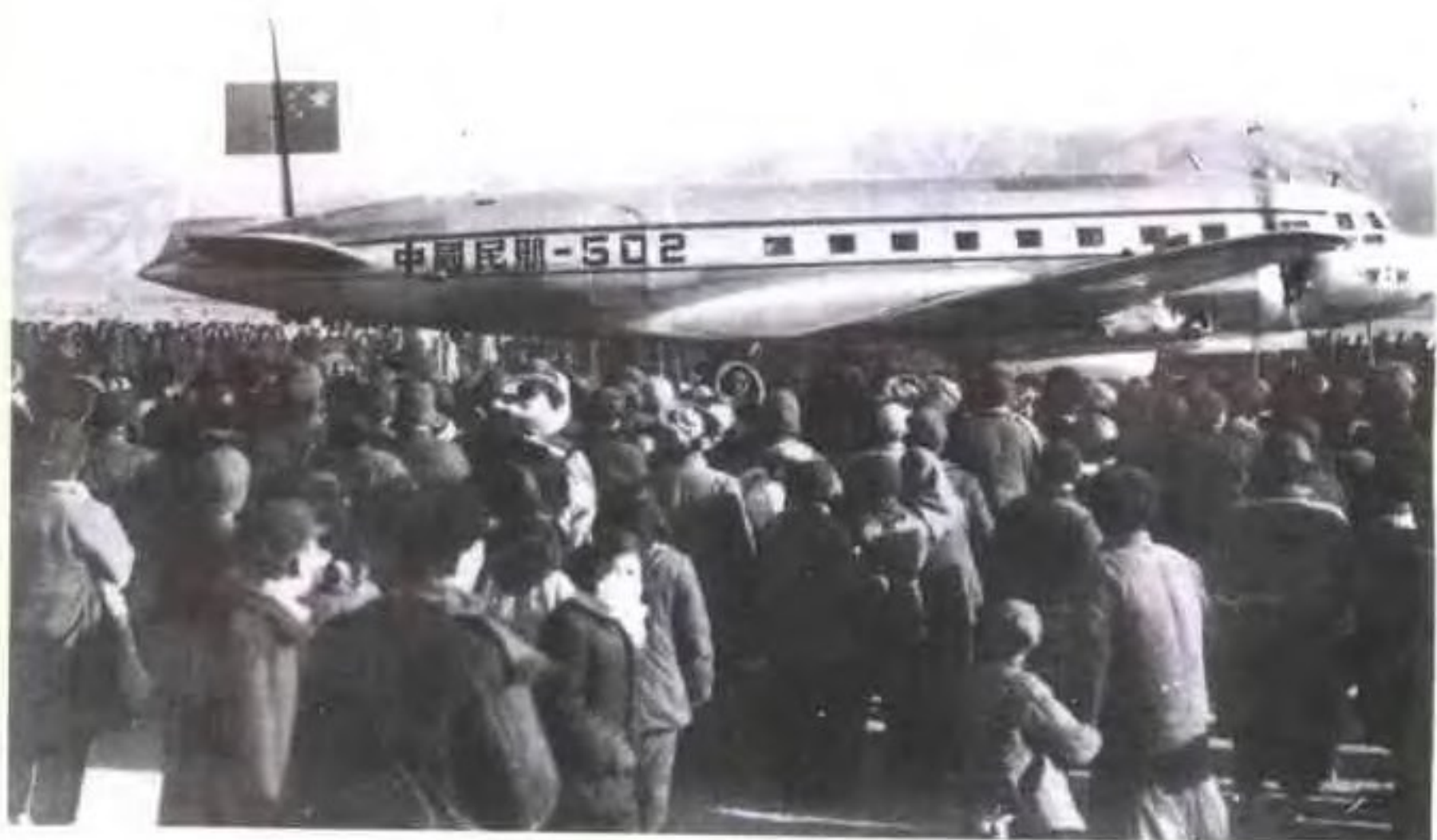
▶ 1957年1月4日西宁—塔尔顶通航庆典 (北京—包头—兰州—西宁—塔尔顶)