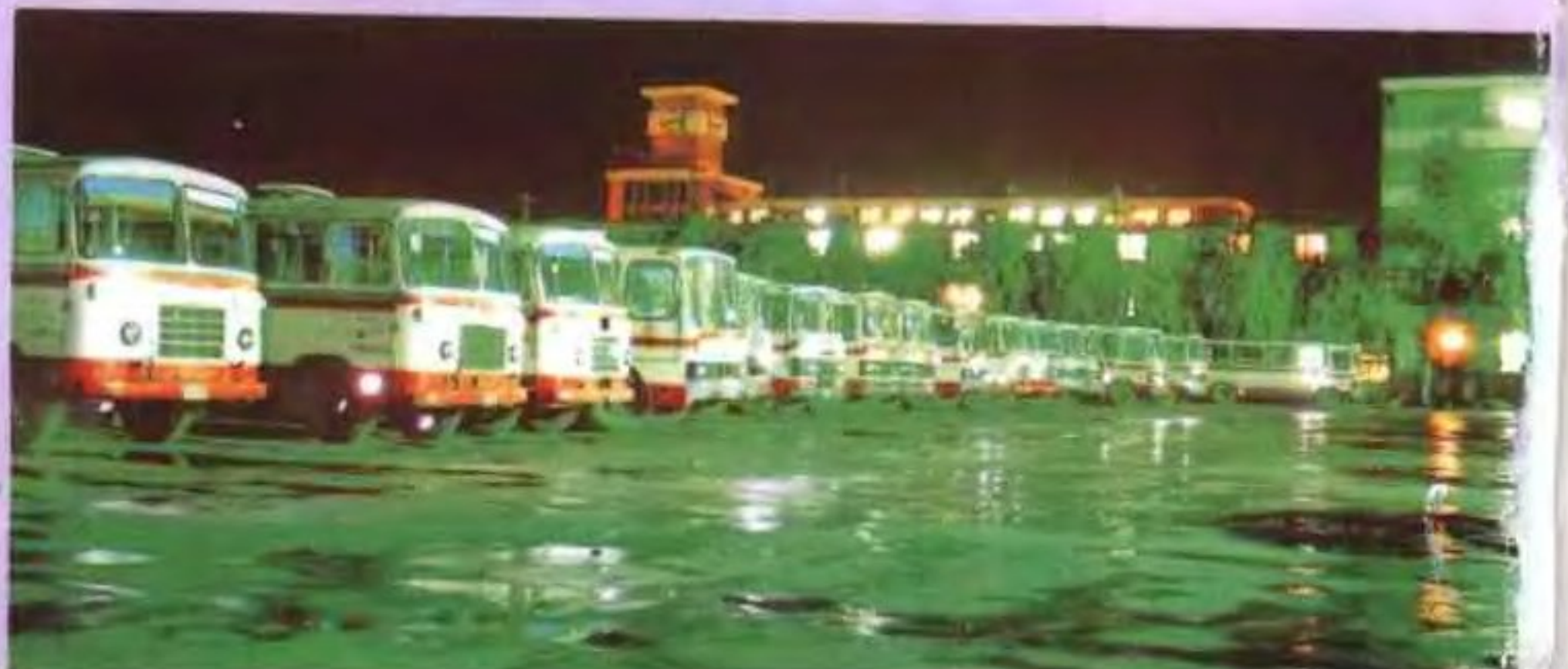
司停车场 ▶ 西宁市公交公