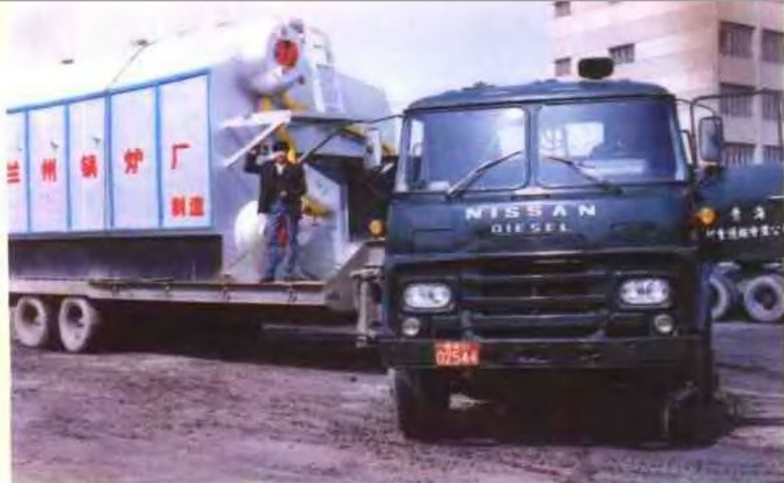
◀青海起重运输安装公司承运 大件运输