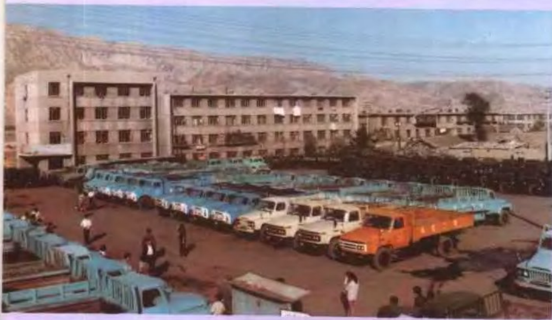
◀ 西宁市运输公司停车场