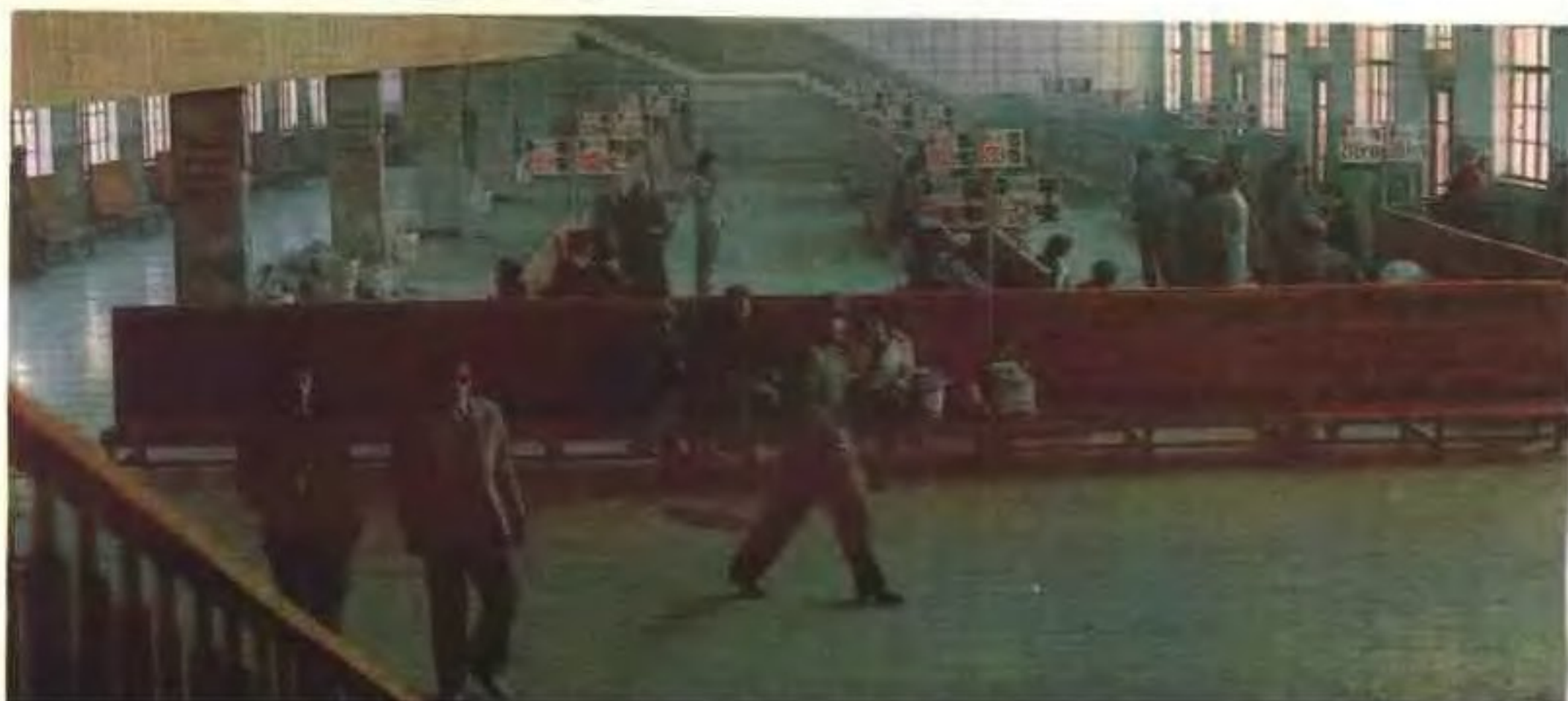
▼西宁汽车站候车厅