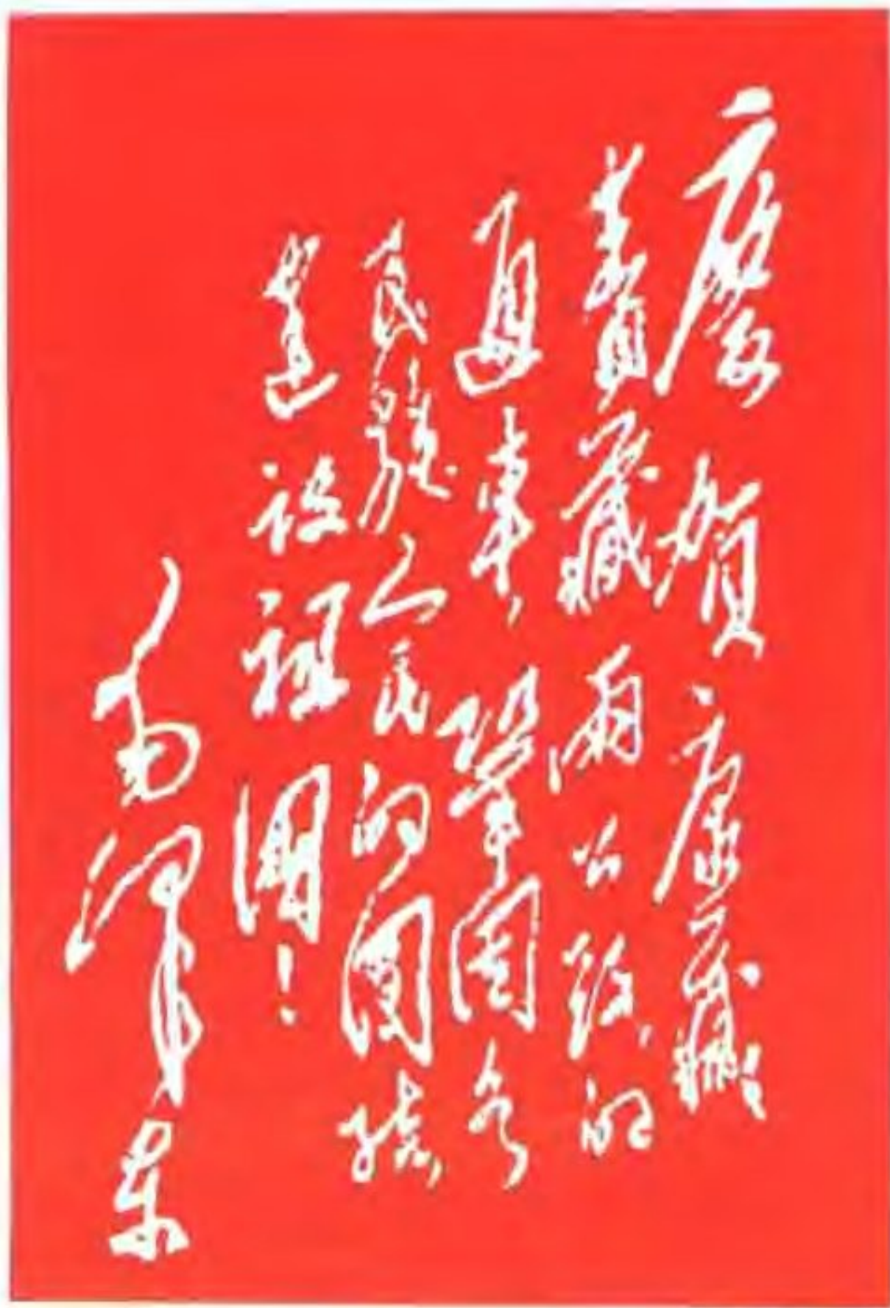
◀1954年12月毛泽东主席为筑路部队和工程技术人员亲笔题写的“庆贺康藏青藏两公路的通车，巩固各民族的团结，建设祖国！”的锦旗