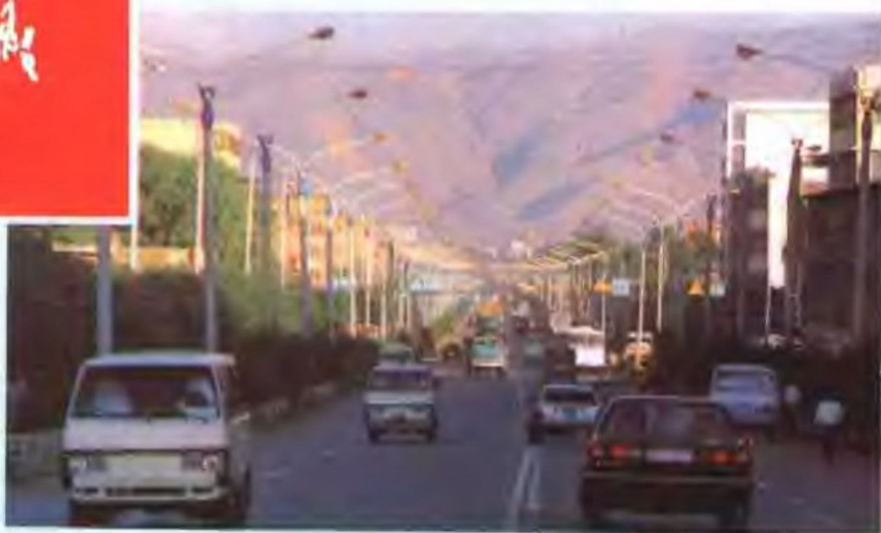
▼▲ 20世纪90年代西宁市城市道路