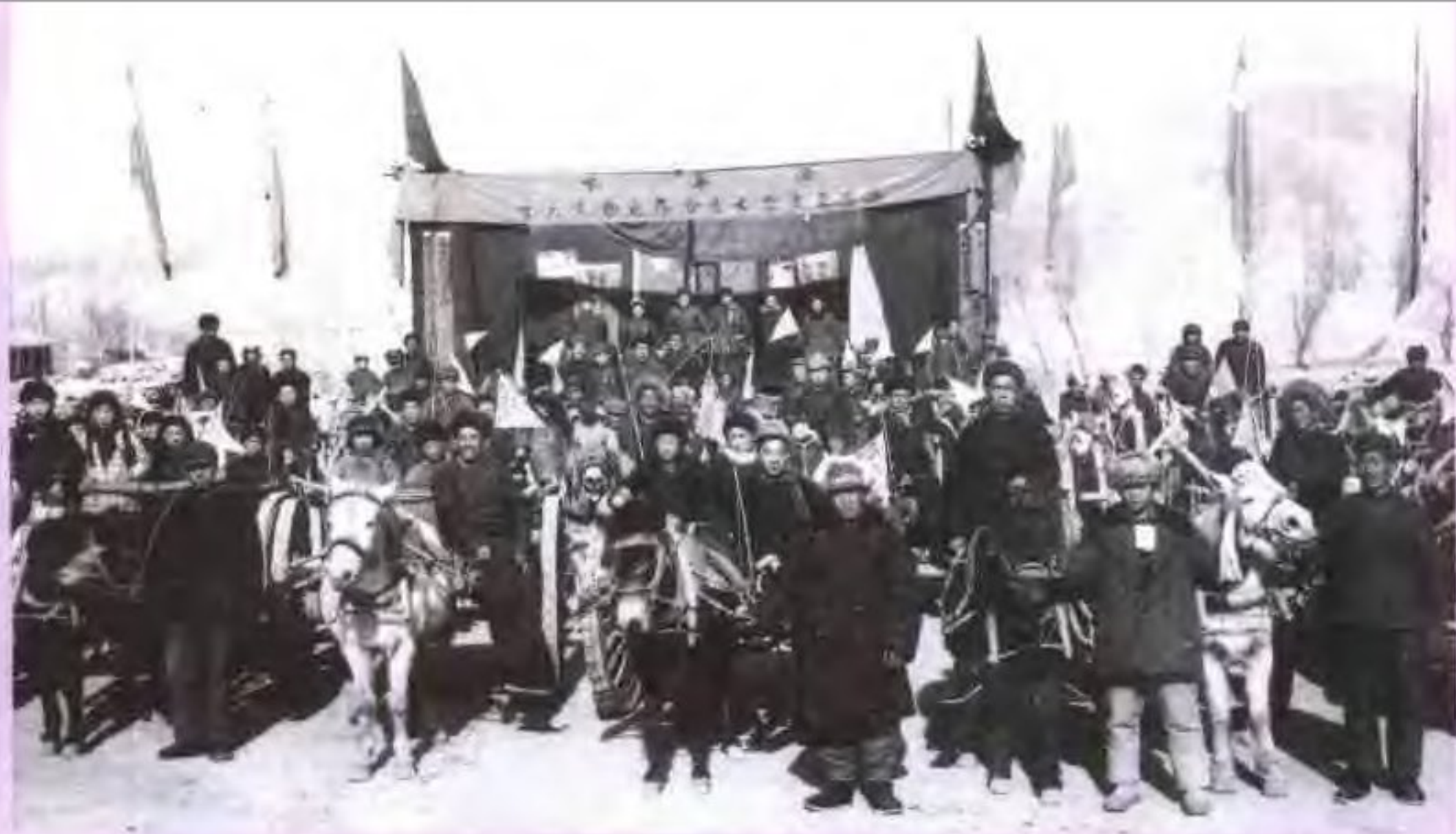
▲ 西宁地区 20 世纪 50—70 年代民间运输主力马车运输合作社