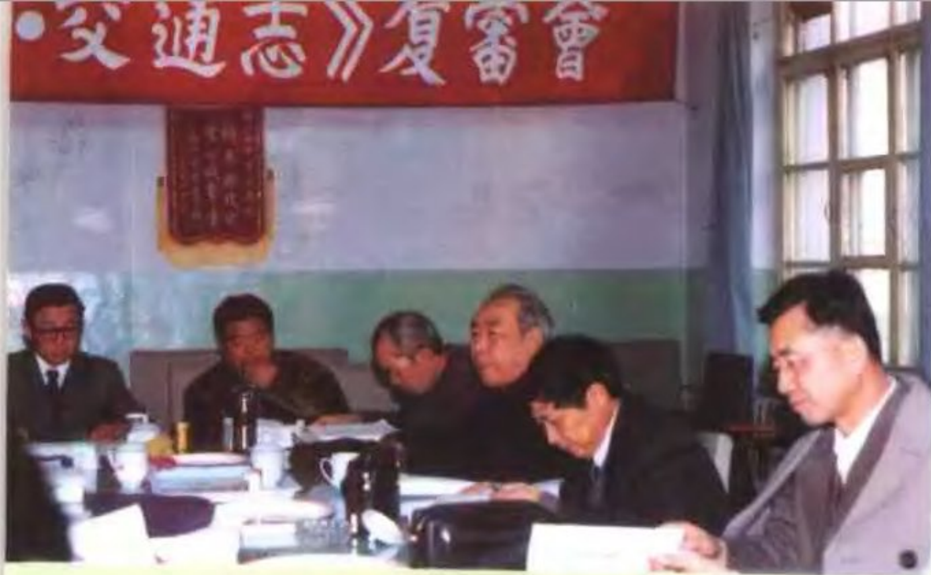
◀《西宁市志·交通志》复 审会