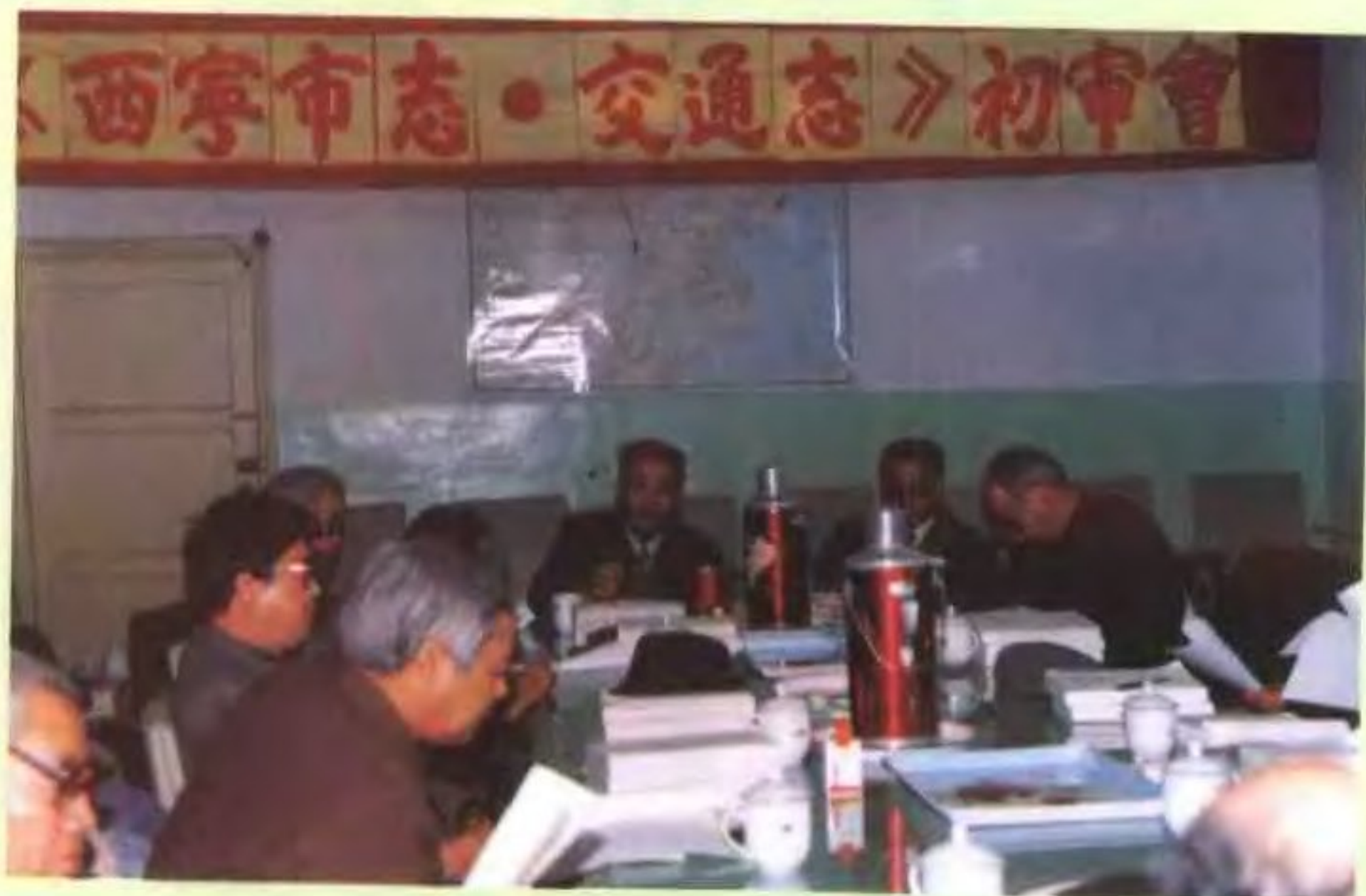
▶《西宁市志·交通志》初审会