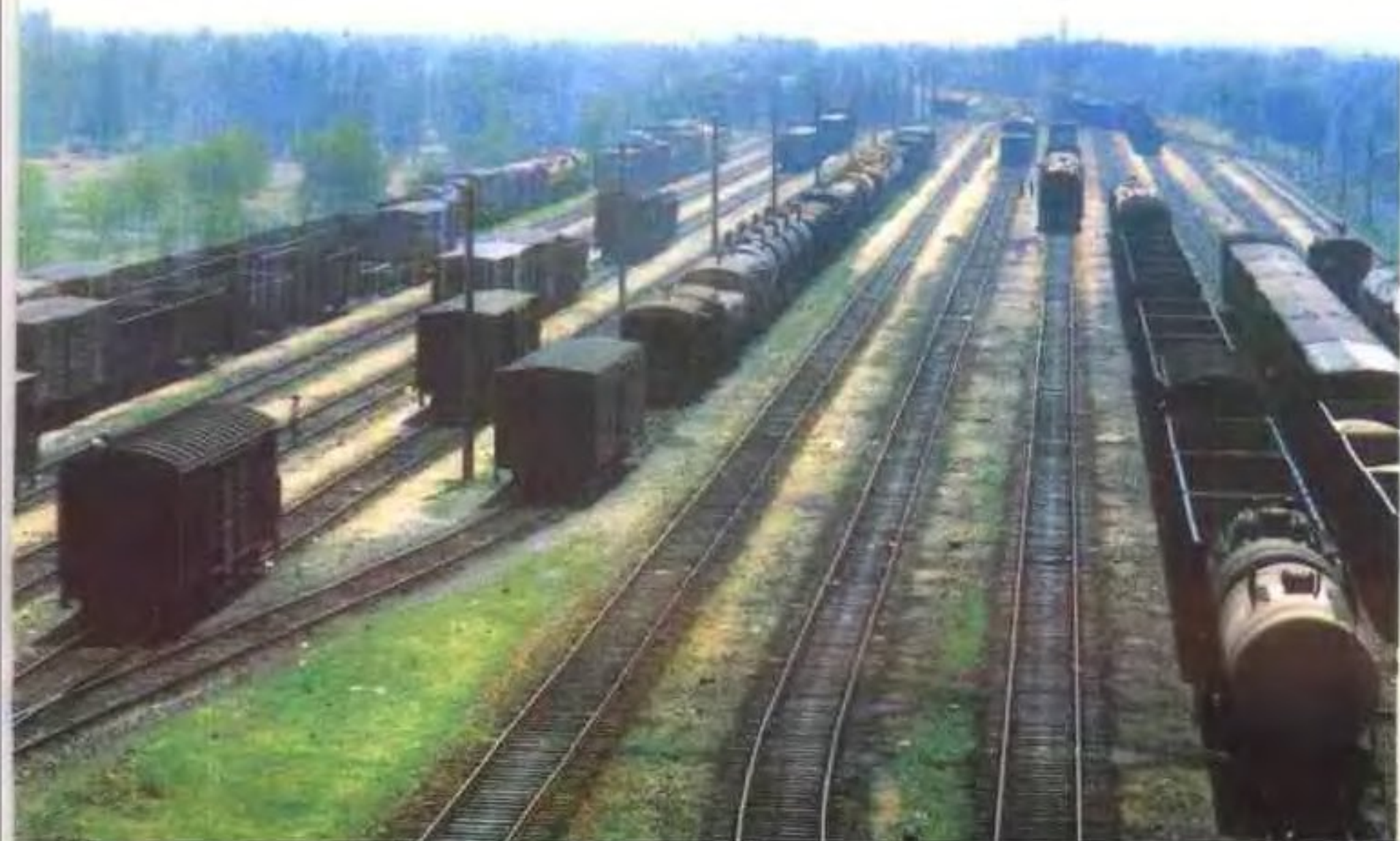
◀ 西宁火车站调车场