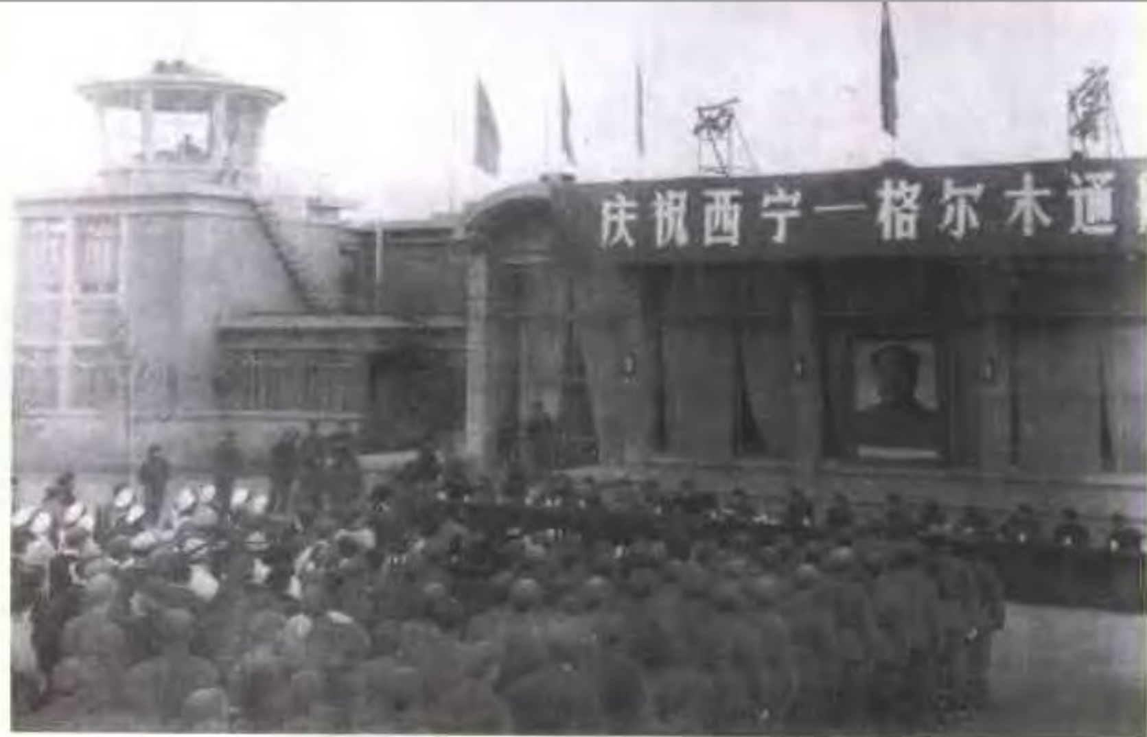
◀ 1974年11月9日西宁—格尔木通航(图为省政府在西宁乐家湾机场举行通航仪式)