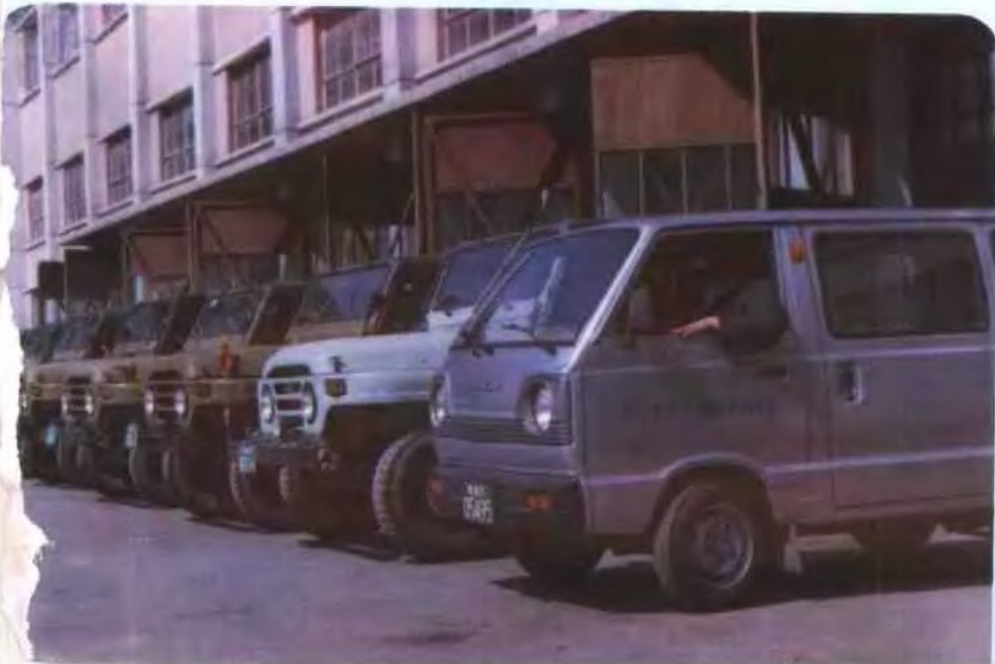
▼ 西宁市汽车摩托车修理厂修复后的车辆