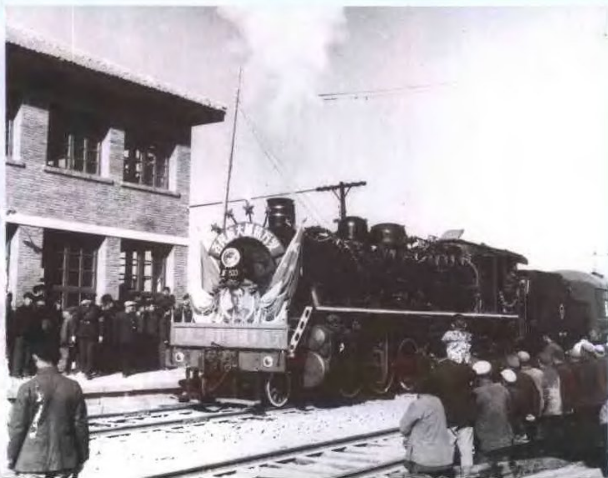
◀ 1959年10月1日兰青铁路通车西宁