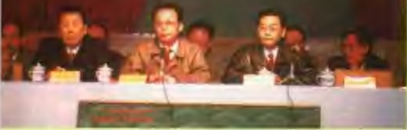
△青海省省长田成平（左二）中共青海省委副书记姚湘成（右二）原青海省邮电管理局局长路万福（左一）青海省邮电管理局局长陈坚（右一）在西宁移动电话开通庆典会上