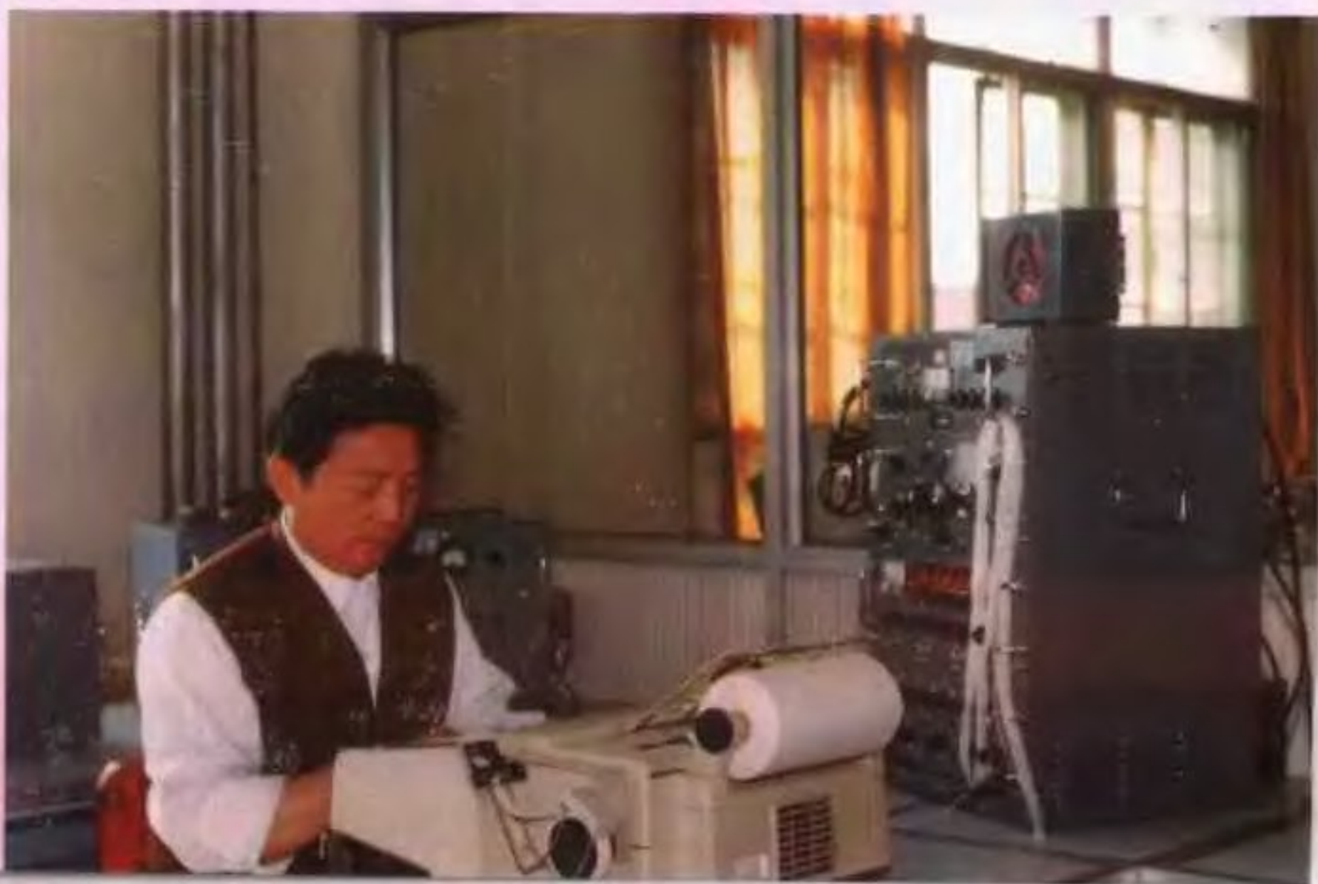
▷单边带无线收讯机