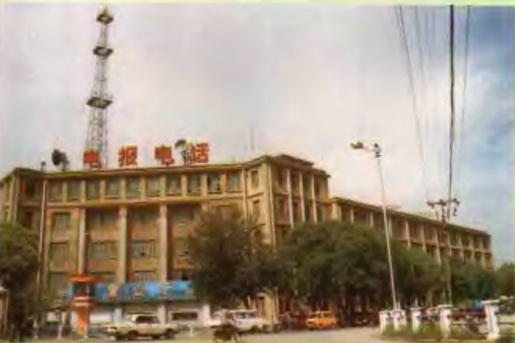
◁西宁市电信局全景