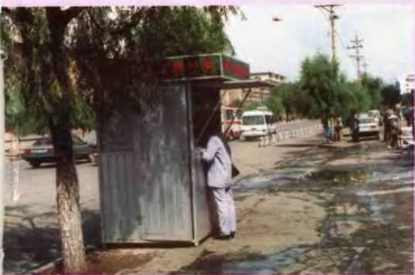
△西宁市电信局公用电话亭