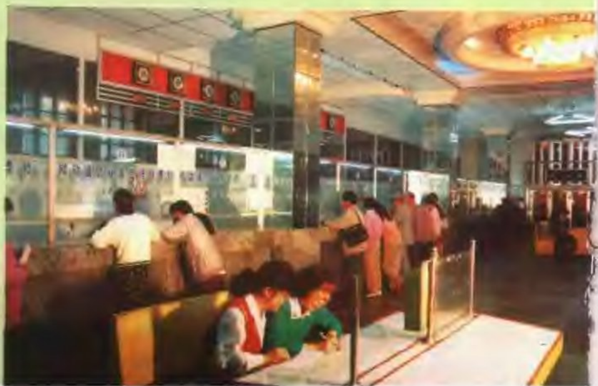
▷西宁市电信局营业大厅