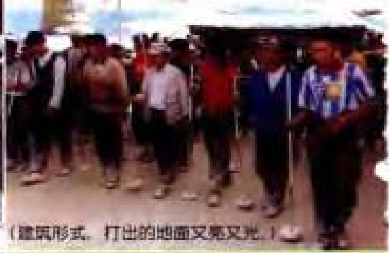
(建筑形式，打出的地面又亮又光。)