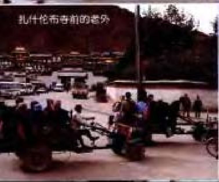
扎什伦布寺前的老外