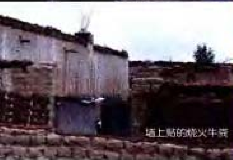
墙上贴的烧火牛粪