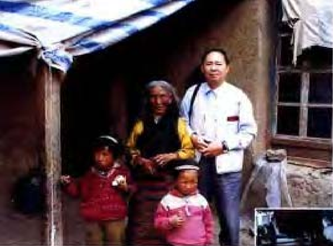
▲ 作者在藏民农家中采访