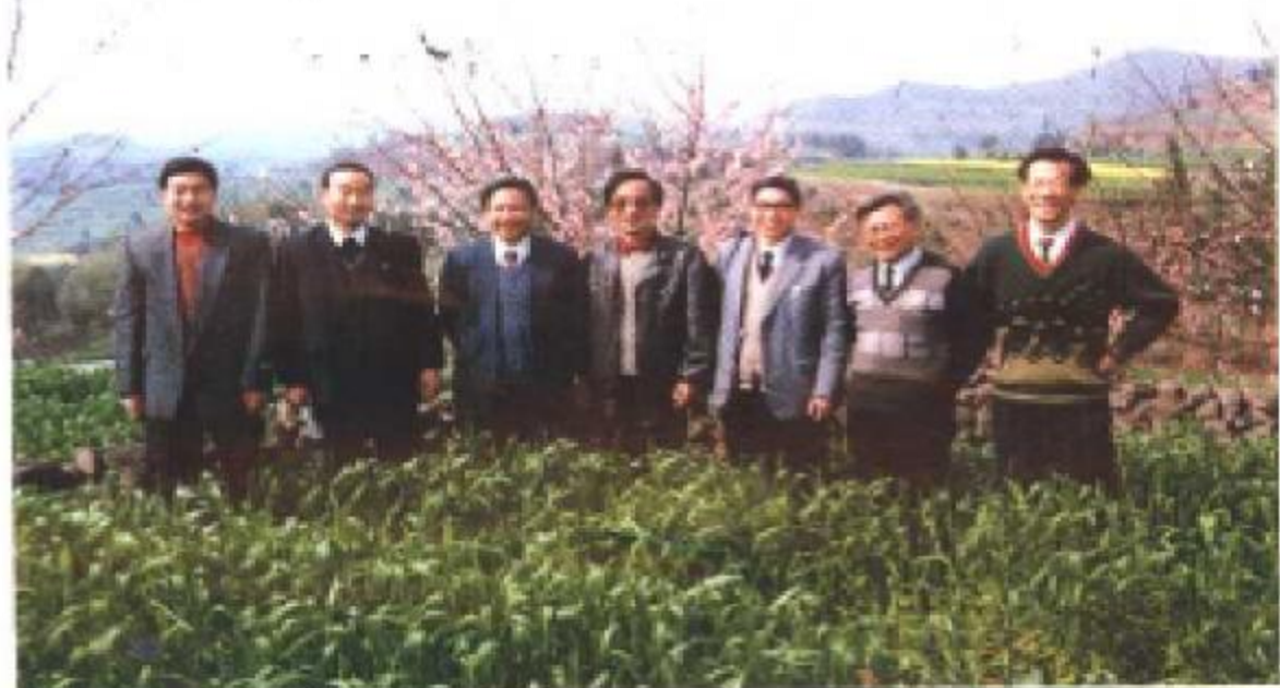
国家在西充验收第一期水土保持工程留影