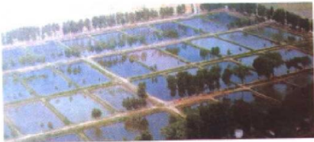
仁合镇改造后的中低产田一角