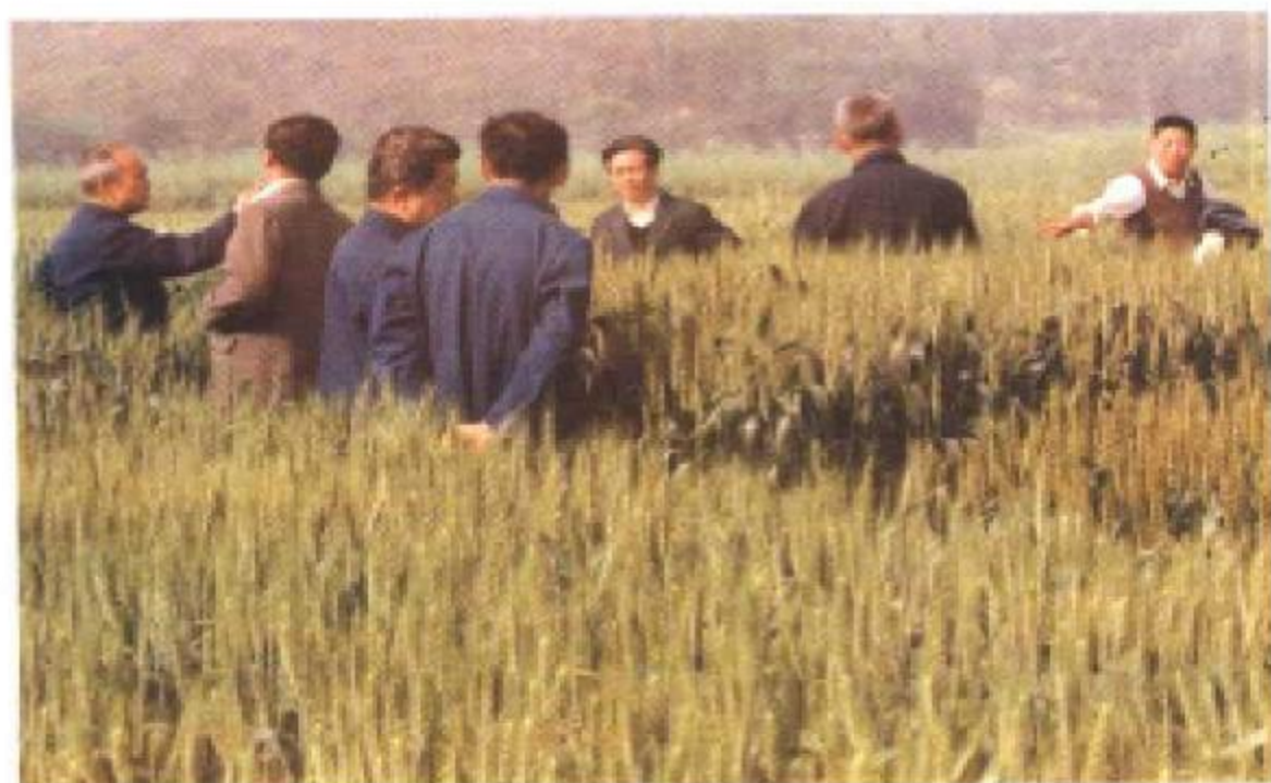
四川省刘纯夫副省长在西充县农科所考察验收杂交小麦