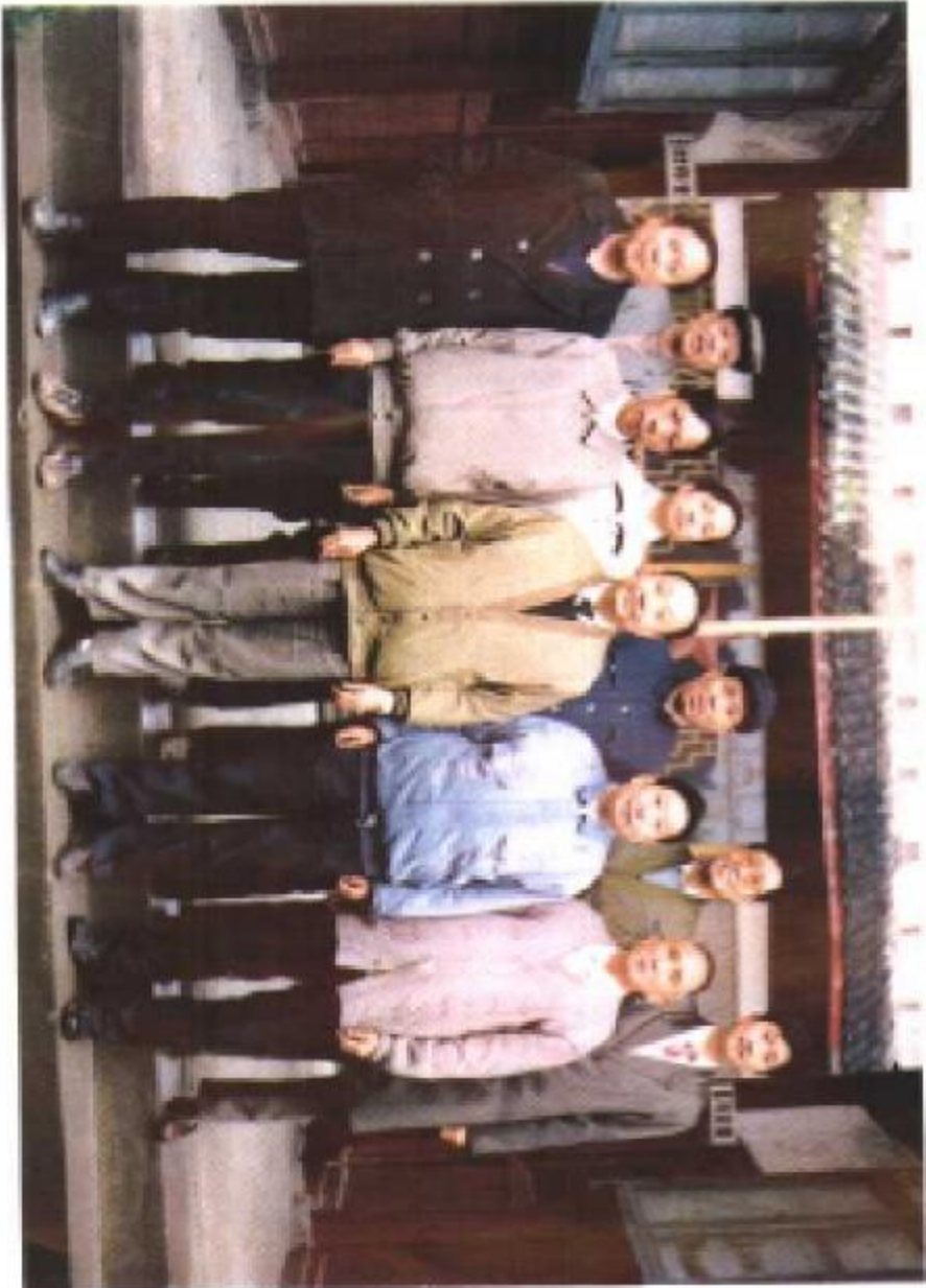
西充县政协领导与本辑编委成员合影