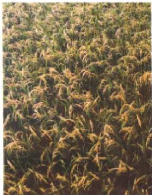
杂交水稻在西充喜获丰收