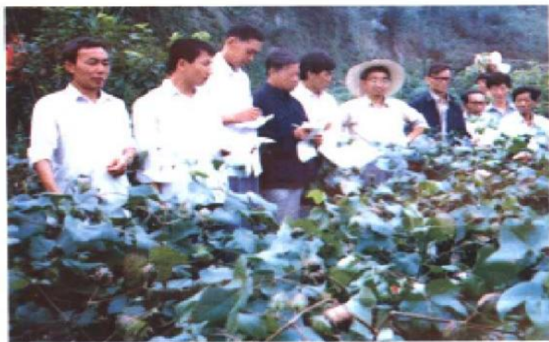
市县领导、专家考察槐树镇棉花高产田