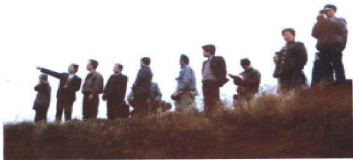
国家、省、市专家考察龙滩河流域