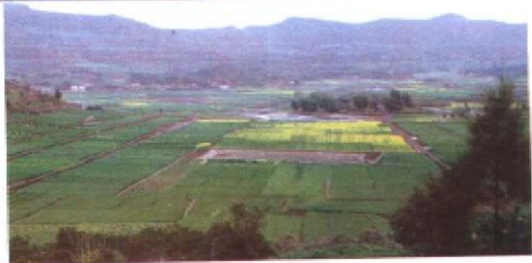
双凤镇水土保持工程梯田新貌