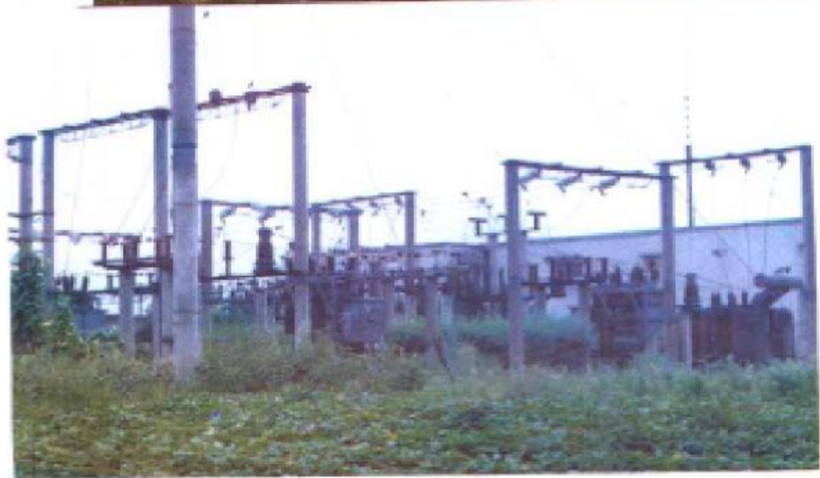
西充县金龙山变电站一角