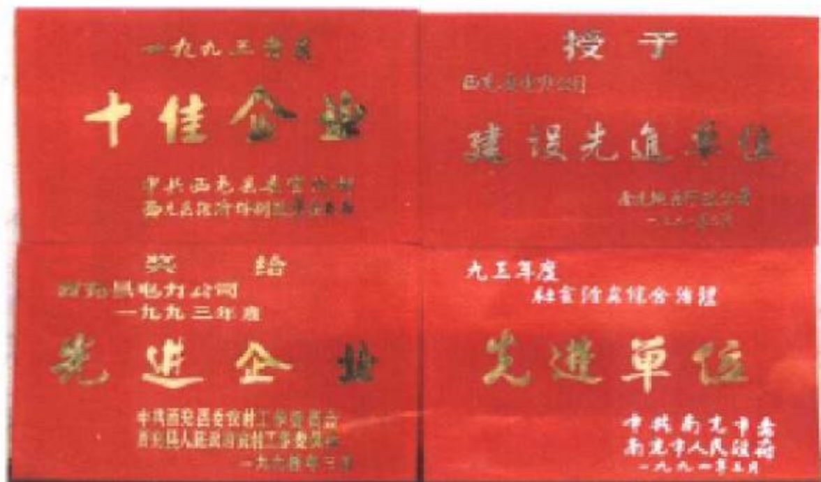
西充县电力公司多次受到上级表彰