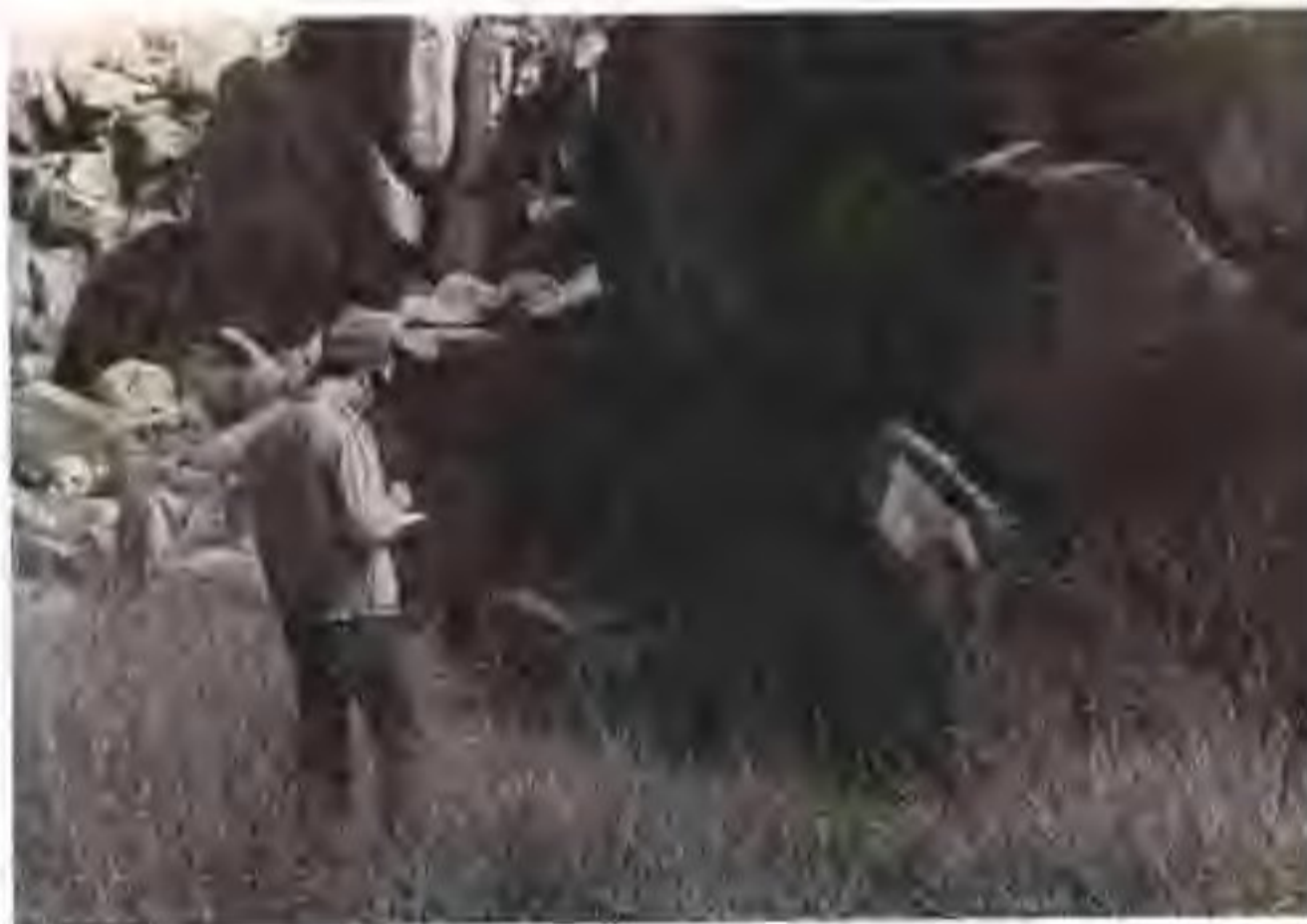
作者调查哈龙沟岩画

野牛沟岩画位于昆仑山脚的奈齐郭勒河谷的四道梁，该河谷俗称野牛沟，东北距格尔木市120公里左右。但蒙古族牧民只是听说，谁也未曾见过，因为四道梁属于哈萨克人的放牧地区。我们打算找哈萨克人了解情况时，才得知格尔木的哈萨克人已举族迁往新疆。在以往的岩画调查中，常常遇到“谎报军情”的情况，即听上去像真有岩画，实则空跑一趟。蒙、藏、哈萨克，乃至世界上许多民族都坚信，岩画非人力所为，是从岩石中自然生长出来