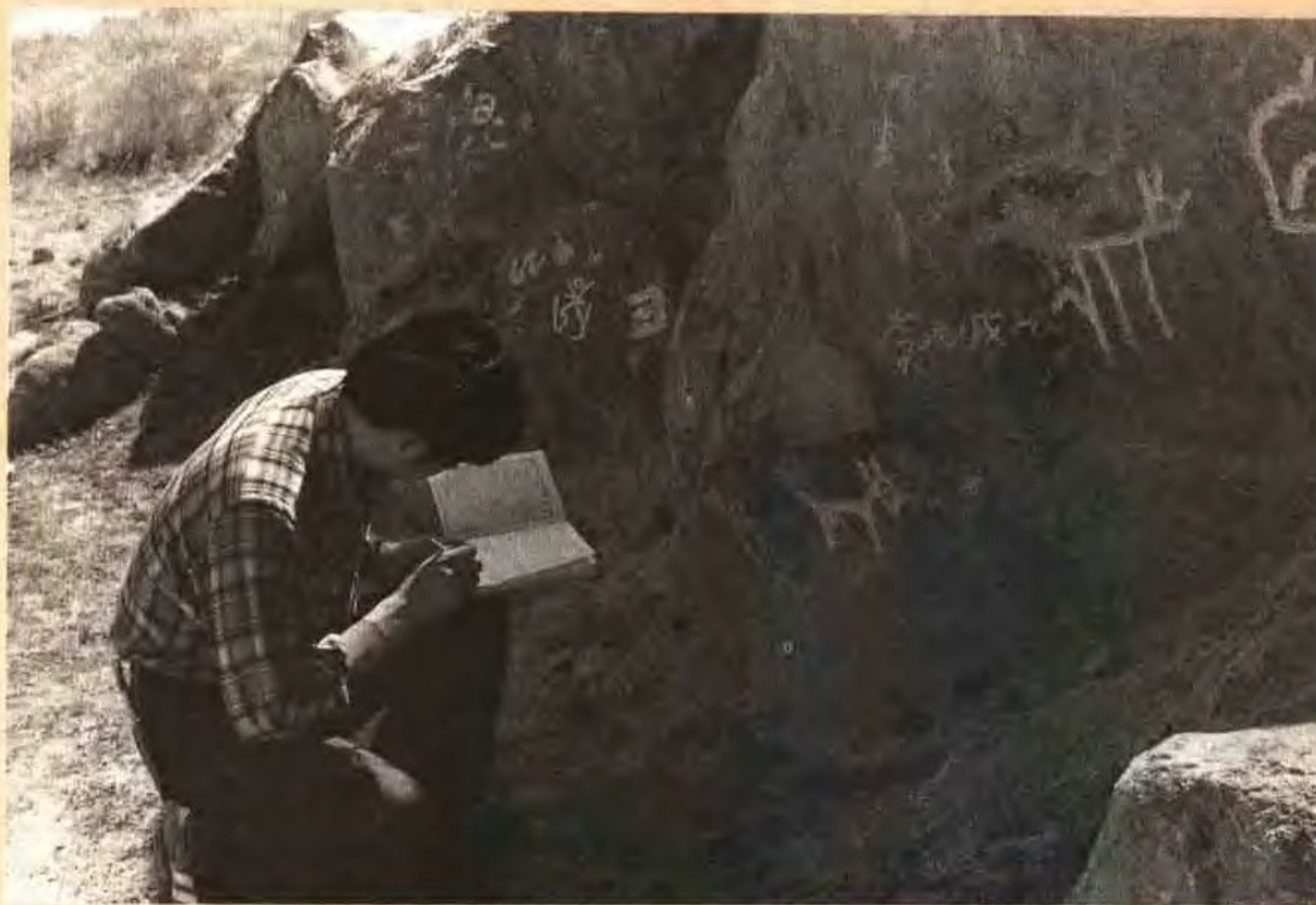
作者调查巴哈默里沟岩画