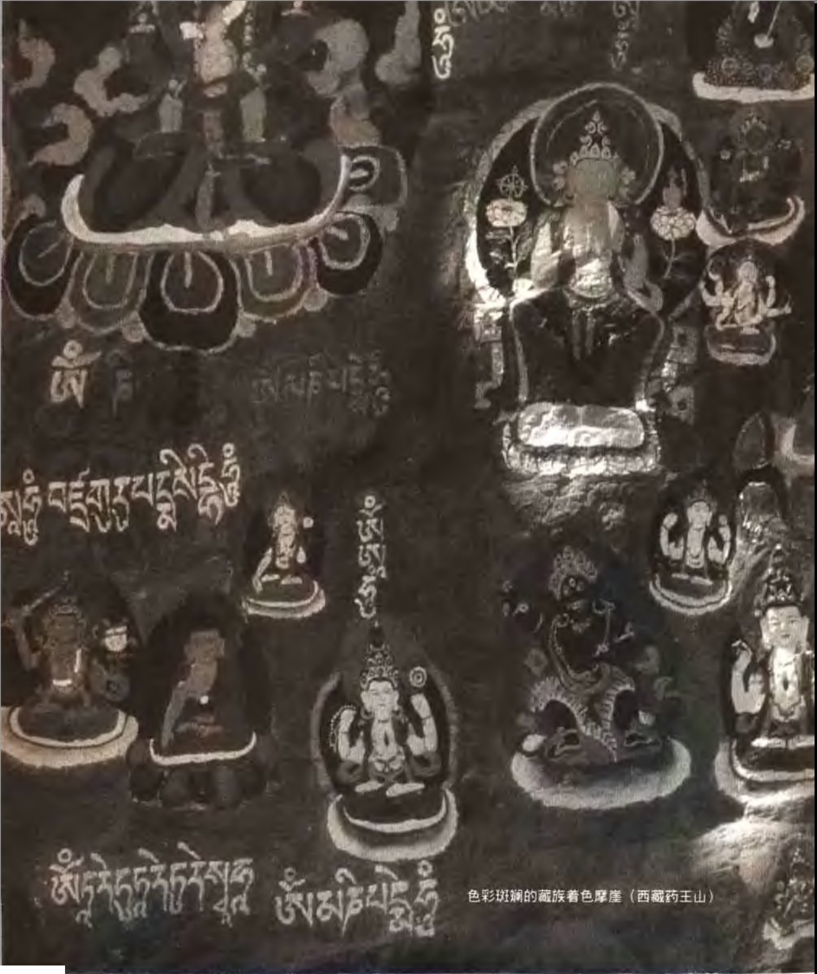
色彩斑斓的藏族着色摩崖（西藏药王山）