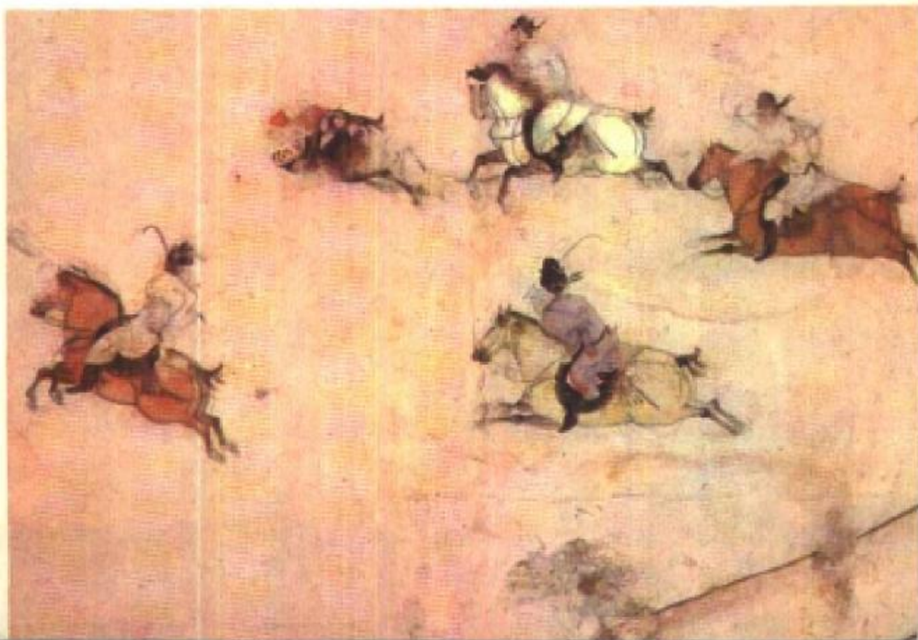
打马球图（唐代壁画）