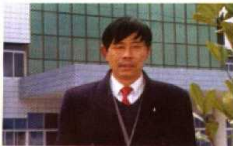
黄陵县武湖建筑公司副经理 104 工 区 项 目 经 理 黄陵县工商联武湖分会会长