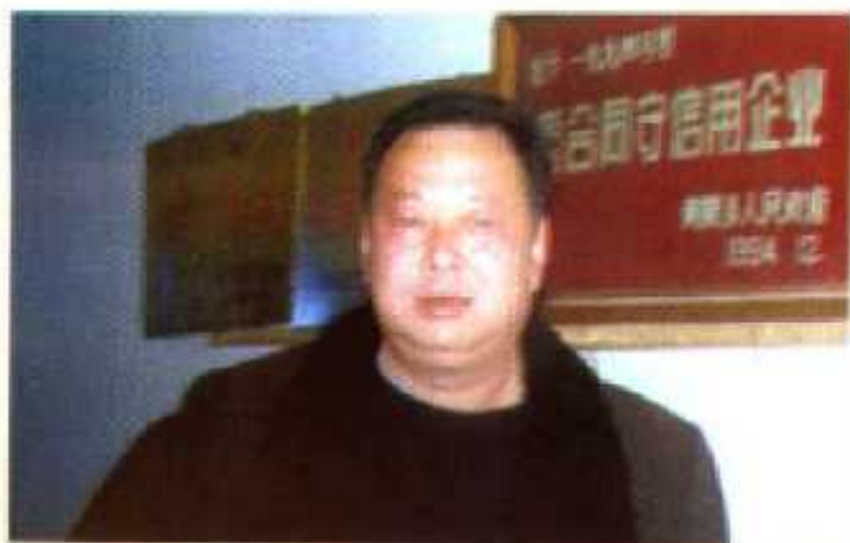
黄陂县光华米厂厂长