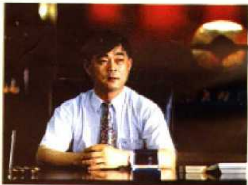
59192 部队建筑工程公司经理 黄陂县装饰建筑公司副经理 黄陂县装饰建筑公司一工区经理

公司生产48个系列 700多种规格型号铝合金型材，产品一次性通过 ISO9002标准验收。1997年被湖北省政府命名为“湖北省名牌产品”。1996年被武汉市委、市政府授予市级“十佳企业”称号。