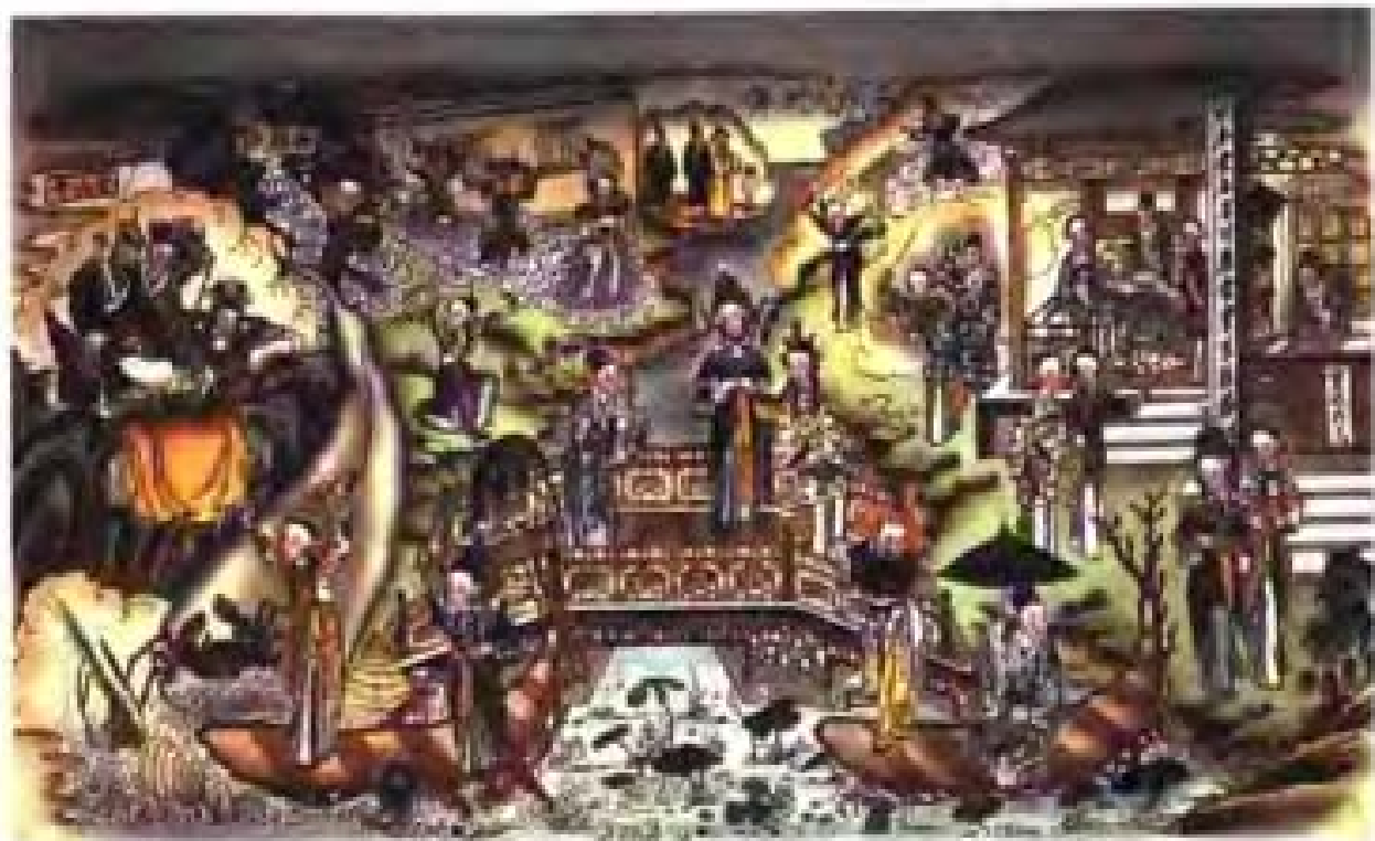
白蛇传 天津杨柳青

上写的则是“心定自然凉”，或者是首打油诗：“夏天天气热，扇子借不得。虽是好朋友，你热我也热。”他也会写几把扇子送给同事和邻居。父亲的字写得很不错，单位里逢年过节的标语都是他写，文革中他也总是被造反派叫去抄大字报。可惜当时不以为意，父亲去世后，才想到他的书法竟连一件都没有保存下来。我手边留着玩的一把折扇，是一位善书法的朋友送的，他为我写的是“上善若水”。