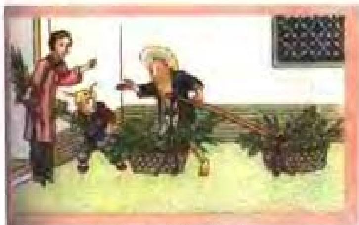
赛蒲艾（选自民国香烟牌）