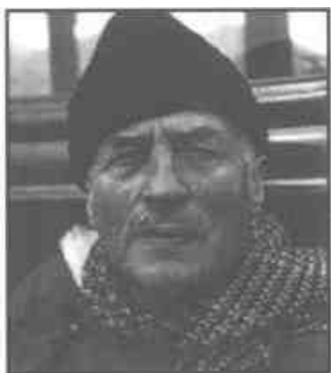
斯文·赫定 (Sven Hedin)

斯文·赫定，一八六五年出生于瑞典首都斯德哥尔摩一个中产阶级家庭，其父为知识分子，终生对斯