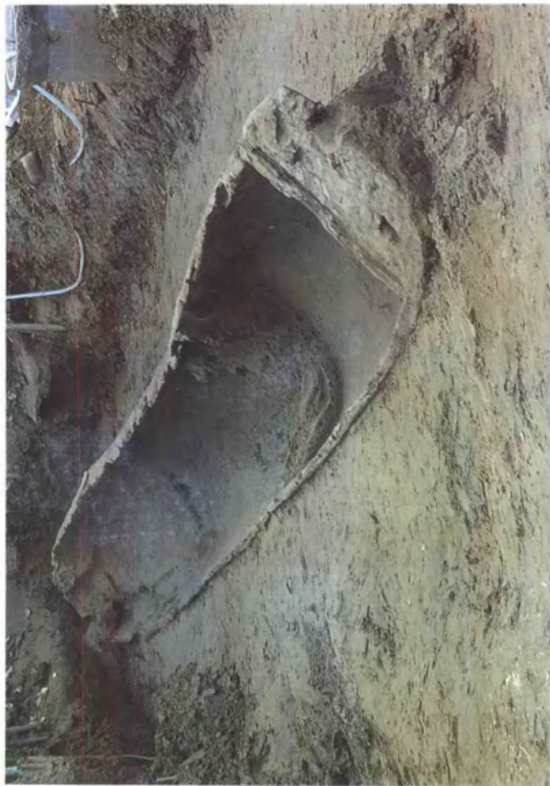
彩版一 淮北市濉溪县柳孜隋唐大运河遗址出土的唐代独木舟(长 10.6 米)