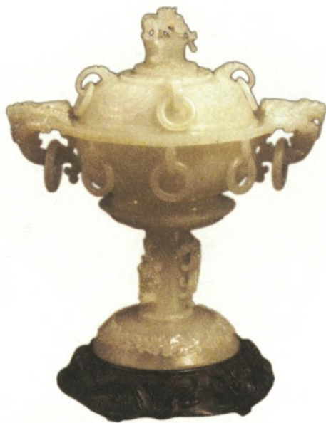
清白玉饕餮纹香炉