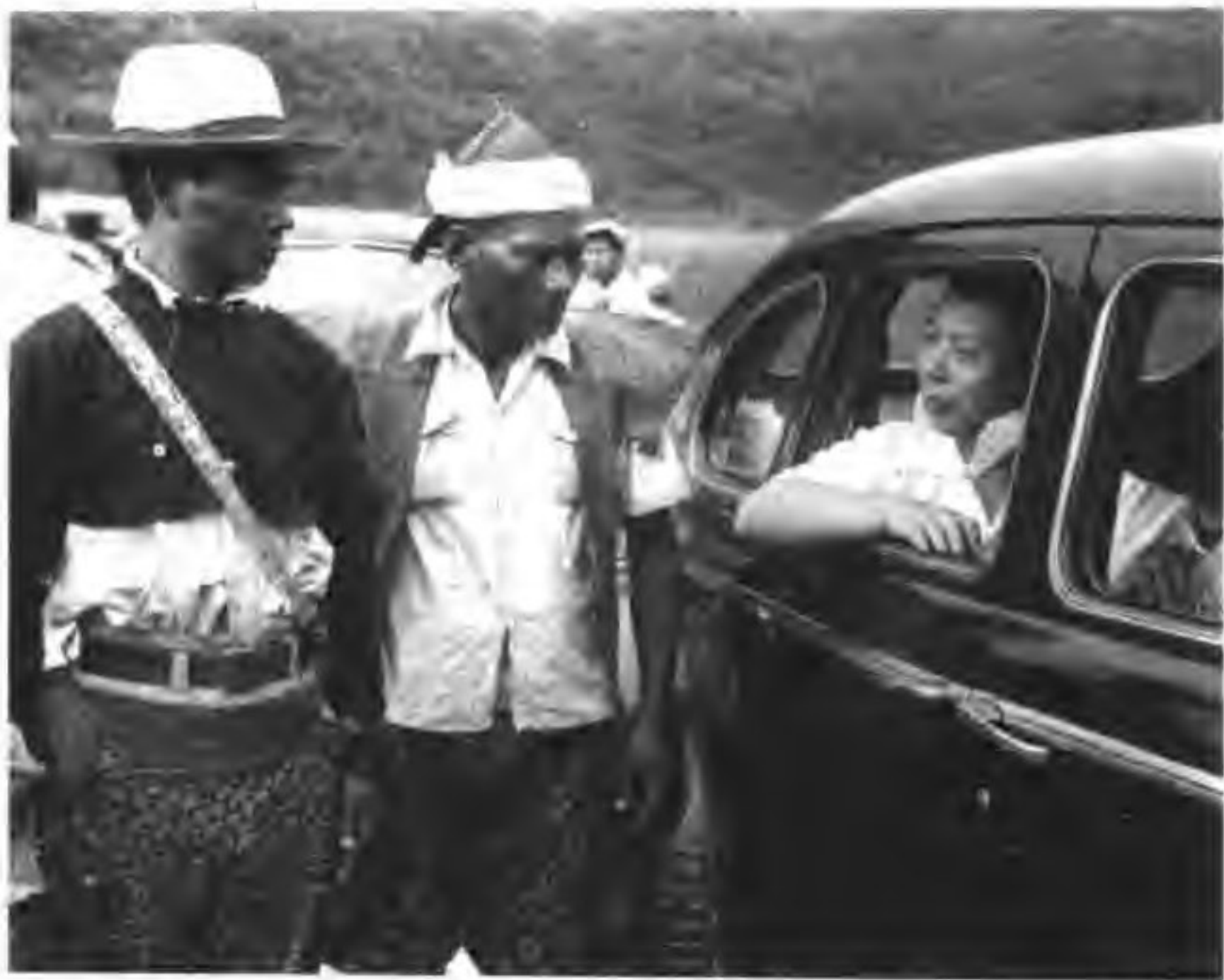
20世纪50年代初，时任“台湾省主席”的吴国桢驱车前往台东巡视途中，与两位山胞交谈。

厅厅长和汉口市市长，其间还担任过蒋介石的侍从秘书。抗战时任重庆市市长，后又曾任国民党中央宣传部部长。抗战胜利后，出任上海市市长。1949年底，国民党大陆失利，吴国桢又任“台湾省政府主席兼保安司令”，一直到1953年离台赴美。