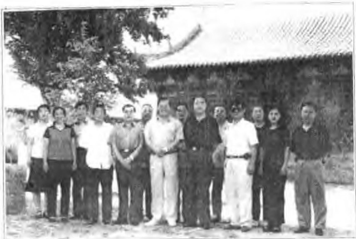
▲ 2001年8月22日张家口市政协文史委来蔚县视察，在蔚州名刹释迦寺合影留念。