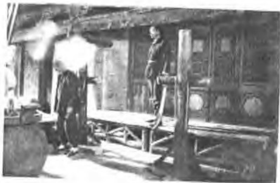
▶ 电影《平原枪声》在 蔚县玉皇阁拍摄。