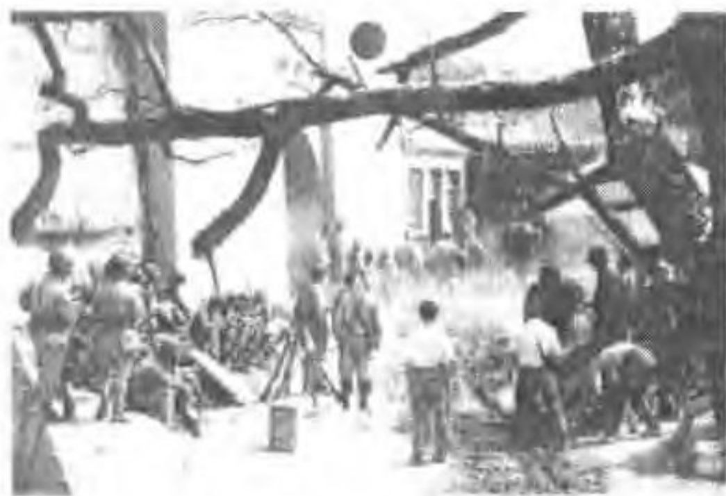
▲ 电影《我认识的鬼子兵》在蔚县南留庄镇水东堡拍摄。