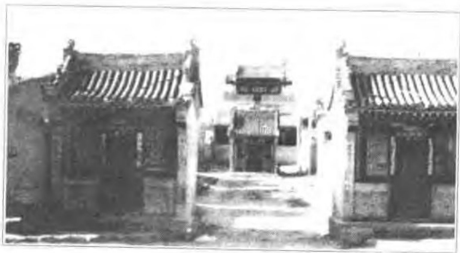
▲ 涌泉庄北方城古建筑群