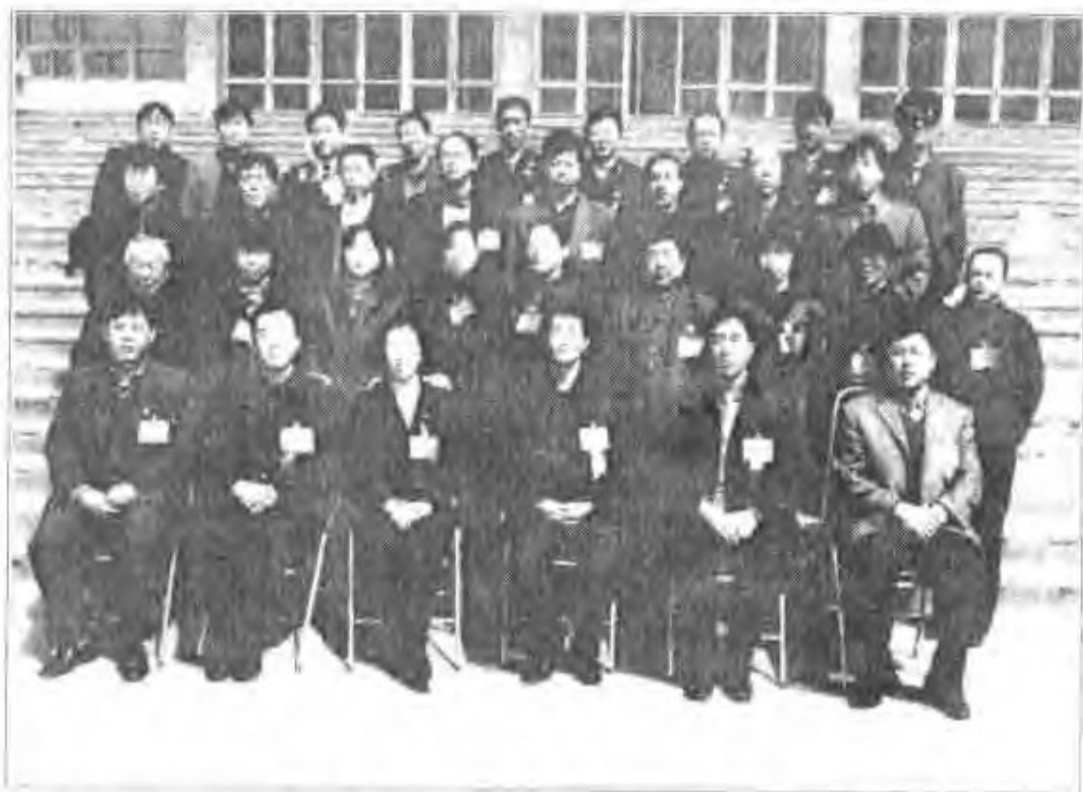
▲ 政协蔚县第十二届委员会常务委员合影