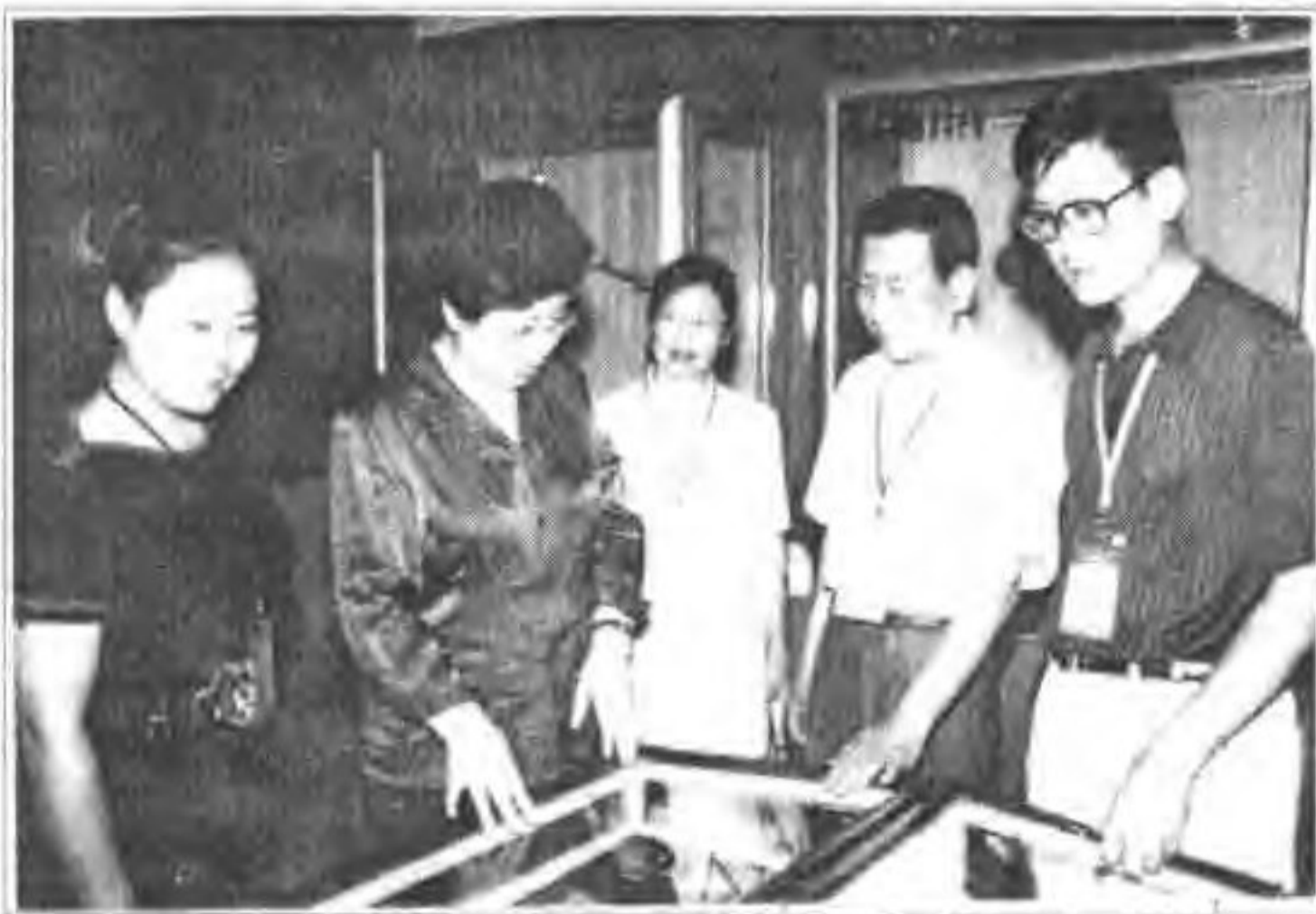
▲ 2003年8月26日河北省副省长孙士彬(右二)在蔚县博物馆参观。