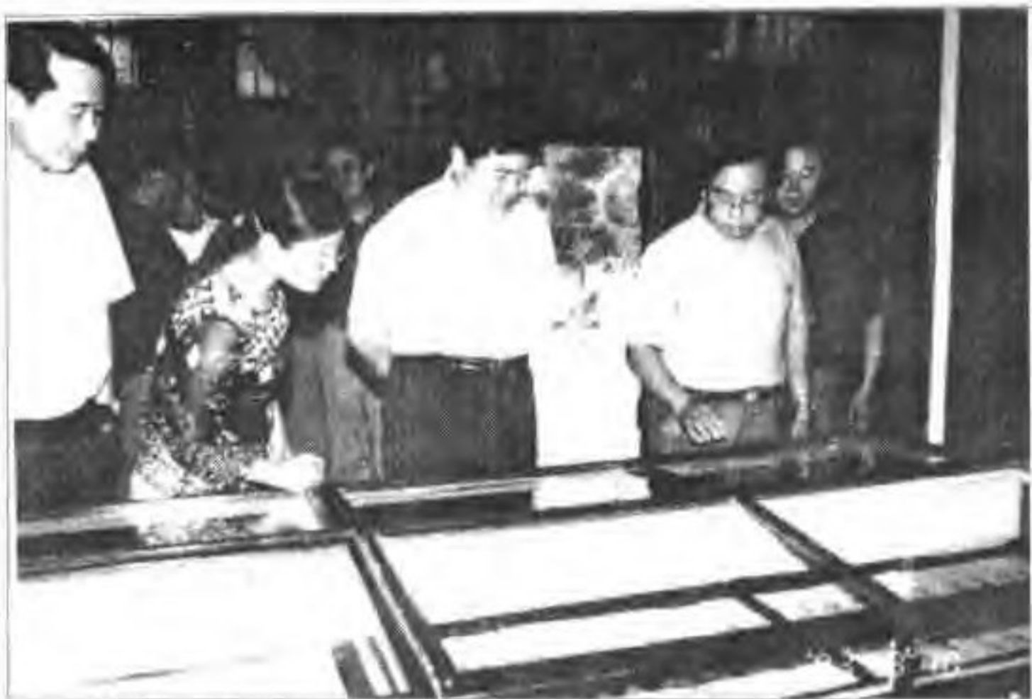
▲ 2003年8月10日国家文物局局长单霁翔(右三)在蔚县博物馆参观。