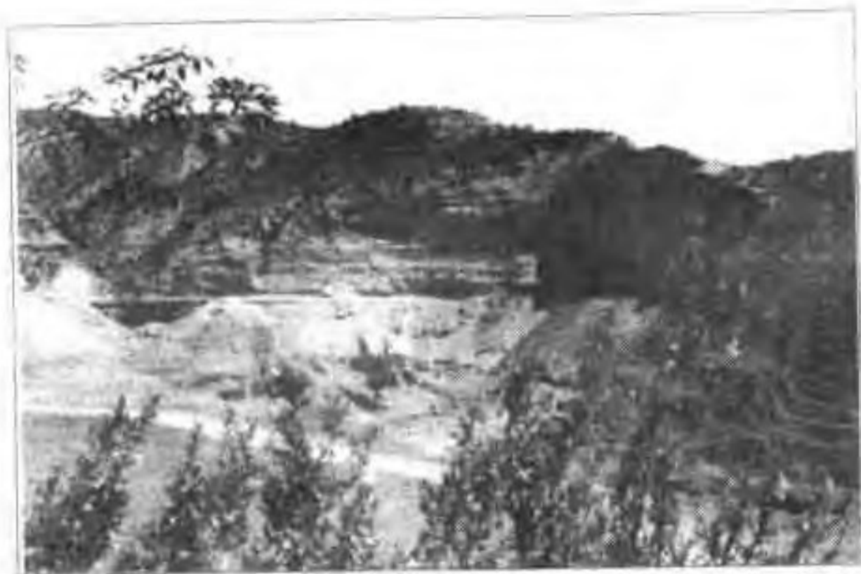
▲ 代王城古城墙遗址