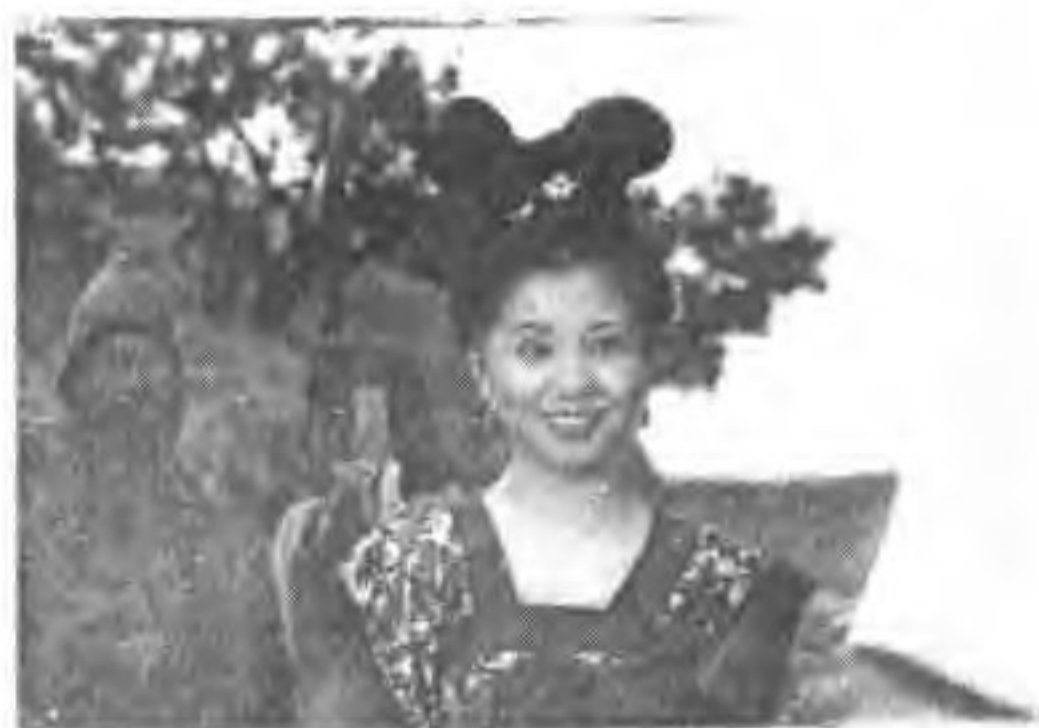
▲ 著名演员潘好好在电视剧《新少林寺》饰女主角牧羊女。拍摄地点——蔚县涌泉庄。