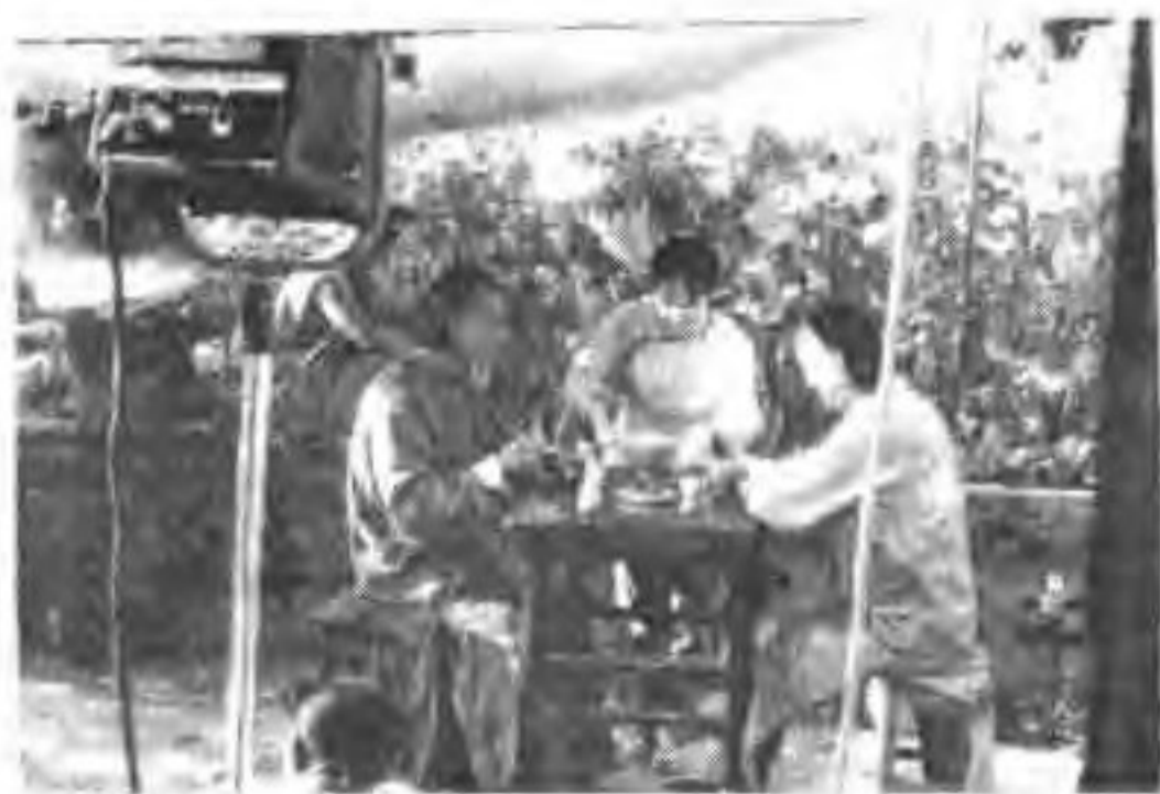
▲ 著名演员陶慧敏、赵恒焯在蔚县玉皇阁拍摄电视剧《民间戏圣》