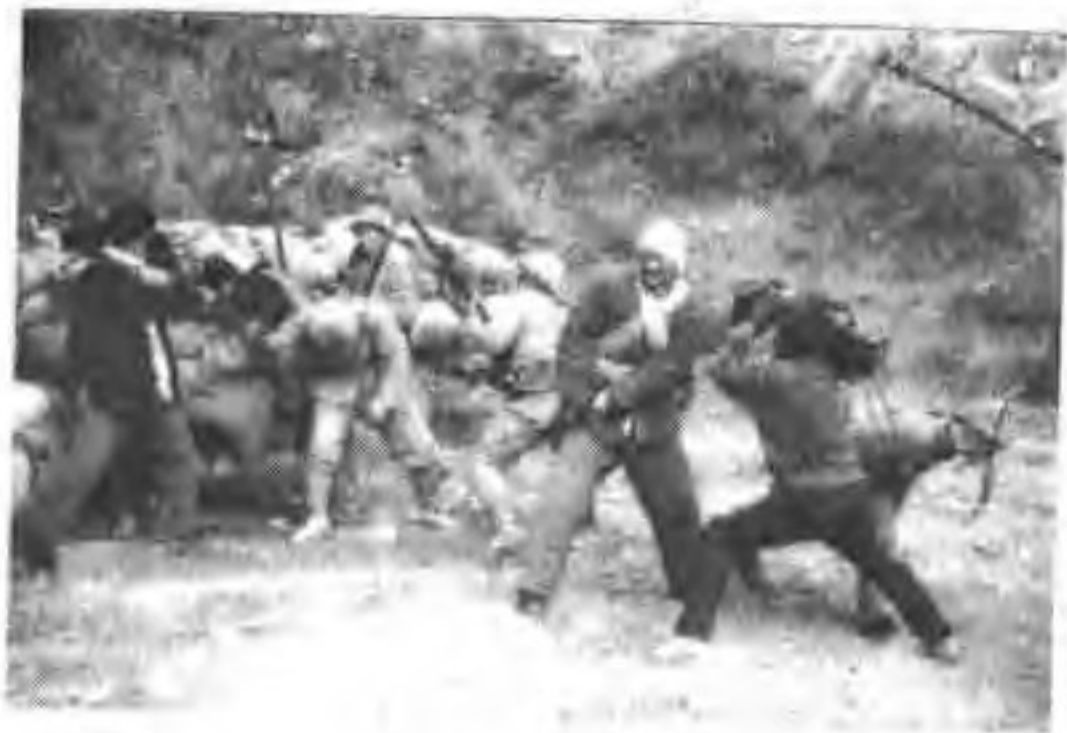
▶ 电视剧《烈火金刚》 在蔚县飞狐峪拍摄。