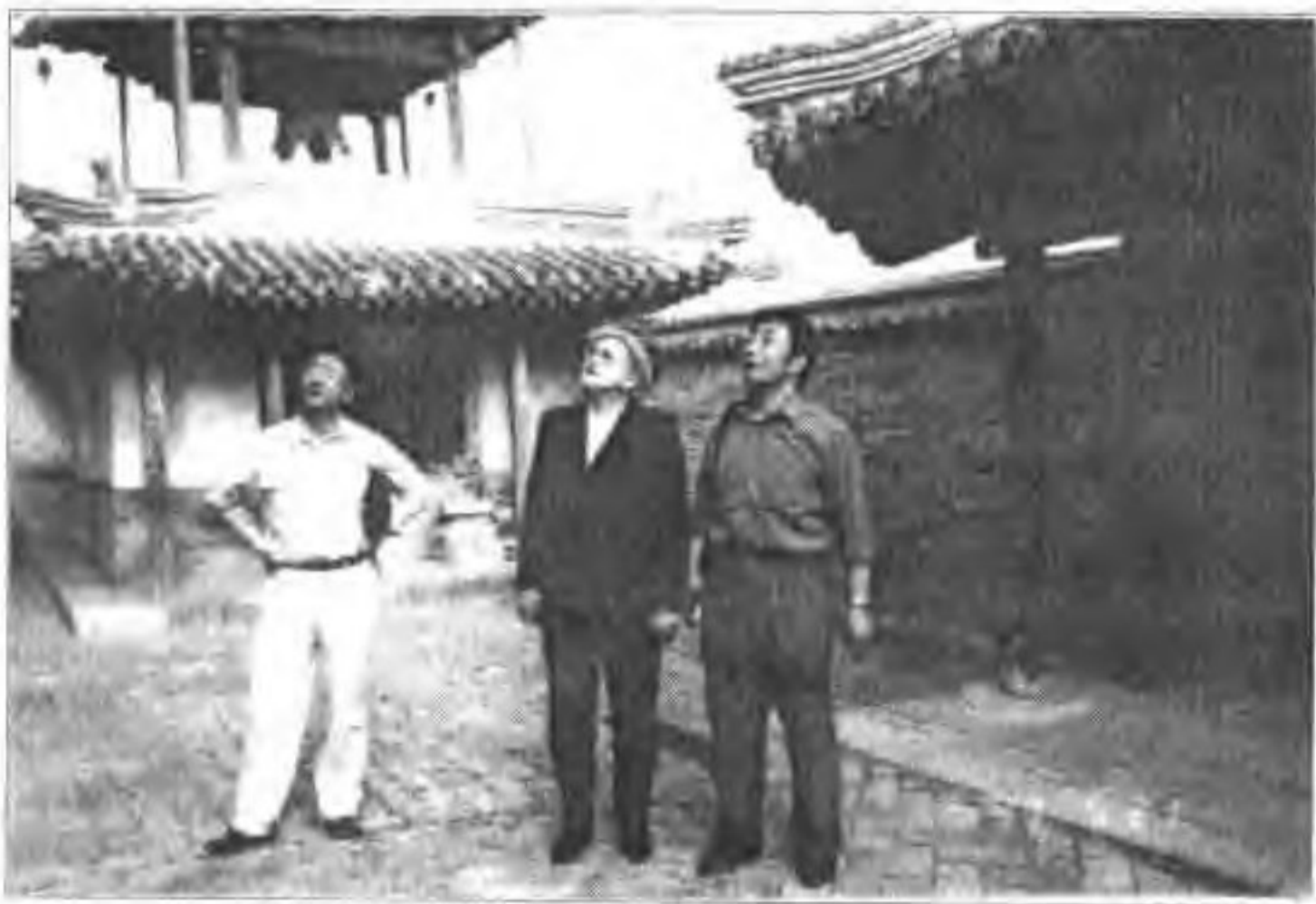
▲ 1999年5月21日乌克兰基辅大学文学院院长(中)在蔚县玉皇阁。