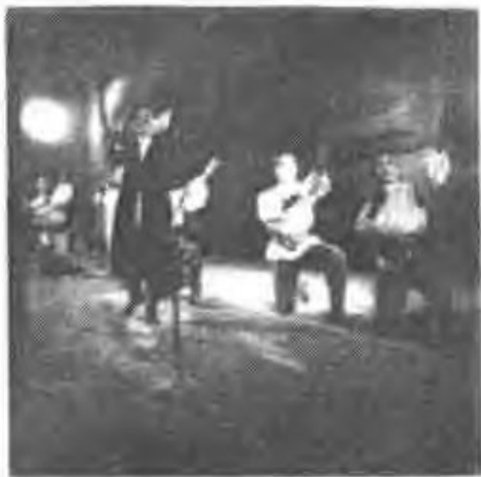
▲ 1973年9月，蔚县壶流河水库竣工，在西合营驻军体验生活的中国歌剧舞剧院到工地慰问演出。