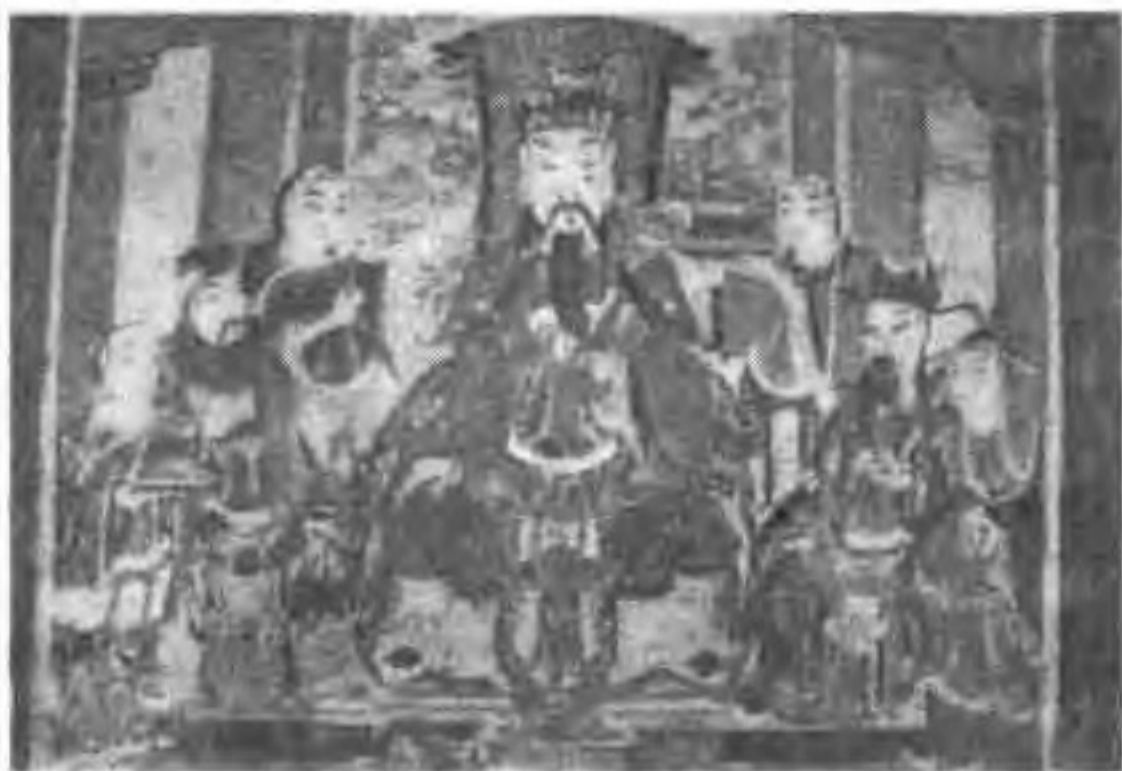
蔚县城李堡子六神庙壁画