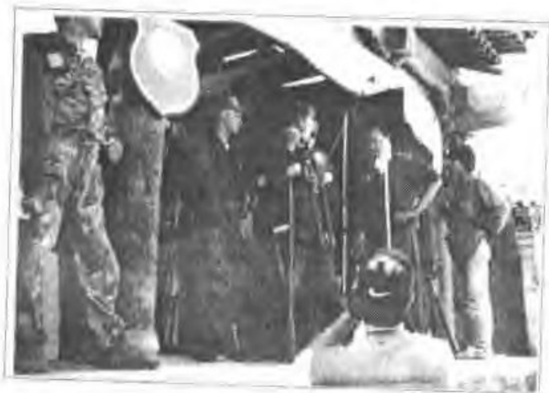
◀ 电影《鬼子来了》在蔚县 西古堡拍摄。图为著名导演姜 文(右二)给香港著名演员吴 大维(右三)说戏。