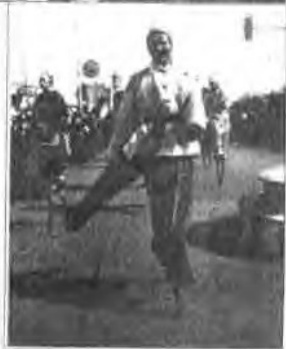
丰富多彩的蔚州社火