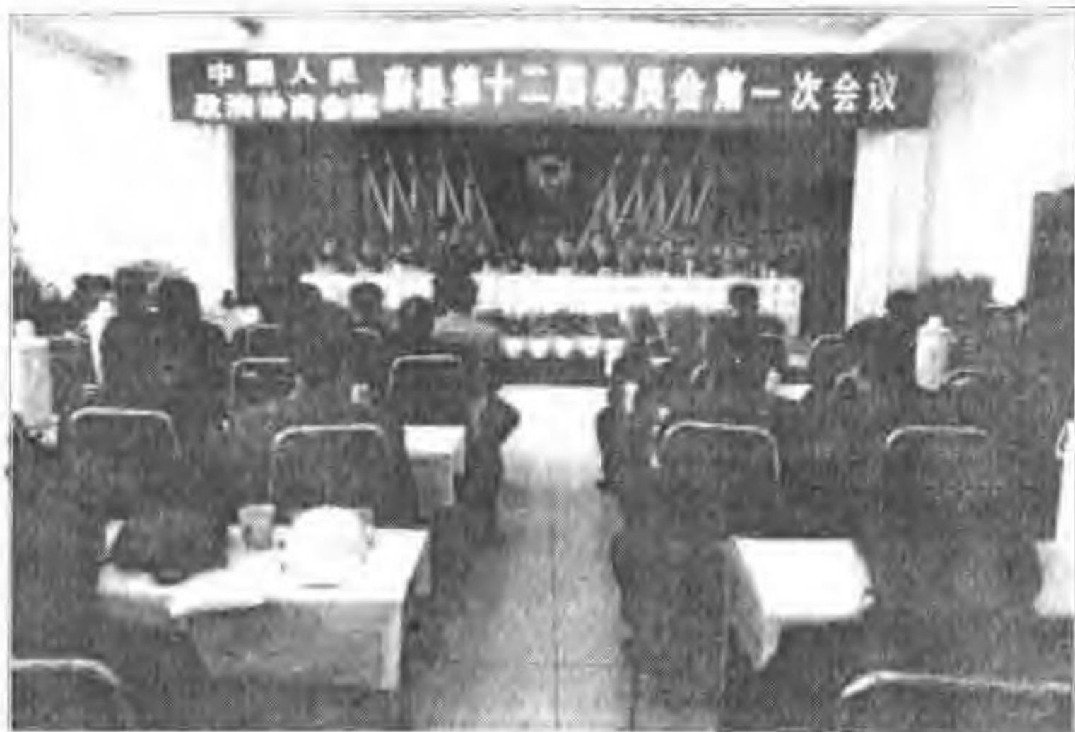
▲ 政协蔚县第十二届委员会第一次会议主席台