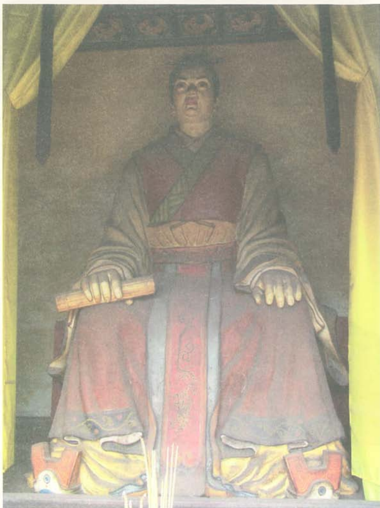
太原王氏始祖——太子晋王子乔