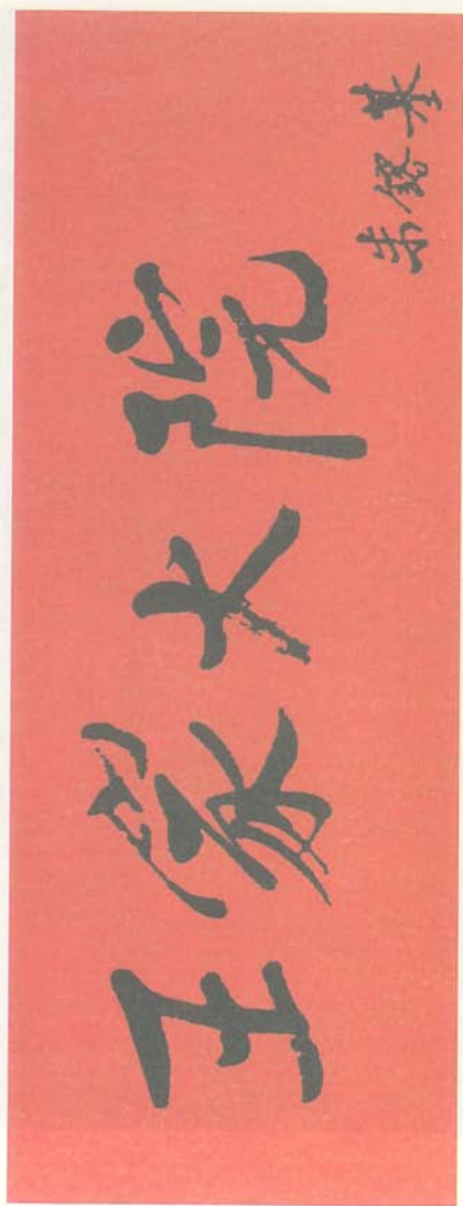
前国务院总理朱镕基题字