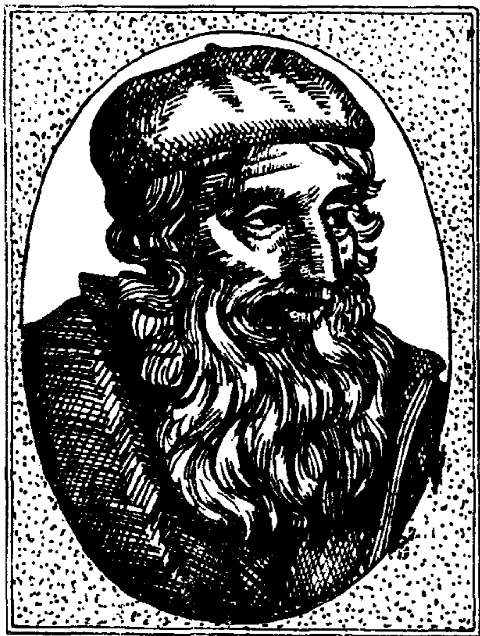
图5 约翰·威克里夫像

总之,在中世纪,教会同封建制度融为一体,人民要反对现存的社会制度,必须首先批判教会,剥去封建