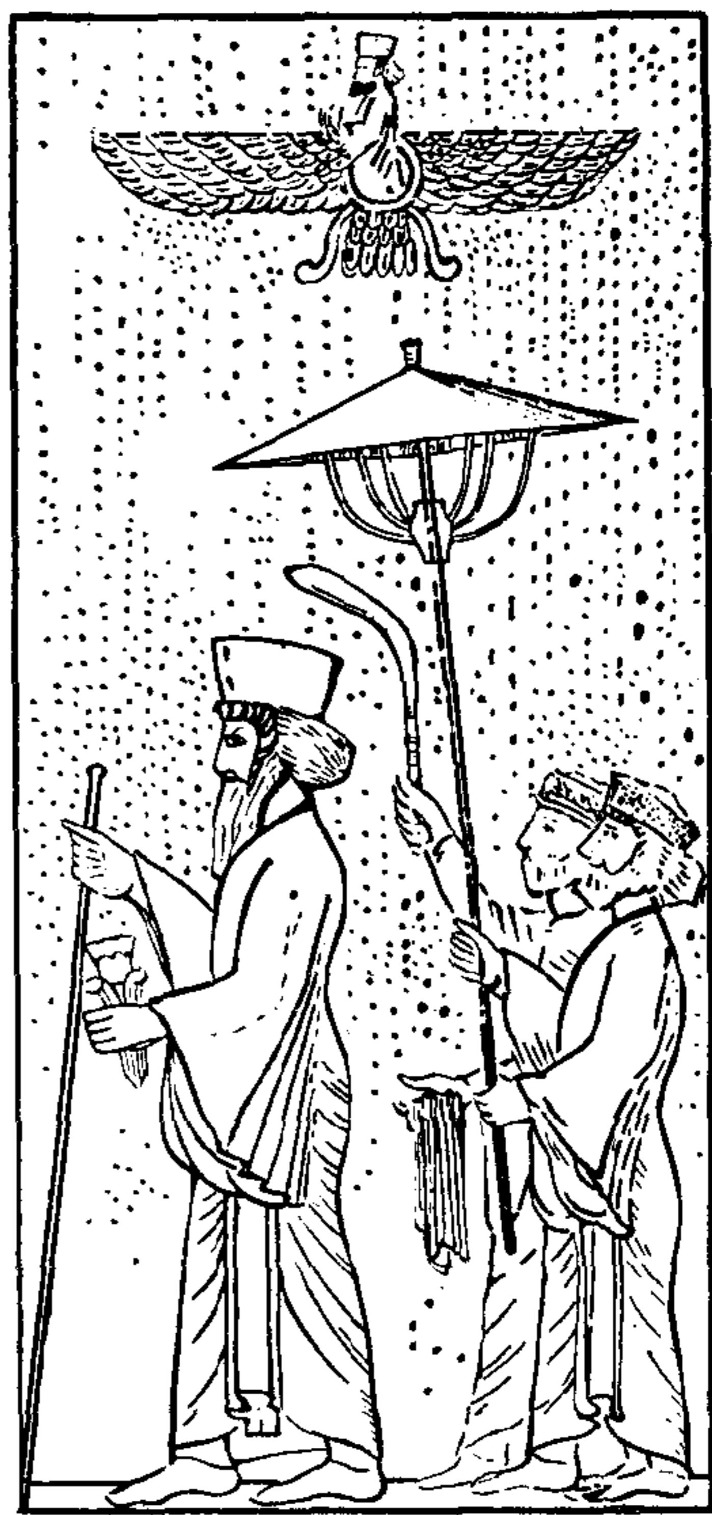
波斯皇帝大流士一世

到公元前六世纪末，波斯国王大流士一世（公元前521—485年）曾在政治、经济、军事等方面进行了一系列重大改革，客观上促进了波斯的经济的发展，加强了中央集权统治，使得波斯成为当时世界上最强大的奴隶制帝国。这个大帝国的疆域：东起印度河，西至爱琴海；北起高加索山，南至印度洋，地跨欧、亚、非三洲，统治着许多国家和部族。大流士一世曾得意地自称为“全部大陆的君主”。