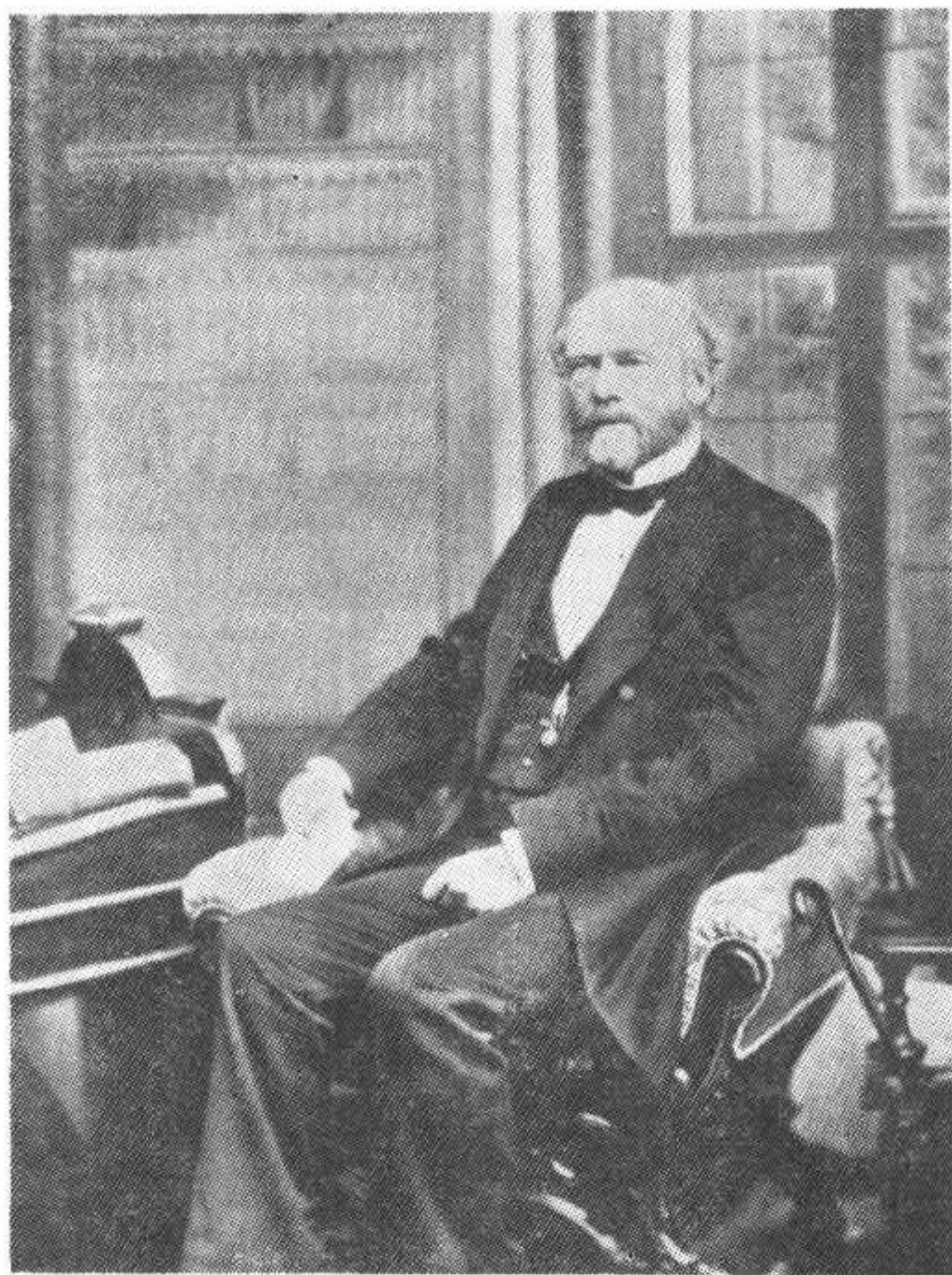
路易斯·亨利·摩尔根