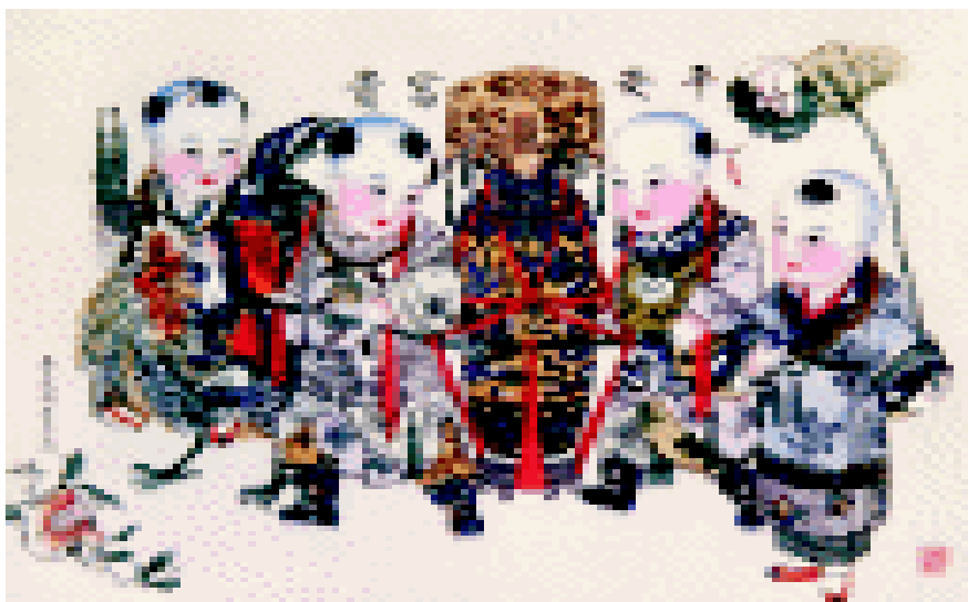
平安富贵（杨柳青年画）

除夕主要是辞旧岁，迎新年。当天民间有贴门神、春联，挂挂签的风俗，在祖先牌位前摆好供品，烧香点烛。家里人要穿上新衣，准备鞭炮，主妇则准备好饭菜。