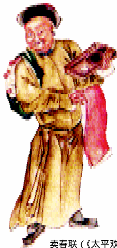
卖春联（《太平欢乐图》）

迎新年的活动，远在腊八后就开始了，如买年货、写对联、做年糕等。无论过节还是喜庆，都祈求富贵平安、亲人团聚。春节更不例外，外出者纷