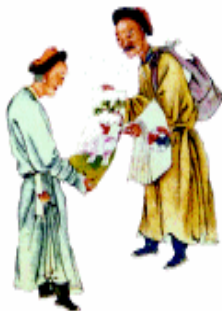
卖年画（《太平欢乐图》）