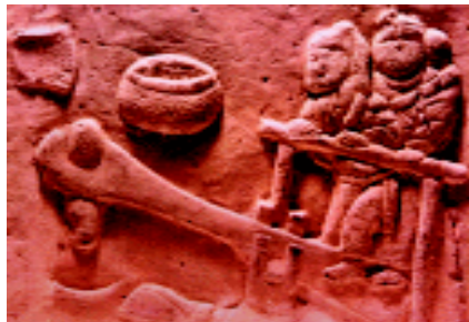
舂米（宋代宁夏泾源砖雕）

人则到集镇办年货。《春明采风志》记载了置办年货的种类：“琉璃、铁丝、油彩、转沙、碰丝、走马，风筝、毽毛、口琴、纸牌、拈圆棋、升官图、江米人、太平鼓、响葫芦、琉璃喇叭，率皆童玩之物也，买办一切，谓之忙年。”由此可见，置办年货是忙年的重要一环。