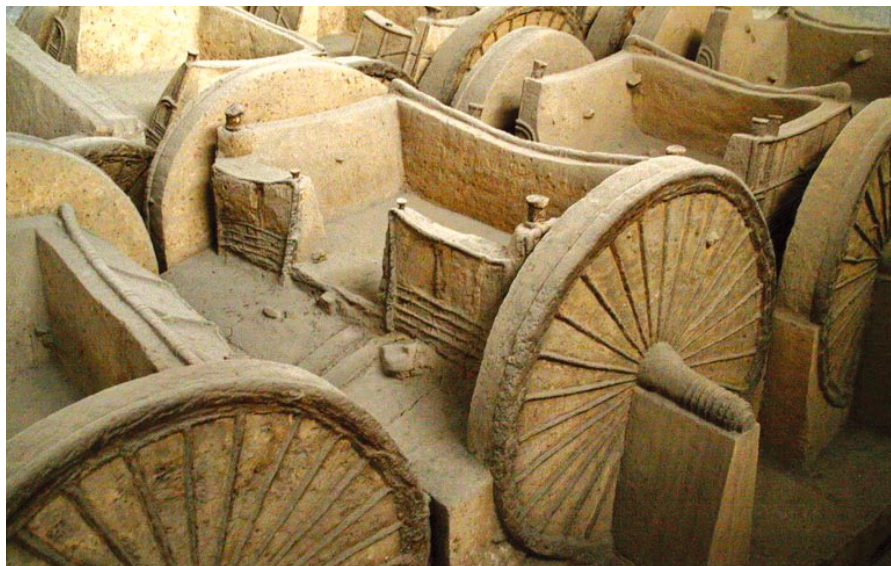
◎ 赵简子墓中出土的车战阵

赵简子觉得是自己的使臣失礼，忙派人前去道歉并要求重新结盟，卫灵公正在气头上，便断然拒绝。为了发泄心头的不满，又率兵攻打晋国的邯郸城。