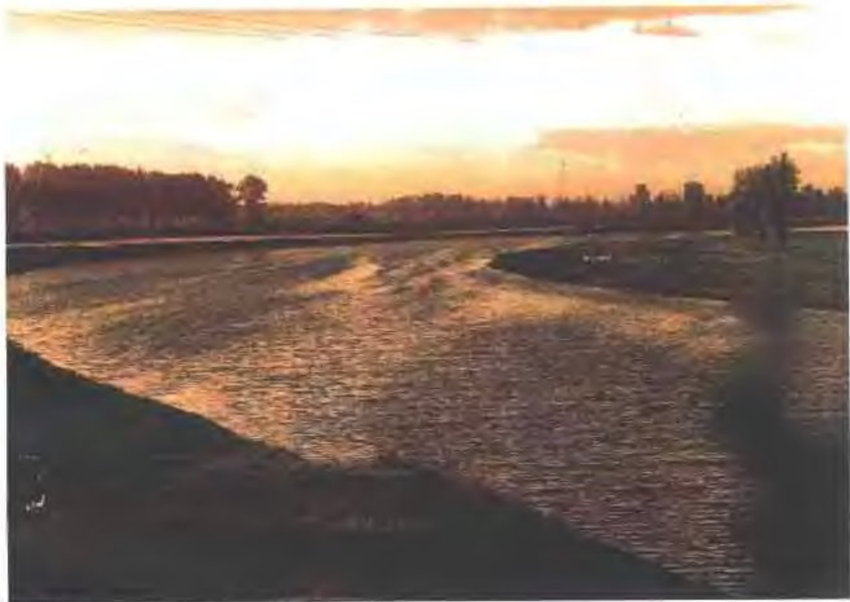
贯通祖国南北的京杭大运河通州源头