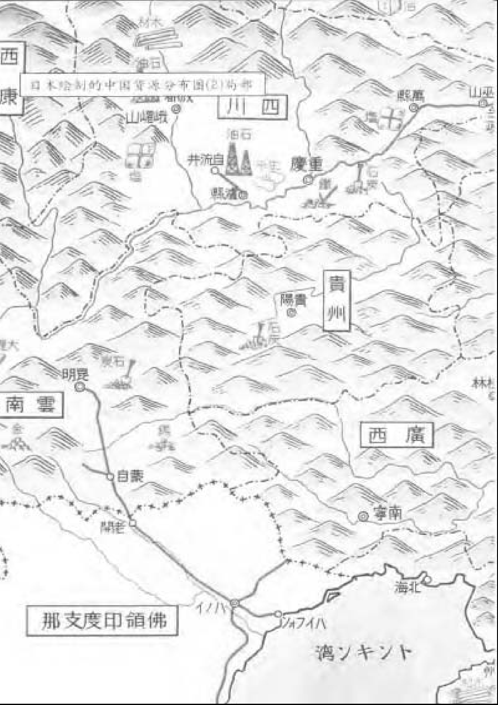
日本繪制的中国資源分布圖(2)南部