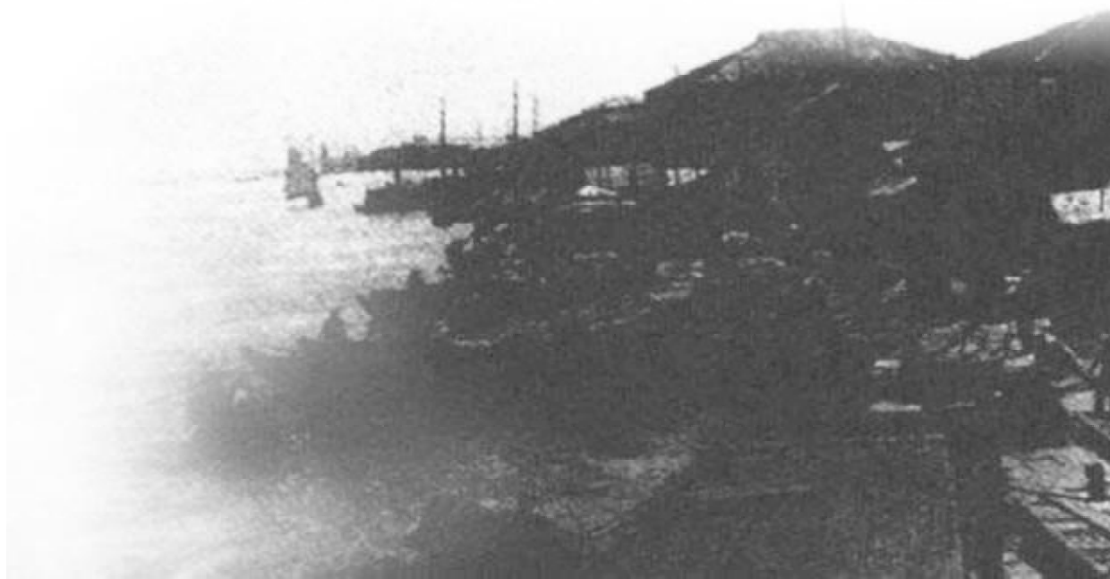
晚清武汉，长江与汉水交汇处码头与船舶。