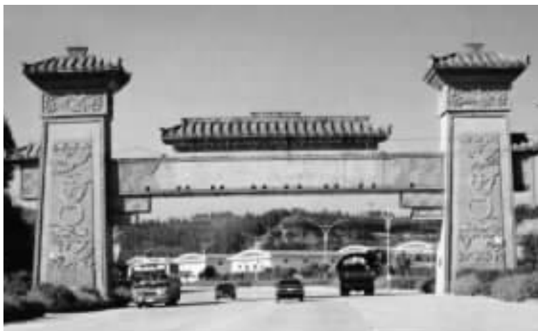
蓬安相如故里门阙