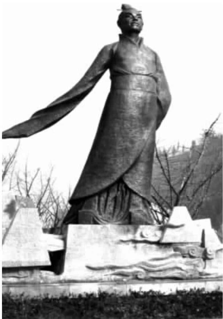
蓬安相如公园里的相如塑像