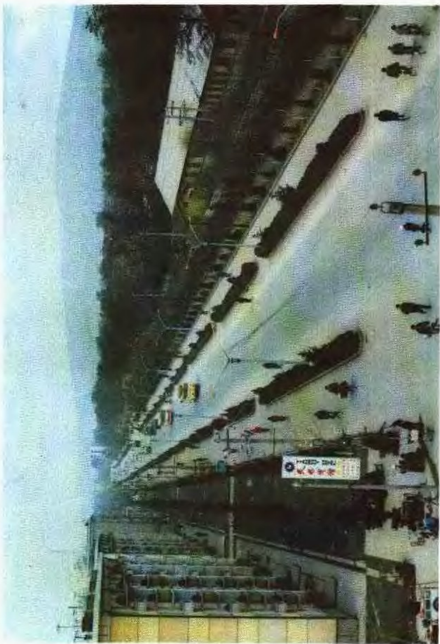
新建的天水市岷山路