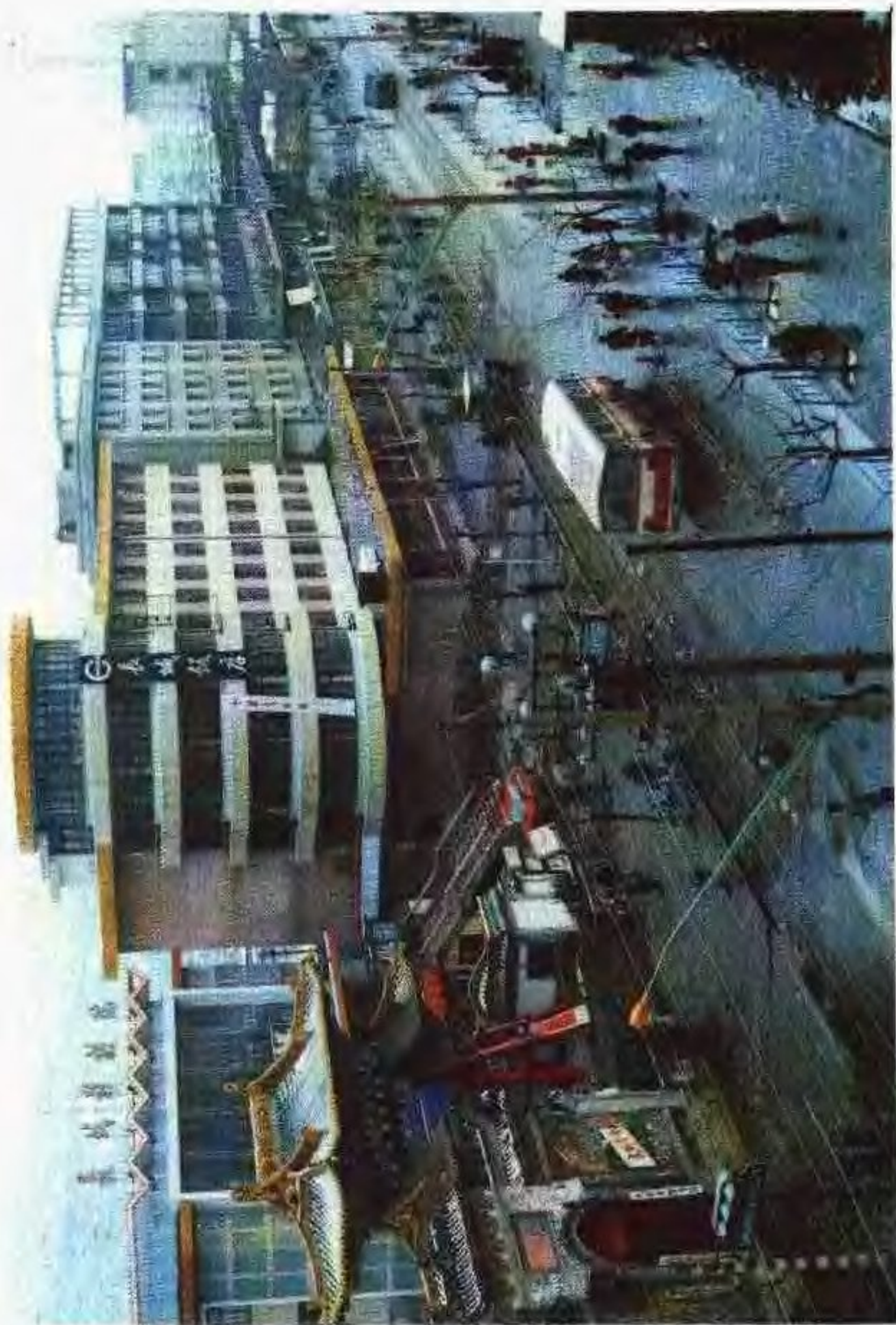
新建的天水市民主东路