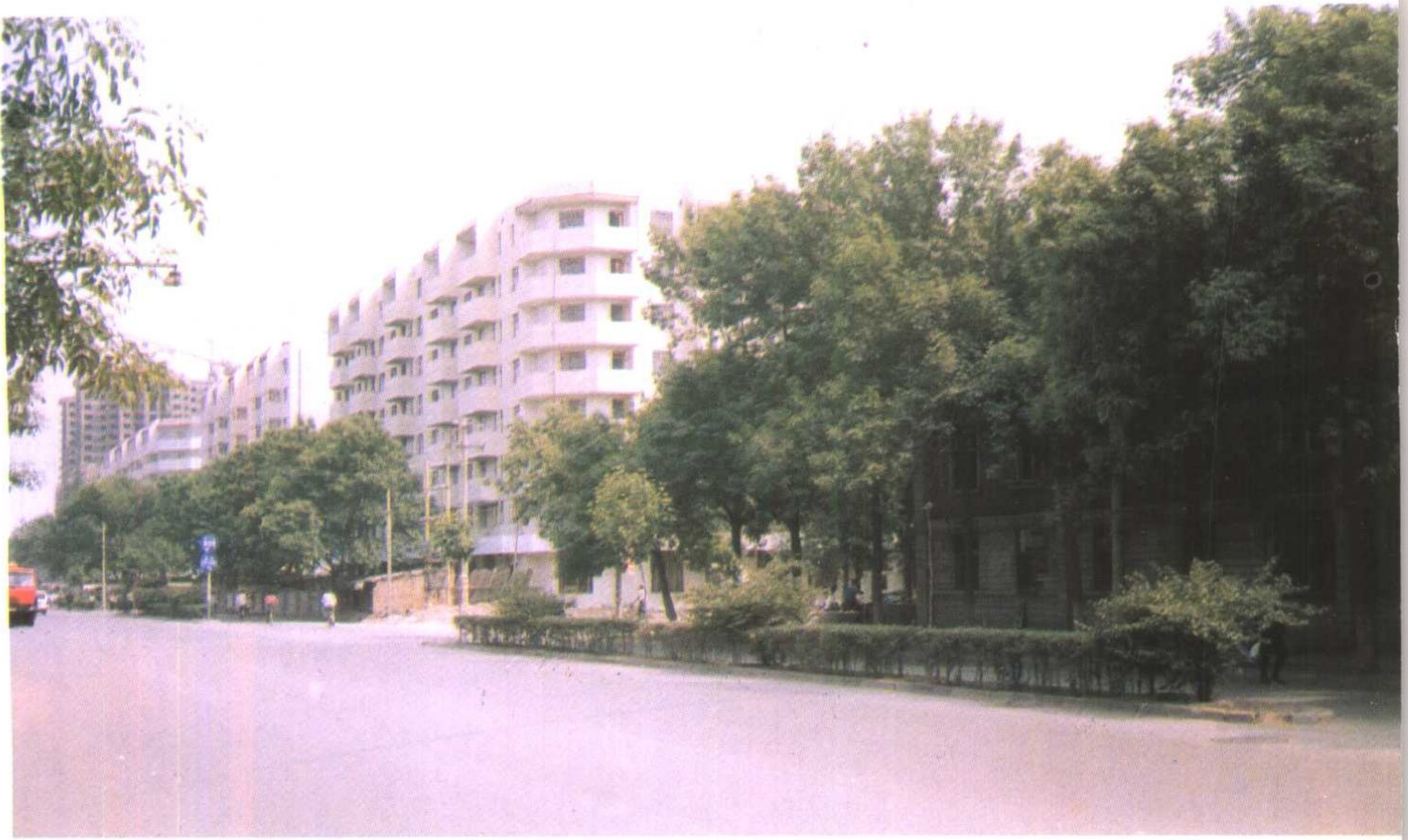
改造后的丁字沽一、二、五段居民区