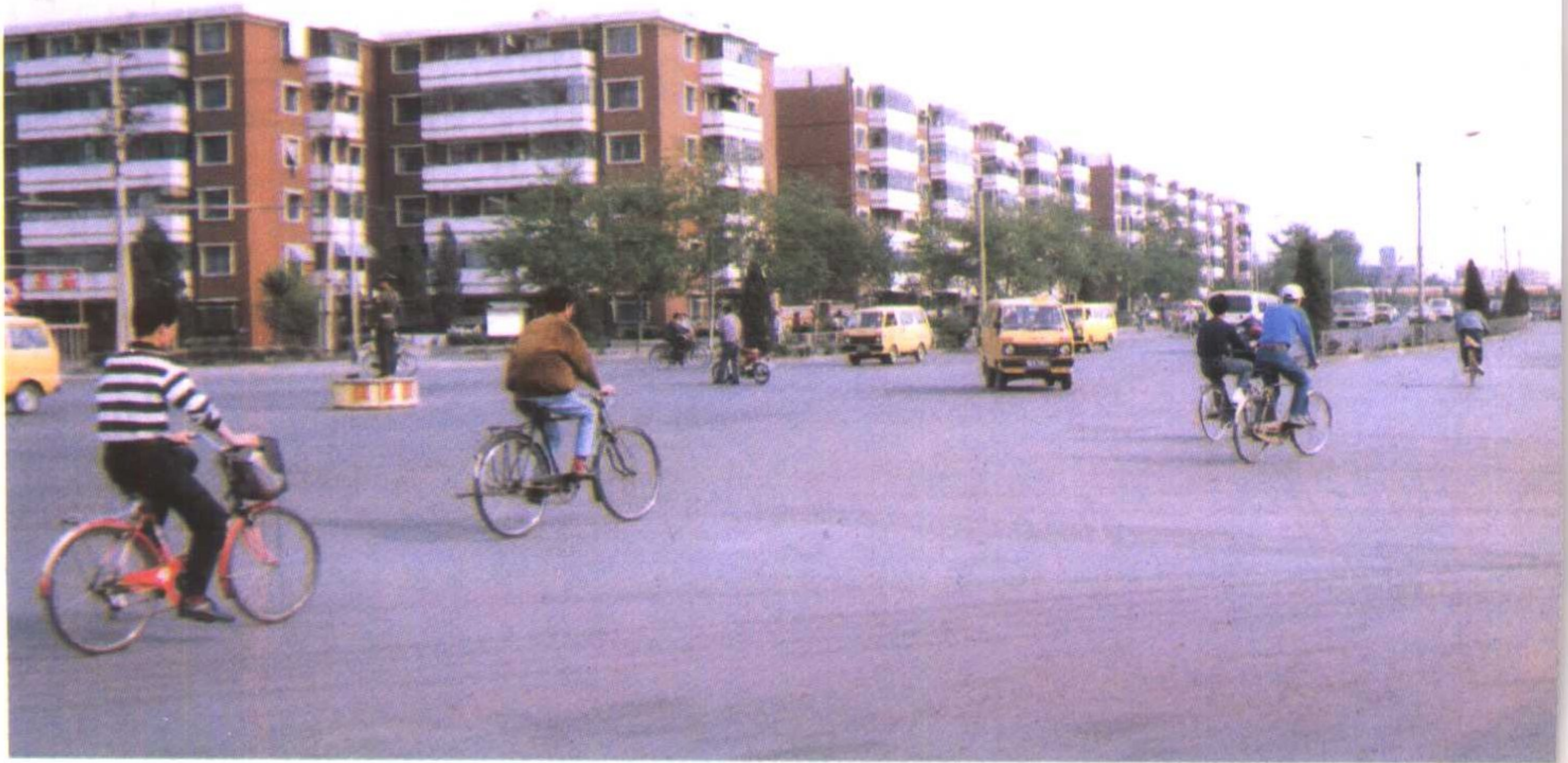
西沽湘潭里居民区