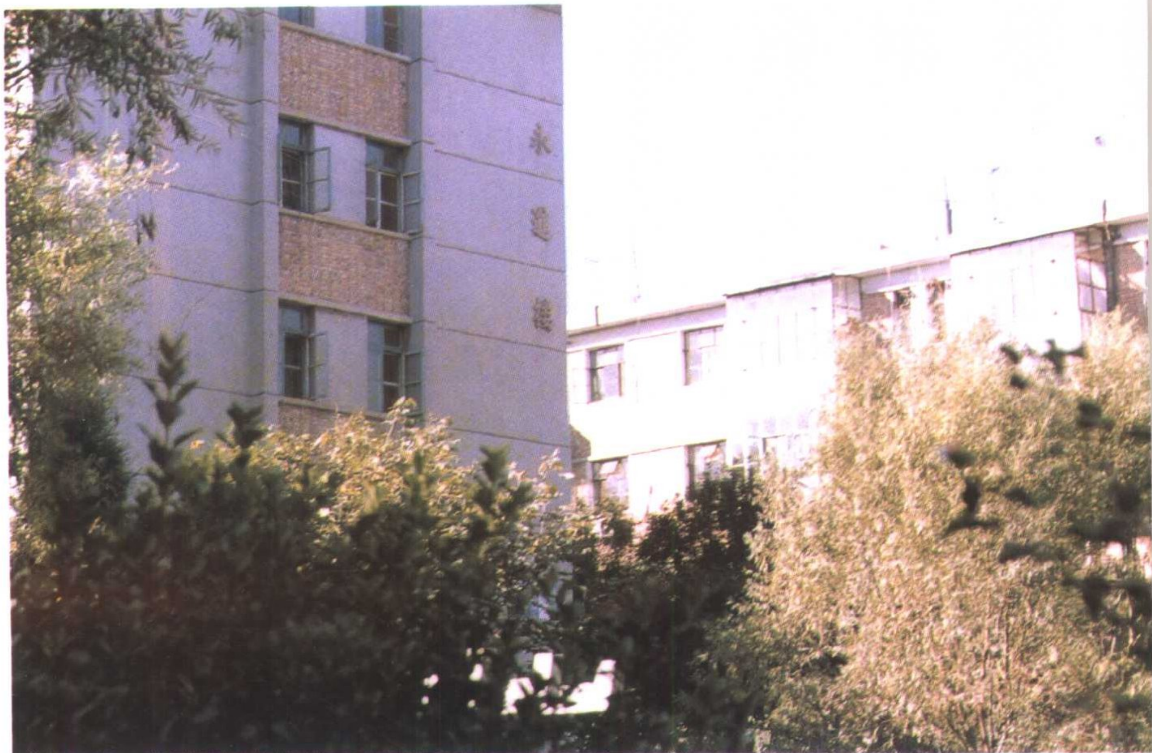
咸阳北路住宅小区