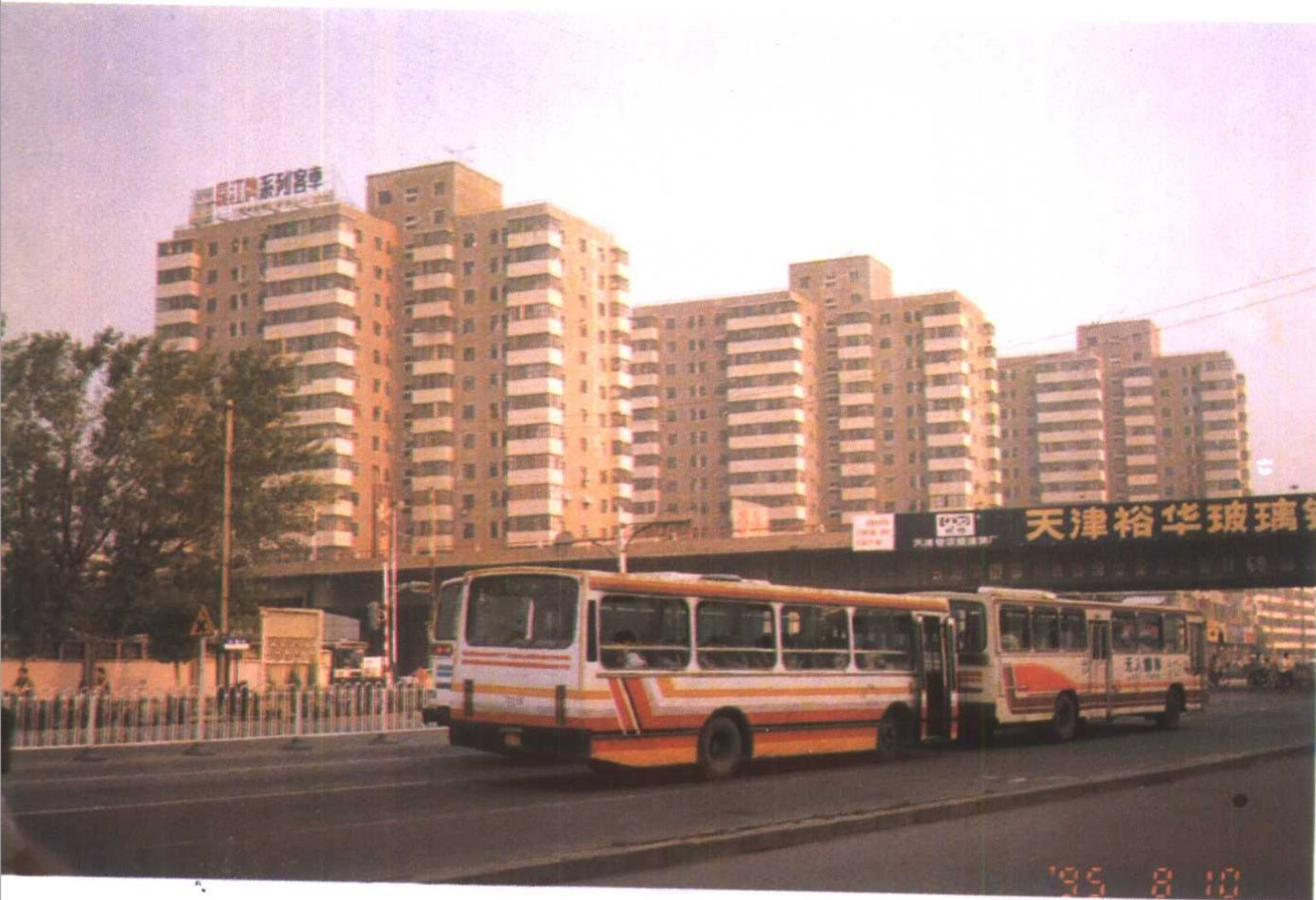
西青道高层住宅楼