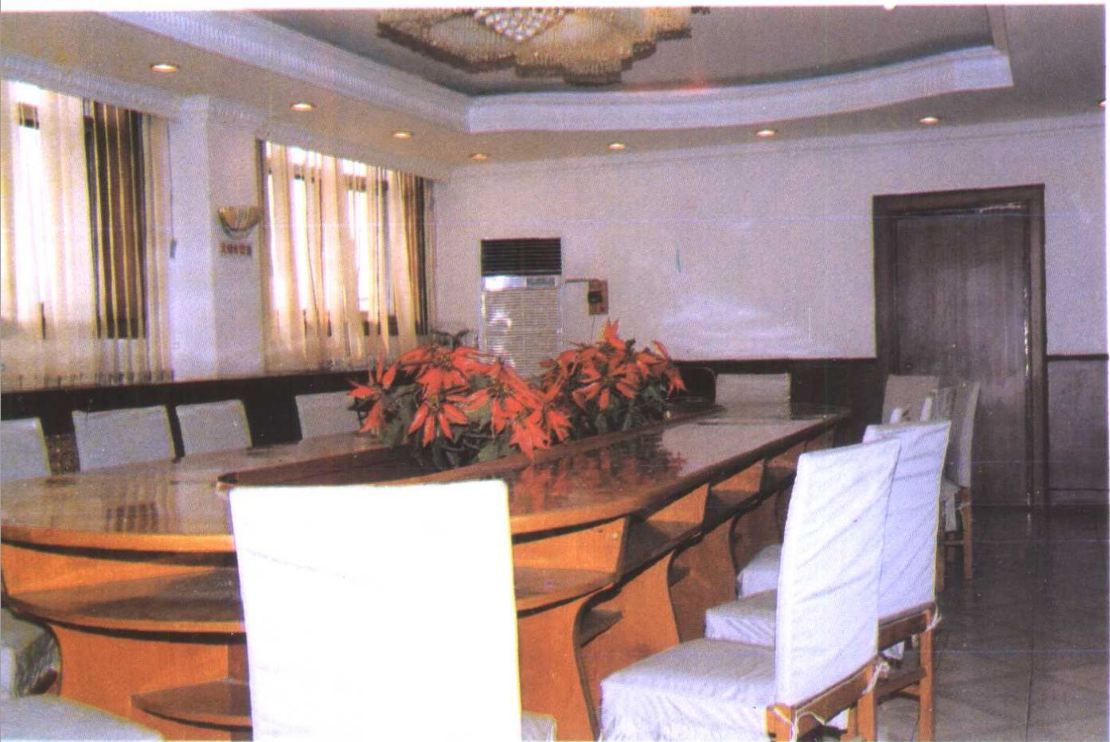
区房产总公司五楼会议室