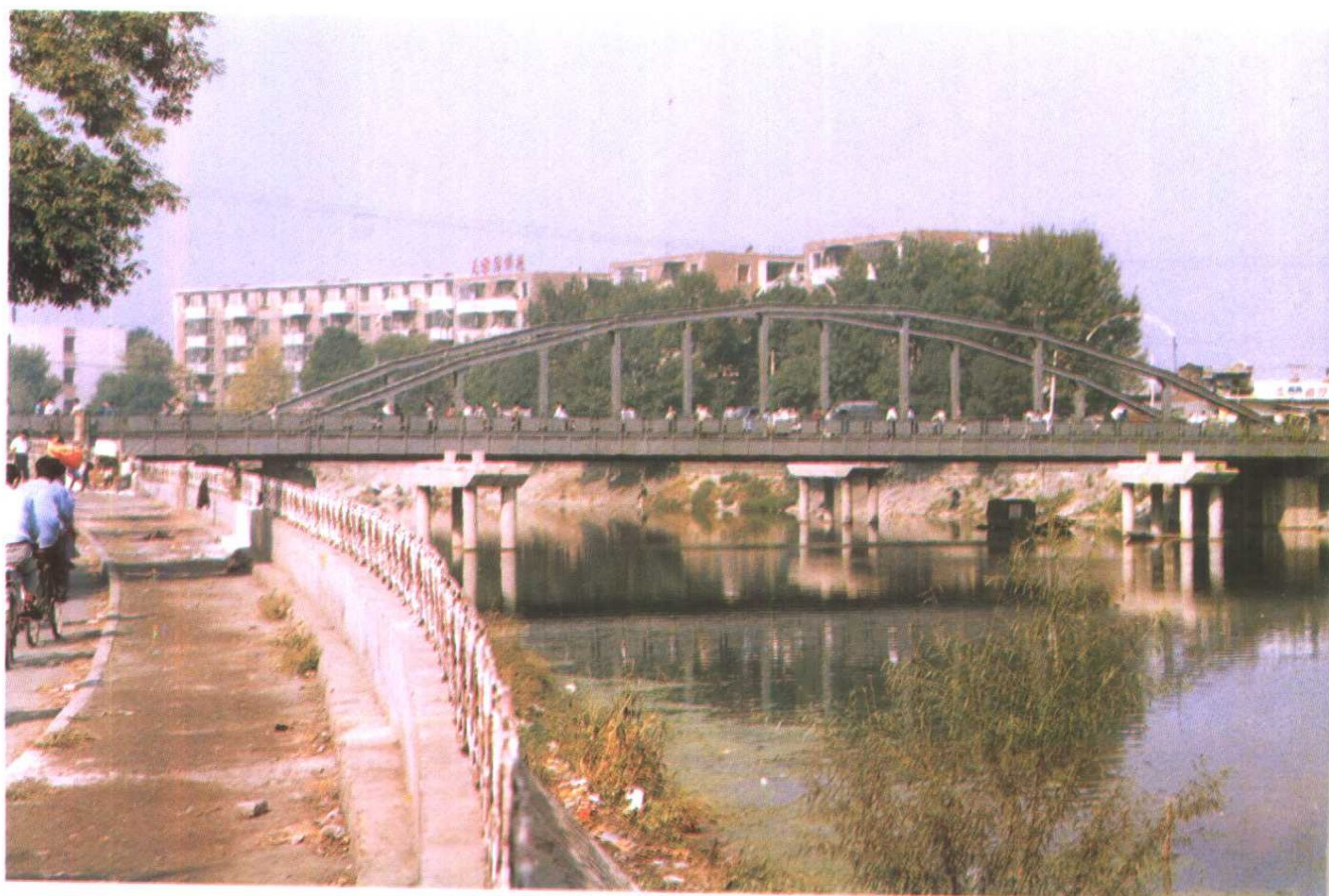
大红桥——红桥区以此得名