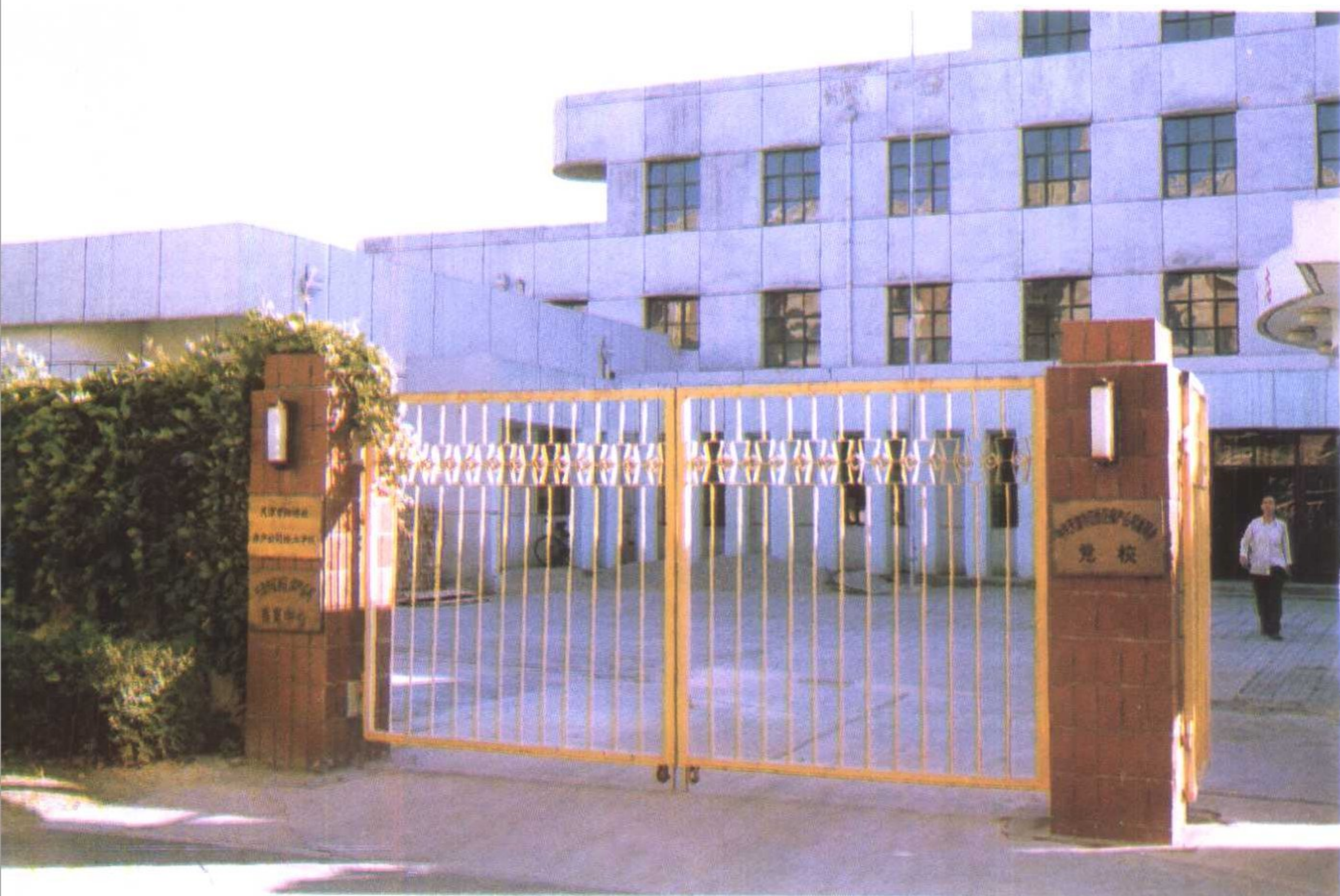
区房产总公司技工学校