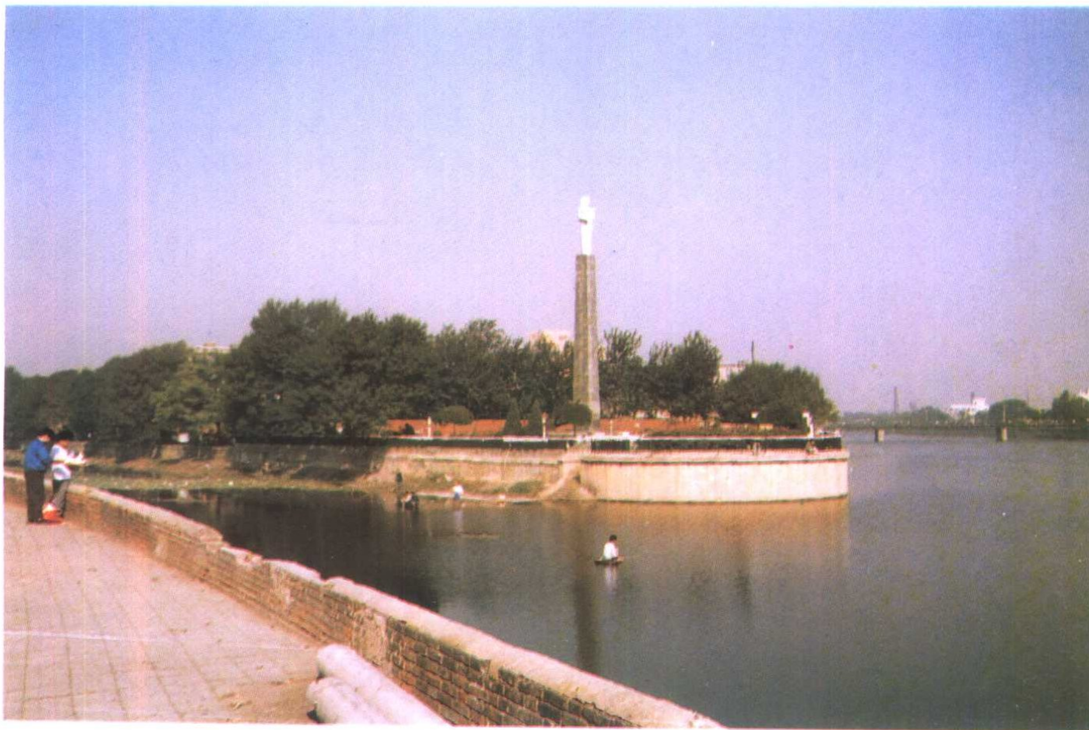
三岔河口——天津市发祥地