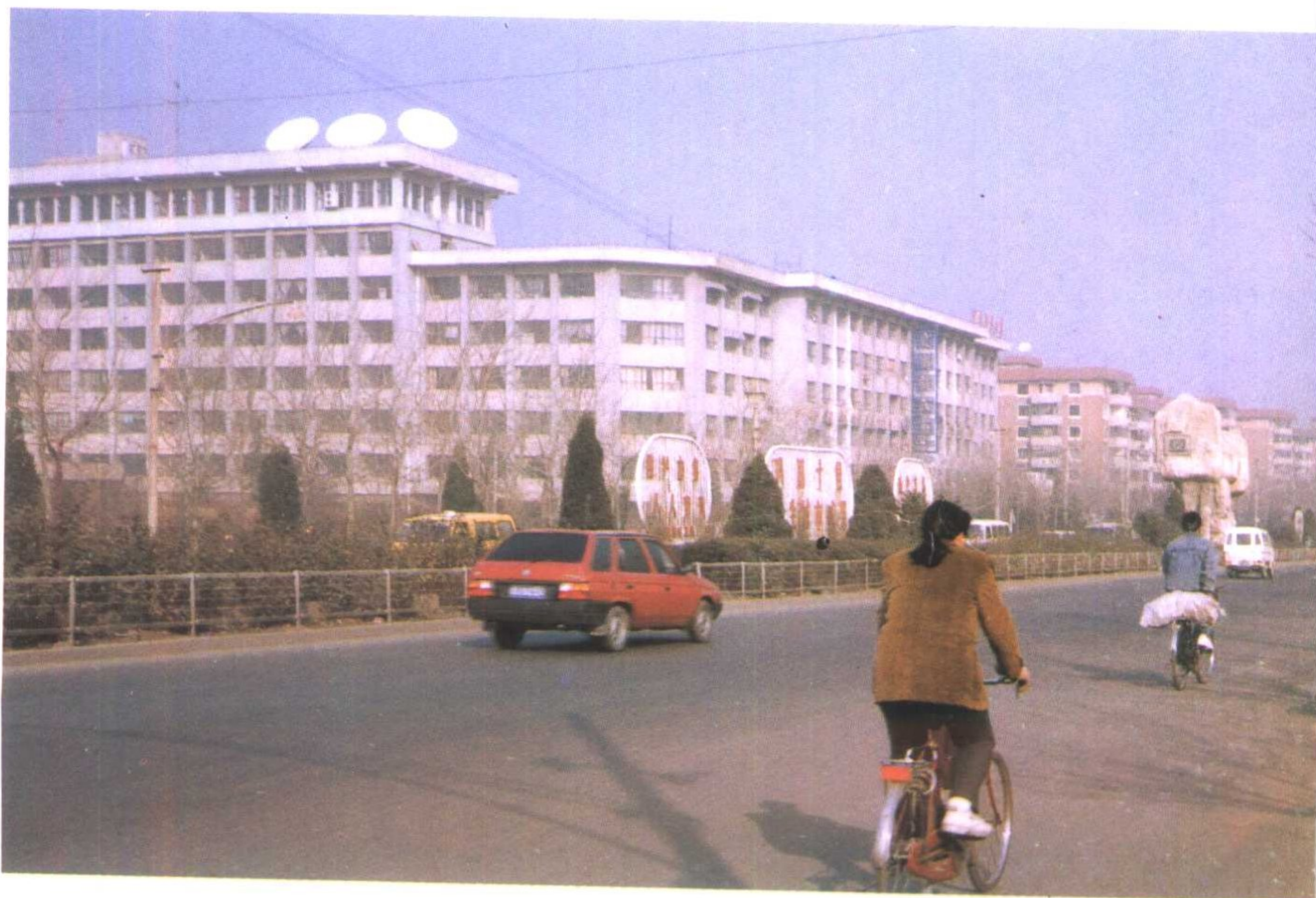
红桥区人民政府大楼