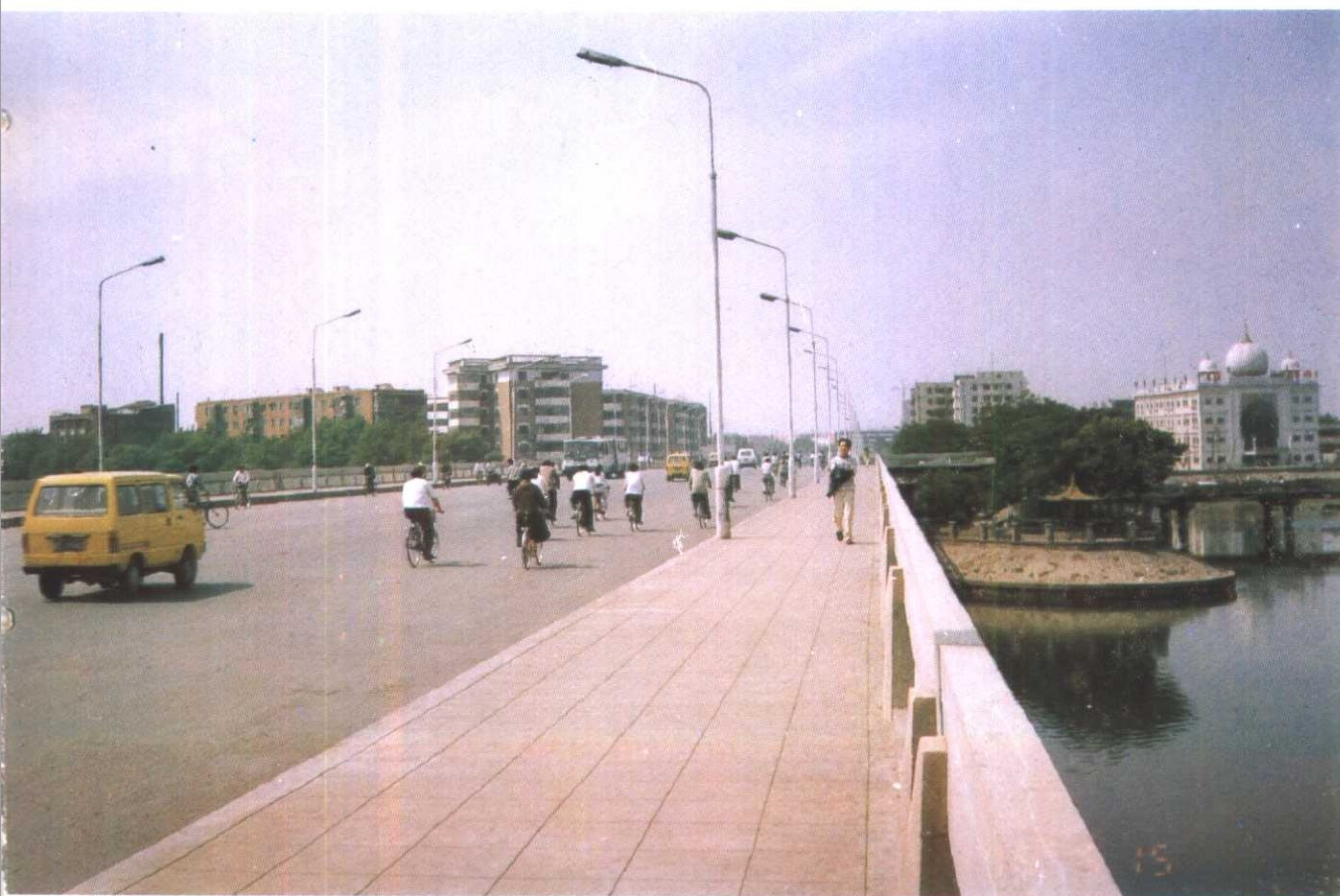
新红桥及房屋建筑