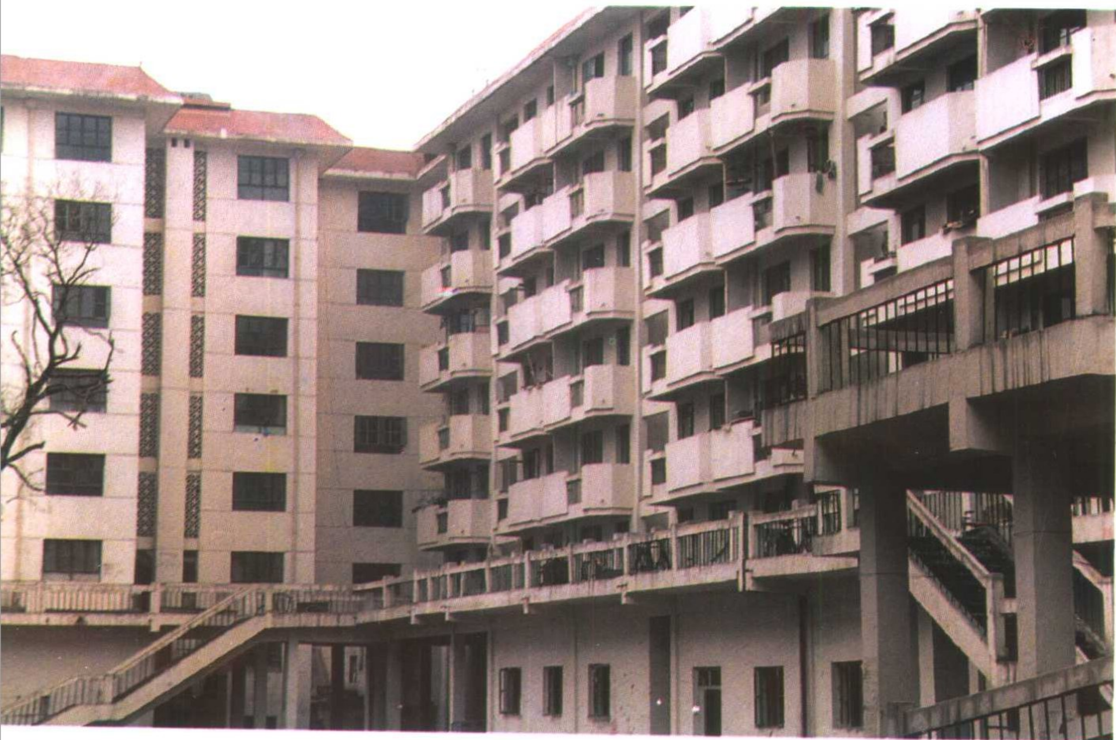
改造后的西关北里居民区