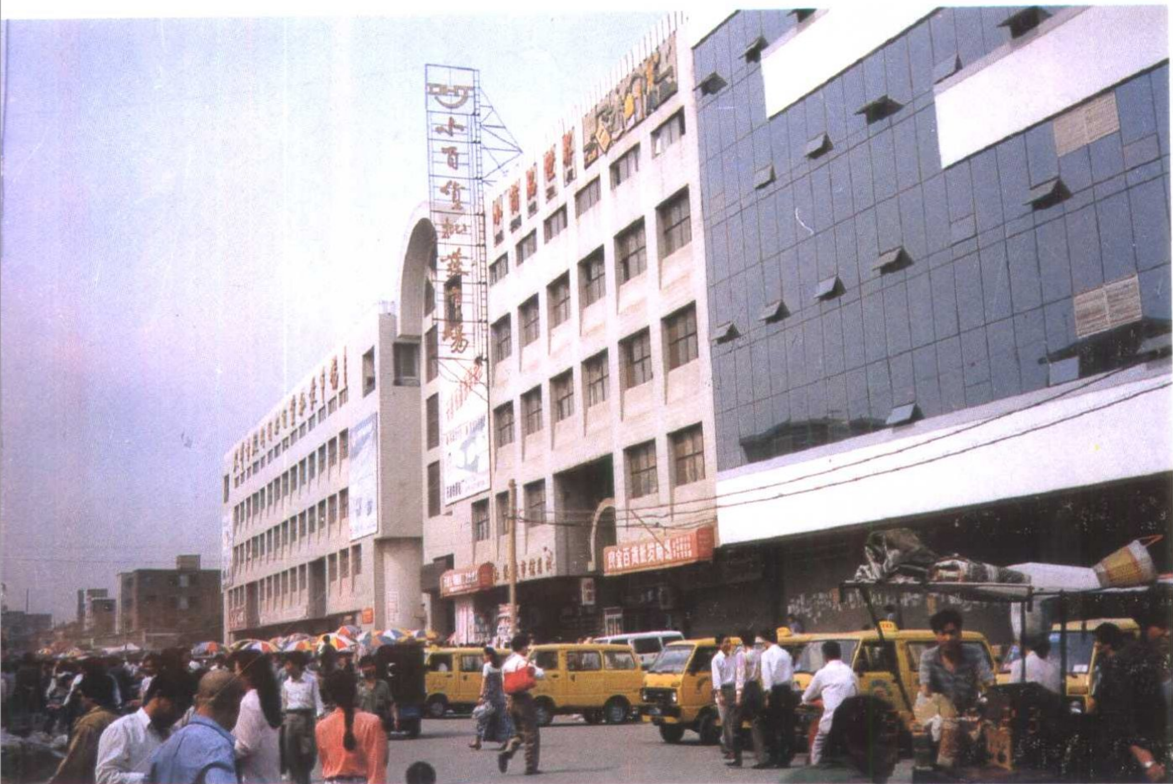
辐射三北地区的小百货批发市场