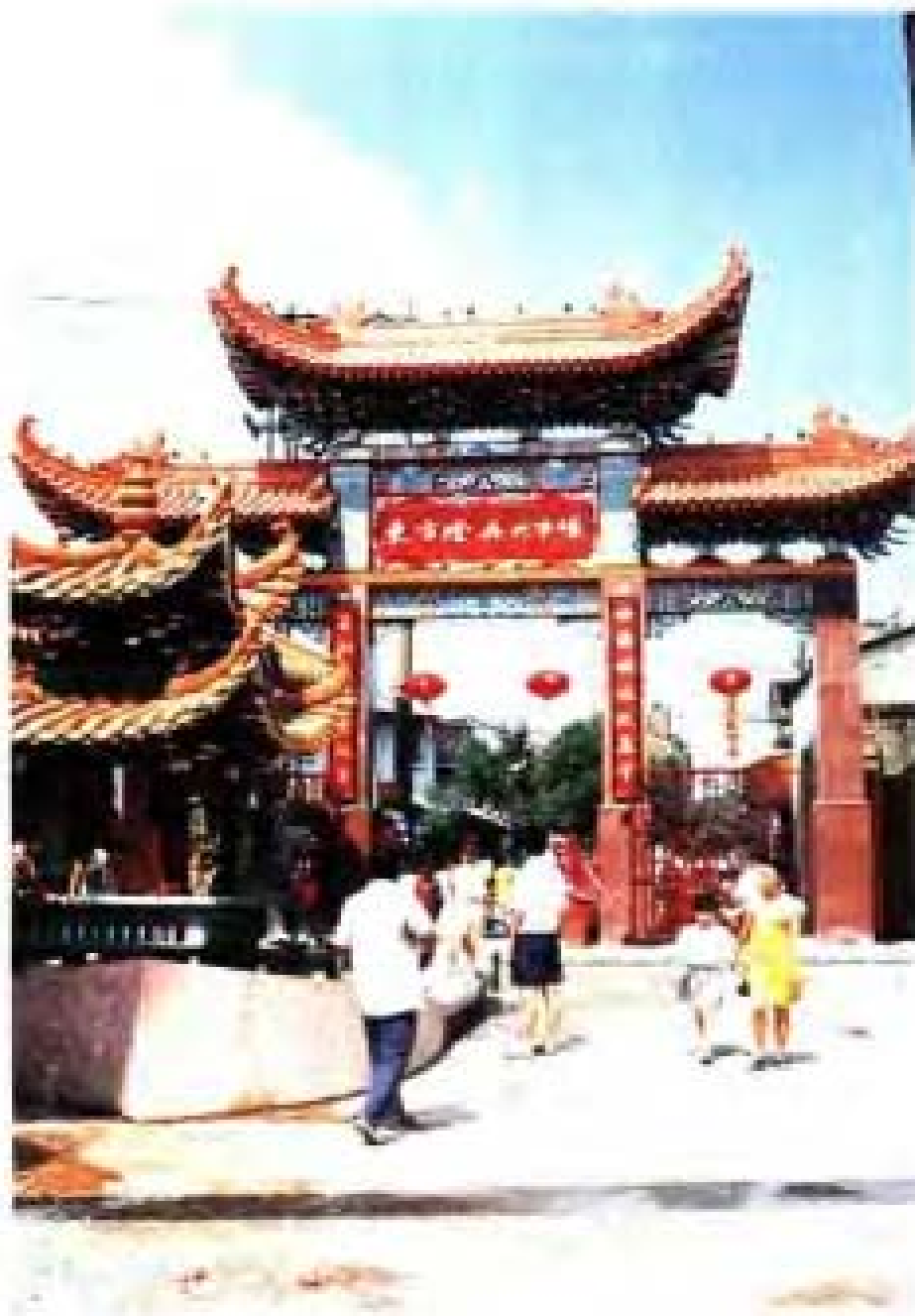
浙江東方集團公司於 1993 年創辦的東方燈具大市場