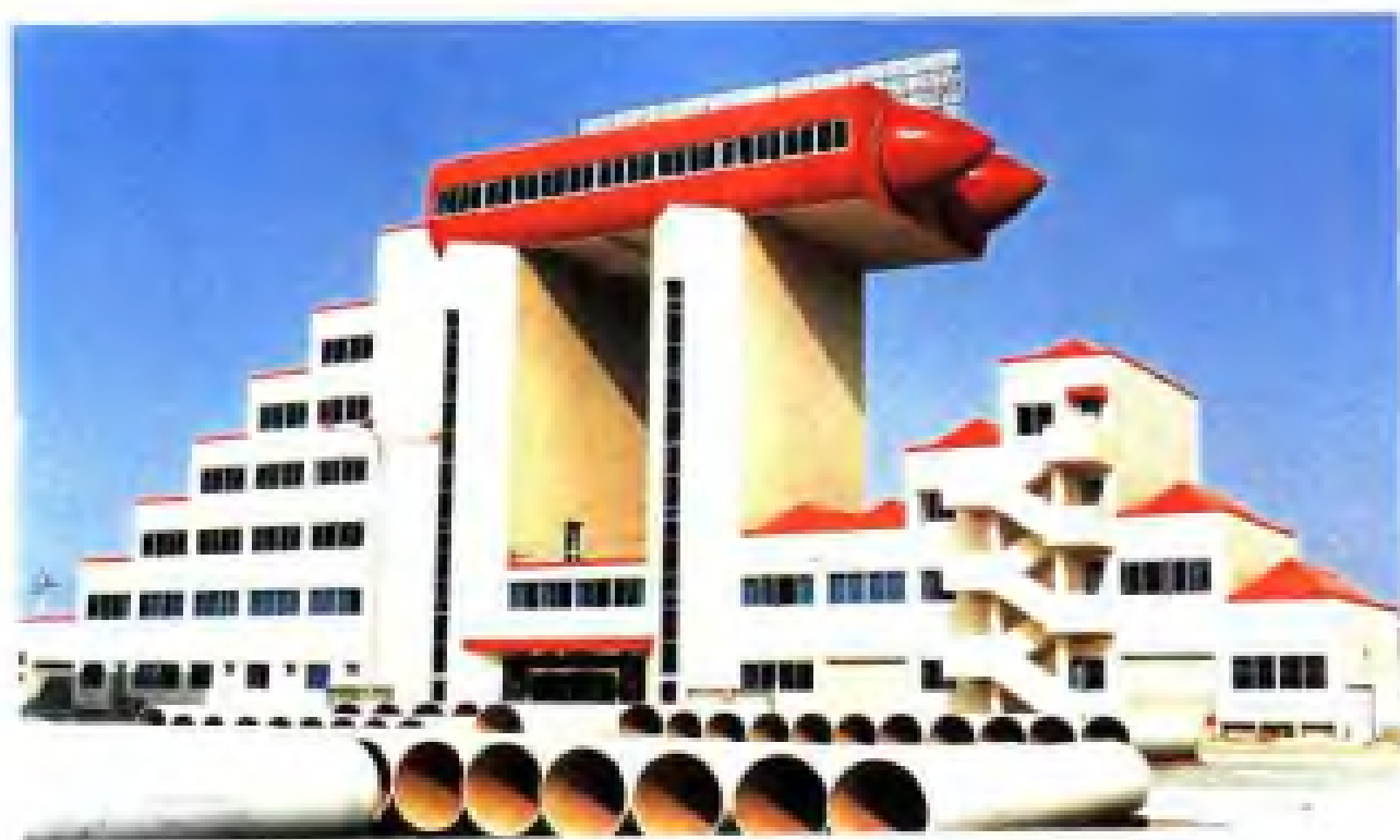
浙江东方集团管道公司