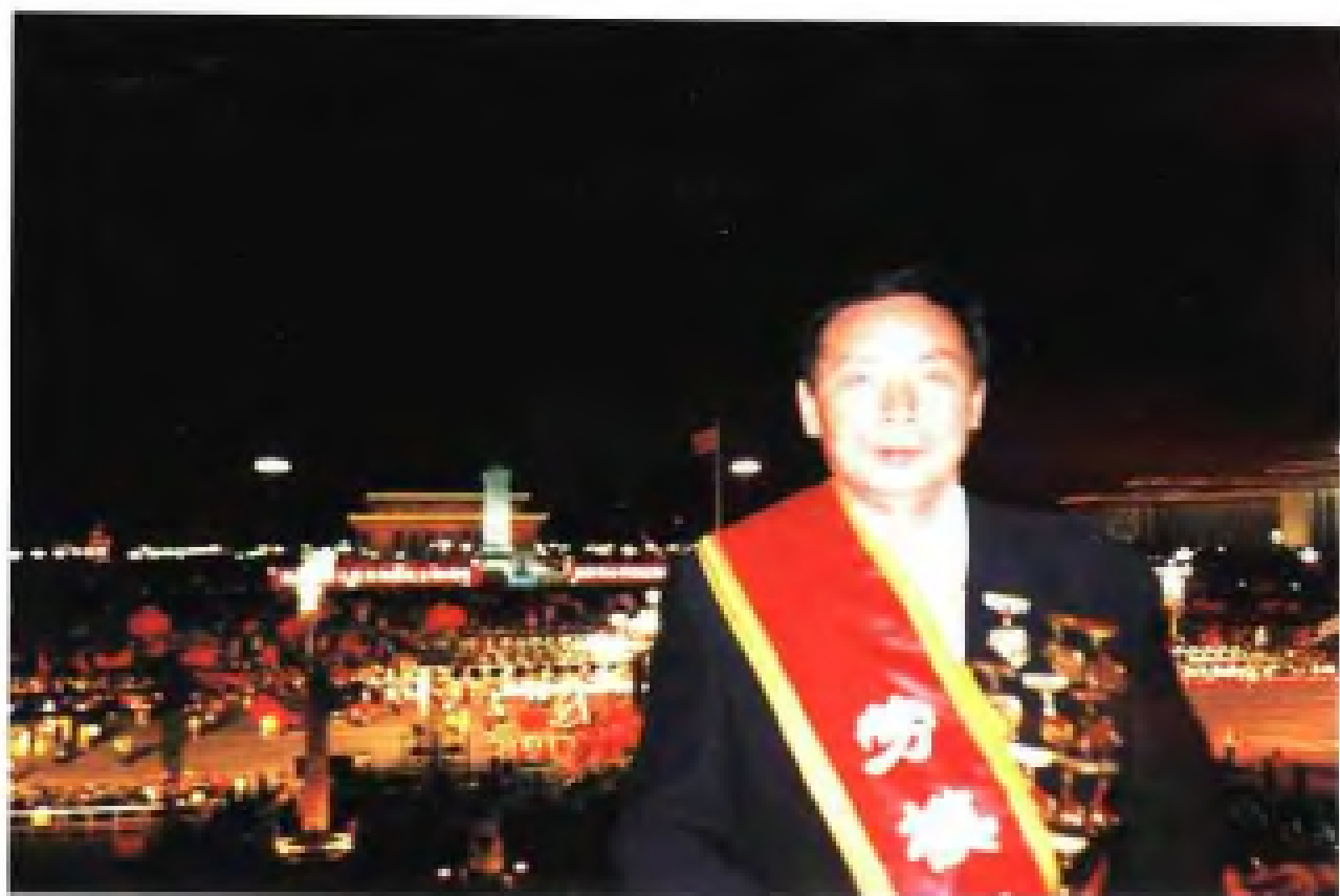
国庆五十周年，滕增寿同志登上天安门城楼观看群众联欢晚会