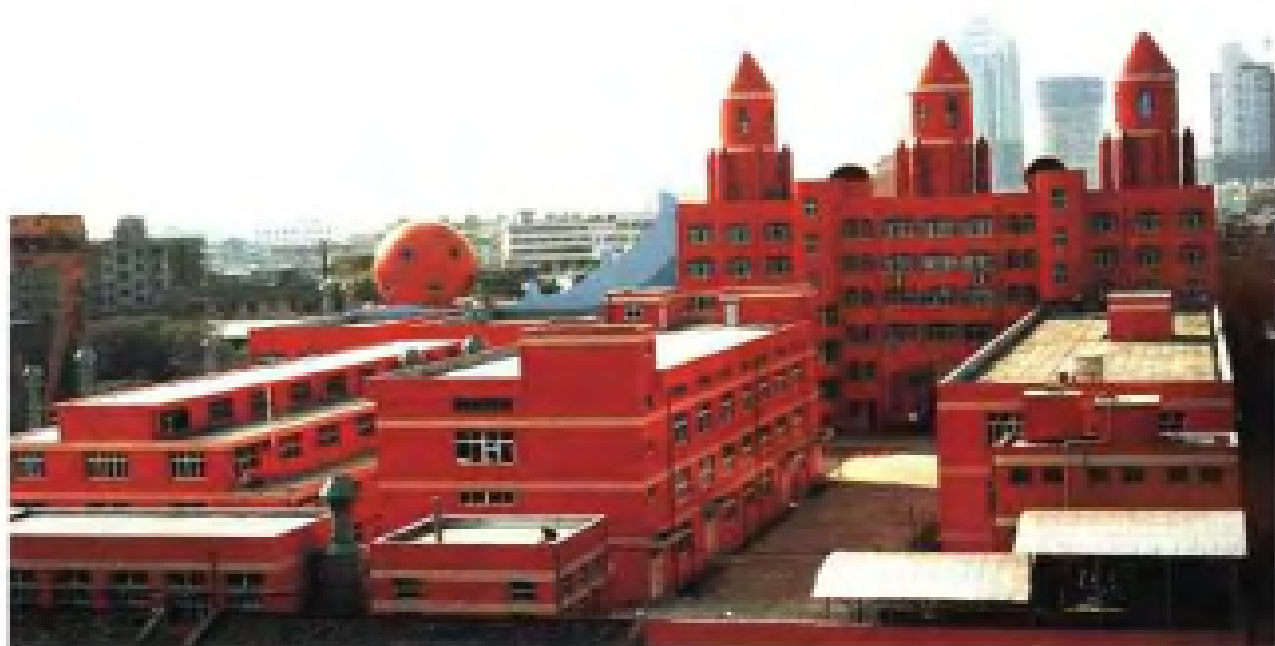
浙江东方集团电镀公司