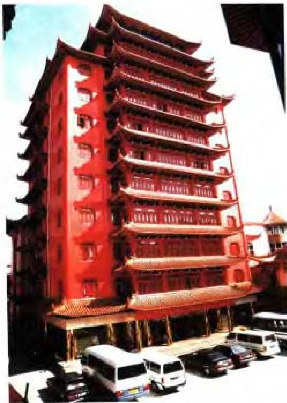
浙江东方集团公司办公大楼