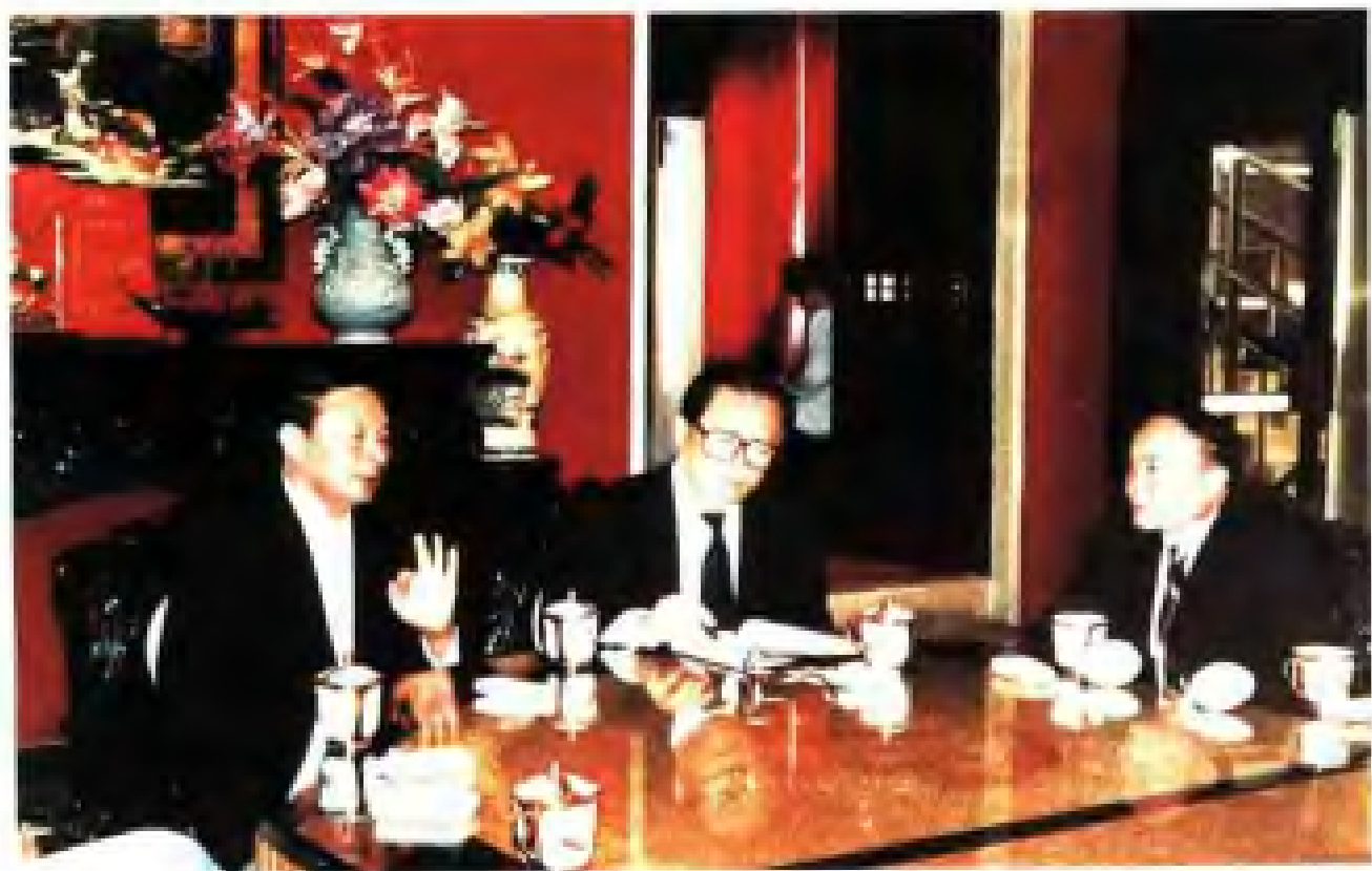
滕增寿同志向江泽民总书记汇报工作