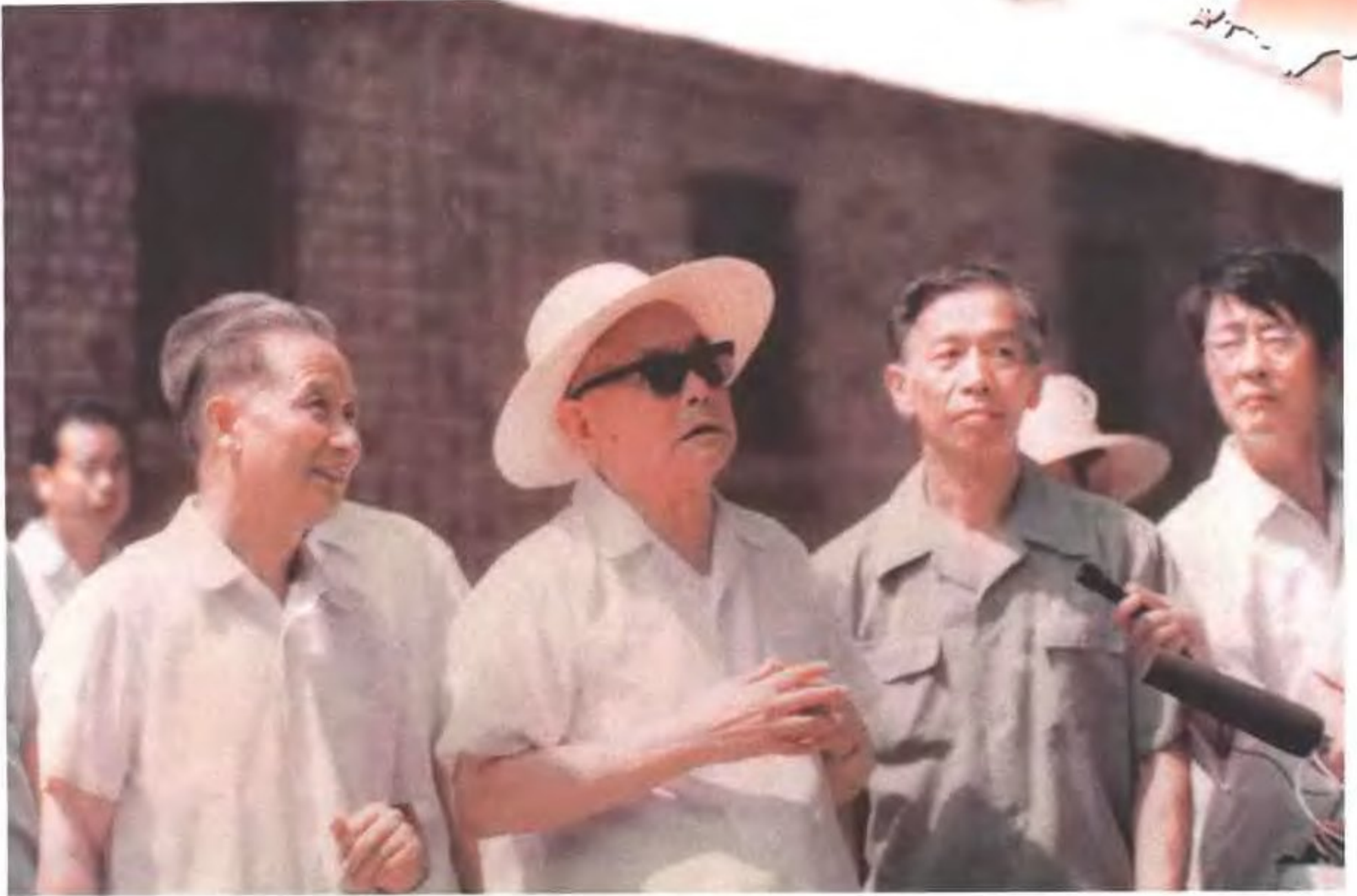
1984年8月5日,李先念主席视察唐山工程技术学院地震遗址。