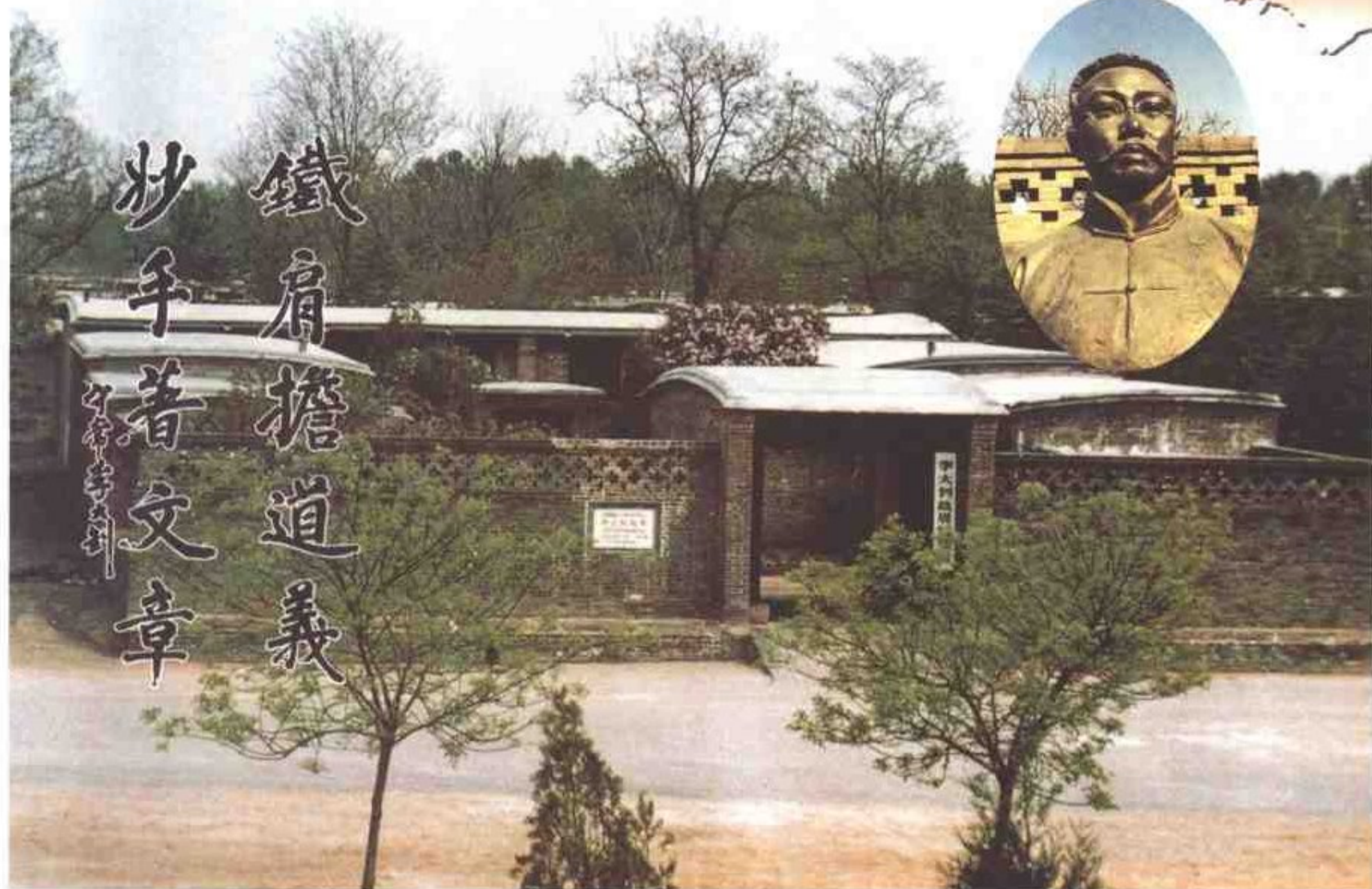
中国共产党创始人之一李大钊的故居