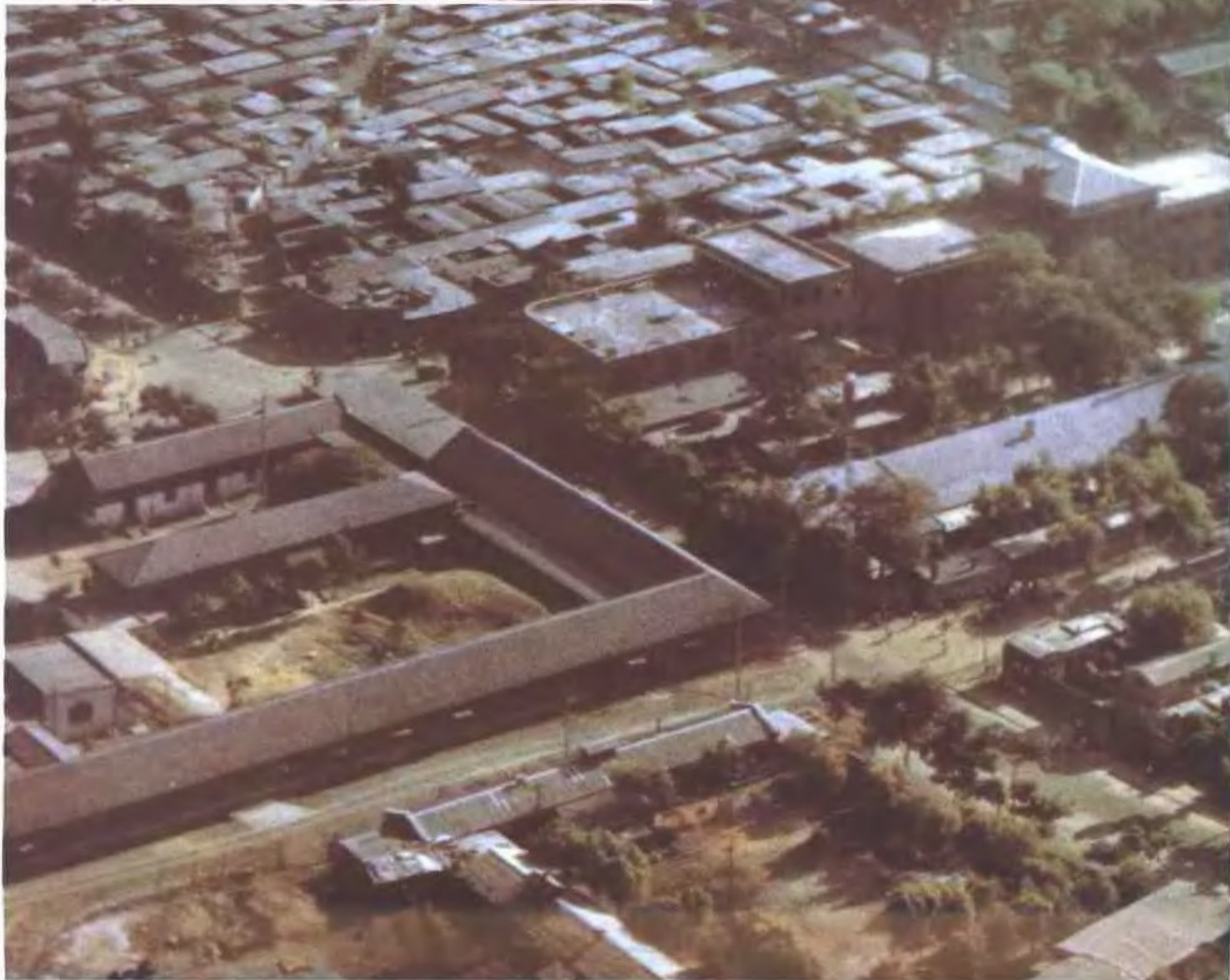
1976年“7·28”大地震前的唐山市区鸟瞰