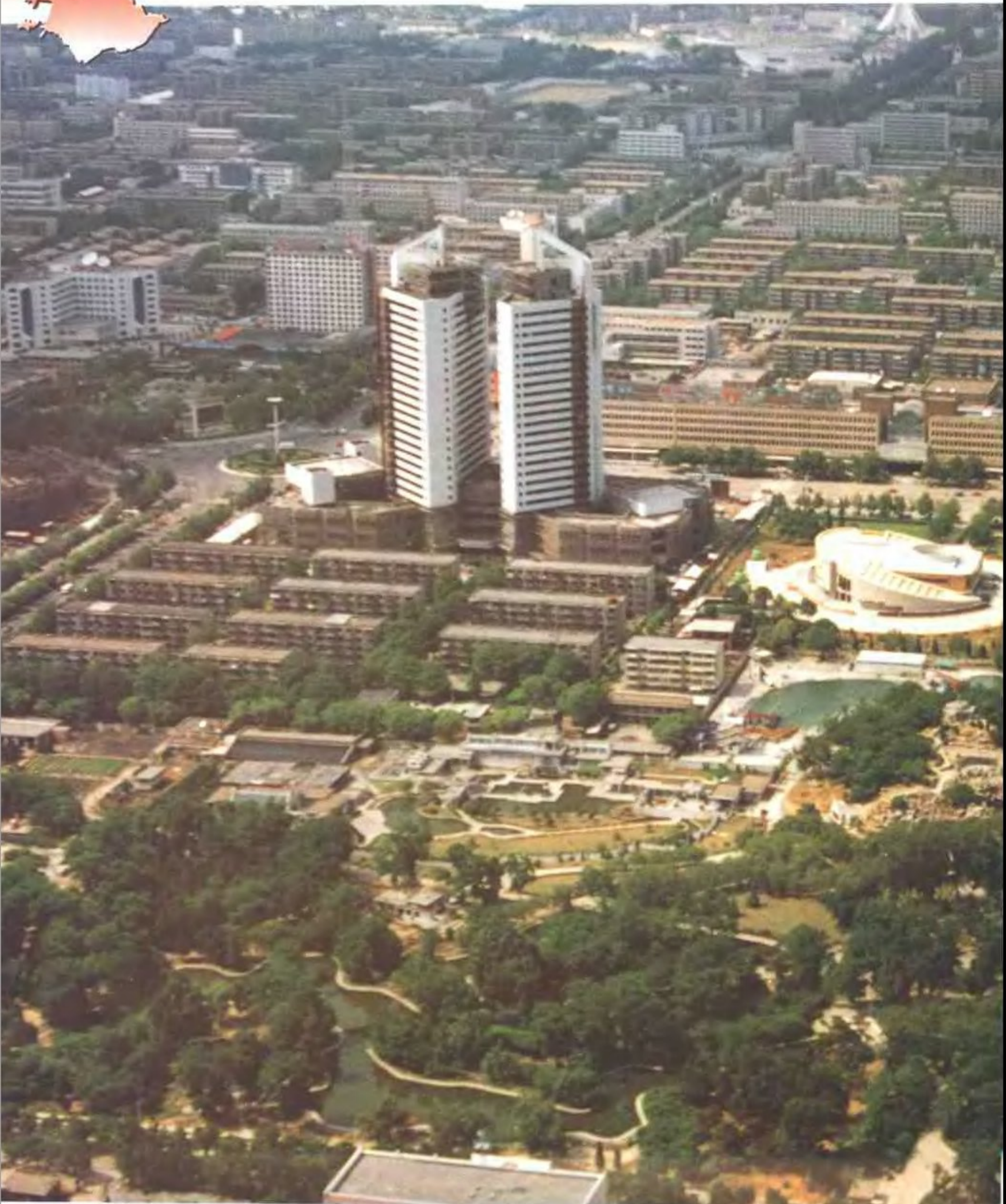
1976年“7·28”大地震后重建的唐山市区鸟瞰