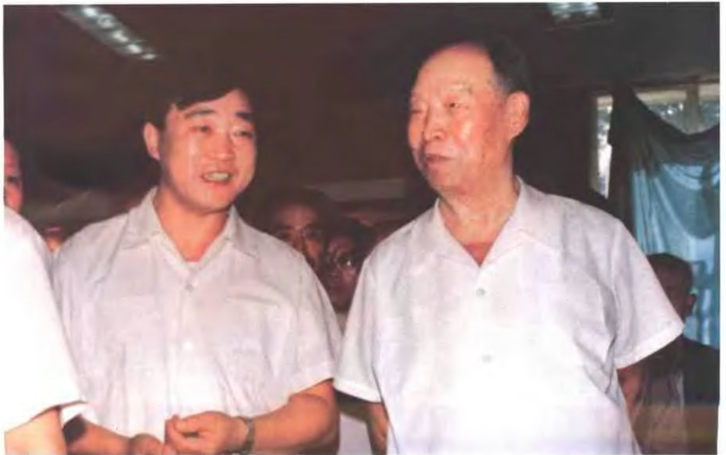
1986年8月21日,彭真委员长视察唐山陶瓷集团有限公司。