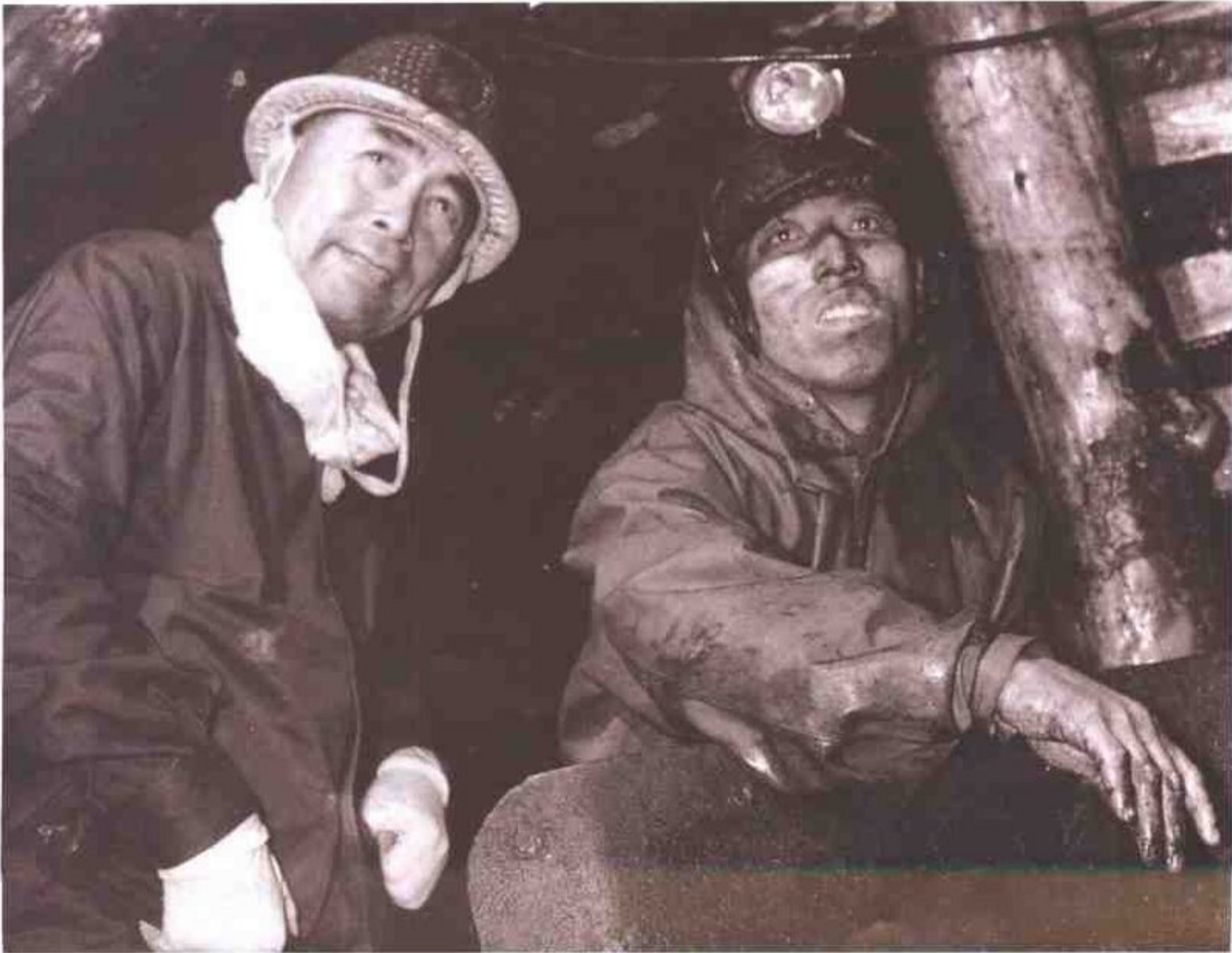
周恩来总理在开滦井下视察