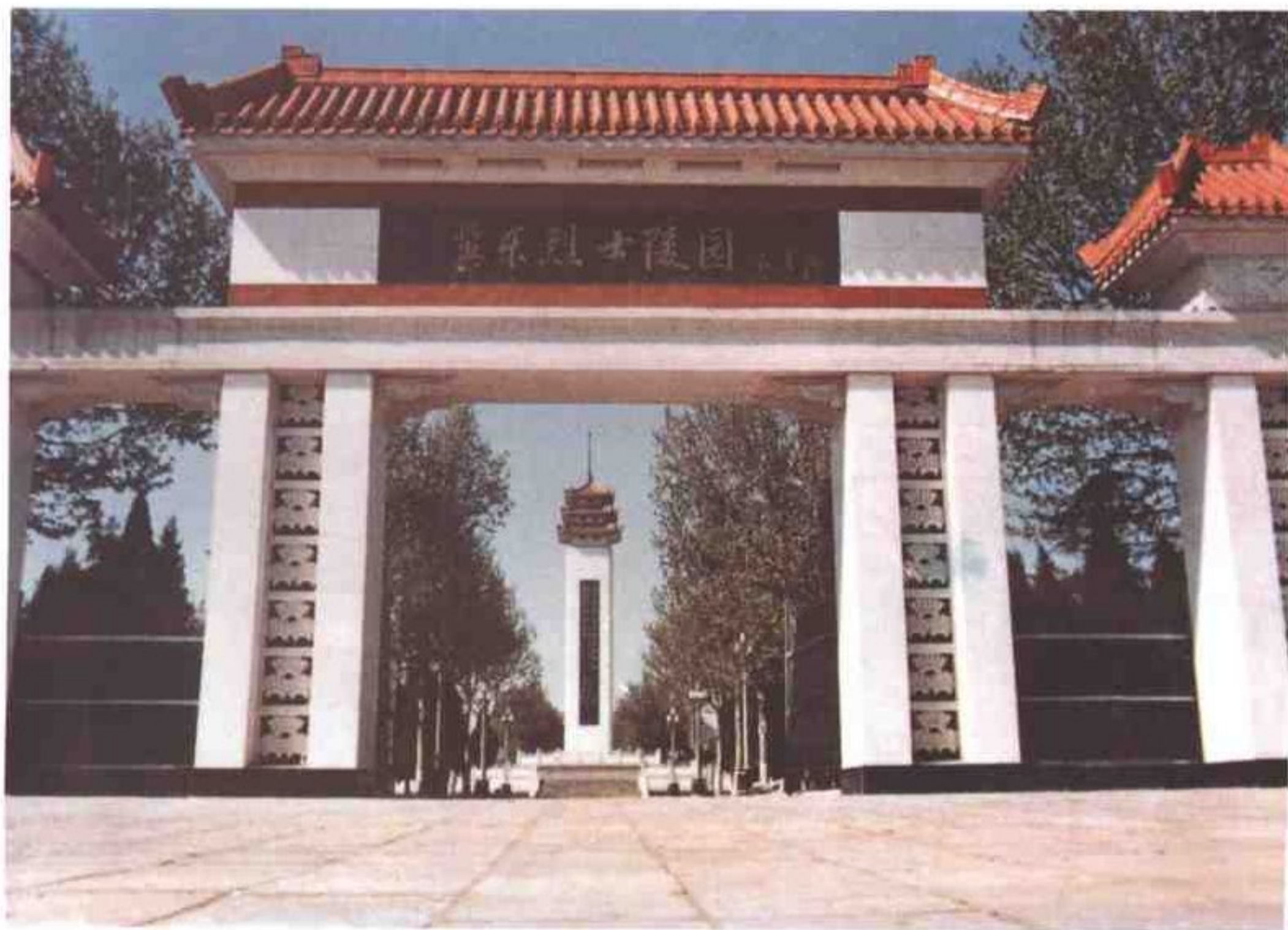
庄严肃穆的冀东烈士陵园