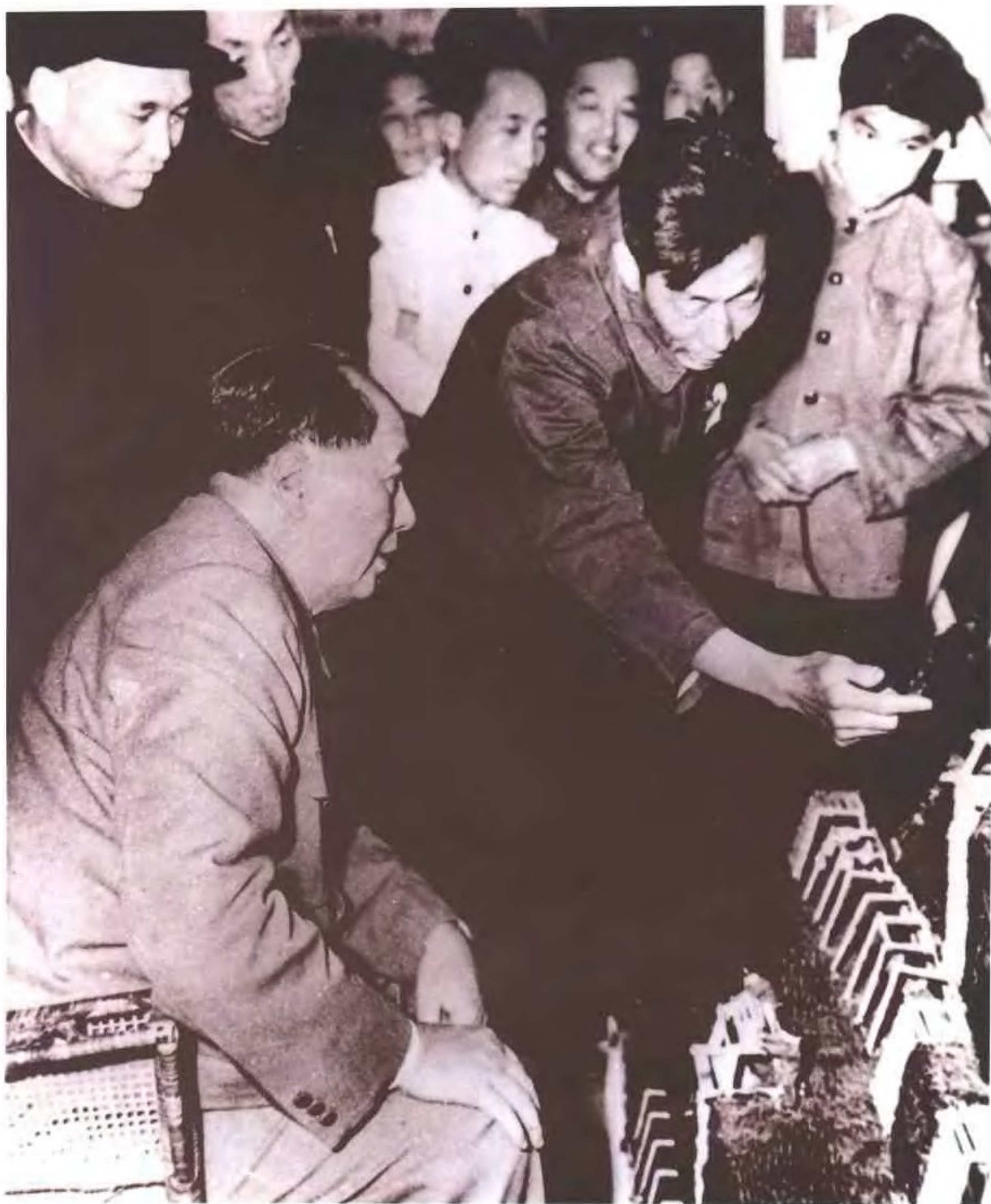
1958年,毛泽东主席观看开滦水力采煤模型。