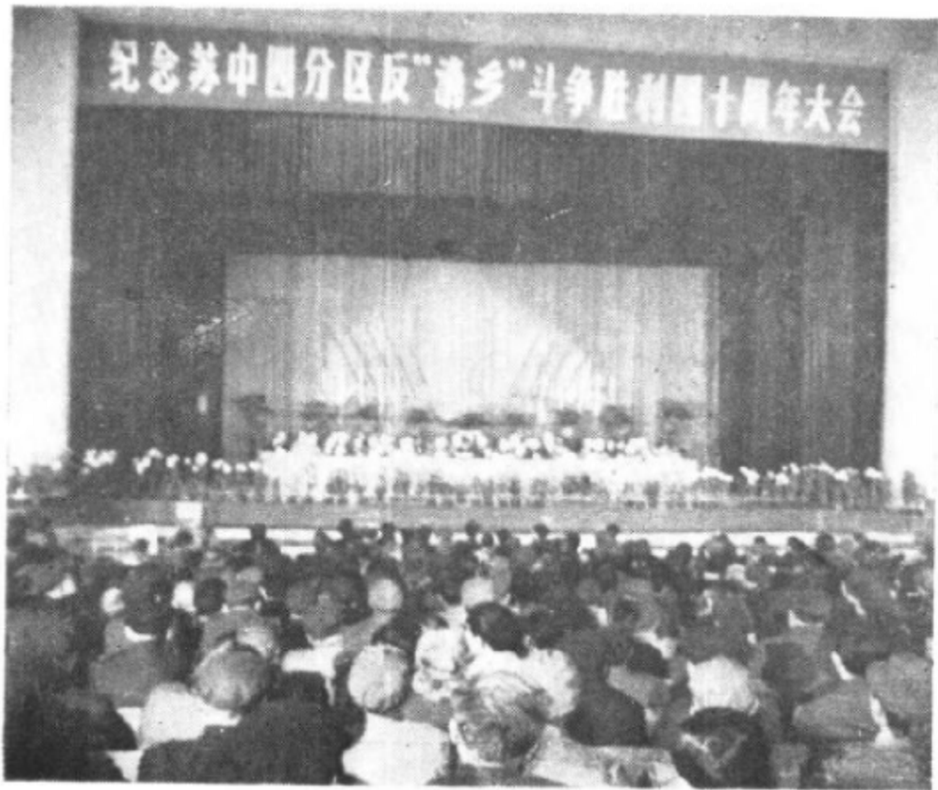
南通市纪念苏中四分区反“清乡”斗争胜利 四十周年大会会场